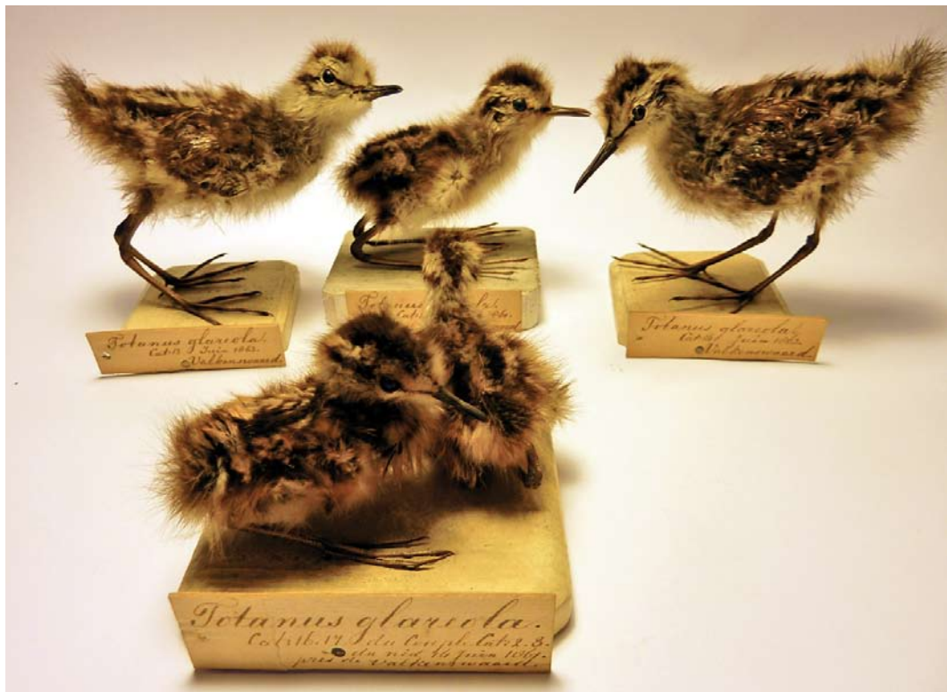
15 Wood Sandpipers / Bosruiters Tringa glareola , five hatchlings (collected at Valkenswaard, Noord-Brabant, on 31 May 1861, 14 June 1861 (two) and June 1863 (two)), Naturalis Biodiversity Center, Leiden, Netherlands, 11 February 2013. Collected by local people employed by A Bots and P Jaspers, who sold these birds to Hermann Schlegel in Leiden, on the latter's request. The same men also sold eggs to various English collectors in subsequent periods.

from five nests are preserved in various museums, with an additional clutch, comprising an unknown number of eggs, mentioned in the Merckelbach notebook (see below). Comprehensive data are known from 17 clutches. The earliest date in the year on which a clutch was collected was 11 May, while the latest was in July. Clutches were found in the first half of May (five), the second half of May (eight), the first half of June (three) and the second half of June (one). Young were collected as early as 31 May (indicating that egg laying occurred around 6 May, based on an incubation period of 22-23 days; Cramp & Simmons 1983). This accords with the clutch of four eggs found on 11 May (laying interval 1-2 days; Cramp & Simmons 1983).