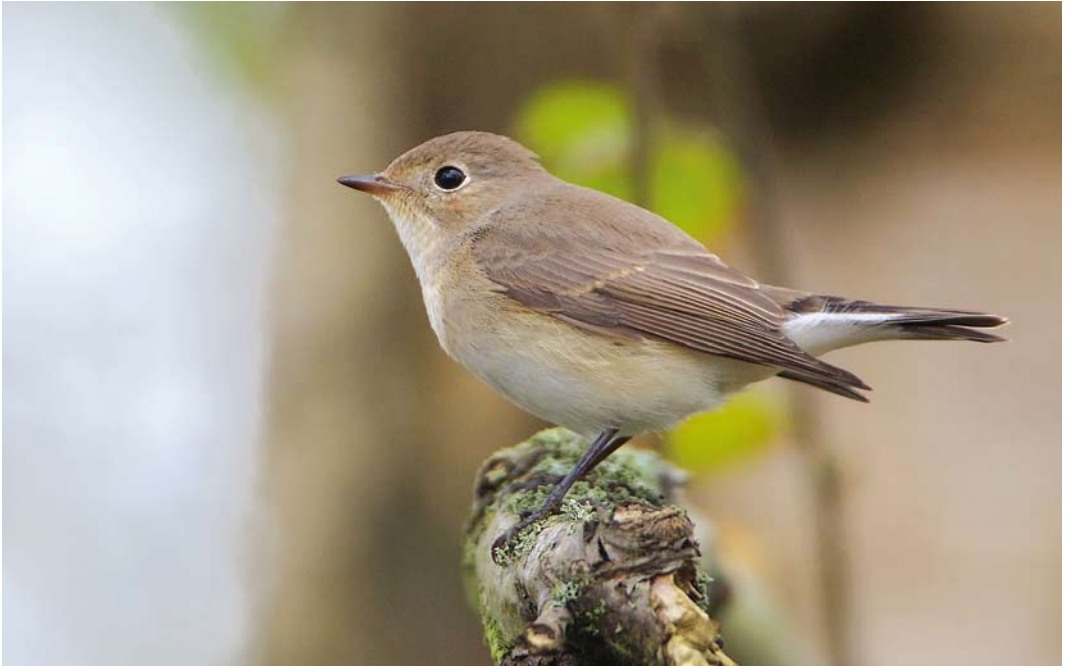
579 Kleine Vliegenvanger / Red-breasted Flycatcher Ficedula parva , eerstejaars, Maasvlakte, Zuid-Holland, 26 oktober 2014 (Martin van der Schalk)