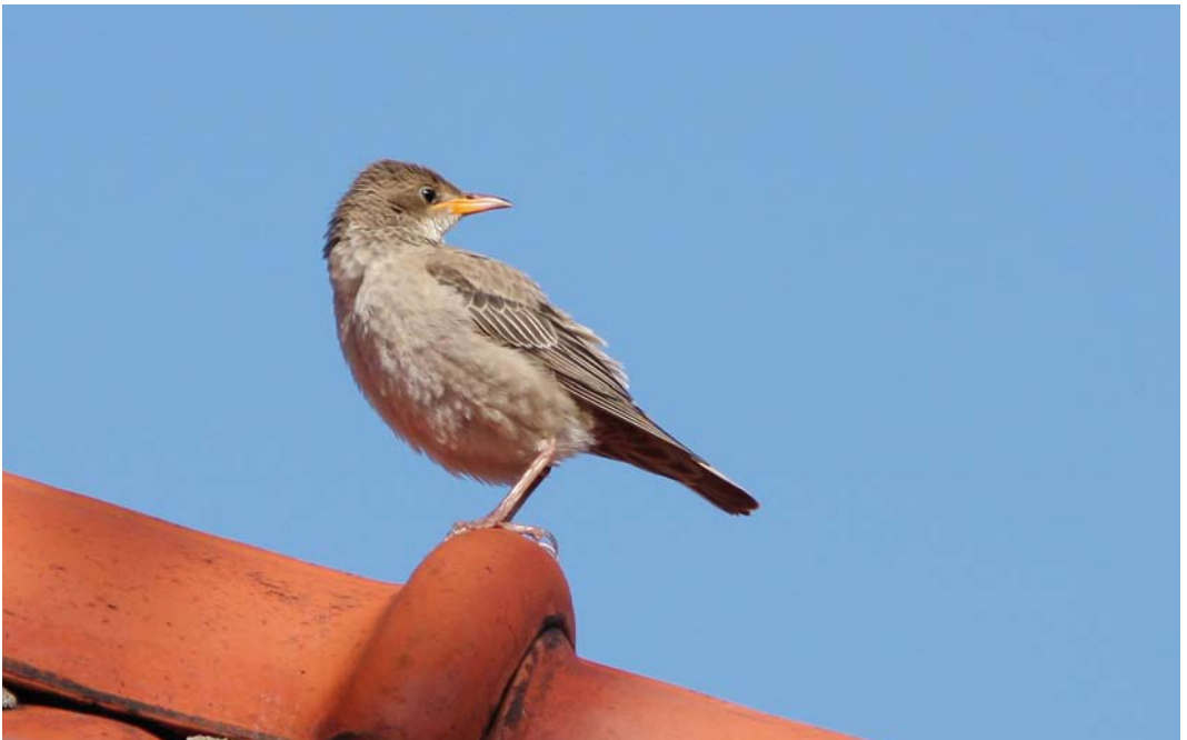
580 Roze Spreeuw / Rosy Starling Pastor roseus , juveniel, Den Helder, Noord-Holland, 16 oktober 2014 (Rob Half) )