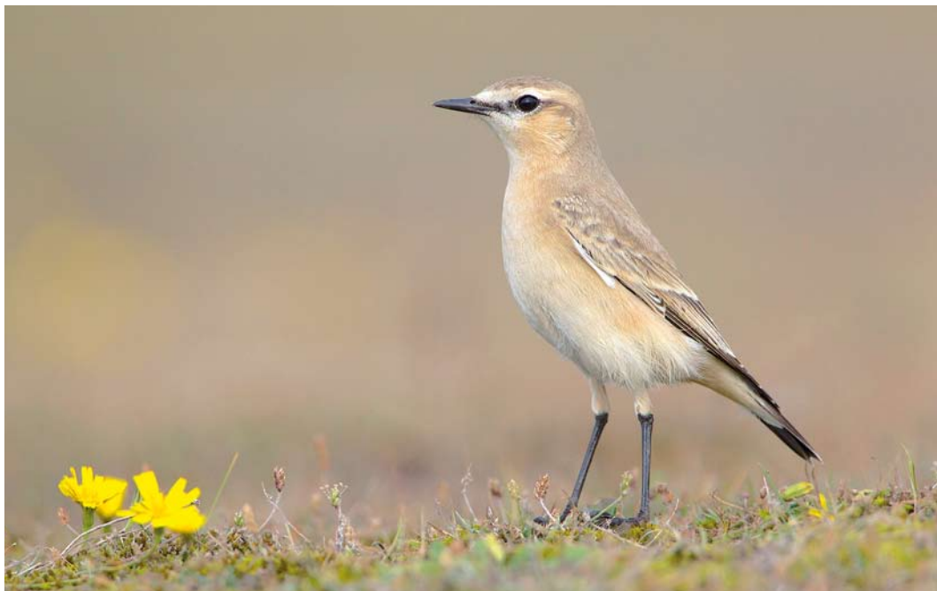
573 Izabeltapuit / Isabelline Wheatear Oenanthe isabellina , eerstejaars, Maasvlakte, Zuid-Holland, 5 oktober 2014 (Martin van der Schalk)