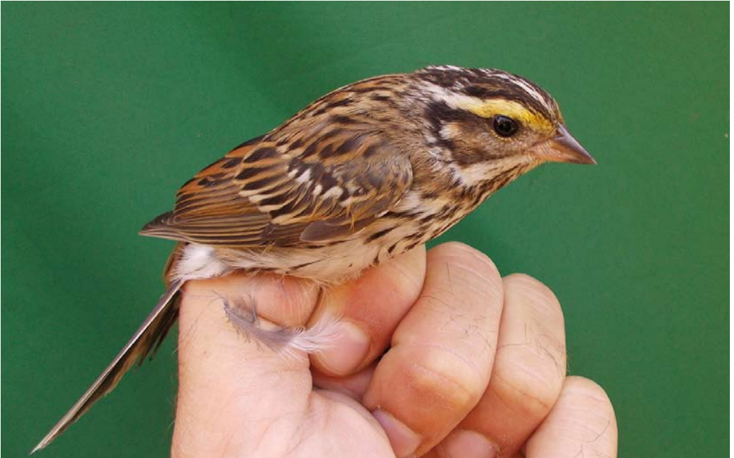
555 Yellow-browed Bunting / Geelbrauwgors Emberiza chrysophrys , first-year, Dąbkowice, Sławno, Pomerania, Poland, 5 October 2014 (Michał Polakowski)