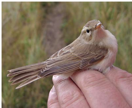
513 Booted Warbler / Kleine Spotvogel Iduna caligata , Castricum, Noord-Holland, 9 September 2013 (André J van Loon)

24 August, IJmuiden, Velsen , Noord-Holland, photographed (R Alberts); 28 August, IJmuiden, Velsen , Noord-