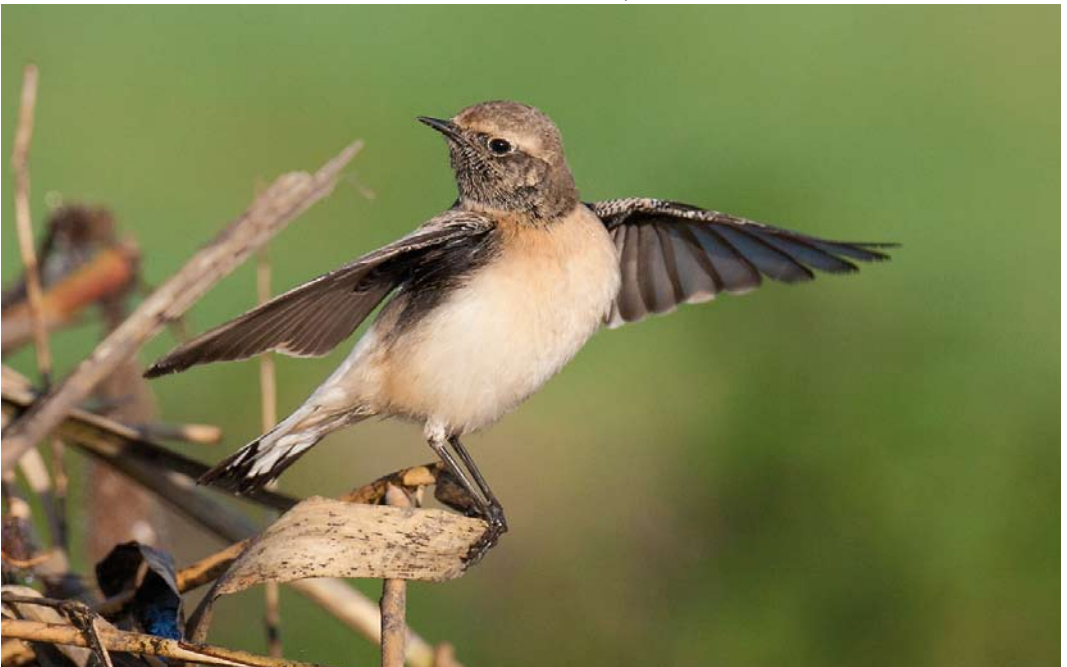
560 Pied Wheatear / Bonte Tapuit Oenanthe pleschanka , first-year male, Zoeterwoude, Zuid-Holland, Netherlands, 13 November 2014