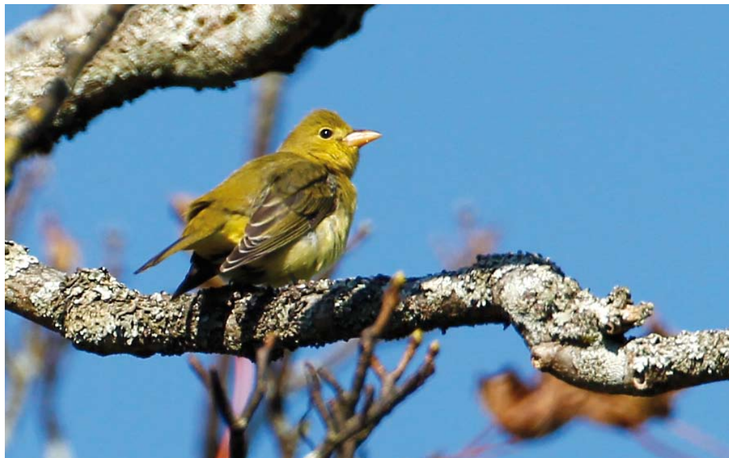
547 Scarlet Tanager / Zwartvleugeltangare Piranga olivacea , first-year male, Barra, Outer Hebrides, Scotland, 8 October 2014