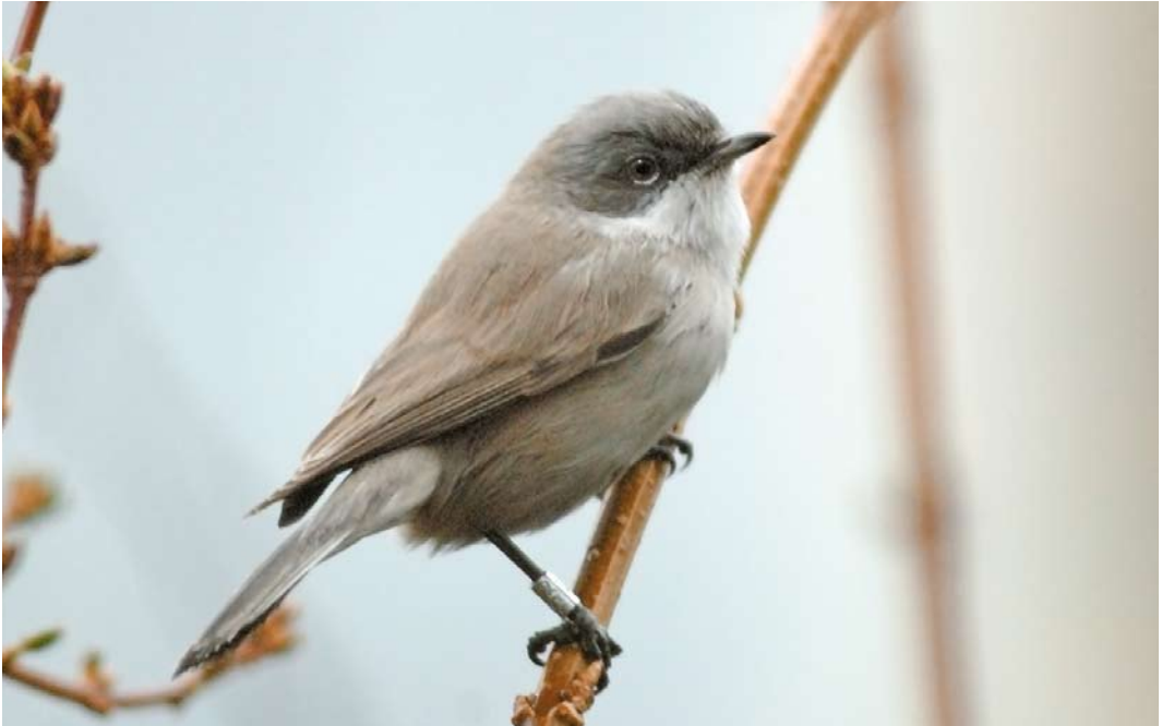
510 Desert Lesser Whitethroat / Vale Braamsluiper Sylvia althaea halimodendri , Vinkhuizen, Groningen, Groningen, 1 February 2007 (Arnaud B van den Berg)

been adopted by the CDNA, and are not all repeated here. In four unspecified 'subalpine warblers', vocalizations ruled out Moltoni's Warbler S subalpina (cf Wassink & CDNA 2014). The only record of Moltoni's (at Bloemendaal, Noord-Holland, on 23-26 May 1987) is under review (cf Wassink & CDNA 2014). Totals exclude birds accepted to species level.