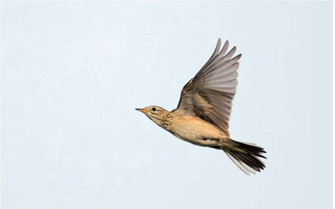
559 Blyth's Pipit / Mongoolse Pieper Anthus godlewskii , first-year, Kieldrecht, Oost-Vlaanderen, Belgium, 25 October 2014