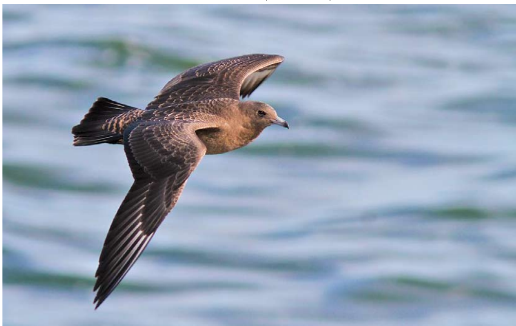
565 Middelste Jager / Pomarine Skua Stercorarius pomarinus , juveniel, Lancasterdijk, Texel, Noord-Holland, 12 oktober 2014 (Marten Miske)