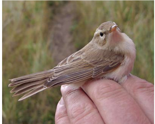
513 Booted Warbler / Kleine Spotvogel Iduna caligata , Castricum, Noord-Holland, 9 September 2013 (André J van Loon)

24 August, IJmuiden, Velsen , Noord-Holland, photographed (R Alberts); 28 August, IJmuiden, Velsen , Noord-