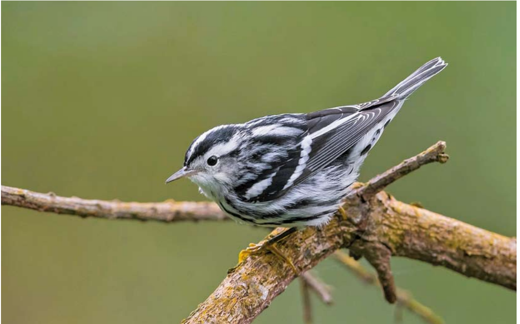
553 Black-and-white Warbler / Bonte Zanger Mniotilta varia , first-year, Ribeira da Ponte, Corvo, Azores, 15 October 2014