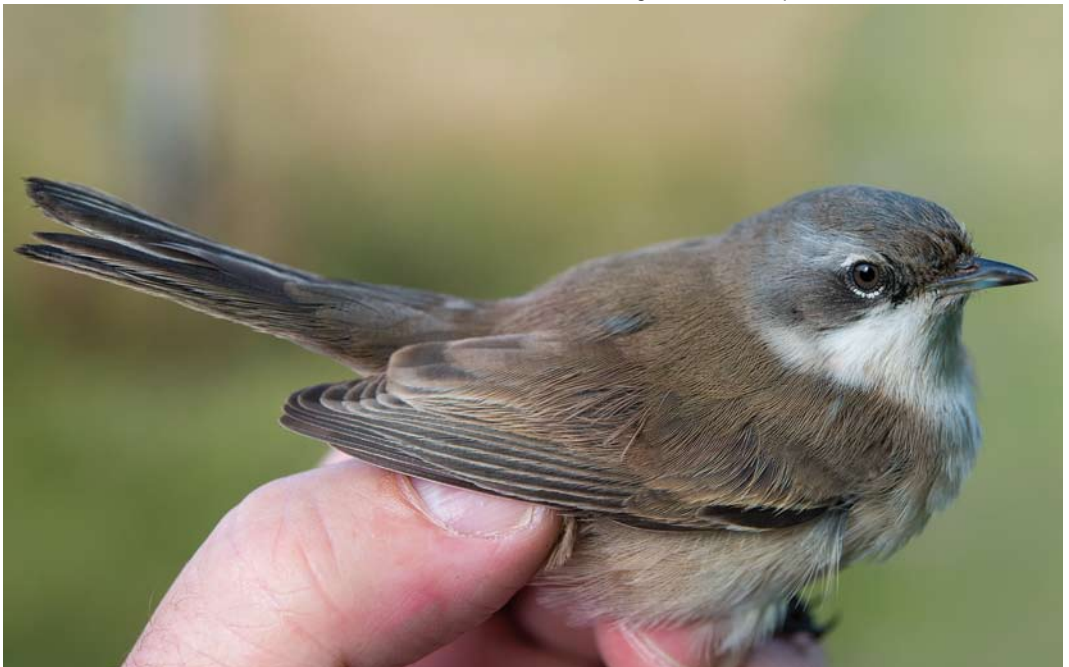
512 Siberian Lesser Whitethroat / Siberische Braamsluiper Sylvia althaea blythi , Bloemendaal, Noord-Holland, 18 October 2013