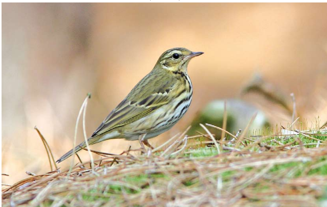
576 Siberische Boompieper / Olive-backed Pipit Anthus hodgsoni , Vlieland, Friesland, 4 oktober 2014