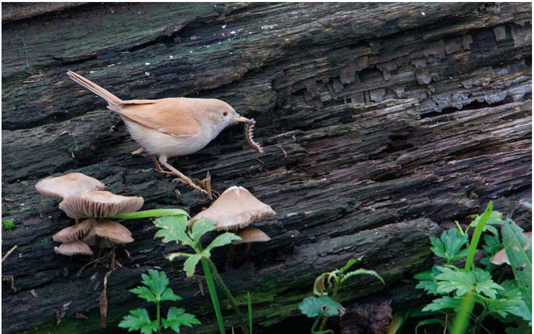
588 Afrikaanse Woestijngrasmus / African Desert Warbler Sylvia deserti , Alphen aan den Rijn, Zuid-Holland, 26 november 2014

AFRICAN DESERT WARBLER From 12 to at least 30 November 2014, an African Desert Warbler Sylvia deserti stayed along ditches in an extensive farmland area near Alphen aan den Rijn, Zuid-Holland. The news was withheld at first and released on 25 November. The next day, the bird was relocated and seen by 100s of birders. Although Asian Desert Warbler S nana would be a more likely candidate, based on the pattern of late autumn records in north-western Europe, the bird clearly showed characters of African Desert, such as the almost plain tertials, golden-brown plumage, clear white underparts and pale whitish face. If accepted, this is the first record for the Netherlands and north-western Europe. Outside the breeding and wintering areas in north-western Africa, vagrant records are known from the Canary Islands, Cape Verde Islands, Italy (three on small islands near Sicily and two mainland records, near Rome and in Lombardia), Madeira, Malta and mainland Spain.