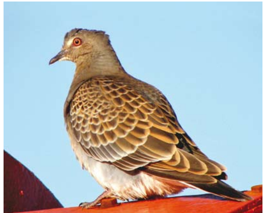
492 Baikal Teal / Siberische Taling Anas formosa , male, Meinerswijk, Gelderland, 25 December 2013 (Alex Bos) 493 Pallid Swift / Vale Gierzwaluw Apus pallidus , Neeltje Jans, Zeeland, 2 November 2013 (Alex Bos) 494-495 Rufous Turtle Dove / Meenartortel Streptopelia orientalis meena , first-year, at sea, 53°25'N 03°39'E, Continentaal Plat (north-west off Texel, Noord-Holland), 16 November 2010 (R Neumann)

2010 16 November, at sea, 53°25'N 03°39'E, Continentaal Plat (north-west off Texel, Noord-Holland), first-year, photographed (via R Neumann).