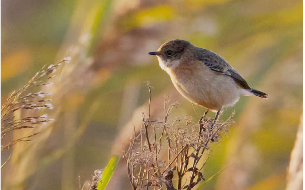
577 Vermoedelijke Stejnegers Roodborsttapuit / presumed Stejneger's Stonechat Saxicola stejnegeri , eerstejaars mannetje, Jaap Deensgat, Lauwersmeer, Groningen, 28 oktober 2014