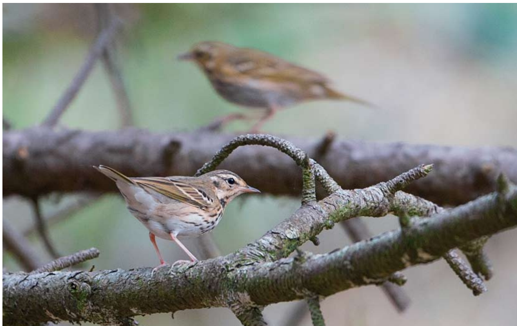
575 Siberische Boompiepers / Olive-backed Pipits Anthus hodgsoni , Vlieland, Friesland, 4 oktober 2014 (Martijn Verdoes)