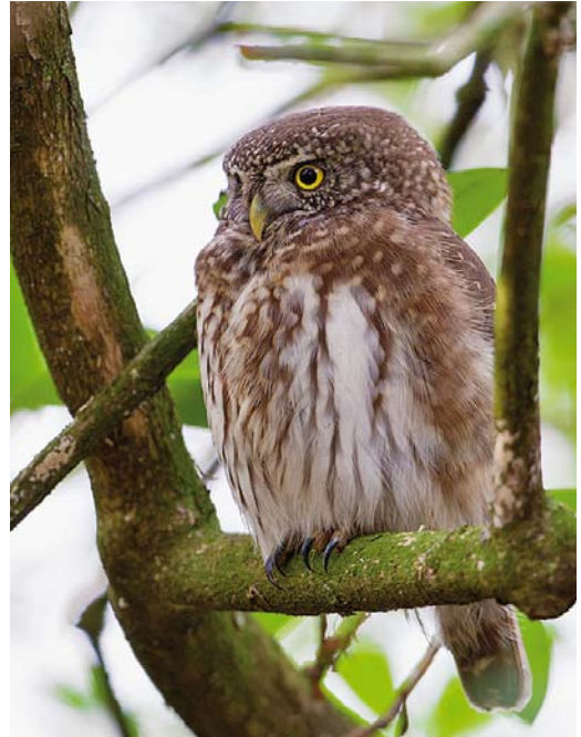
502 Northern Hawk-Owl / Sperweruil Surnia ulula , first-winter, Zwolle, Overijssel, 6 January 2014 (Jaap Denee) 503 Eurasian Pygmy Owl / Dwerguil Glaucidium passerinum , Oostermaet, Lettele, Overijssel, 4 January 2014 (Jaap Denee) 504 Boreal Owl / Ruigpootuil Aegolius funereus , Eemshaven, Groningen, 17 October 2013 (Marcel Sandifort)