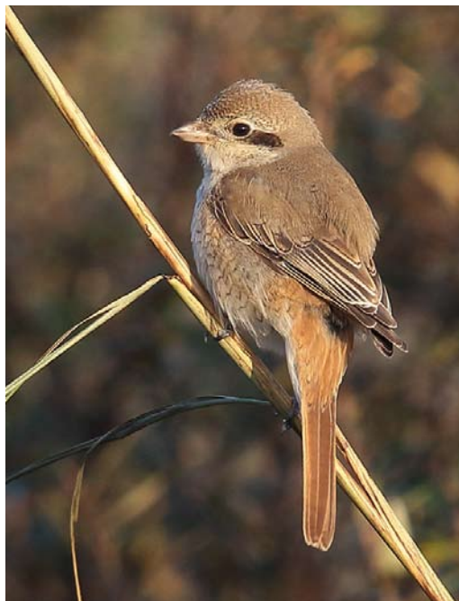
562 Presumed Red-tailed Shrike / vermoedelijke Turkestaanse Klauwier Lanius phoenicuroides , first-year Castricum, Noord-Holland, Netherlands, 21 November 2014 ( Eric Menkveld )

for the Azores. A late Thrush Nightingale Luscinia luscinia was photographed at Warszawa, Poland, on 18 November. A male Siberian Rubythroat Calliope calliope stayed at Levenwick, Mainland, Shetland, on 3-8 October. A Red-flanked Bluetail Tarsiger cyanurus at Blacksod, Mayo, was (only) the fourth for Ireland. Presumed Stejneger's Stonechats Saxicola stejnegeri were found, eg, at Lauwersmeer, Groningen, the Netherlands, on 28 October and on Fair Isle from 31 October to 2 November. Pied Wheatears Oenanthe pleschanka occurred, for instance, at Furilden, Gotland, Sweden, on 27 October; Mortsel, Antwerpen, Belgium, from 8 November; Zoeterwoude, Zuid-Holland, the Netherlands, on 10-13 November; and Madland, Rogaland, Norway, from 11 November. If accepted, an adult White-crowned Wheatear O leucopyga at Poelgeest, Oegstgeest, Zuid-Holland, from at least 23 September through November will be the first for the Netherlands; its tattered appearance provoked lengthy and sometimes entertaining discussions about its provenance (there have been records in c 13 other European countries, north to Denmark and England). Another individual, apparently wearing a red ring, was photographed on Ameland, Friesland, the Netherlands, on 2 November, adding more spice to the discussion.