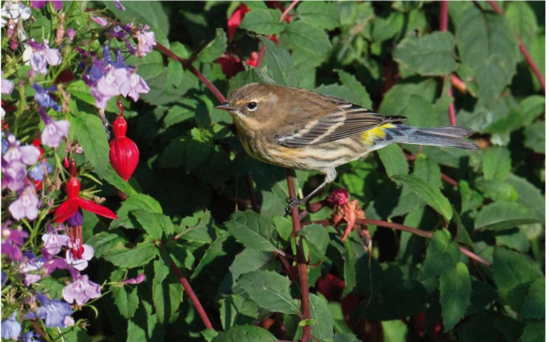
549 Myrtle Warbler / Mirtezanger Setophaga coronata , Grutness, Mainland, Shetland, Scotland, 30 September 2014