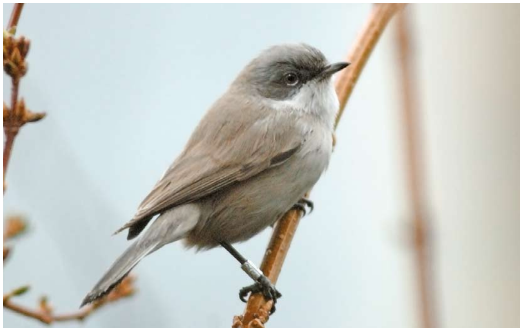
510 Desert Lesser Whitethroat / Vale Braamsluiper Sylvia althaea halimodendri , Vinkhuizen, Groningen, Groningen, 1 February 2007

been adopted by the CDNA, and are not all repeated here. In four unspecified 'subalpine warblers', vocalizations ruled out Moltoni's Warbler S subalpina (cf Wassink & CDNA 2014). The only record of Moltoni's (at Bloemendaal, Noord-Holland, on 23-26 May 1987) is under review (cf Wassink & CDNA 2014). Totals exclude birds accepted to species level.