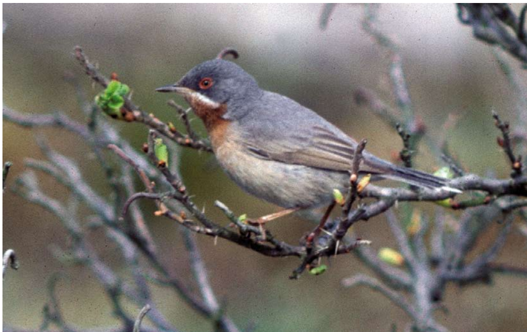
523 Balkanbaardgrasmus / Eastern Subalpine Warbler Sylvia cantillans , tweede-kalenderjaar mannetje, Groet, Noord-Holland, 7 mei 1986