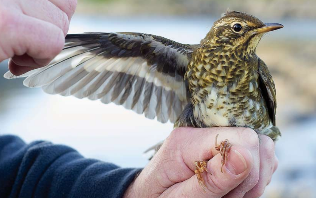
541 Siberian Thrush / Siberische Lijster Geokichla sibirica , first-year female, Træna, Nordland, Norway, 24 September 2014 (Terje Kolaas)