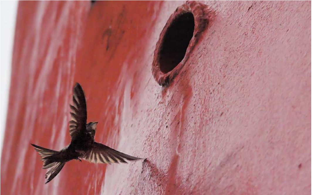
532 Pallid Swift / Vale Gierzwaluw Apus pallidus , De Cocksdorp, Texel, Noord-Holland, Netherlands, 15 November 2014 ( Gerben Mensink ). Near roosting hole at lighthouse.