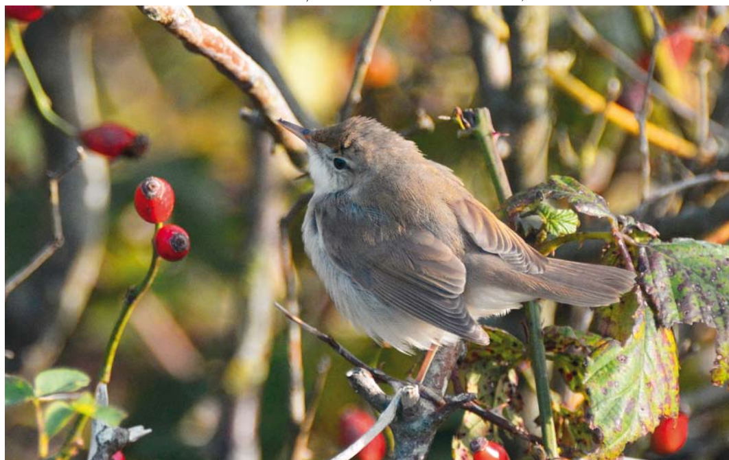
515 Blyth's Reed Warbler / Struikrietzanger Acrocephalus dumetorum , first-winter, Polder Wassenaar, Texel, Noord-Holland, 15 October 2013 (Martin Becker)