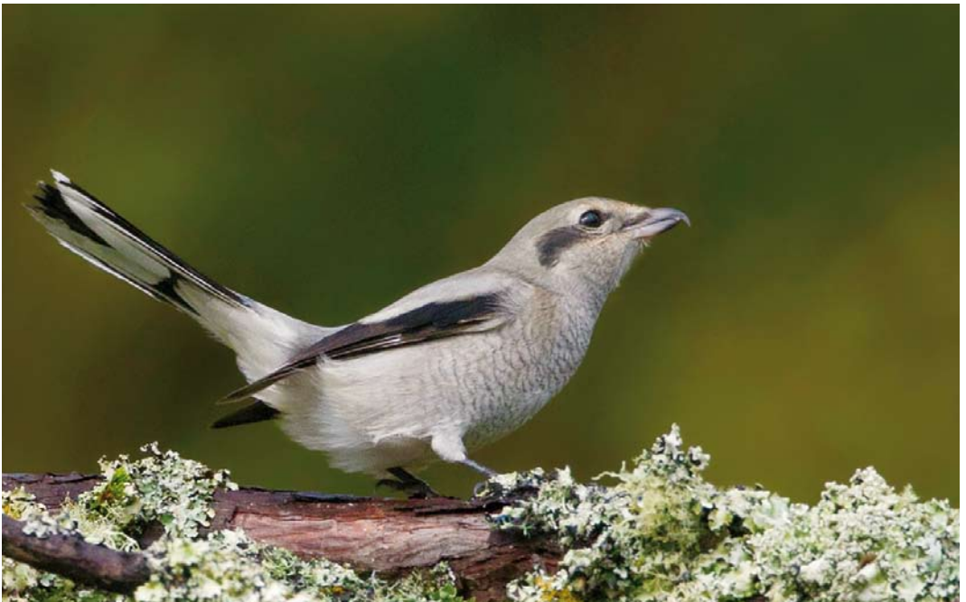
558 American Northern Shrike / Amerikaanse Noordelijke Klapekster Lanius borealis borealis , first-year, Caldeira, Corvo, Azores, 18 October 2014 ( David Monticelli )