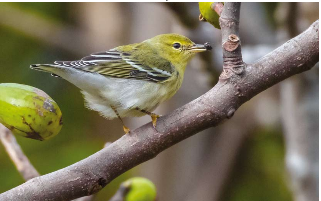
552 Blackpoll Warbler / Zwartkopzanger Setophaga striata , Vila do Corvo, Corvo, Azores, 20 October 2014