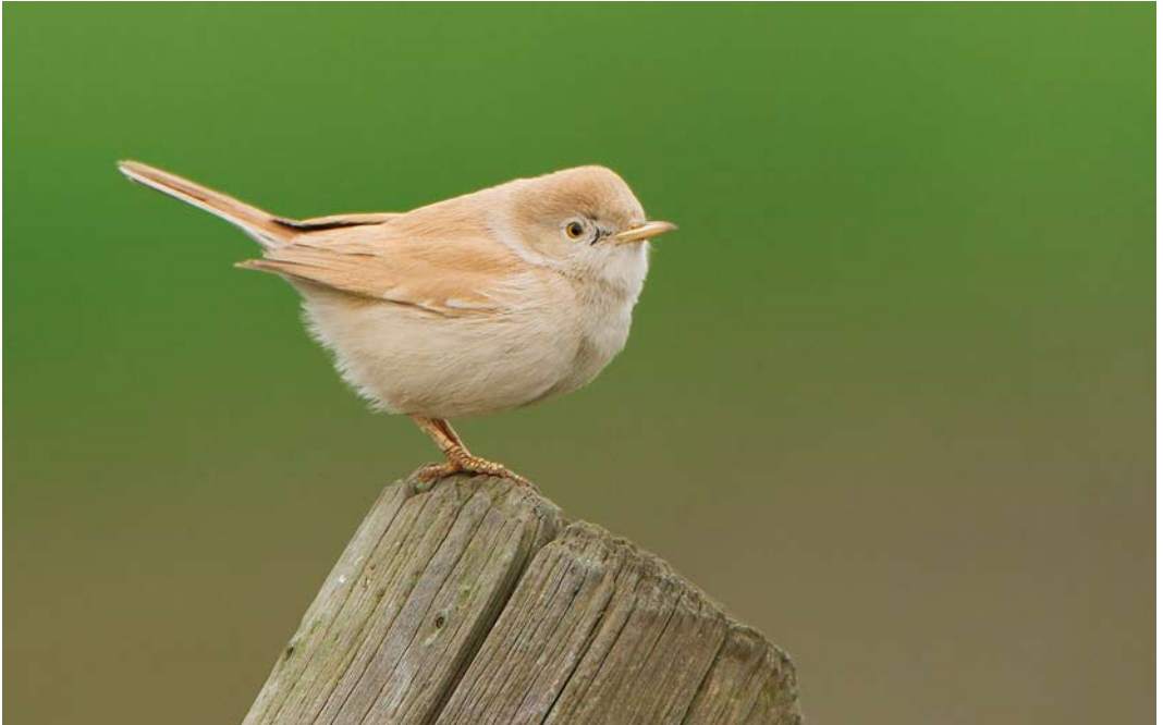
586 Afrikaanse Woestijngrasmus / African Desert Warbler Sylvia deserti , Alphen aan den Rijn, Zuid-Holland, 26 november 2014 (Michel Veldt)