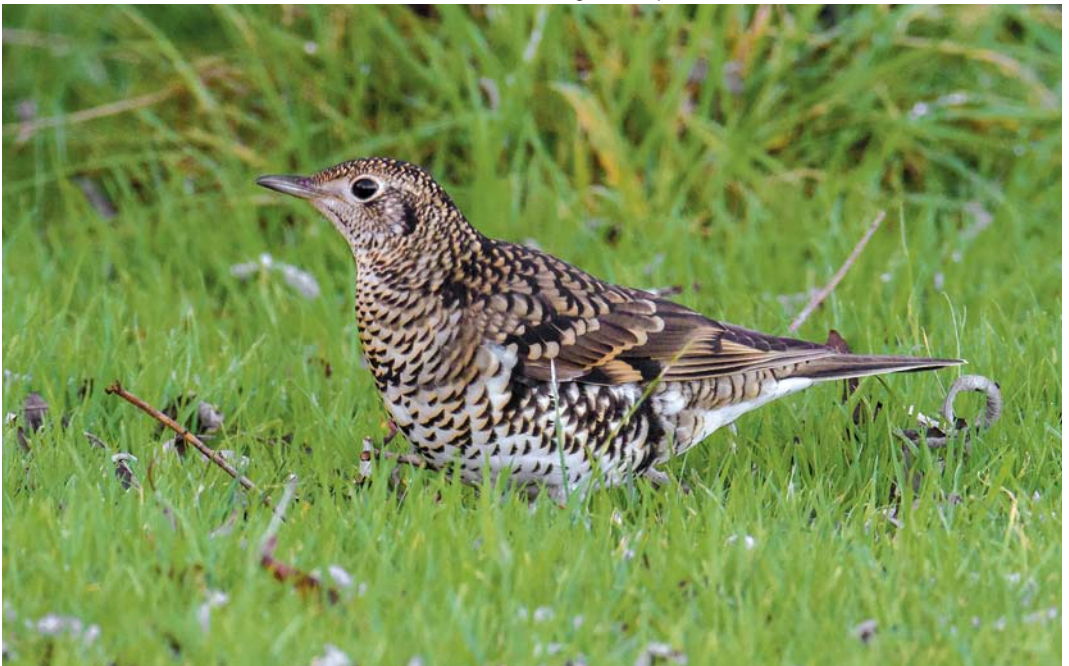
550 White's Thrush / Goudlijster Zoothera aurea , first-year, Durigarth, Mainland, Shetland, Scotland, 1 October 2014