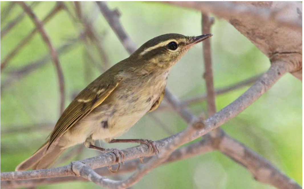
546 Presumed Large-billed Leaf Warbler / vermoedelijke Diksnavelfitis Phylloscopus magnirostris , Al Mamzar Park, Dubai, United Arab Emirates, 11 October 2014