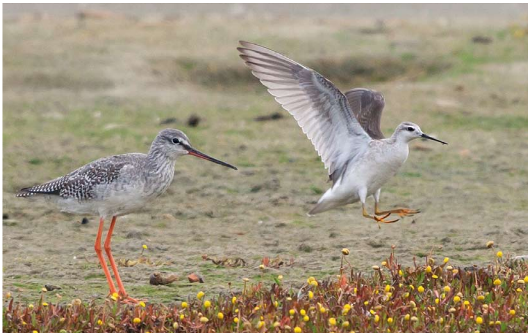
568 Grote Franjepoot / Wilson's Phalarope Phalaropus tricolor , eerstejaars, met Zwarte Ruiters / Spotted Redshank Tringa erythropus , Balgzandpolder, Den Helder, Noord-Holland, 28 september 2014