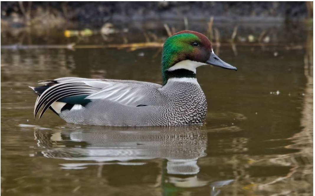
491 Falcated Duck / Bronskopeend Anas falcata , male, Spijkenisse, Zuid-Holland, 31 March 2013