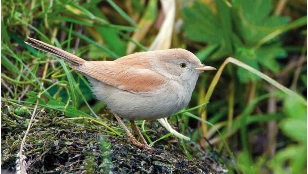
563 African Desert Warbler / Afrikaanse Woestijngrasmus Sylvia deserti , Alphen aan den Rijn, Zuid-Holland, Netherlands, 26 November 2014

more than a handful American Buff-bellied Pipits A rubescens rubescens were seen (five on 4 October and six on 11 October). In Norway, an influx of Pine Grosbeaks Pinicola enucleator started in the first week of November, with up to 1000 at Jæren, Rogaland, and 200 in Vest-Agder in the south-west on 6 November. In Israel, Red Crossbills Loxia curvirostra migrating over Hefer valley (two) and Ramat Hovav, northern Negev (six), on 11 November were the country's first since 1988.