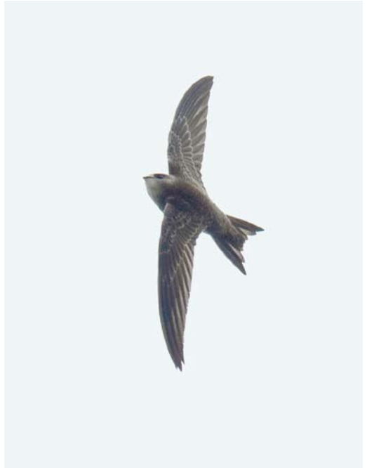
534 Pallid Swift / Vale Gierzwaluw Apus pallidus , juvenile, Heerhugowaard, Noord-Holland, Netherlands, 9 November 2014 ( Maurits Martens ) 535 Pallid Swift / Vale Gierzwaluw Apus pallidus , juvenile, Friebertshausen, Hessen, Germany, 23 November 2014 ( Viola Wege ) 536 Pied-billed Grebe / Dikbekfuut Podilymbus podiceps , with Red Swamp Crayfish / Rode Amerikaanse Rivierkreeft Procambarus clarkii , Lagoa Azul, São Miguel, Azores, 28 October 2014 ( David Monticelli )