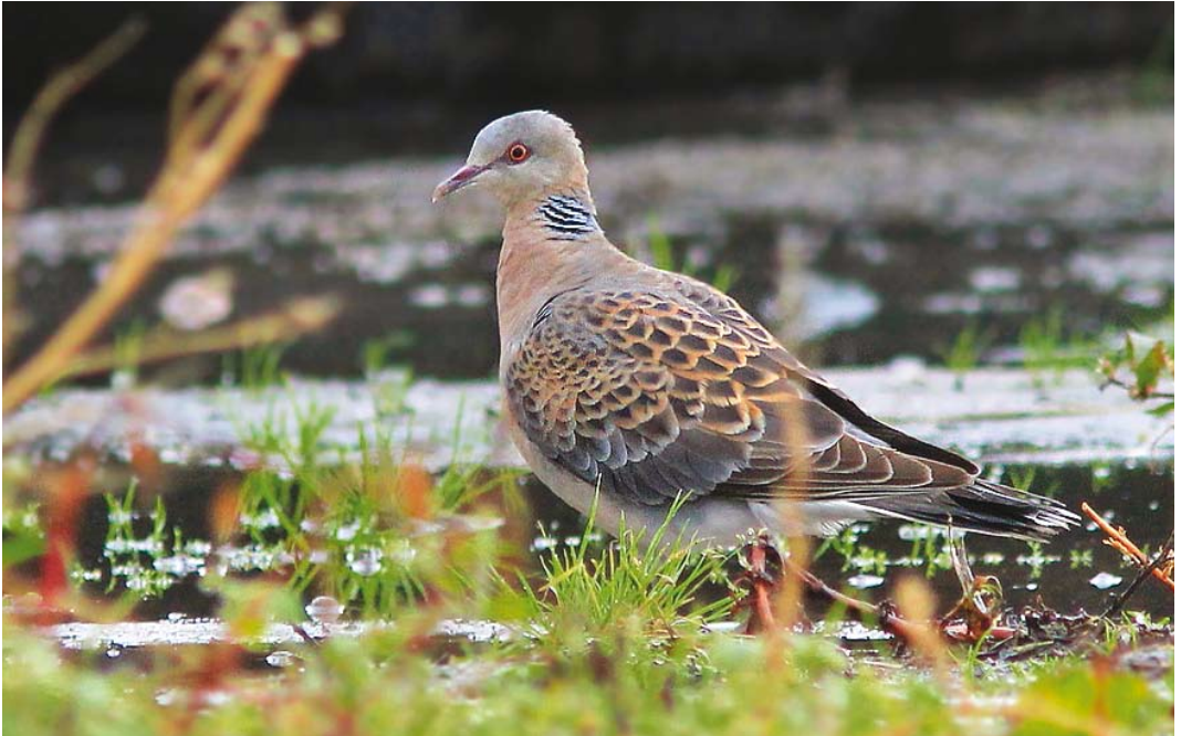
496 Rufous Turtle Dove / Meenatortel Streptopelia orientalis meena , first-year, Schiermonnikoog, Friesland, 12 October 2013 (Thijs Glastra)