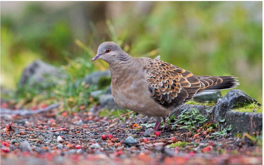
533 Rufous Turtle Dove / Meenatorstel Streptopelia orientalis meena , adult, Vestvågøy, Lofoten, Norway, 30 October 2014