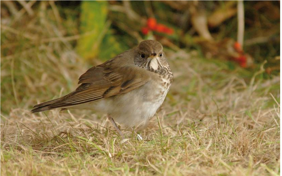
543 Grey-cheeked Thrush / Grijswangdwerglijster Catharus minimus , first-year, Île de Sein, Finistère, France, 22 October 2014 (Maxime Zucca)