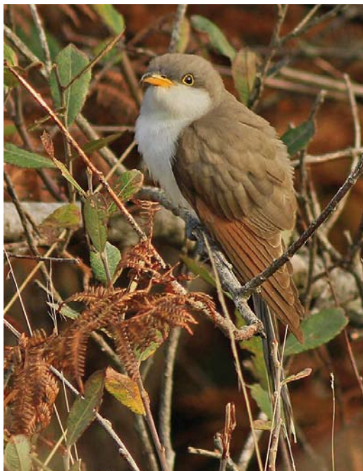
561 Yellow-billed Cuckoo / Geelsnavelkoekoek Coccyzus americanus , Porthgwarra, Cornwall, England, 24 October 2014