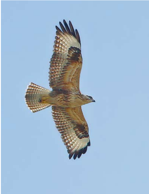
500 Long-legged Buzzard / Arendbuizerd Buteo rufinus , Maasvlakte, Zuid-Holland, 26 September 2013

summer, moulting into winter plumage, photographed, sound-recorded (P van Franeker et al; Dutch Birding 35: 354, plate 451, 2013); 3-20 November, Bantpolder, Dongeradeel , Friesland, adult winter (M Olthoff et al).