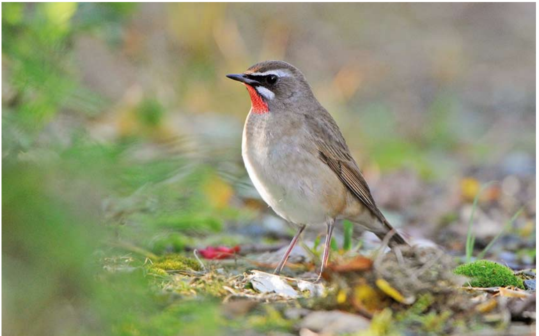
548 Siberian Rubythroat / Roodkeelnachtegaal Calliope calliope , male, Levenwick, Mainland, Shetland, Scotland, 8 October 2014