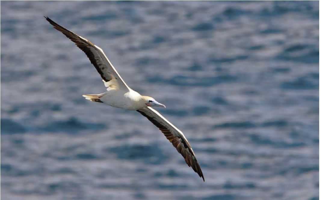
530 Red-footed Bobby / Roodpootgent Sula sula , subadult, at sea, 19°48'59"N, 23°10'48"W (c 200 nautical miles south of Canary Islands), 2 October 2014