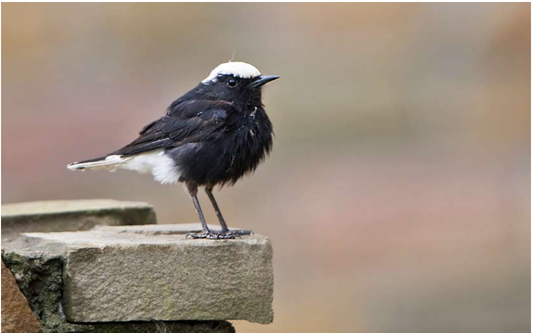
574 Witkruintapuit / White-crowned Wheatear Oenanthe leucopyga , adult, Oegstgeest, Zuid-Holland, 9 oktober 2014 (Hans Overduin)