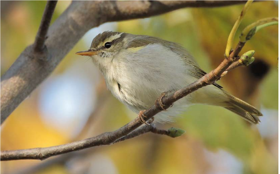
545 Eastern Crowned Warbler / Kroonboszanger Phylloscopus coronatus , Brotton, Cleveland, England, 1 November 2014