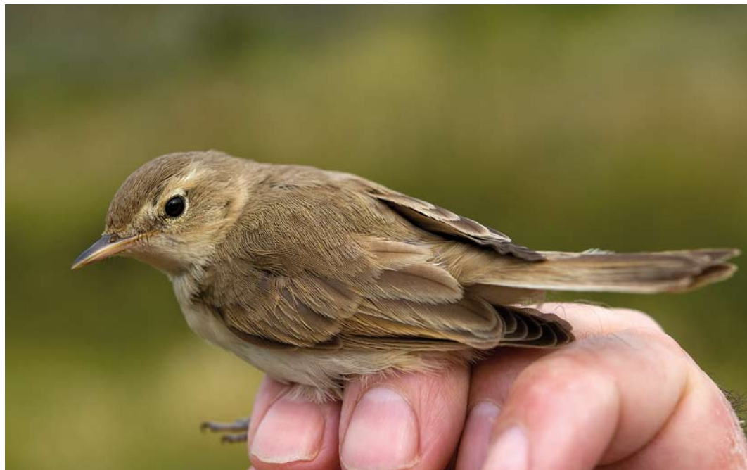
514 Booted Warbler / Kleine Spotvogel Iduna caligata , Bloemendaal, Noord-Holland, 28 August 2013