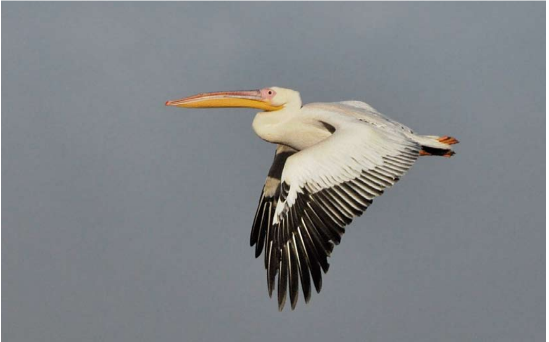
566 Roze Pelikaan / Great White Pelican Pelecanus onocrotalus , adult, Callantssoog, Noord-Holland, 17 oktober 2014