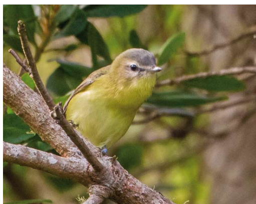
537 Great Knot / Grote Kanoet Calidris tenuirostris (right), with Red Knots / Kanoeten C canutus , Agadir, Oued Souss, Souss-Massa-Draâ, Morocco, 8 November 2014 (Arnaud B van den Berg) 538 Great Knot / Grote Kanoet Calidris tenuirostris (left), with Red Knots / Kanoeten C canutus , Agadir, Oued Souss, Souss-Massa-Draâ, Morocco, 8 November 2014 (Arnaud B van den Berg) 539 White-headed Duck / Witkoppeend Oxyura leucocephala , Dzierżno Duże reservoir, Upper Silesia, Poland, 5 November 2014 (Zbigniew Kajzer) 540 Philadelphia Vireo / Philadelphiavireo Vireo philadelphicus , Corvo, Azores, 11 October 2014 (Vincent Legrand)

November. A second-winter Audouin's Gull Larus audouinii photographed at Dungeness, Kent, on 12 October was the third for Dungeness and the seventh for Britain. On 16 October, another second-winter was present at a research platform in the North Sea north of Borkum, Schleswig-Holstein, Germany. In Cornwall, England, a Bridled Tern Onychoprion anaethetus flew past Pendeen on 21 October and a Forster's Tern Sterna forsteri flew past Cape Cornwall on 22 October. In Ireland, the adult Forster's returned first to Dublin in October and then to Galway in November.