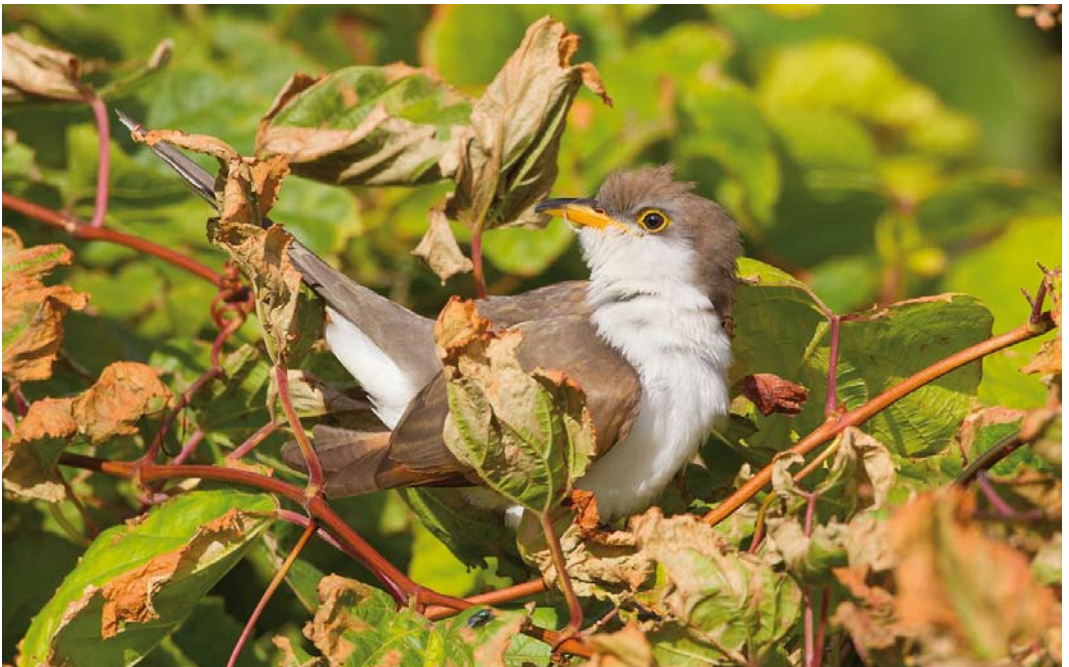
554 Yellow-billed Cuckoo / Geelsnavelkoekoek Coccyzus americanus , Corvo, Azores, 21 October 2014 (David Monticelli)