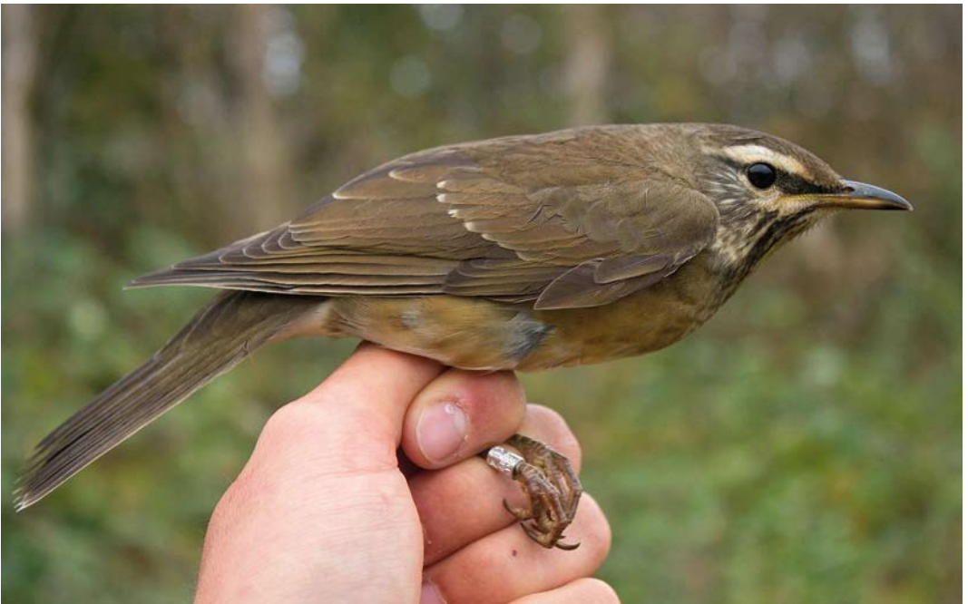
542 Eyebrowed Thrush / Vale Lijster Turdus obscurus , first-year, Gedser, Nordjylland, Denmark, 18 October 2014 (Anders O W Nielsen)