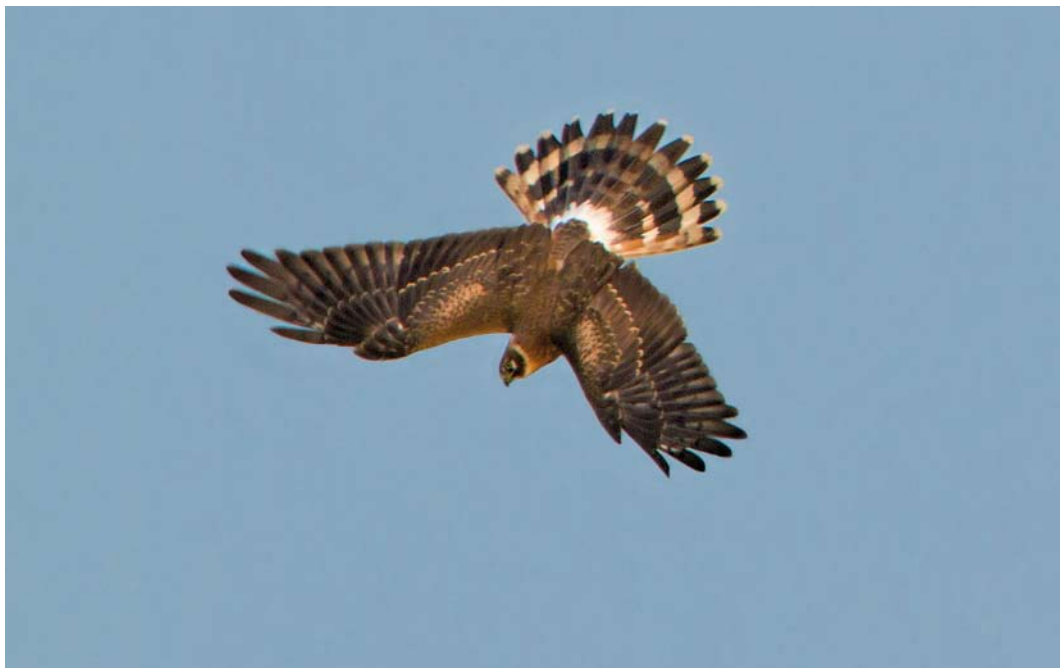
564 Steppekiekendief / Pallid Harrier Circus macrourus , eerstjaars mannetje, Oorsprongweg, Texel, Noord-Holland, 11 oktober 2014