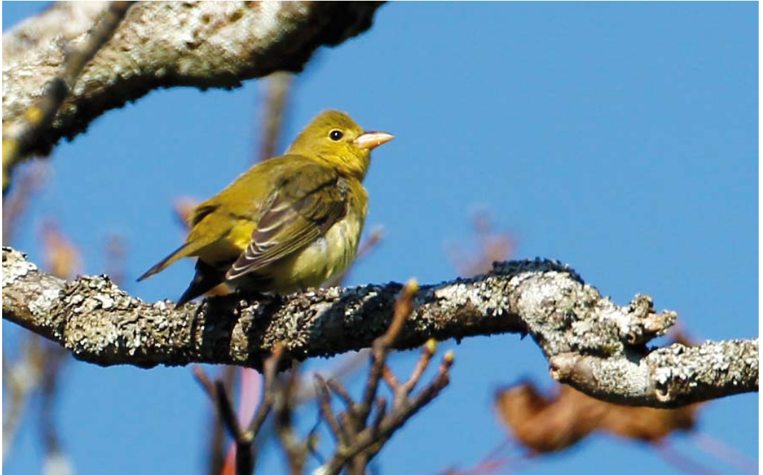
547 Scarlet Tanager / Zwartvleugeltangare Piranga olivacea , first-year male, Barra, Outer Hebrides, Scotland, 8 October 2014 (Mark Rayment)