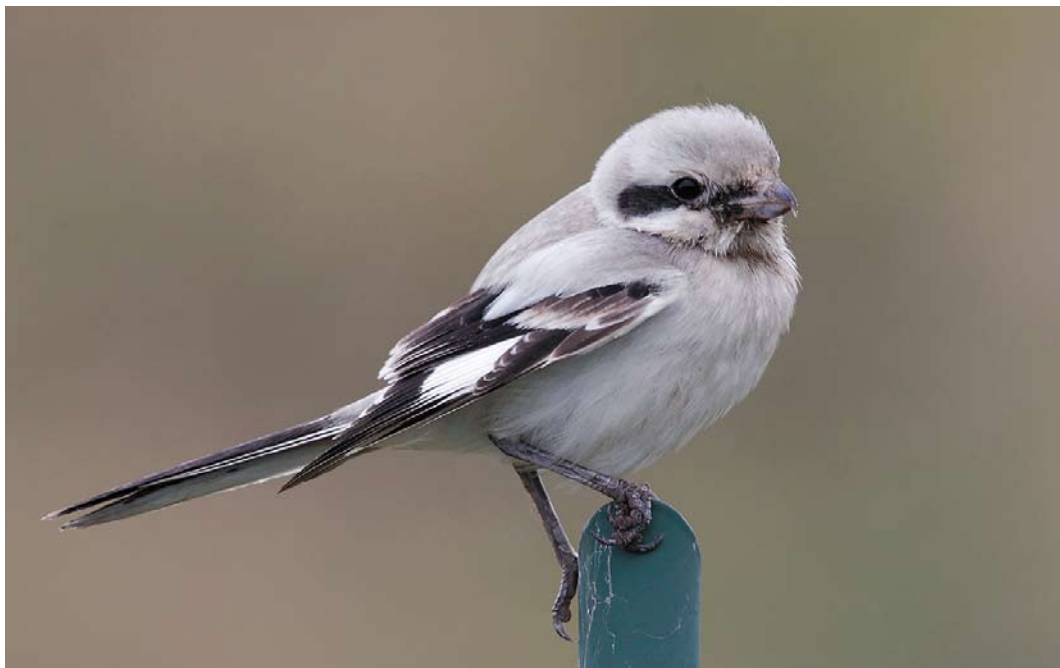
570 Steppeklapekster / Steppe Grey Shrike Lanius lahtora pallidirostris , eerstejaars, Den Helder, Noord-Holland, 25 oktober 2014 (Eric Menkveld) 571 Izabelklauwier / isabelline shrike Lanius isabellinus/phoenicuroides , tweedekalenderjaar vrouwtje, Westerduinen, Texel, Noord-Holland, 11 oktober 2014 (Eric Menkveld) 572 Daurische Klauwier / Daurian Shrike Lanius isabellinus , eerstejaars, Wimmenummerduinen, Egmond aan Zee, Noord-Holland, 18 oktober 2014 (Eric Menkveld)