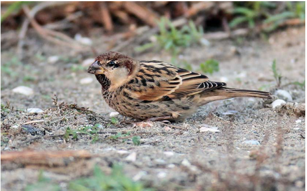
578 Spaanse Mus / Spanish Sparrow Passer hispaniolensis , mannetje, Missouriweg, Maasvlakte, Zuid-Holland, 27 oktober 2014 (André Strootman)