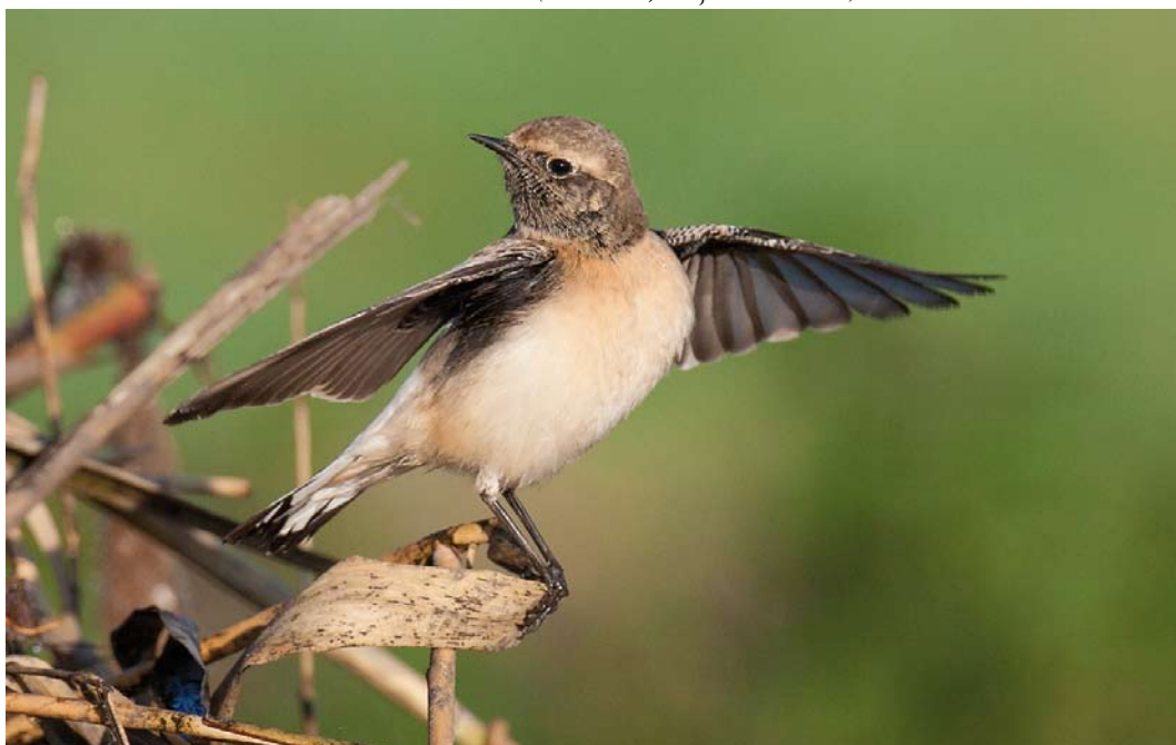
560 Pied Wheatear / Bonte Tapuit Oenanthe pleschanka , first-year male, Zoeterwoude, Zuid-Holland, Netherlands, 13 November 2014