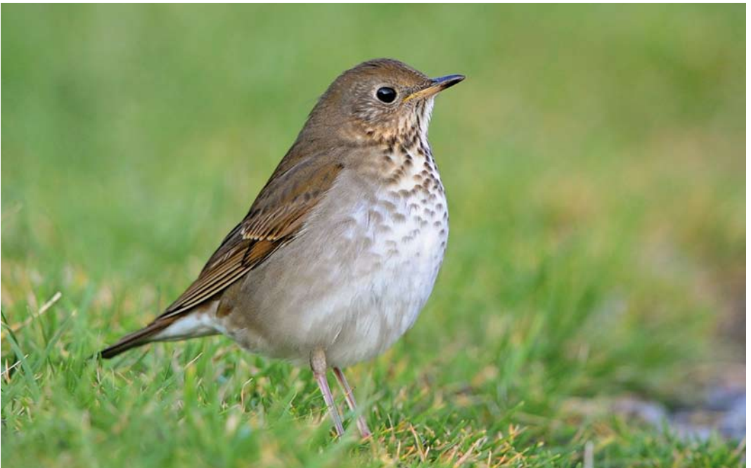
544 Grey-cheeked Thrush / Grijswangdwerglijster Catharus minimus , first-year, Rerwick, Mainland, Shetland, Scotland, 10 November 2014 (Rebecca Nason)