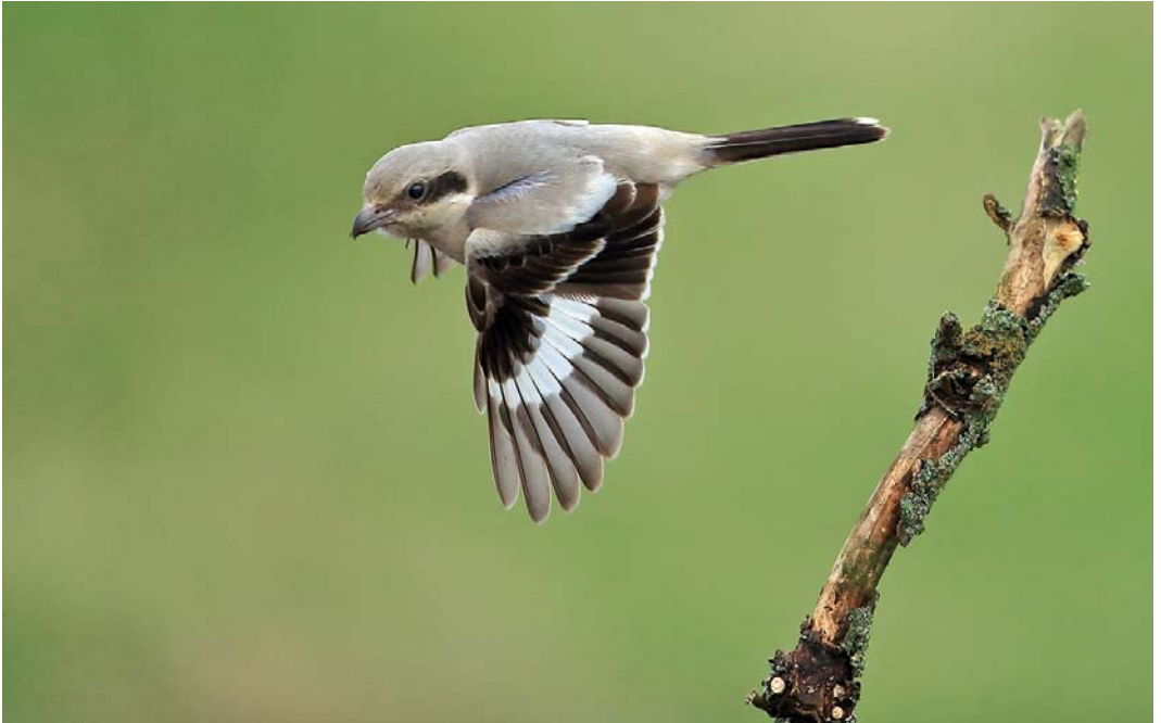
557 Steppe Grey Shrike / Steppeklapekster Lanius lahtora pallidirostris , first-year, Burnham Norton, Norfolk, England, 12 October 2014