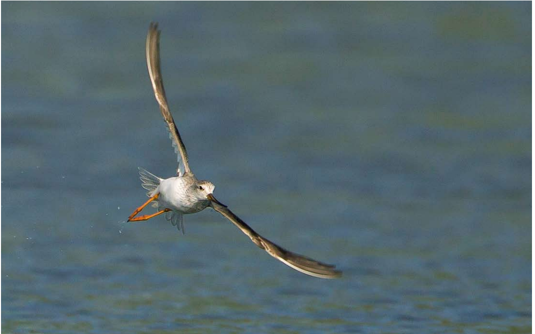
498 Terek Sandpiper / Terekruiter Xenus cinereus , male, Spaarndam-West, Noord-Holland, 28 May 2013