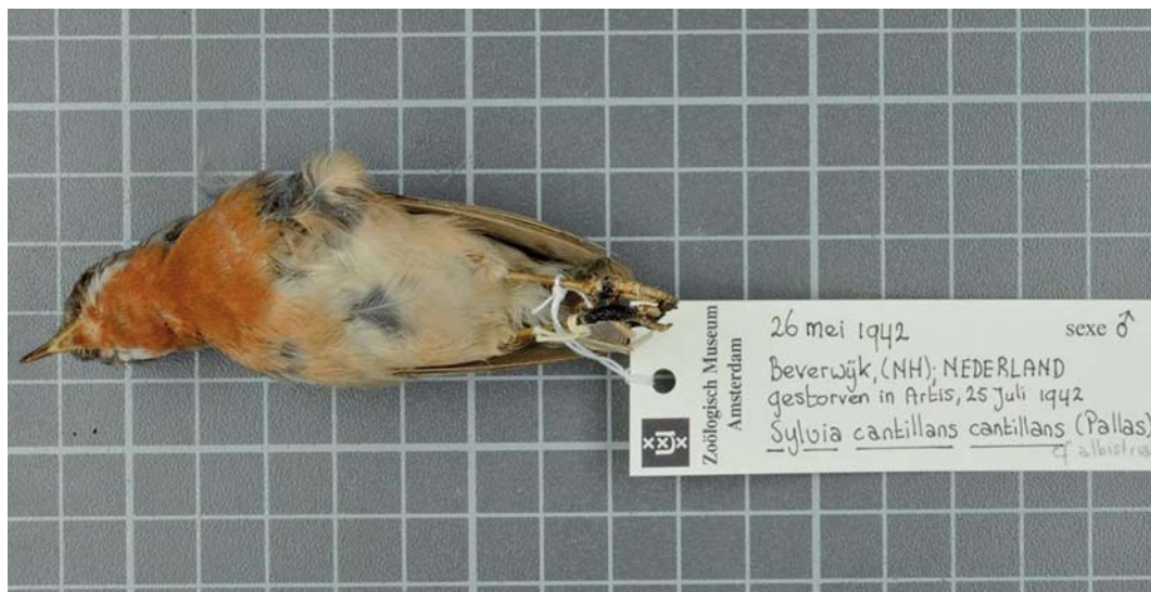
522 Balkanbaardgrasmus / Eastern Subalpine Warbler Sylvia cantillans , mannetje (gevangen in Beverwijk, Noord-Holland, op 26 mei 1942, gestorven in Artis, Amsterdam, Noord-Holland, op 25 juli 1942), Naturalis Biodiversity Center, Leiden, Zuid-Holland, 21 september 2014 (Naturalis Biodiversity Center). Steenrode kleur beperkt tot kin, keel en bovenborst, brede mondstreep en (hoewel niet zichtbaar op foto) een-na-buitenste staartpen (t5) met karakteristieke lichte wig bevestigen determinatie / brick-red coloration confined to chin, throat and upperbreast, broad submoustachial stripe and (not visible on photograph) second outermost tail-feather (t5) with characteristic pale wedge confirm identification.