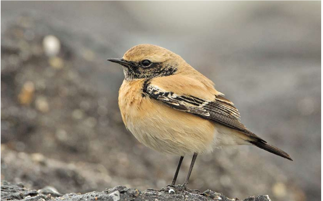
519 Desert Wheatear / Woestijntapuit Oenanthe deserti , first-winter male, Westkapelle, Zeeland, 1 November 2013