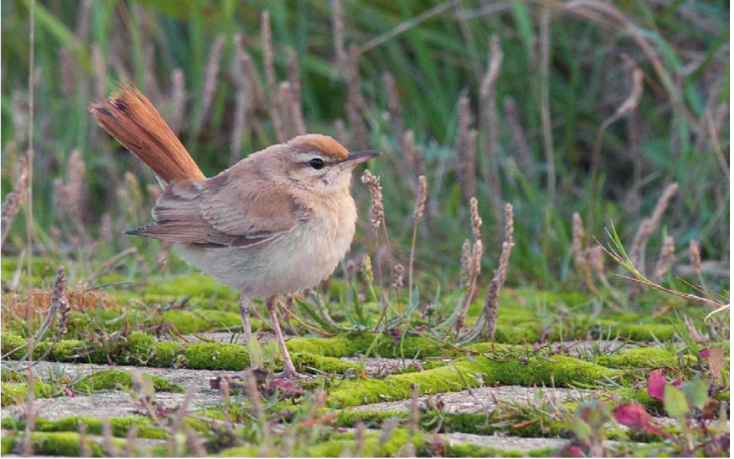
516 Western Rufous-tailed Scrub Robin / Westelijke Rosse Waaiertaart Cercotrichas galactotes galactotes , first-winter, Camperduin, Noord-Holland, 27 September 2014 ( René van Rossum ) 517 Siberian Stonechat / Aziatische Roodborsttapuit Saxicola maurus maurus , first-winter male, Robbenjager, De Cocksdorp, Texel, Noord-Holland, 10 October 2013 ( Eric Menkveld ) 518 Red-flanked Bluetail / Blauwstaart Tarsiger cyanurus , first-winter, Levensvreugd, De Cocksdorp, Texel, Noord-Holland, 15 October 2013 ( Hans Gebuis )