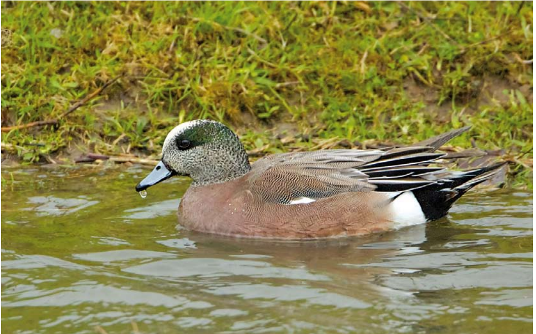
490 American Wigeon / Amerikaanse Smient, Anas americana , male, Eiland van Maurik, Gelderland, 3 February 2013 (Martin van der Schalk)