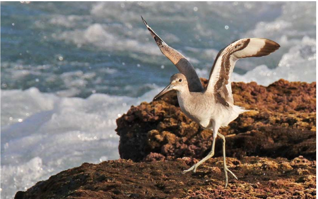
531 Western Willet / Westelijke Willet Tringa semipalmata inornata , first-year, Ponta Delgado, São Miguel, Azores, 23 September 2014 ( John de Roos )