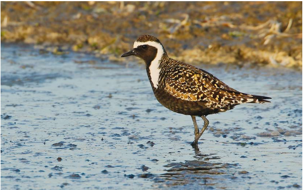
499 American Golden Plover / Amerikaanse Goudplevier Pluvialis dominica , adult summer, Camperduin, Noord-Holland, 3 June 2013 (Martin van der Schalk)