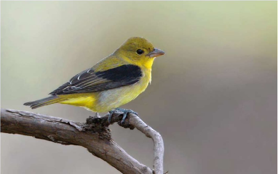
551 Scarlet Tanager / Zwartvleugeltangare Piranga olivacea , first-year male, Corvo, Azores, 9 October 2014 (David Monticelli)