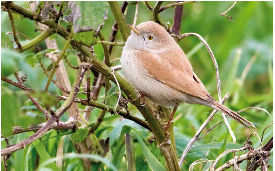
587 Afrikaanse Woestijngrasmus / African Desert Warbler Sylvia deserti , Alphen aan den Rijn, Zuid-Holland, 26 november 2014 (Jaap Denee)