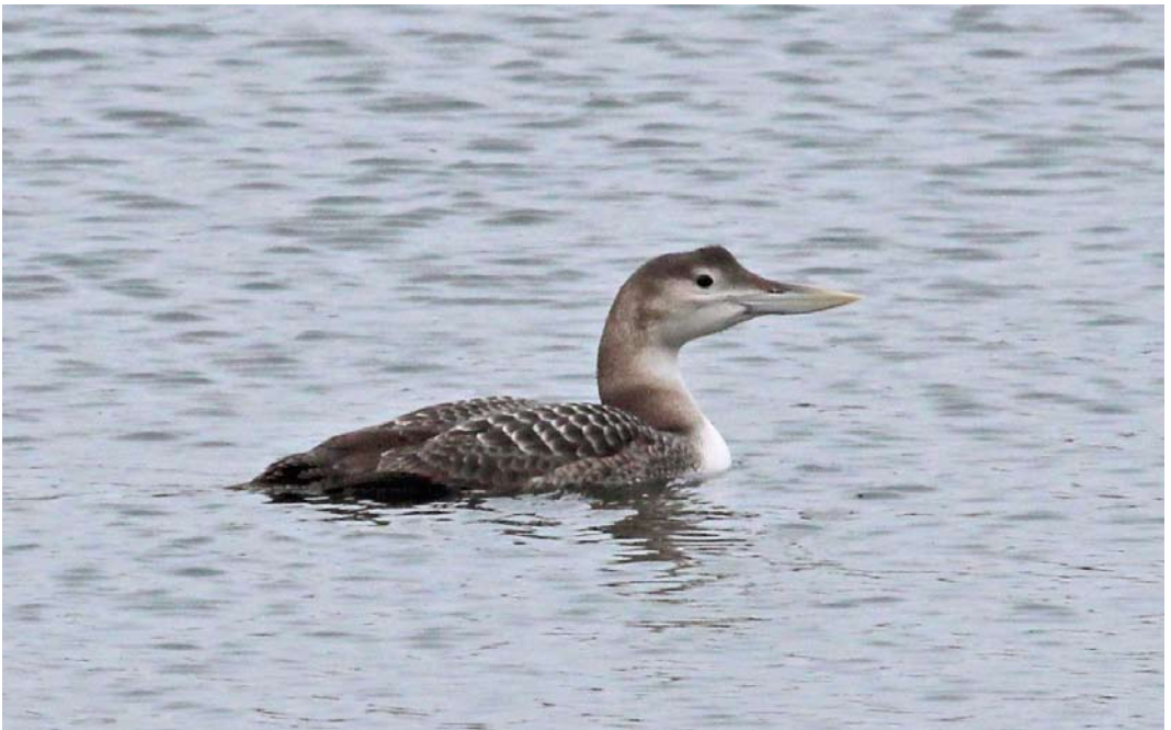
497 Yellow-billed Loon / Geelsnavelduiker Gavia adamsii , first-winter, Bommeneede, Zeeland, 17 February 2013