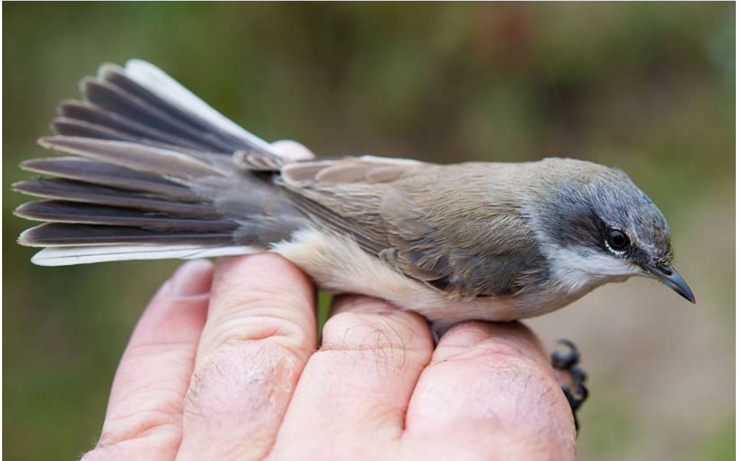
511 Siberian Lesser Whitethroat / Siberische Braamsluiper Sylvia althaea blythi , Bloemendaal, Noord-Holland, 20 October 2012