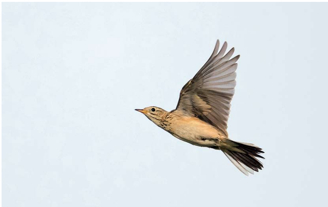
559 Blyth's Pipit / Mongoolse Pieper Anthus godlewskii , first-year, Kieldrecht, Oost-Vlaanderen, Belgium, 25 October 2014