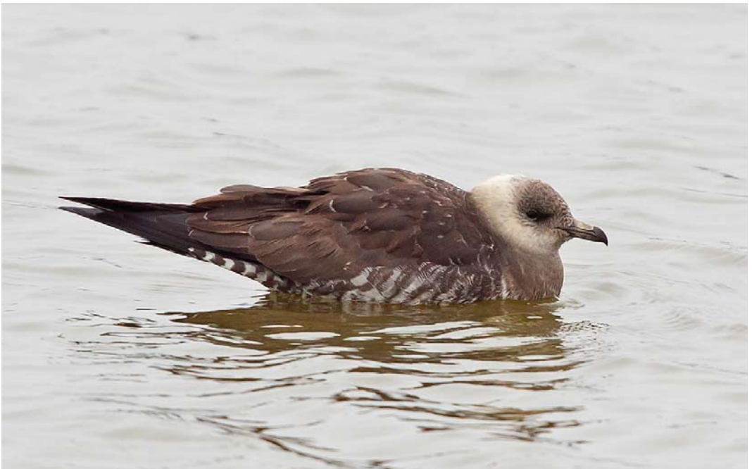
567 Kleinste Jager / Long-tailed Jaeger Stercorarius longicaudus , tweede kalenderjaar, De Putten, Camperduin, Noord-Holland, 6 september 2014 (Maurits Martens)