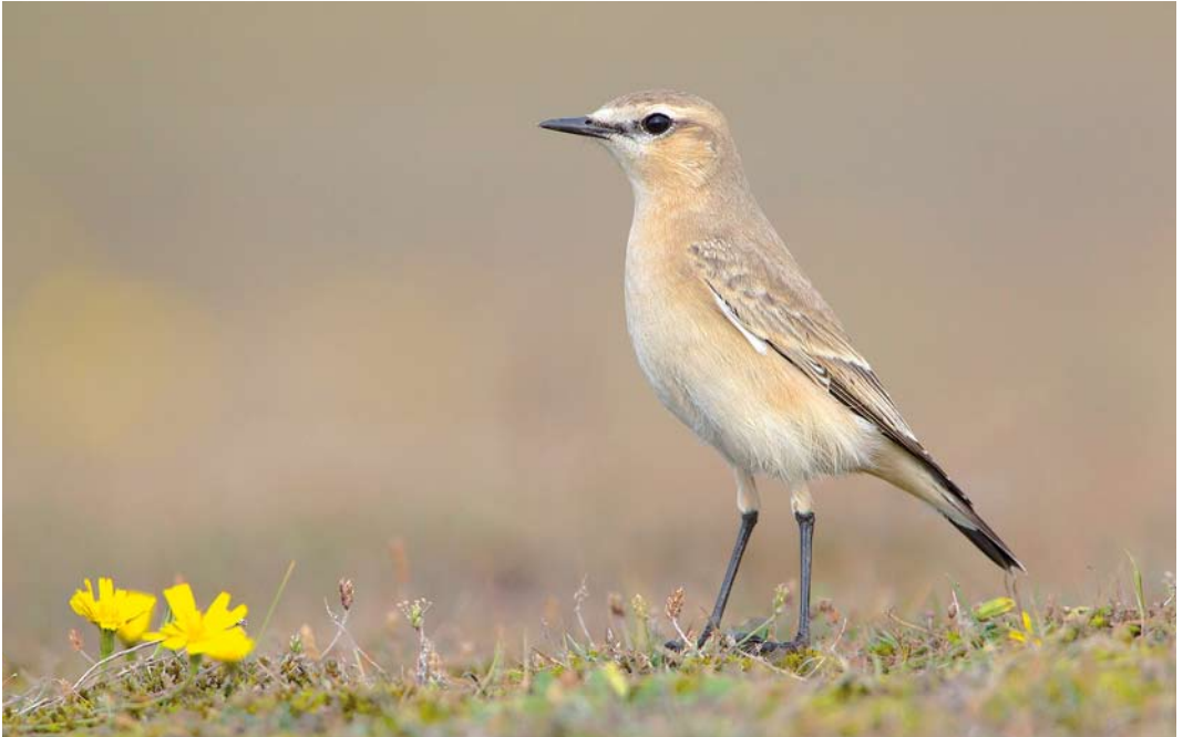
573 Izabeltapuit / Isabelline Wheatear Oenanthe isabellina , eerstejaars, Maasvlakte, Zuid-Holland, 5 oktober 2014 (Martin van der Schalk)