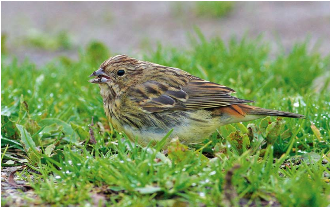
556 Chestnut Bunting / Rosse Gors Emberiza rutila , first-year, Ouessant, Finistère, France, 24 October 2014