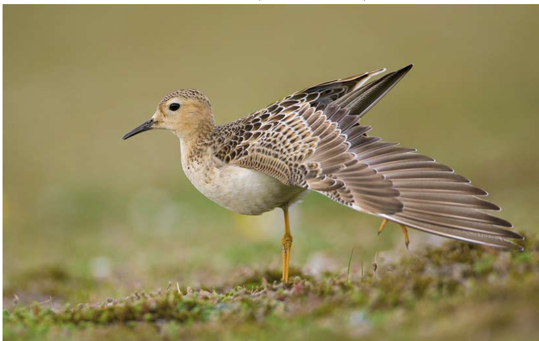
569 Blonde Ruiters / Buff-breasted Sandpiper Calidris subruficollis , juveniel, Maasvlakte, Zuid-Holland, 19 oktober 2014 (Martin van der Schalk)