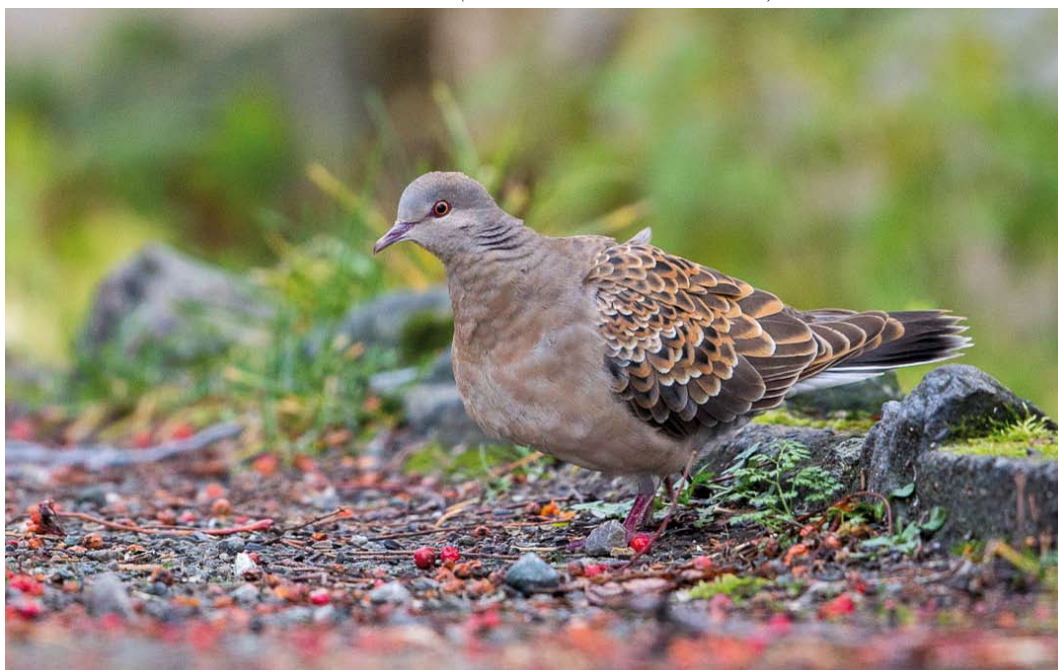
533 Rufous Turtle Dove / Meenatorstel Streptopelia orientalis meena , adult, Vestvågøy, Lofoten, Norway, 30 October 2014