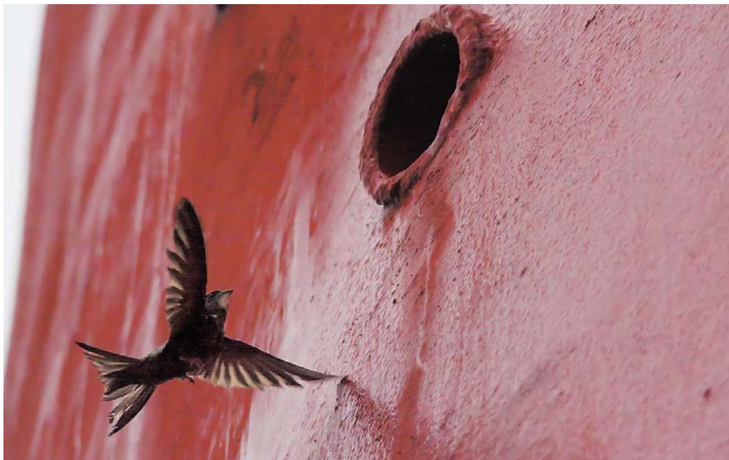
532 Pallid Swift / Vale Gierzwaluw Apus pallidus , De Cocksdorp, Texel, Noord-Holland, Netherlands, 15 November 2014 ( Gerben Mensink ). Near roosting hole at lighthouse.