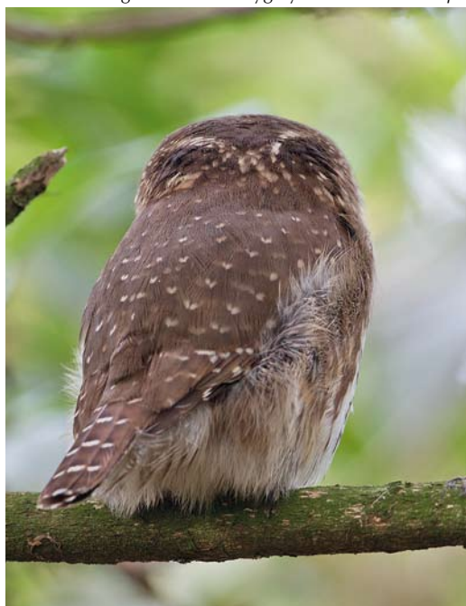
88-89 Dwerguil / Eurasian Pygmy Owl Glaucidium passerinum , Lettele, Overijssel, 4 januari 2014

De laatste uilensoort van 2013, Sneeuwuil, kondigde