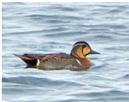
70 Vale Gierzwaluw / Pallid Swift Apus pallidus , juveniel, Oosterscheldekering, Zeeland, 2 november 2013 ( Alex Bos ) 71 Swinhoes Boszanger / Two-barred Warbler Phylloscopus plumbeitarsus , Kamperhoek, Flevoland, 2 december 2013 ( Marten Miske ) 72-73 Provençaalse Grasmus / Dartford Warbler Sylvia undata , Westkapelle, Zeeland, 2 november 2013 ( Corstiaan Beeke ) 74 Izabeltapuit / Isabelline Wheatear Oenanthe isabellina , eerste-winter mannetje, Kroonspolders, Vlieland, Friesland, 2 november 2013 ( Sander Lagerveld ) 75 Siberische Taling / Baikale Teal Anas formosa , eerste-winter mannetje, Driel, Gelderland, 25 december 2013 ( Alex Bos )