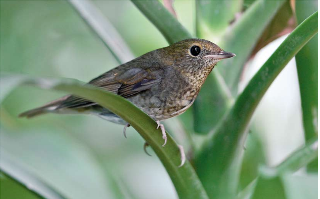
29-31 Rufous-headed Robin / Roodkopnachttegaal Larivora ruficeps , first-winter female, Phnom Penh, Cambodia, 20 November 2012 (James A Eaton)