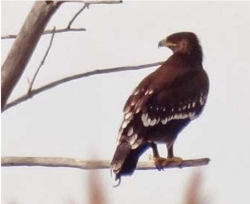
58 Greater Spotted Eagle / Bastaardarend Aquila clanga , first-year, Daimiel, Ciudad Real, Castilla-La Mancha, Spain, 30 December 2013