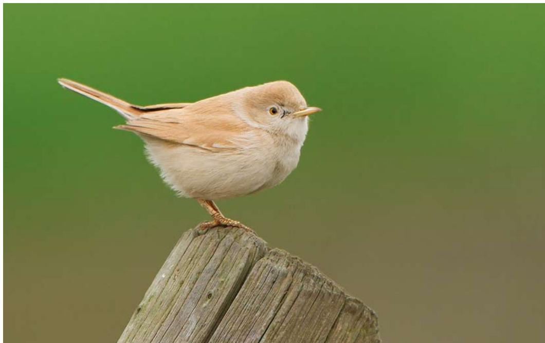
586 Afrikaanse Woestijngrasmus / African Desert Warbler Sylvia deserti , Alphen aan den Rijn, Zuid-Holland, 26 november 2014