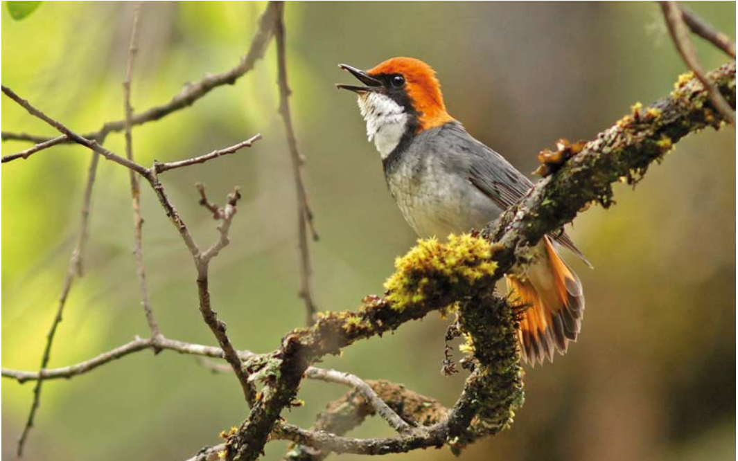
28 Rufous-headed Robin / Roodkopnachttegaal Larvivora ruficeps , male, Jiuzhaigou, Sichuan, China, 17 May 2013

status of both taxa based on analyses of mitochondrial and nuclear DNA, vocalisations and distributions. Phylogenetic analysis confirmed that they are sister species, their genetic divergence (cytochrome b 6.4%) being comparable with several other species pairs of 'chats'. Discriminant function analysis of songs correctly classified 88% of the recordings. Based on these congruent differences in morphology, songs and molecular markers, it was confirmed that they are appropriately treated as separate species.