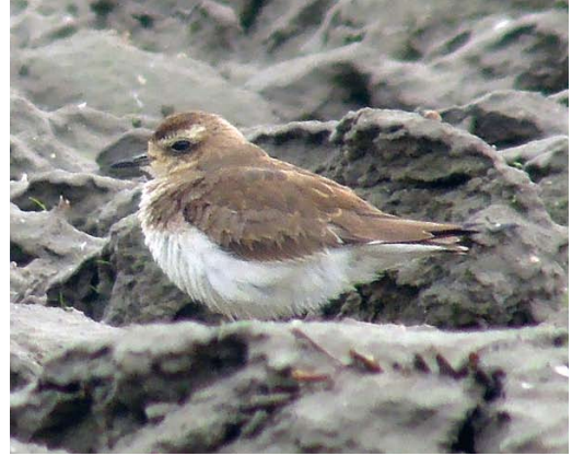
96 Kaspische Plevier / Caspian Plover Charadrius asiaticus , eerste-winter, Wissenkerke, Zeeland, 18 januari 2014 (Kris De Rouck)

op met een aantal Kieviten en verdween in westelijke richting. Zoekacties leverden in de laatste paar uur daglicht niets meer op; enkele 10-tallen vogelaars waren vergeefs gekomen. De volgende ochtend duurde het een paar uur totdat Hans Moerman en Hugo Moerman hem tussen enkele Watersnippen Gallinago gallinago terugvonden op een geploegde akker nabij Wissenkerke. Hier werd hij tot 12:30 waargenomen en de dagen erna was hij met enige moeite steeds terug te vinden op akkers in de omgeving, vaak solitair en lastig te zien tussen de kleihopen of de lage begroeiing. Op zaterdag en zondag trok hij in totaal enkele 100en belangstellenden en daarna enkele 10-tallen op doordeweekse dagen en weer meer dan 100 in het weekend van 18-19 januari; onder de bezoekers waren veel vogelaars uit België en enkele uit Brittannië, Duitsland en Frankrijk. De vogel werd gezien tot ten minste 26 januari.