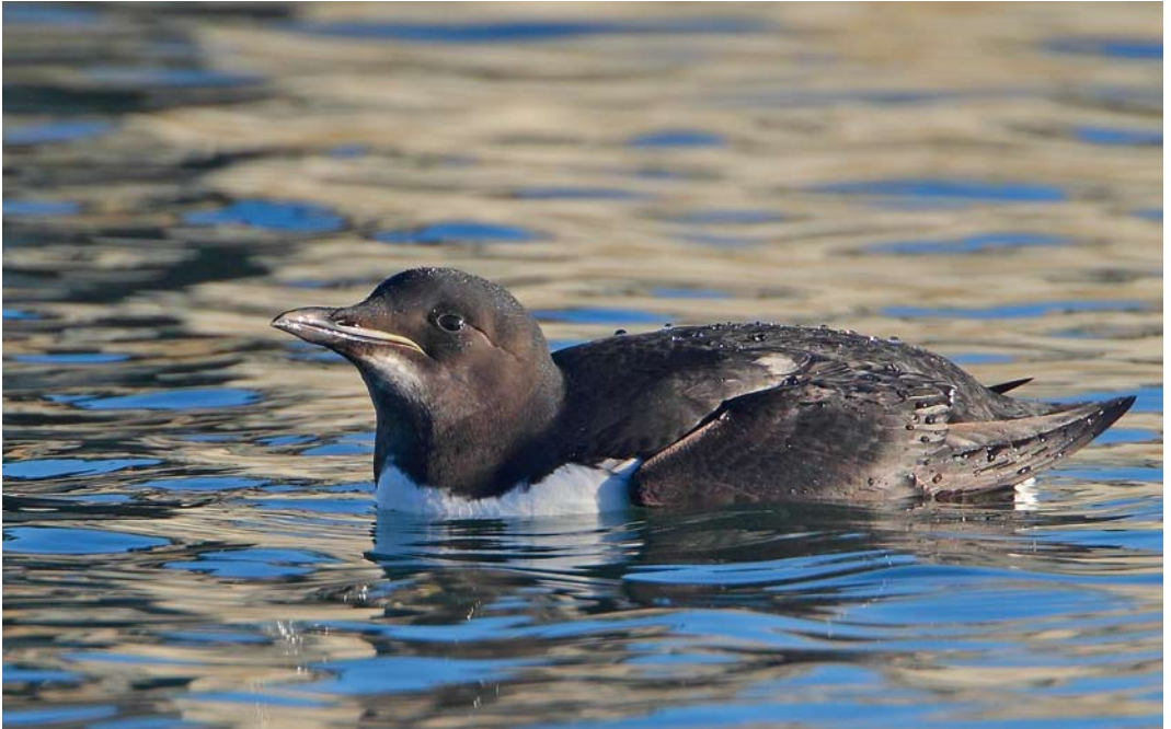
48 Thick-billed Murre / Kortbekzeekeet Uria lomvia , Portland harbour, Dorset, England, 29 December 2013