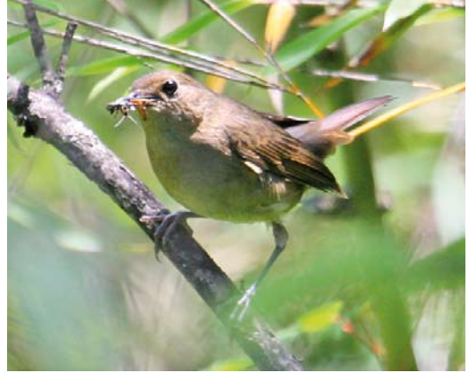
41 Blackthroat / Zwartkeelnachtegaal Calliope obscura , female, Changqing NP, Shaanxi, China, 23 June 2012