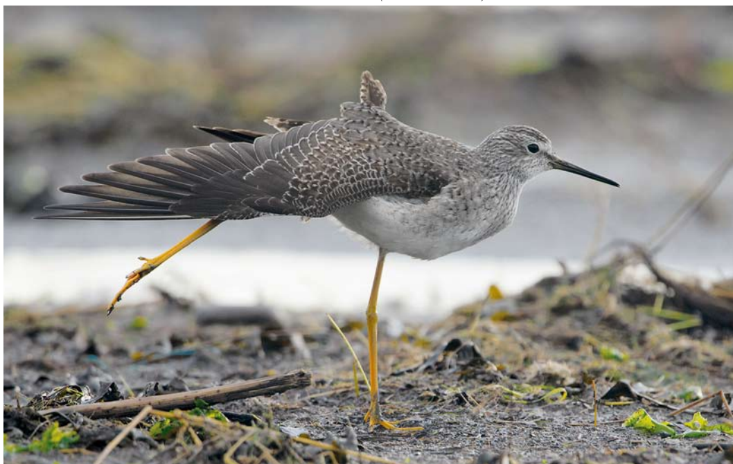
67 Kleine Geelpootruiter / Lesser Yellowlegs Tringa flavipes , eerste-winter, Vatrop, Noord-Holland, 28 december 2013