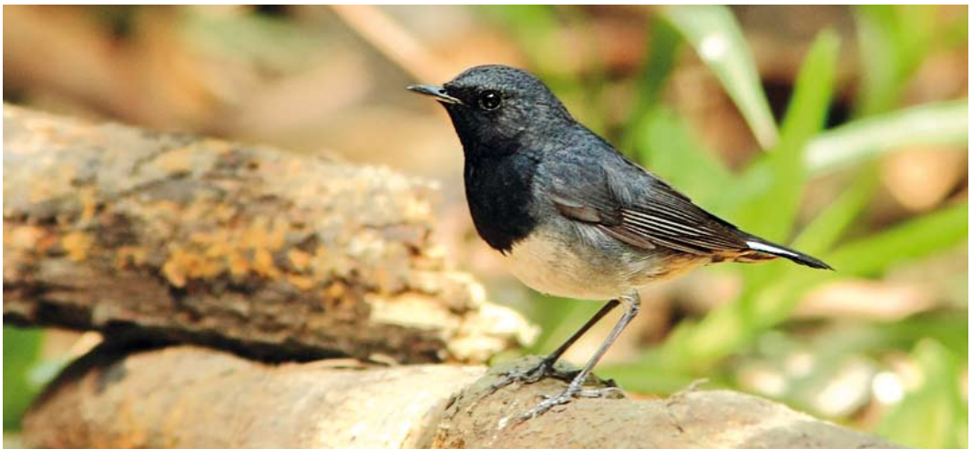
42 Blackthroat / Zwartkeelnachtegaal Calliope obscura , first-summer male, Sichuan University, Shengdu, Sichuan, China, 2 May 2011

Goodwin, D & Vaurie, C 1956. Are Luscinia pectardens