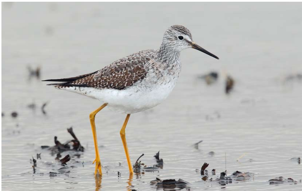
66 Kleine Geelpootruiter / Lesser Yellowlegs Tringa flavipes , eerste-winter, Vatrop, Noord-Holland, 16 december 2013