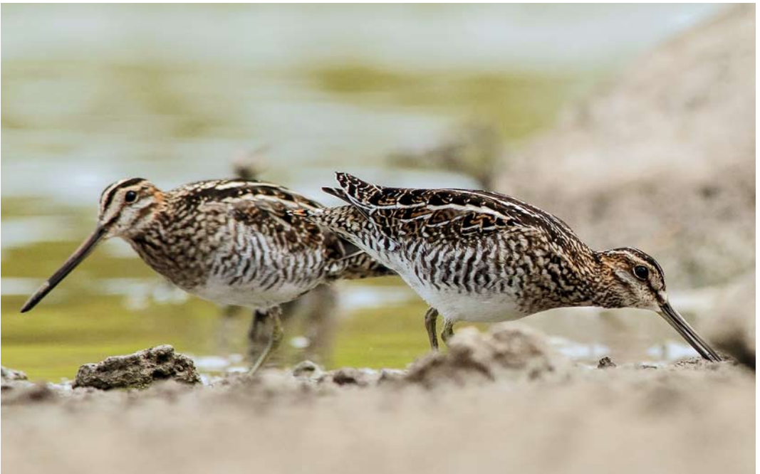
51 Wilson's Snipes / Amerikaanse Watersnippen Gallinago delicata , Tejina, La Laguna, Tenerife, Canary Islands, 26 October 2013 (Ramón Fernández Febles)