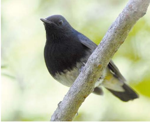
40 Blackthroat / Zwartkeelnachtegaal Calliope obscura , male, Changqing NP, Shaanxi, China, 4 June 2013