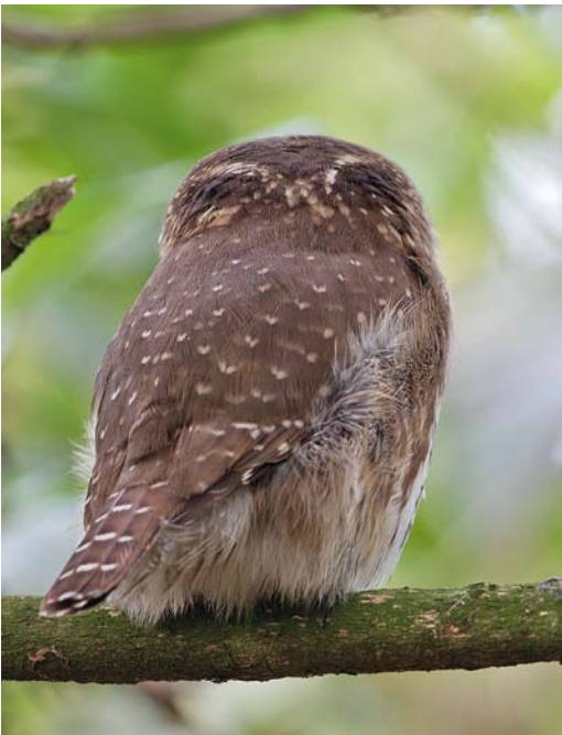
88-89 Dwerguil / Eurasian Pygmy Owl Glaucidium passerinum , Lettele, Overijssel, 4 januari 2014 (Jaap Denee)

De laatste uilensoort van 2013, Sneeuwuil, kondigde