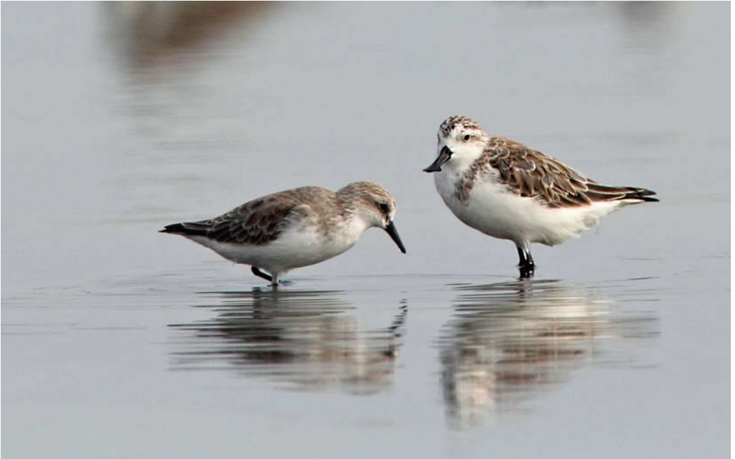
50 Spoon-billed Sandpiper / Lepelbekstrandloper Calidris pygmaea , adult winter, with Red-necked Stint / Roodkeelstrandloper C. ruficollis , adult winter, Pak Thale, Thailand, 8 January 2014 (Edwin Winkel)