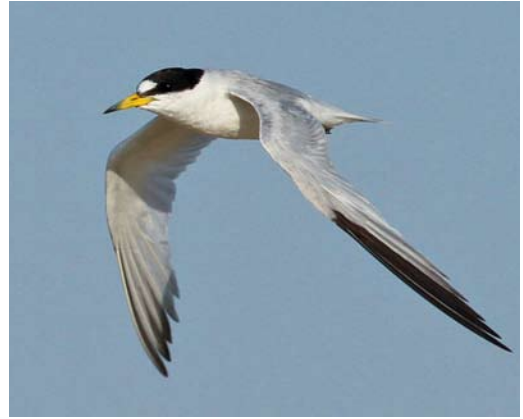
18-19 Saunders's Tern / Saunders' Dwergstern Sternula saundersi , adult, Ras Sudr, Sinai, Egypt, 25 July 2013

Arabian part of the Western Palearctic (WP, sensu BWP), Kuwait in the east (where breeding has been suspected in the past; Jennings 2010) and Egypt in the west would be the obvious choices, especially Egypt with its high densities of seabird colonies (predominantly White-eyed Gulls Larus leucophthalmus , Bridled Terns Onychoprion anaethetus and White-cheeked Terns Sterna repressa ).