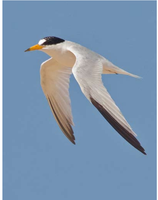
20-21 Saunders's Tern / Saunders' Dwergstern Sternula saundersi , adult, Ras Sudr, Sinai, Egypt, 25 July 2013 (Vincent Legrand)