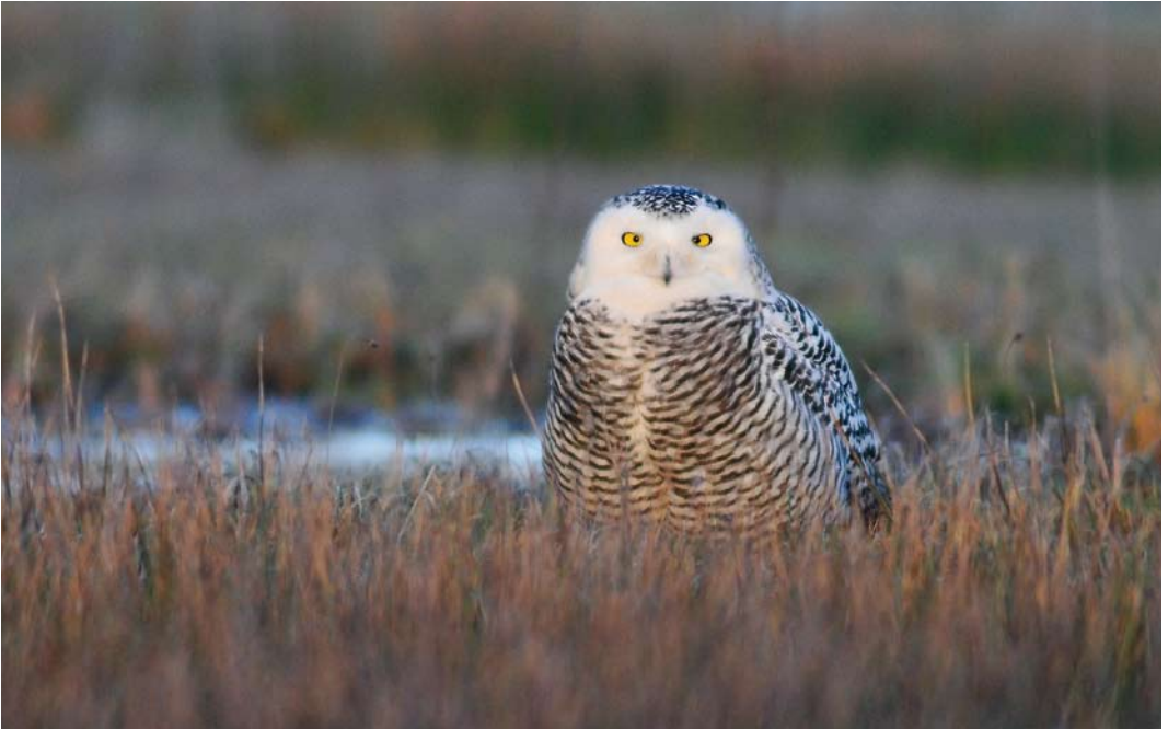
90 Sneeuwuil / Snowy Owl Bubo scandiacus , eerste-winter vrouwtje, De Cocksdorp, Texel, Noord-Holland, 28 december 2013