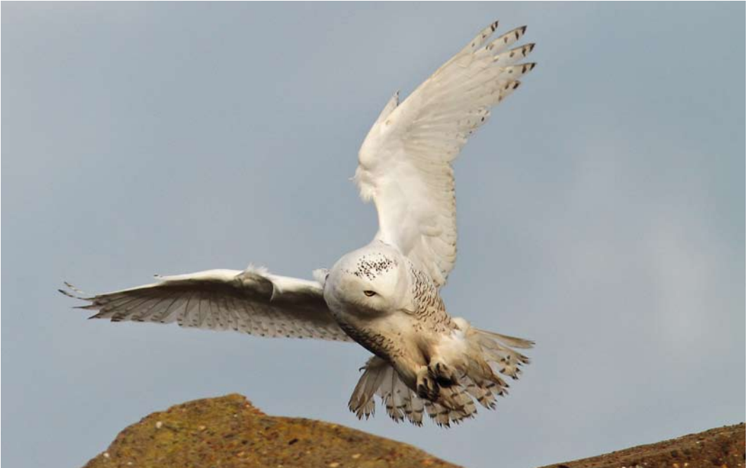
52 Snowy Owl / Sneeuwuil Bubo scandiacus , Zeebrugge, immature male, West-Vlaanderen, Belgium, 22 December 2013