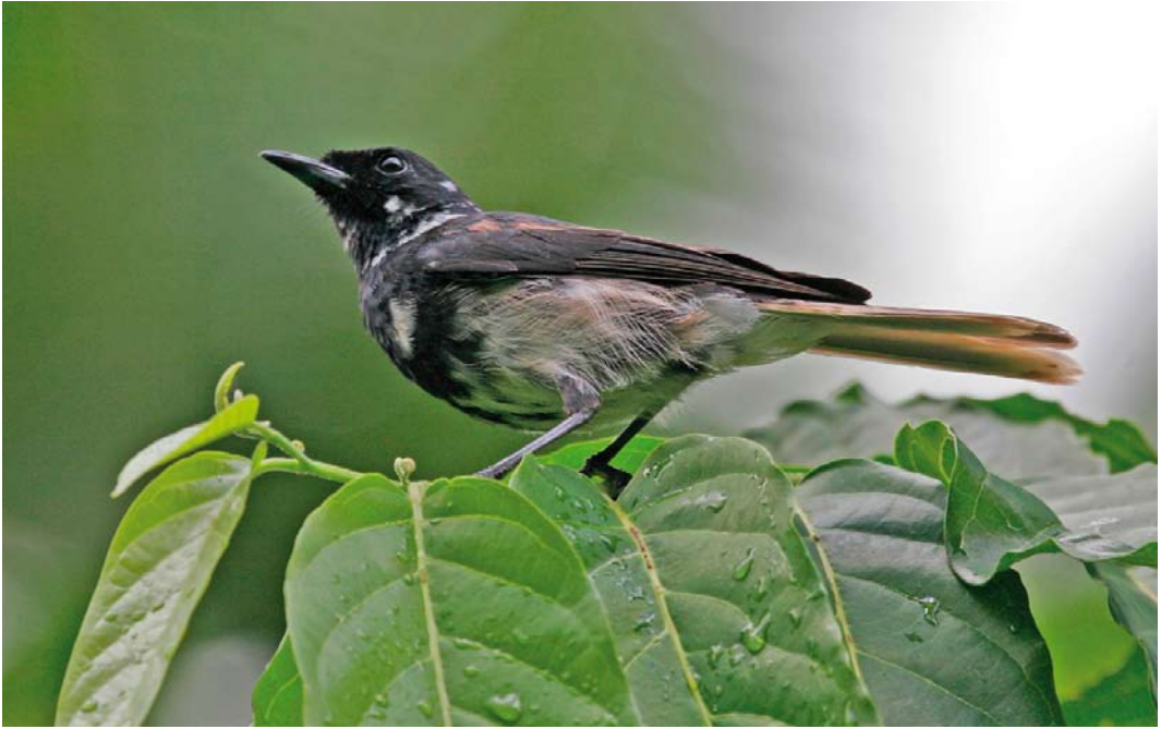
308 Iphis Monarch / Iphismonarch Pomarea iphis , Botanique Communal de Vaipae, Ua Huka, Marquesas Islands, French Polynesia, 16 September 2006

Horned Owl Bubo virginianus (in the Marquesas) may affect species groups like pigeons and doves, lorikeets, kingfishers and swiftlets (Holyoak & Thibault 1984).