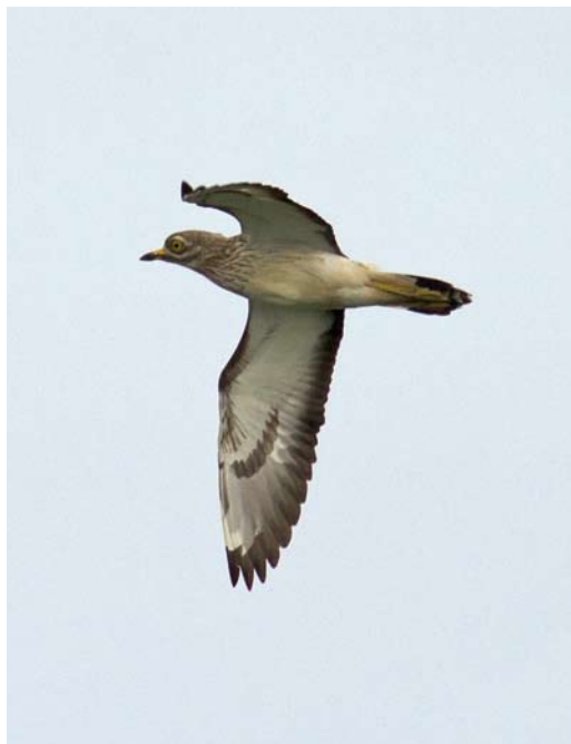
349 Dougalls Stern / Roseate Tern Sterna dougallii , adult-zomer, De Putten, Camperduin, Noord-Holland, 25 juni 2013 350 Griel / Eurasian Stone-curlew Burhinus oedicanus , Burghsluis, Zeeland, 14 mei 2013 351 Terekruiter / Terek Sandpiper Xenus cinereus , met Tureluur / Common Redshank Tringa totanus , Spaarndam, Noord-Holland, 28 mei 2013