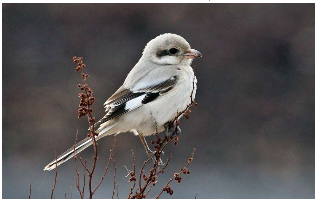
282 Steppeklapekster / Steppe Grey Shrike Lanius lahtora pallidirostris , Vivesholm, Gotland, Zweden, 28 oktober 2009