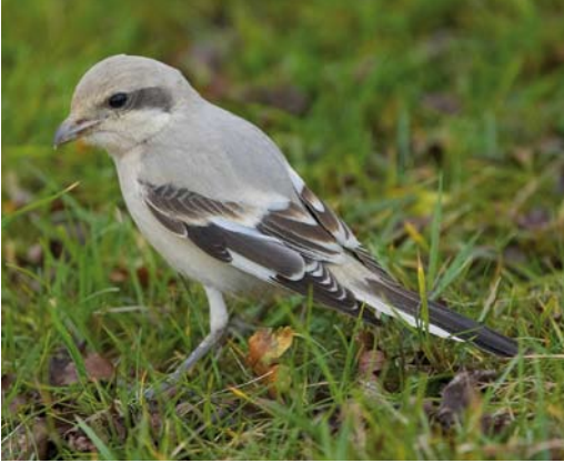
285 Steppeklapekster / Steppe Grey Shrike Lanius lahtora pallidirostris , Grainthorpe Haven, Lincolnshire, Engeland, 15 november 2008 (Glyn Sellors)