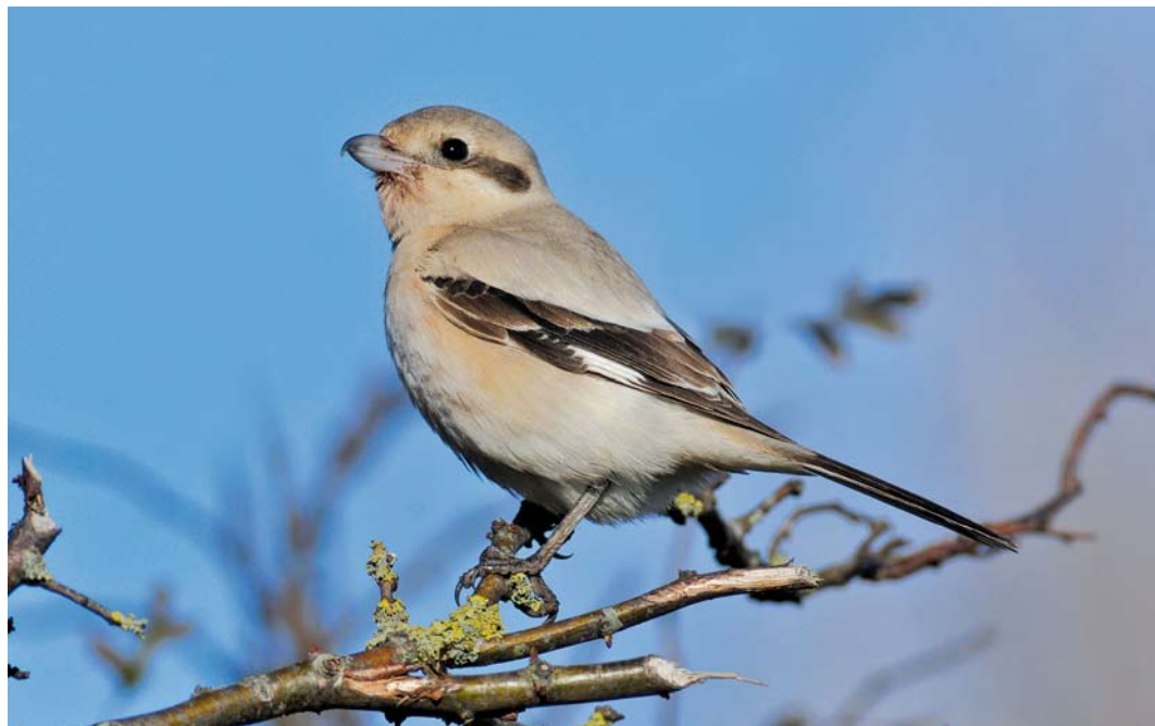
276 Steppeklapekster / Steppe Grey Shrike Lanius lahtora pallidirostris , eerstejaars, Buitendijk, Texel, Noord-Holland, 5 november 2012

basis van: 1 te lange handpenprojectie (duidelijk korter bij Klapekster); 2 overwegend lichte snavel (overwegend donker bij Klapekster maar variabel); 3 lichte teugel (donker bij Klapekster); 4 bruin waas op vleugels, stuit en staart; en 5 lichtgrijze bovendelen met sterke zandkleur en weinig contrast tussen bovendelen en vuilwitte tot roomkleurige onderdelen.