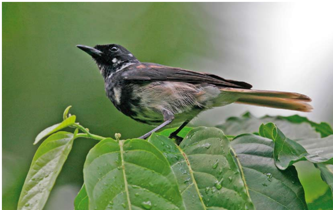
308 Iphis Monarch / Iphismonarch Pomarea iphis , Botanique Communal de Vaipae, Ua Huka, Marquesas Islands, French Polynesia, 16 September 2006

Horned Owl Bubo virginianus (in the Marquesas) may affect species groups like pigeons and doves, lorikeets, kingfishers and swiftlets (Holyoak & Thibault 1984).