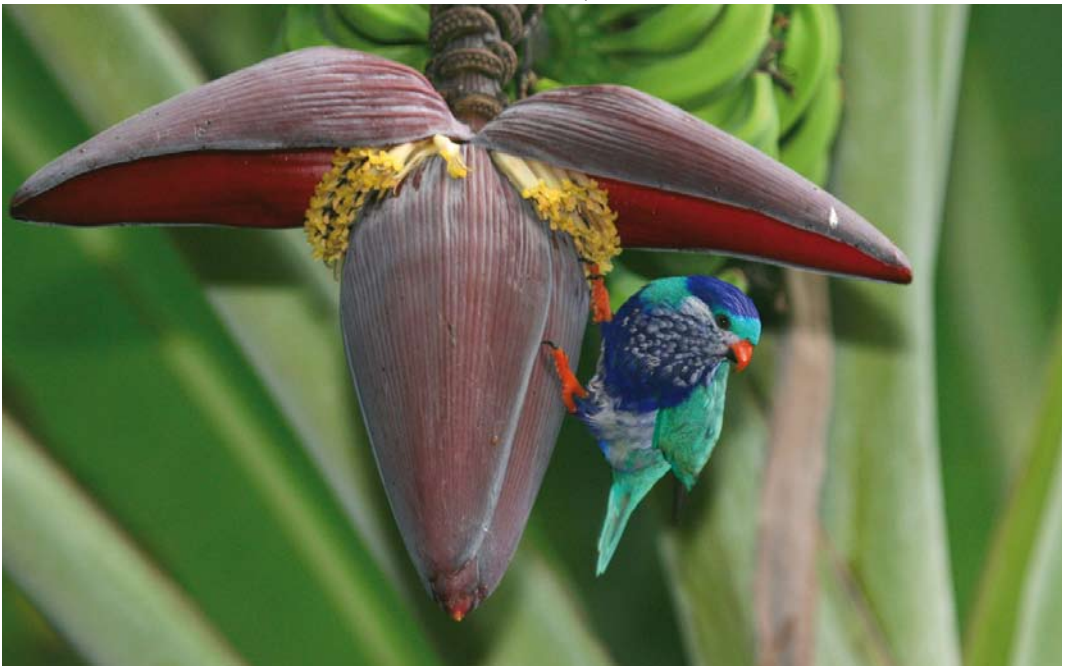
295 Ultramarine Lorikeet / Hemelsblauwe Lori Vini ultramarina , Ua Huka, Marquesas Islands, French Polynesia, October 2009 (Tammy Doukas)