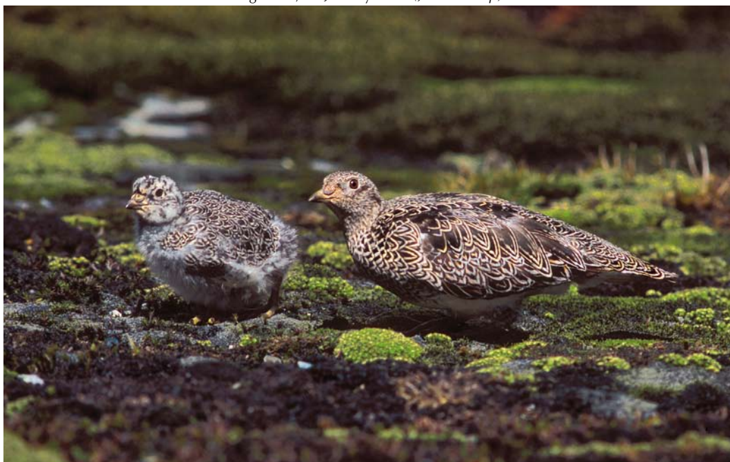
315 White-bellied Seedsnipes / Witbuikkwartelsnippen Attagis malouinus , adult with chick, Paso Garibaldi, Argentina, 31 January 2004