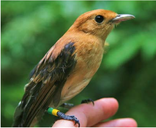
309 Tahiti Monarch / Tahitimonarch Pomarea nigra , immature, Papehue Valley, Tahiti, Society Islands, French Polynesia, 13 February 2009