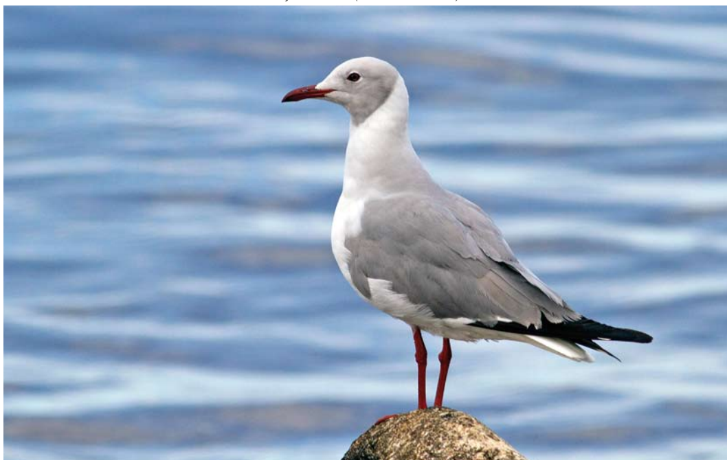
324 Grey-headed Gull / Grijskopmeeuw Chroicocephalus cirrocephalus , adult, Molfetta, Bari, Apulia, Italy, 4 June 2013