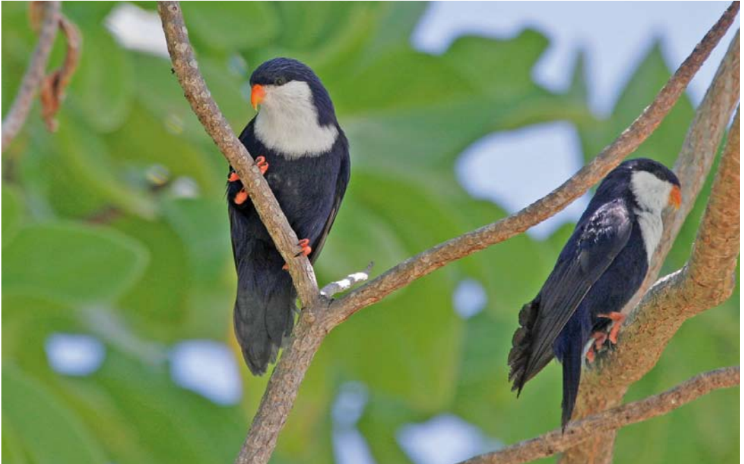
294 Blue Lorikeets / Saffierlori's Vini peruviana , Rangiroa, Tuamotu Islands, French Polynesia, 25 September 2006 (Pete Morris)