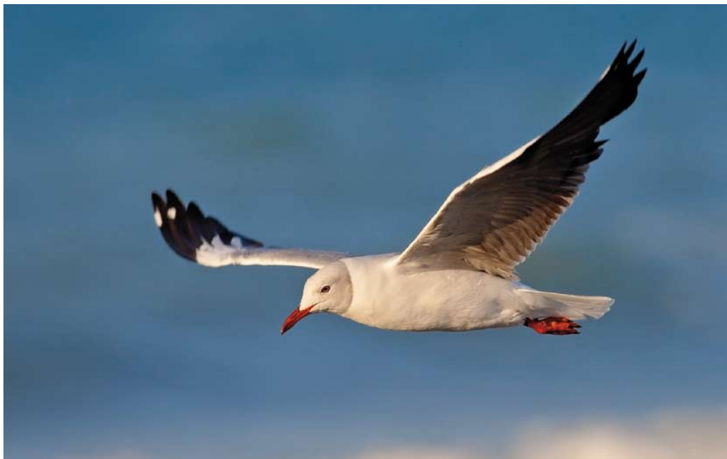
323 Grey-headed Gull / Grijskopmeeuw Chroicocephalus cirrocephalus , adult, Molfetta, Bari, Apulia, Italy, 12 June 2013