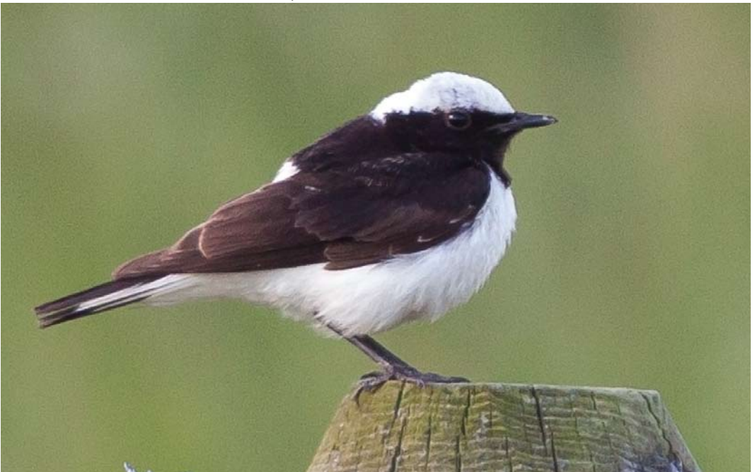
341 Pied Wheatear / Bonte Tapuit Oenanthe pleschanka , first-summer male, Ferwert, Friesland, Netherlands, 9 juli 2013 ( Maurits Martens )