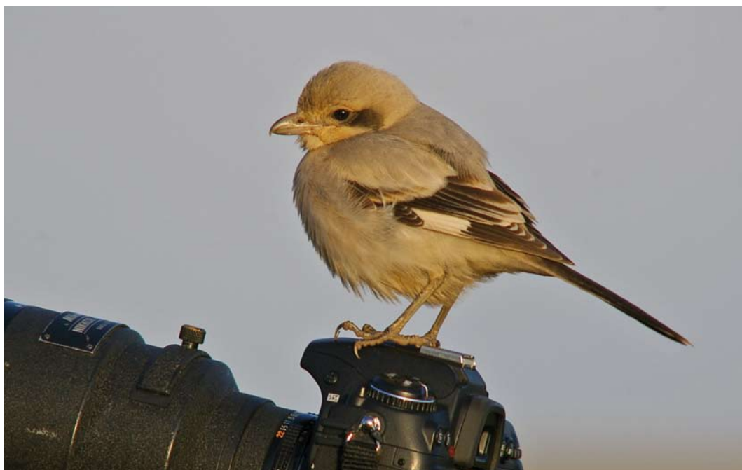
284 Steppeklapekster / Steppe Grey Shrike Lanius lahtora pallidirostris , Grainthorpe Haven, Lincolnshire, Engeland, 24 november 2008 (David Ellis)

De waarneming op Texel in oktober-november 2012 betrof het tweede geval voor Nederland. Van 4 tot 23 september 1994 verbleef een eerste-winter nabij De Cocksdoorp, eveneens op Texel. Ook bij deze vogel dacht men aanvankelijk met een onvolwassen Kleine Klapekster van doen te hebben (Wassink 1997).