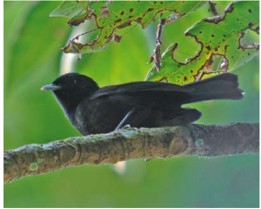
310 Tahiti Monarch / Tahitimonarch Pomarea nigra , adult, Tahiti, Society Islands, French Polynesia, 14 September 2006

For most people, the islands in the Society group will be the best known. Moorea, Bora Bora and Raiatea all make a fabulous honeymoon destination. Consequently, most of these islands are served by frequent flights (more than one daily) from Tahiti. Alternatively, several freighters will take tourists. Ferries also serve Moorea and Huahine.