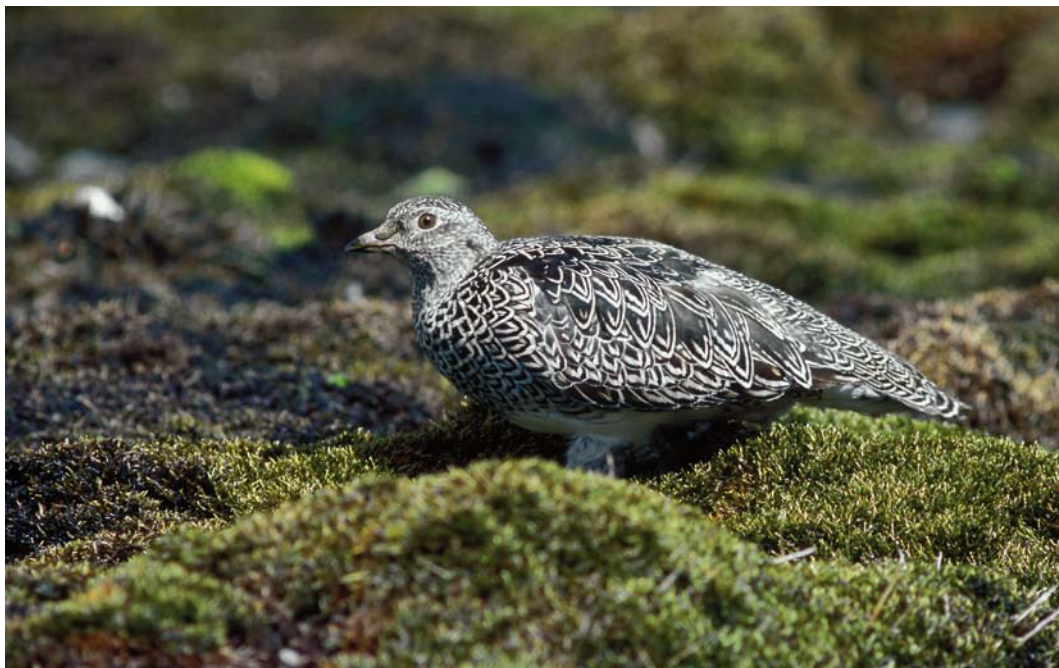
314 White-bellied Seedsnipe / Witbuikkwartelsnip Attagis malouinus , adult, Paso Garibaldi, Argentina, 31 January 2004