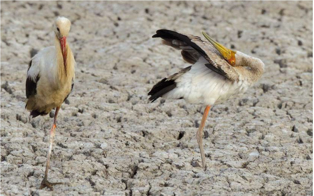
327 Yellow-billed Stork / Afrikaanse Nimmerzat Mycteria ibis , immature, with White Stork / Ooievaar Ciconia ciconia , Bet She'an valley, Israel, 6 July 2013