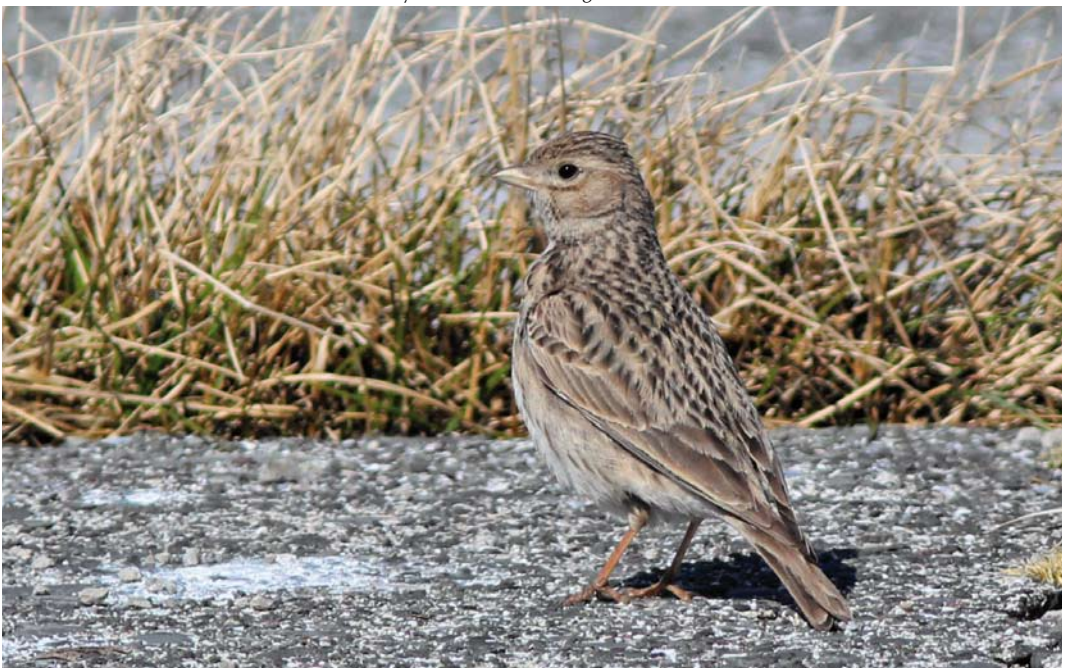
343 Lesser Short-toed Lark / Kleine Kortteenleeuwerik Calandrella rufescens , Hornøya, Finnmark, Norway, 30 May 2013