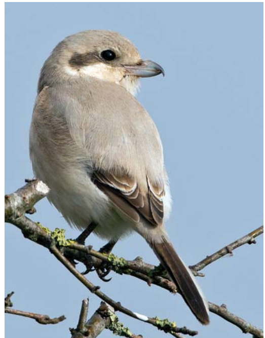
275 Steppeklapekster / Steppe Grey Shrike Lanius lahtora pallidirostris , eerstejaars, Buitendijk, Texel, Noord-Holland, 30 oktober 2012

en teveel getrapt (bovendien past de kleurverdeling op de staart niet op Kleine); 6 te lichte en te lange snavel; en 7 te lange poten, bruin in plaats van zwart. Klapekster kon worden uitgesloten op