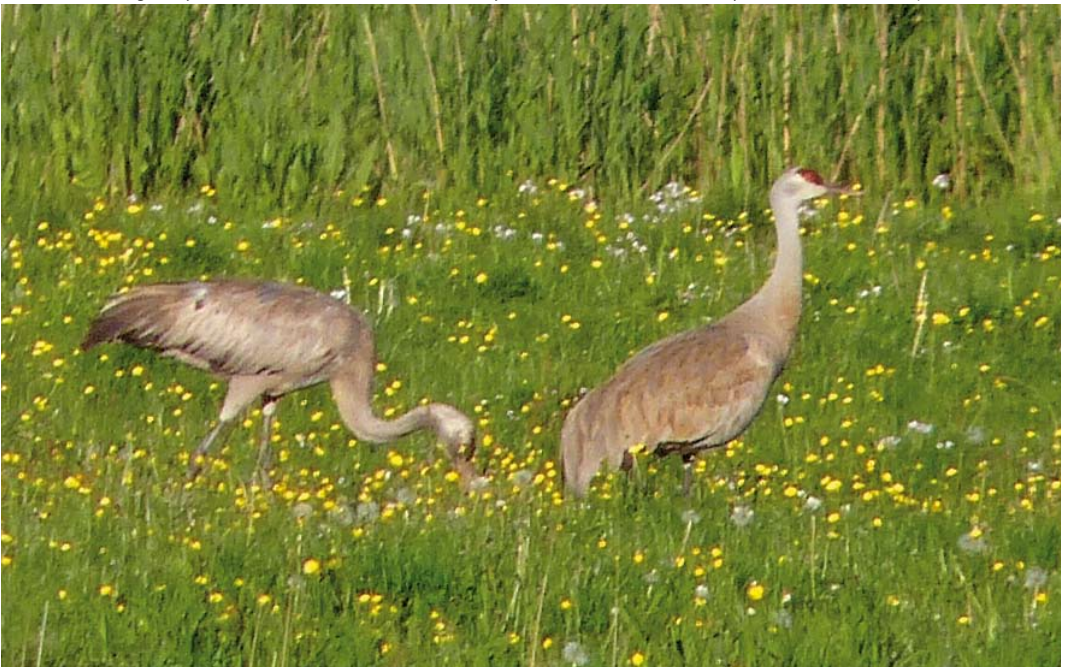
328 Sandhill Crane / Canadese Kraanvogel Grus canadensis , adult (right), with Common Crane / Kraanvogel G. grus , juvenile, Busemark Mose, Møn, Sjælland, Denmark, 27 May 2013