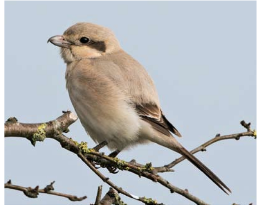
274 Steppeklapekster / Steppe Grey Shrike Lanius lahtora pallidirostris , eerstejaars, Buitendijk, Texel, Noord-Holland, 30 oktober 2012 (Co van der Wardt)

birdpix.nl, www.dutchbirding.nl, www.waarneming.nl). Succesvol bij jagen en enkele 10-tallen prooien per dag vangend (Enno Ebels pers obs).