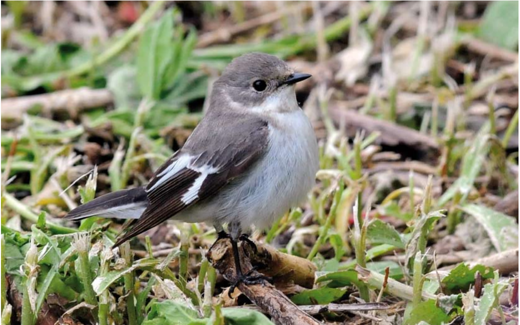
342 Collared Flycatcher / Withalsvliegenvanger Ficedula albicollis , female, Helgoland, Schleswig-Holstein, Germany, 26 May 2013 (Roef Mulder)