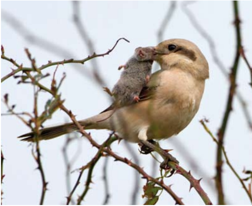
273 Steppeklapekster / Steppe Grey Shrike Lanius lahtora pallidirostris , eerstejaars, met Huisspitsmuis Crocidura russula als prooi, Buitendijk, Texel, Noord-Holland, 31 oktober 2012 (Jankees Schwiebbe)