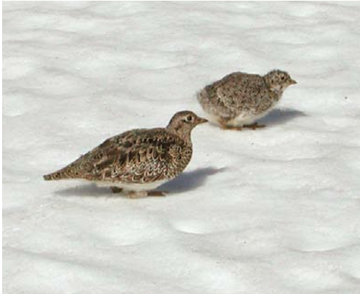
320 White-bellied Seedsnipes / Witbuikkwartelsnippen Attagis malouinus , adult with chick, Paso Garibaldi, Argentina, 31 January 2004