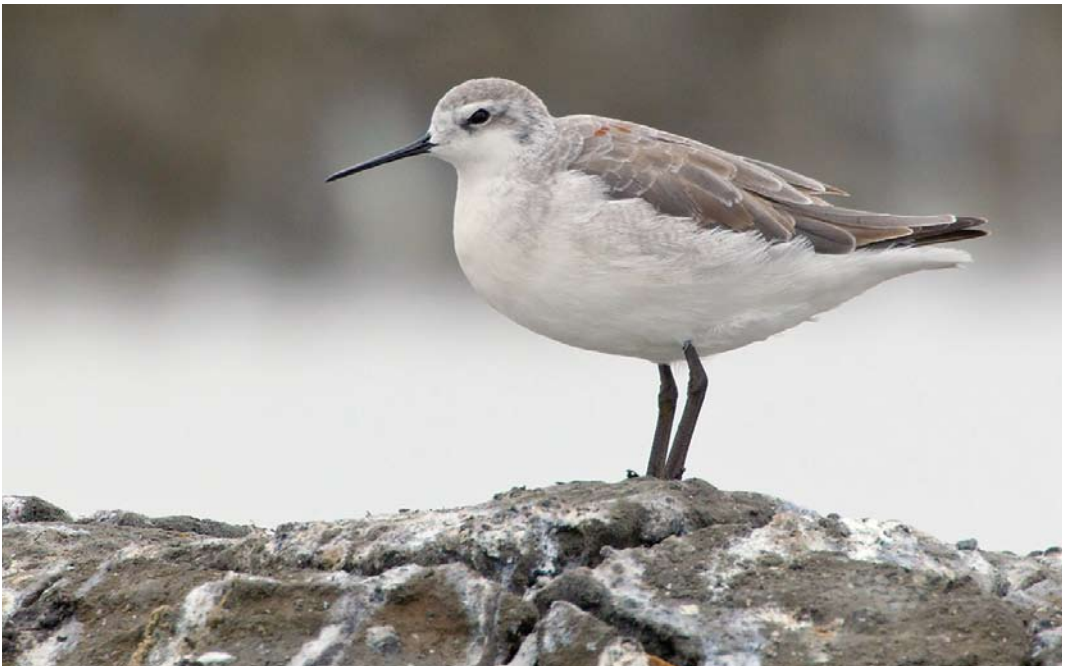
326 Wilson's Phalarope / Grote Franjepoot Phalaropus tricolor , adult, Aveiro, Portugal, 20 July 2013 (David Monticelli)