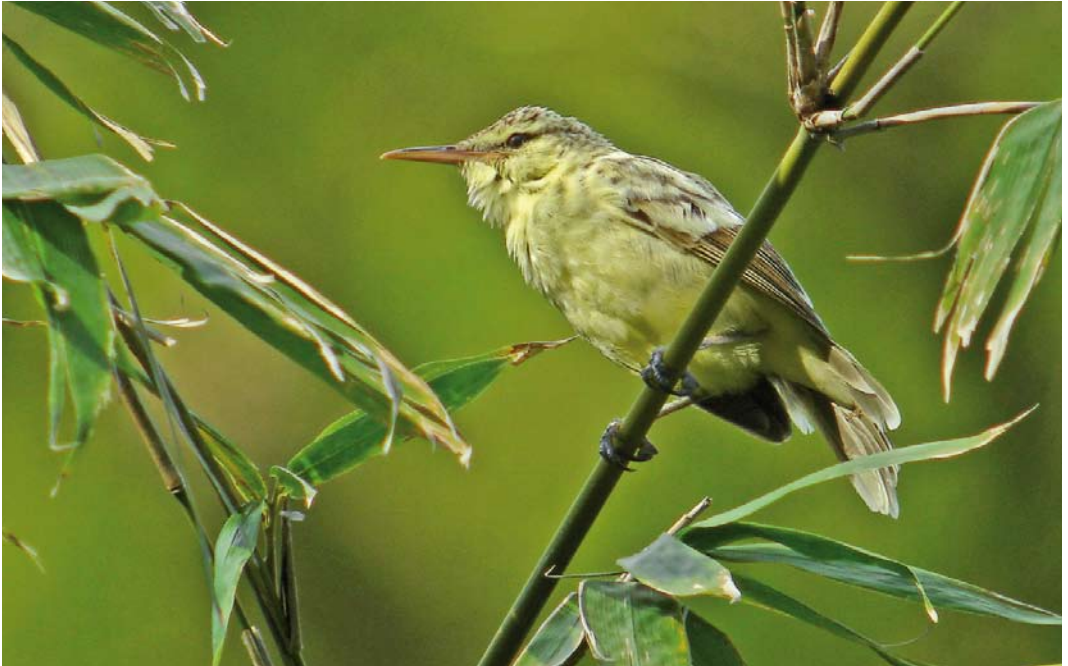
304 Tahiti Reed Warbler / Langsnavelkarekiet Acrocephalus caffer , yellow morph, Papenoo Valley, Tahiti, Society Islands, French Polynesia, 14 September 2006 ( Pete Morris ) 305 Tahiti Reed Warbler / Langsnavelkarekiet Acrocephalus caffer , brown morph, Papenoo Valley, Tahiti, Society Islands, French Polynesia, 14 September 2006 ( Pete Morris ) 306 Rimatara Reed Warbler / Rimatarakarekiet Acrocephalus rimatarae , Rimatara, Austral Islands, French Polynesia, 30 September 2010 ( Mark Van Beirs )