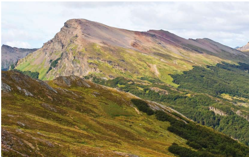
318-319 Landscape around Paso Garibaldi, Argentina, 8 March 2006