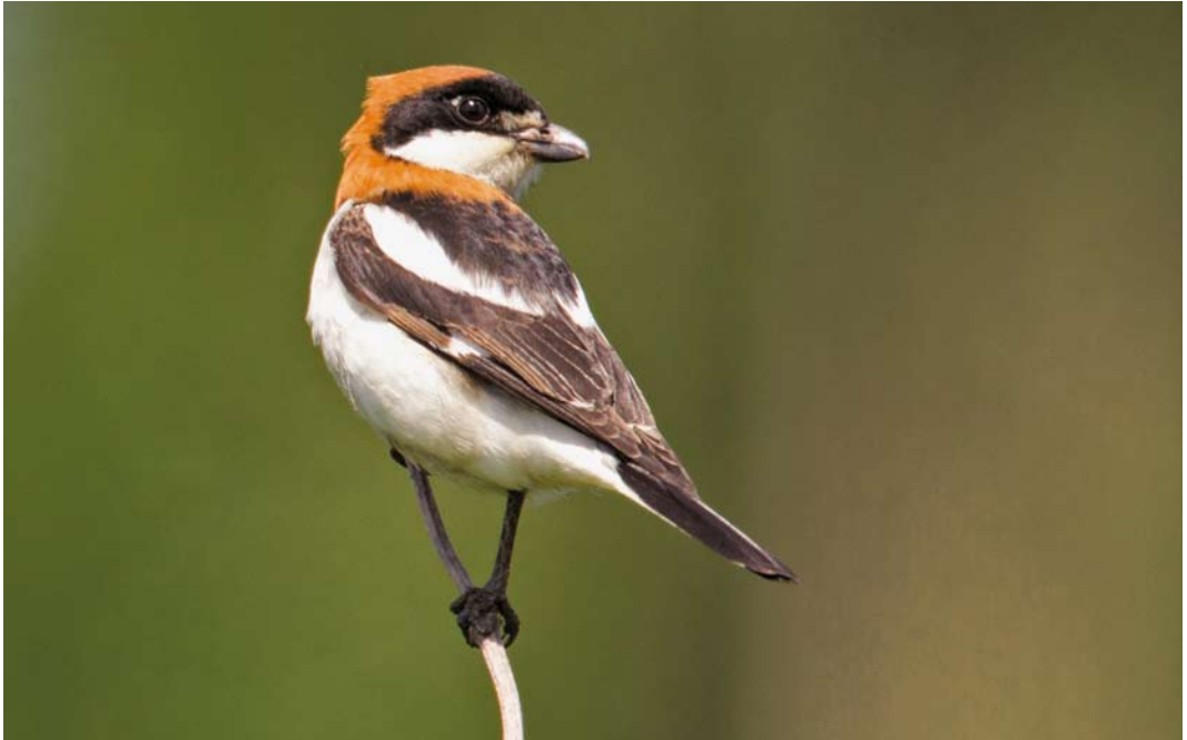
363 Roodkopklauwier / Woodchat Shrike Lanius senator , eerste-zomer mannetje, Poelgeest, Warmond, Zuid-Holland, 27 mei 2013 (René van Rossum)

Waterhoen P pusilla kon men in ieder geval terecht in Waverhoek, Utrecht (maximaal drie), en de omgeving van Peize (minimaal zeven), maar ook op enkele andere plekken werden territoria opgetekend. Voor het 13e achtereenvolgende jaar kwamen Kraanvogels Grus grus tot broeden in het Fochteloërveen, Drenthe/Friesland. Dit jaar waren er vier legfels, waarvan één in de eifase werd gepredeerd. Medio juni waren nog vier jongen in leven. Net als in 2012 werd ook succesvol gebroed op het Dwingelderveld, Drenthe. Eind juni werden hier twee jongen waargenomen. Minimaal één ontsnapte Jufferkraanvogel G virgo deed de harten van slechts weinig vogelaars sneller kloppen, al kon bij vluchtwaarnemingen – zoals op 3 mei boven Veendam, Groningen, en op 10 juni bij Raalte, Overijssel – een eventuele ring niet worden vastgesteld.