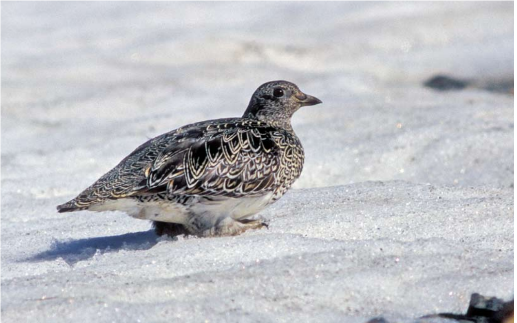
312-313 White-bellied Seedsnipe / Witbuikkwartelsnip Attagis malouinus , adult, Paso Garibaldi, Argentina, 31 January 2004 ( Jan Bisschop )