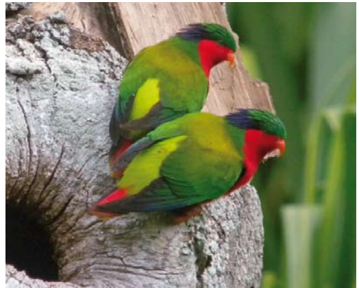
287 Tahiti Sandpiper / Tahitistrandloper Prosobonia leucoptera (collected in Tahiti, Society Islands, French Polynesia, in 1773; RMNH.AVES.87556), Naturalis Biodiversity Center, Leiden, Zuid-Holland, the Netherlands ( Naturalis Biodiversity Center ). The only remaining specimen of this species. 288 Grey-green Fruit Dove / Tahitiaanse Jufferduif Ptilinopus purpuratus purpuratus , Tahiti, Society Islands, French Polynesia, 30 August 2008 ( Tom Ghestemme ) 289 Polynesian Ground Dove / Tahitiaanse Patrijsduif Alopecoenas erythropterus , female, Tenararo, Tuamotu Islands, French Polynesia, 24 September 2010 ( Dave Williamson ) 290 Kuhl's Lorikeets / Kuhls Lori's Vini kuhlii , Rimatara, Austral Islands, French Polynesia, 30 September 2010 ( Dave Williamson )

demic, still-extant species. These include nine species of dove and pigeon (in three genera), three species of lorikeet Vini , two species of swiftlet Aerodramus , four species of kingfisher Todiramphus , five species of reed warbler Acrocephalus and four species of monarch Pomarea . Below, we will discuss these six groups. Many of these species are single-island endemics (table 1), and difficult to reach by the independent birder. We therefore especially present species that occur on islands that are easier to travel to.