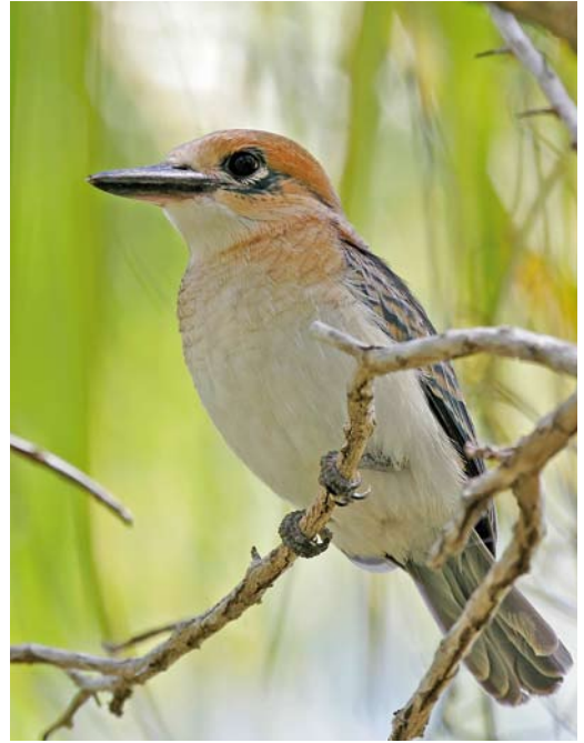
300 Chattering Kingfisher / Boraboraijsvogel Todarhamphus tutus tutus , Bora Bora, Society Islands, French Polynesia, January 2013 ( Fred Jacq ) 301 Tuamotu Kingfisher / Tuamotu-ijsvogel Todarhamphus gambieri gertrudae , juvenile, Niau, Tuamotu Islands, French Polynesia, 22 September 2006 ( Pete Morris ) 302 Tuamotu Kingfisher / Tuamotu-ijsvogel Todarhamphus gambieri gertrudae , adult, Niau, Tuamotu Islands, French Polynesia, 22 September 2006 ( Pete Morris )