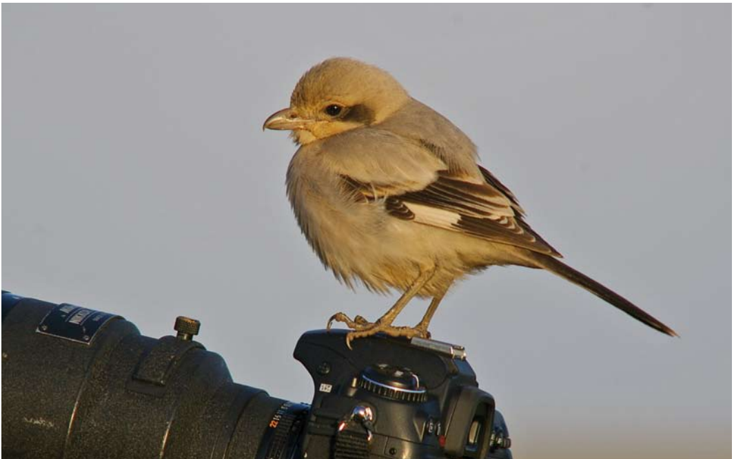
284 Steppeklapekster / Steppe Grey Shrike Lanius lahtora pallidirostris , Grainthorpe Haven, Lincolnshire, Engeland, 24 november 2008 (David Ellis)

De waarneming op Texel in oktober-november 2012 betrof het tweede geval voor Nederland. Van 4 tot 23 september 1994 verbleef een eerste-winter nabij De Cocksdorp, eveneens op Texel. Ook bij deze vogel dacht men aanvankelijk met een onvolwassen Kleine Klapekster van doen te hebben (Wassink 1997).