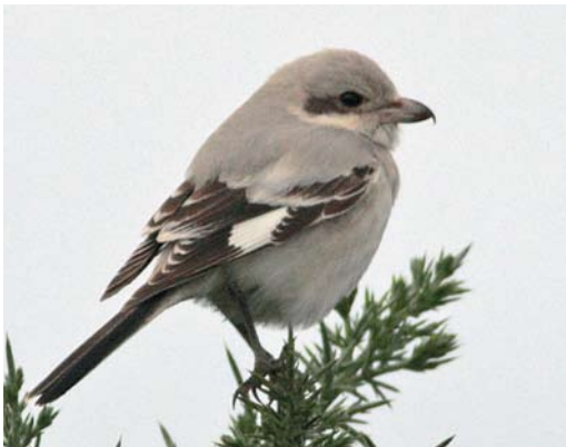
277 Steppeklapekster / Steppe Grey Shrike Lanius lahtora pallidirostris , St Martin's, Scilly, Engeland, 25 september 2009 (Martin P Goodey)