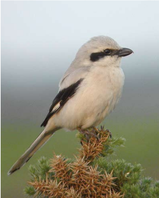
283 Steppeklapekster / Steppe Grey Shrike Lanius lahtora pallidirostris , Isle of Man, Brittannië, 17 juni 2003

juli-augustus 2011 (een exemplaar op Isle of Man, Brittannië, vanaf 17 juni 2003 bleef tot 12 juli). Bij vrijwel alle Europese gevallen betrof het eerstejaars vogels (in tegenstelling tot andere zeldzame Centraal-Aziatische klauwieren zoals Daurische Klauwier L. isabellinus en Turkestaanse Klauwier L. phoenicuroides die regelmatig in adult kleeed in West-Europa worden gezien). Er zit een stijgende lijn in het voorkomen in Europa, met zes gevallen in 1980-89, 20 in 1990-99 en 31 in 2000-09. Een belangrijke verklaring is de toegenomen veldkennis van een groeiend aantal vogelaars maar een werkelijke toename (bijvoorbeeld door een westwaartse uitbreiding van het verspreidingsgebied) is niet uitgesloten. Ook de soortstatus die pallidirostris heeft gekregen (als zelfstandige soort of ondersoort van Aziatische Klapekster) heeft ongetwijfeld bijgedragen aan een verhoogde opmerkzaamheid bij waarnemers in Europa.