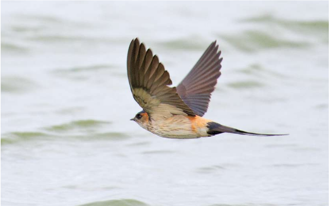
370 Vermoedelijke Amoerroodstuitzwaluw / presumed Asian Red-rumped Swallow Cecropis daurica daurica/japonica , Kennemermeer, IJmuiden, Noord-Holland, 26 mei 2013 ( Jelle van der Helm )