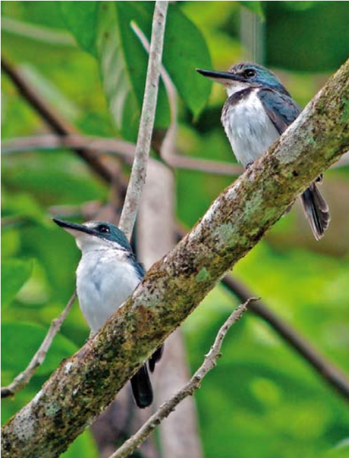
303 Tahiti Kingfishers / Tahitiijsvogels Todiramphus veneratus veneratus , male (left) and female, Tahiti, Society Islands, French Polynesia, 18 September 2006

The taxonomy of Polynesian Todiramphus kingfishers is a bit messy. We follow Dickinson & Remsen (2013) here but other arrangements are possible (eg, Fry et al 1992). In French Polynesia, five different taxa can be encountered. Two species are critically endangered and are now confined to only one island: Marquesan Kingfisher T godeffroyi on Tahuata in the Marquesas, and Tuamotu Kingfisher T gambieri on Niau in the Tuamotus. Both species have in common that they got extinct on other islands: Marquesan previously occurred on Hiva Oa and Fatu Hiva as well while the nominate subspecies of Tuamotu got extinct on Mangareva. The other three taxa can only be encountered in the Society Islands. The nominate subspecies of Chattering Kingfisher T tutus tutus occurs in forests in the Leeward Islands, like the famous island Bora Bora, sharing its distribution with the Grey-green Fruit Dove subspecies P p chrysogaster . It too can be easily seen in the forests at Fa'ahia archaeological site on Huahine, providing some fine nature in a beautiful backdrop. Chattering Kingfisher is also said to occur on the higher slopes of Tahiti (although it has never been reported from nearby Moorea) but con-