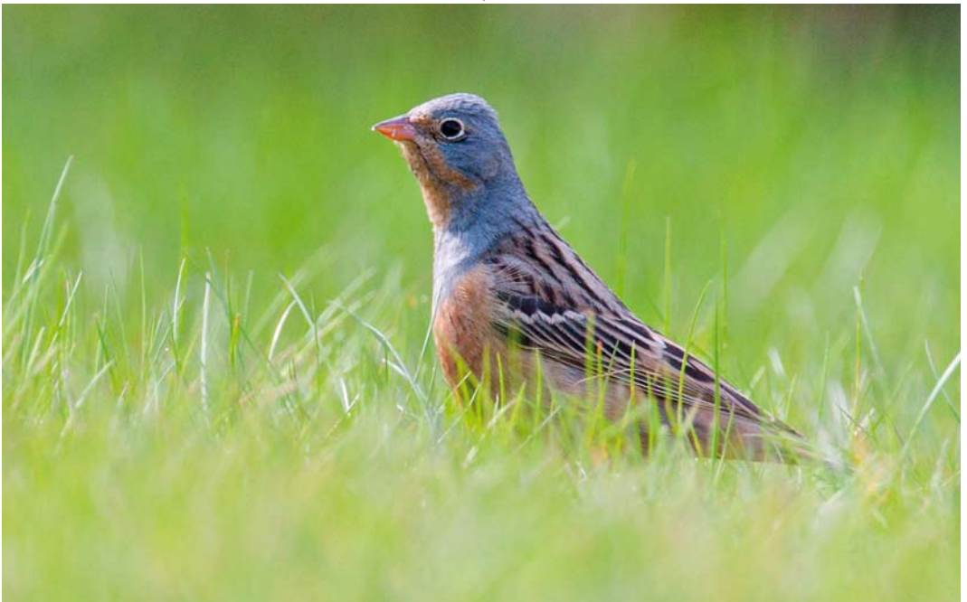
371 Bruinkeelortolaan / Cretschmar's Bunting Emberiza caesia , mannetje, Lauwersoog, Groningen, 5 mei 2013