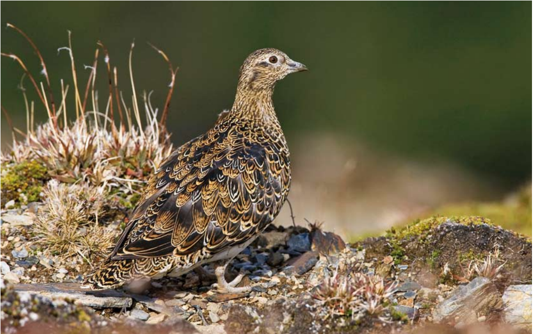
316-317 White-bellied Seedsnipe / Witbuikkwartelsnip Attagis malouinus , adult, Paso Garibaldi, Argentina, 8 March 2006