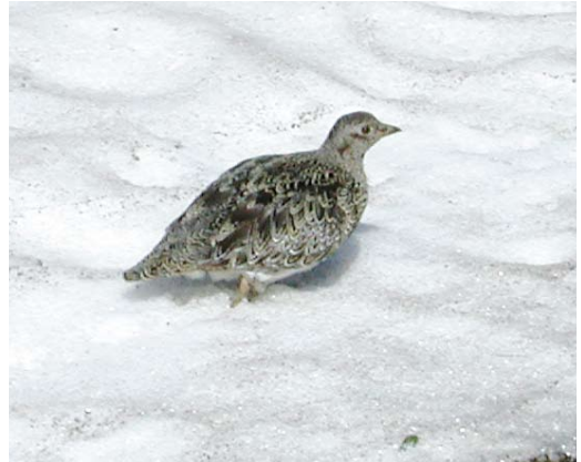
321 White-bellied Seedsnipe / Witbuikkwartelsnip Attagis malouinus , adult, Paso Garibaldi, Argentina, 31 January 2004

above the tree line. The species of the genus Attagis are much more difficult to find, because they are more secretive and more thinly distributed with mostly just a pair or a few individuals encountered. Rufous-bellied Seedsnipe A gayi usually occurs in the high alpine meadows above 4500 m up to as far as to the snow line (5500 m), where only few roads go. The best places to see this species are, eg, Papallacta pass in Ecuador and the high-altitude pass near Chivay in Peru. The fourth member, White-bellied Seedsnipe A malouinus prefers the same habitat but only occurs in extreme southern Patagonia (Argentina and Chile), an area with even fewer roads reaching into their preferred habitat and lower numbers of birders present or visiting. Within its relatively small range, it is very hard to encounter during the breeding season, making it a main target for avid birders visiting the region in that period. It may, in fact, be easier to find in the cold winter season because it then gathers in flocks at lower altitudes (down to sea level) after heavy snowfall (Fjeldså & Krabbe 1990, Jaramillo et al 2003). It exceptionally even leaves the mainland as it has been recorded in the Falkland Islands in 1783 and 1859 (Hayman et al 1986). The species is not threatened and its population appears to be stable; for this and other reasons, it is classified by BirdLife International (2013) as 'Least Concern'.