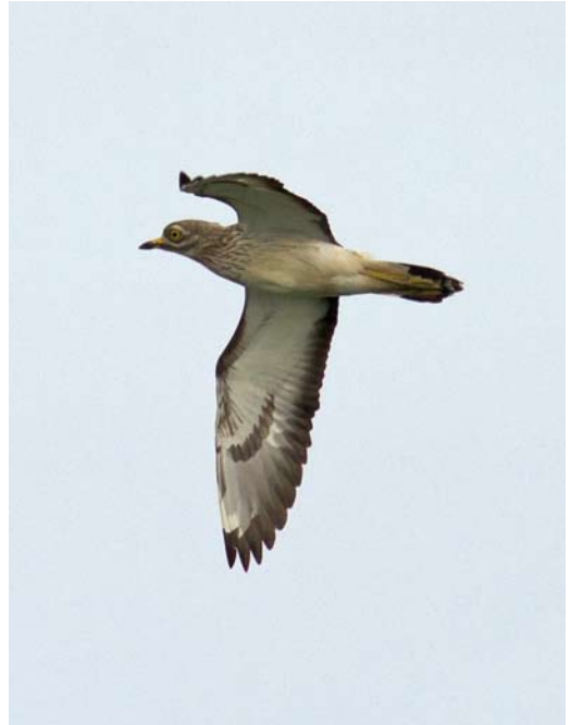
349 Dougalls Stern / Roseate Tern Sterna dougallii , adult-zomer, De Putten, Camperduin, Noord-Holland, 25 juni 2013 ( Maurits Martens ) 350 Griel / Eurasian Stone-curlew Burhinus oedicanus , Burghsluis, Zeeland, 14 mei 2013 ( Marcel Klootwijk ) 351 Terekruijer / Terek Sandpiper Xenus cinereus , met Tureluur / Common Redshank Tringa totanus , Spaarndam, Noord-Holland, 28 mei 2013 ( Johnny van der Zwaag )