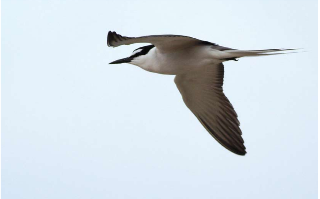
325 Bridled Tern / Brilstern Onychoprion anaethetus , adult, Farne Islands, Northumberland, England, 2 July 2013 (Josh Jones)