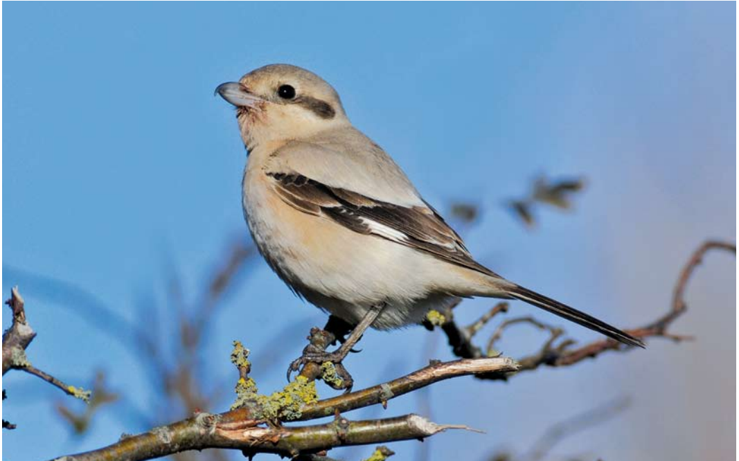
276 Steppeklapekster / Steppe Grey Shrike Lanius lahtora pallidirostris , eerstejaars, Buitendijk, Texel, Noord-Holland, 5 november 2012 (René Pop)

basis van: 1 te lange handpenprojectie (duidelijk korter bij Klapekster); 2 overwegend lichte snavel (overwegend donker bij Klapekster maar variabel); 3 lichte teugel (donker bij Klapekster); 4 bruin waas op vleugels, stuit en staart; en 5 lichtgrijze bovendelen met sterke zandkleur en weinig contrast tussen bovendelen en vuilwitte tot roomkleurige onderdelen.