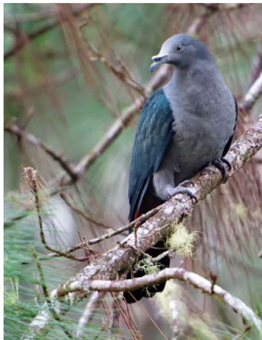
291 White-capped Fruit Dove / Witkapjufferduif Ptilinopus dupetithouarsii dupetithouarsii , Fatu Hiva, Marquesas Islands, French Polynesia, 20 July 2010 292 Marquesan Imperial Pigeon / Markiezenmuskaatduif Ducula galeata , Nuku Hiva, Marquesas Islands, French Polynesia, 15 April 2013 293 Atoll Fruit Dove / Atoljufferduif Ptilinopus coralensis , Tenararo, Tuamotu Islands, French Polynesia, 24 September 2010