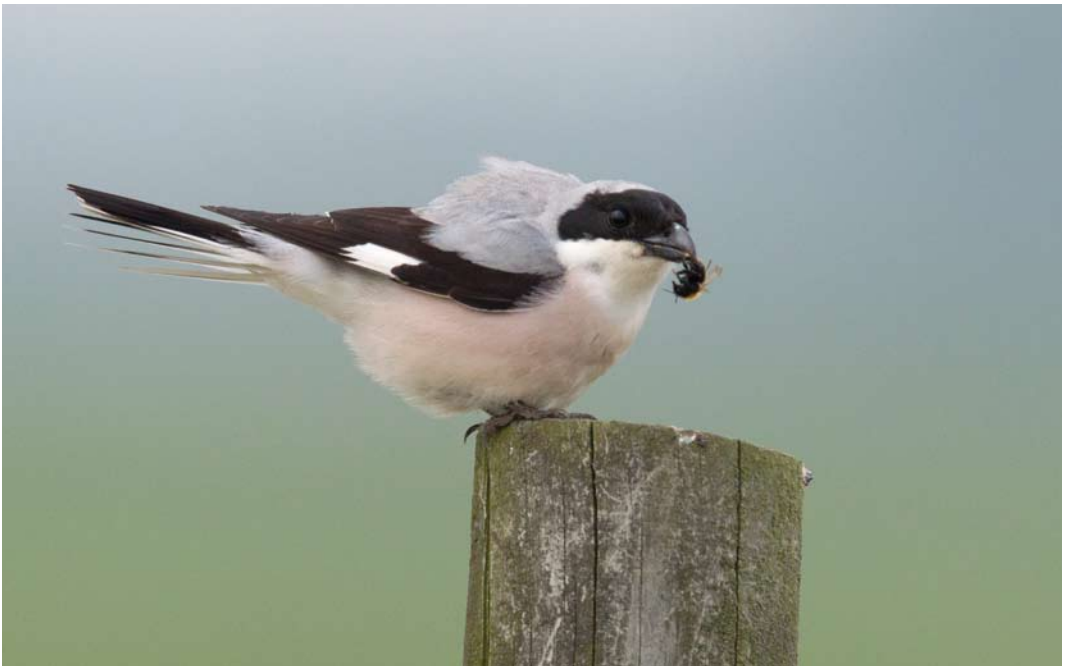
365 Kleine Klapekster / Lesser Grey Shrike Lanius minor , Voorhout, Zuid-Holland, 30 mei 2013 (René van Rossum)