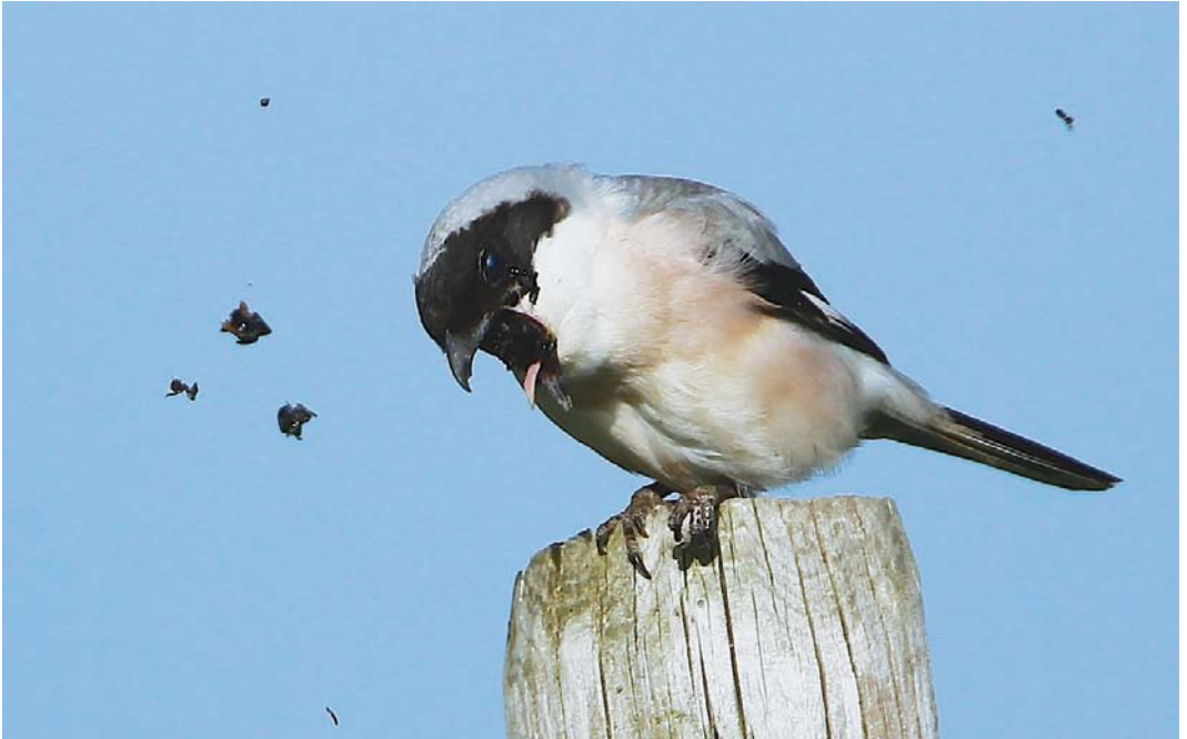
364 Kleine Klapekster / Lesser Grey Shrike Lanius minor , Voorhout, Zuid-Holland, 2 juni 2013