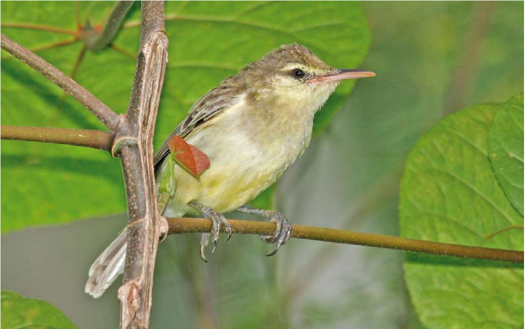
307 Northern Marquesan Reed Warbler / Noordelijke Markiezenkarekiet Acrocephalus percernis idae , Botanique Communal de Vaipae, Ua Huka, Marquesas Islands, French Polynesia, 16 September 2006

for the havoc that rats can wreck on island bird species (Thibault & Meyer 2001). Historically, as many as eight species were known from French Polynesia (Cibois et al 2004) but today only four remain, all single-island endemics. Two of them are hanging by a thread, Tahiti Monarch on Tahiti and Fatuhiva Monarch P. whitneyi on Fatu Hiva respectively, while Mohotani Monarch P. (mendozae) motanensis cannot be visited by the independent traveller as it occurs on uninhabited Mohotani in the Marquesas. The fourth species, Iphis Monarch P. iphis has some sort of thriving population on one Marquesan island only, namely Ua Huka, only because this island is free of Black Rats (see above under Ultramarine Lorikeet).