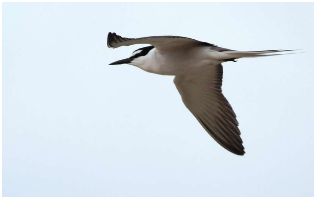
325 Bridled Tern / Brilstern Onychoprion anaethetus , adult, Farne Islands, Northumberland, England, 2 July 2013