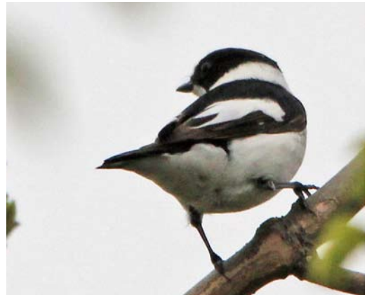
359 Grauwe Fitis / Greenish Warbler Phylloscopus trochiloides , Romeinenweerd, Venlo, Limburg, 7 juni 2013 360 Roodstuitzwaluw / Red-rumped Swallow Cecropis daurica , Berkheide, Zuid-Holland, 3 mei 2013 361 Sperwergrasmus / Barred Warbler Sylvia nisoria , tweede-kalenderjaar, Eastermar, Friesland, 19 juni 2013 362 Withalsvliegenvanger / Collared Flycatcher Ficedula albicollis , eerste-zomer mannetje, Eemshaven, Groningen, 7 mei 2013

plaren in juni. In Noord-Holland werden Zwarte Ibissen Plegadis falcinellus gezien vanuit een taxiënd vliegtuig op Schiphol op 20 juni en vanuit een bus in de Beemster op 27 juni. Een Kuifduiker Podiceps auritus in zomerkleed liet zich van 22 juni tot in juli bewonderen bij Reusel, Noord-Brabant.