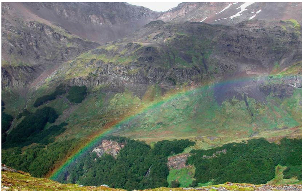
311 Landscape around Paso Garibaldi, Argentina, 31 January 2004 (Jan Bisschop)

Least Seedsnipe T. rumicivorus is perhaps the easiest seedsnipe to find, as it is the only species to be found at sea level, eg, in Peru and Argentina. In the south, it is an austral migrant (van Kleunen et al 2005). The similar Grey-breasted Seedsnipe T. orbignyianus is almost equally easy to connect with because it is common in suitable habitat in most of its range, although you mostly need to be