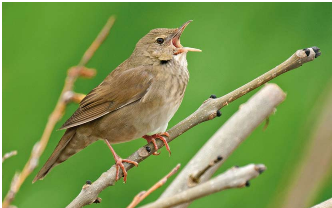
366 Krekelzanger / River Warbler Locustella fluviatilis , Leeuwarden, Friesland, 26 mei 2013