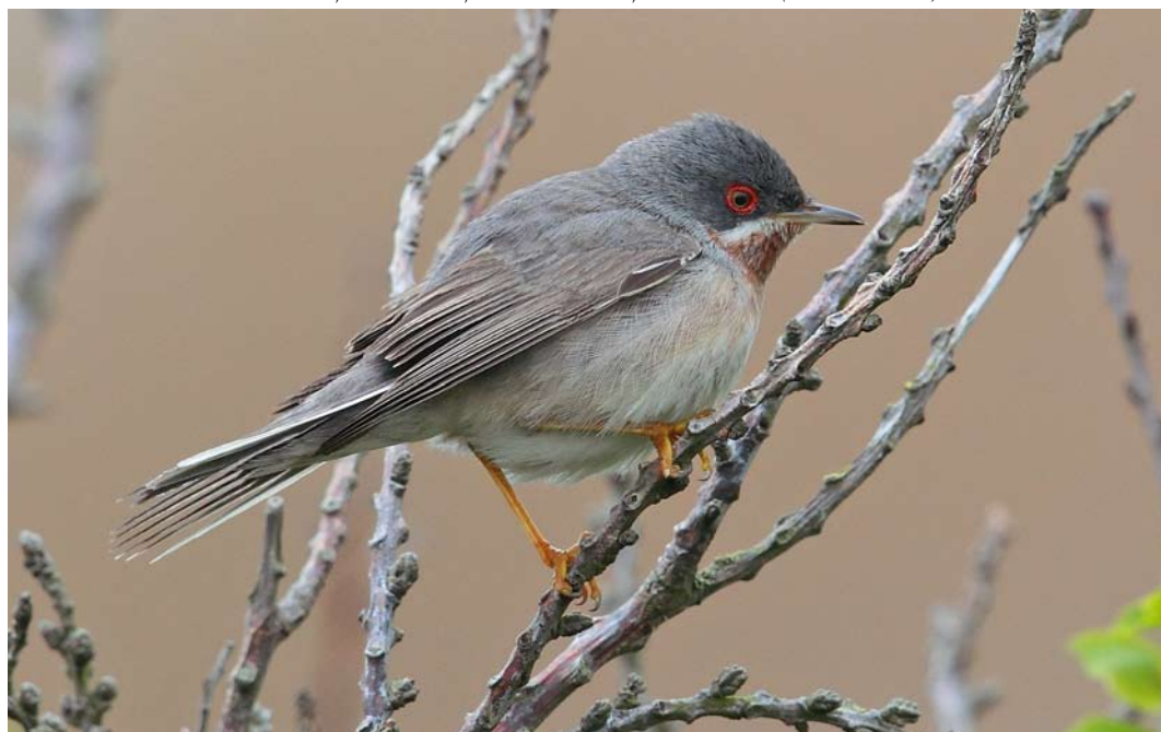
367 Balkanbaardgrasmus / Eastern Subalpine Warbler Sylvia cantillans albistriata , eerste-zomer mannetje, Mariëndal, Den Helder, Noord-Holland, 17 mei 2013 (Eric Menkveld)