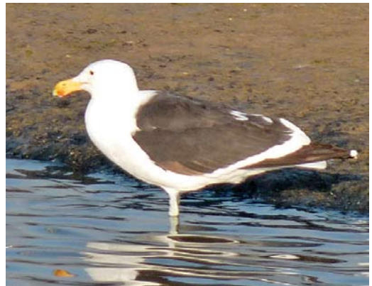
330-331 Ascension Frigatebird / Ascensionfregatvogel Fregata aquila , juvenile, Bowmore, Islay, Argyll, Scotland, 5 July 2013 332 African Openbills / Afrikaanse Gapers Anastomus lamelligerus , Kom Ombo, Egypt, 31 May 2013 333 Pacific Golden Plover / Aziatische Goudplevier Pluvialis fulva , adult male, Łaszka, Pomerania, Poland, 16 July 2013 334 Roseate Tern / Dougalls Stern Sterna dougallii , adult, Mietków reservoir, Silesia, Poland, 13 July 2013 335 Cape Gull / Afrikaanse Kelpmeeuw Larus dominicanus vetula , subadult, Peniche, Portugal, 22 May 2013