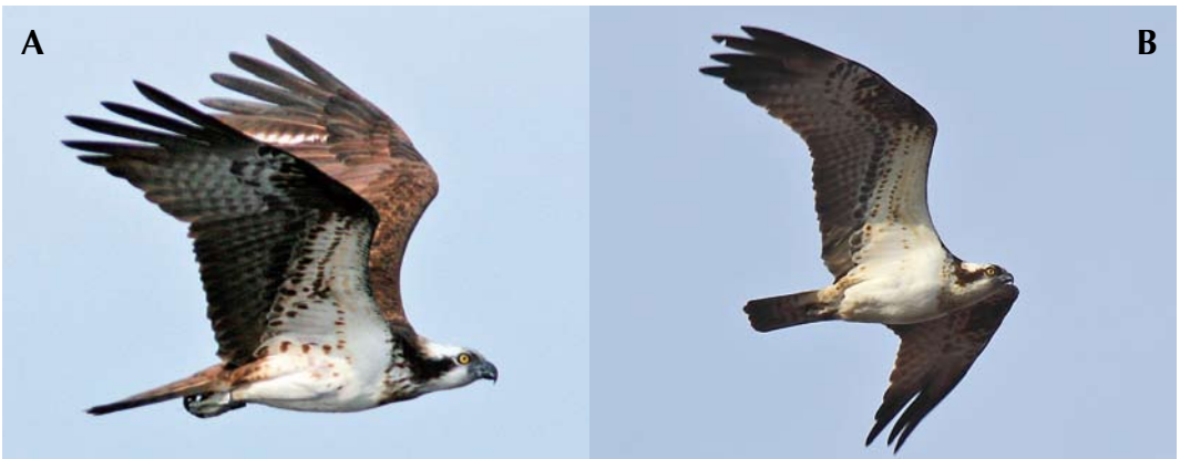
FIGURE 5 Ospreys / Visarenden Pandion haliaetus haliaetus . A adult female, Ivösjön, Sweden, 6 July 2008; B adult male, Armsjön, Sweden, 25 April 2012. Comparison of underwing patterns in well-pigmented individuals.

ing the breeding period – males forage while females care for the young), 12% of the males showed a pale, sparsely streaked to sometimes nearly invisible breast-band (with a faint pale brown wash). Hence, a minority of haliaetus males shows incomplete markings or faint coloration on the breast but I have not found one single male, either in the field or in photo galleries, that lacks