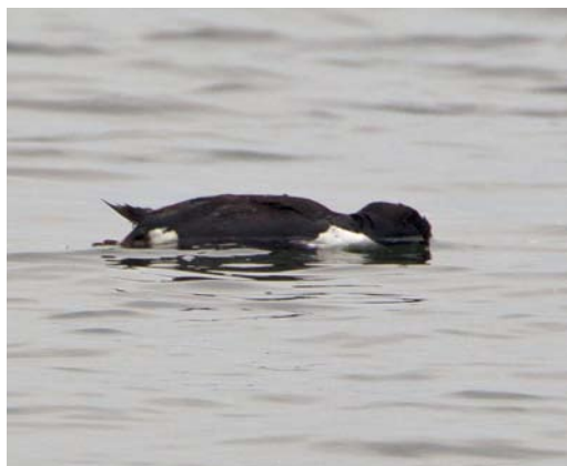
127 Kortbekzeekoet / Thick-billed Murre Uria lomvia lomvia , stervend of dood, Huisduinen, Den Helder, Noord-Holland, 13 augustus 2012 (Hans Brinks)

Wij danken Mark Adams en Hein van Grouw (beiden Natural History Museum, Tring, Engeland),