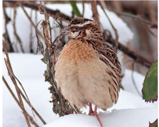
174 Kwartel / Common Quail Coturnix coturnix , mannetje, Zoutelande, Zeeland, 22 januari 2013 (Thomas Luiten)

Camperduin en op 2 februari langs Vlieland, Friesland (twee); met name in februari is deze soort uitermate zeldzaam. Een dode Koereiger Bubulcus ibis werd op 1 januari opgeraapt van het strand bij Den Hoorn op Texel, Noord-Holland. Een levende werd op 27 januari gemeld bij Maasbree, Limburg. De Zwarte Ibis Plegadis falcinellus van Schiermonnikoog, Friesland, werd daar op 1 januari nog – of weer – waargenomen. Trektellers registreerden in totaal vijf Rode Vrouwen Milvus milvus , acht Zeearenden Haliaeetus albicilla , 53 Blauwe Kiekendieven Circus cyaneus (met name tijdens de sneeuwperiodes), twee Ruigpootbuiszeters Buteo lagopus , zes Smellekens Falco columbarius en 34 Slechtvalken F peregrinus . Een mogelijke Giervalk F rusticolus hield tussen 20 januari en 6 februari de gemoederen bezig rondom Den Oever, Noord-Holland. Trektellers meldden op vier plekken in totaal 11 Kraanvogels Grus grus . Op vier plaatsen langs de kust werden solitaire Rosse Franjepoten Phalaropus fulicarius waargenomen.