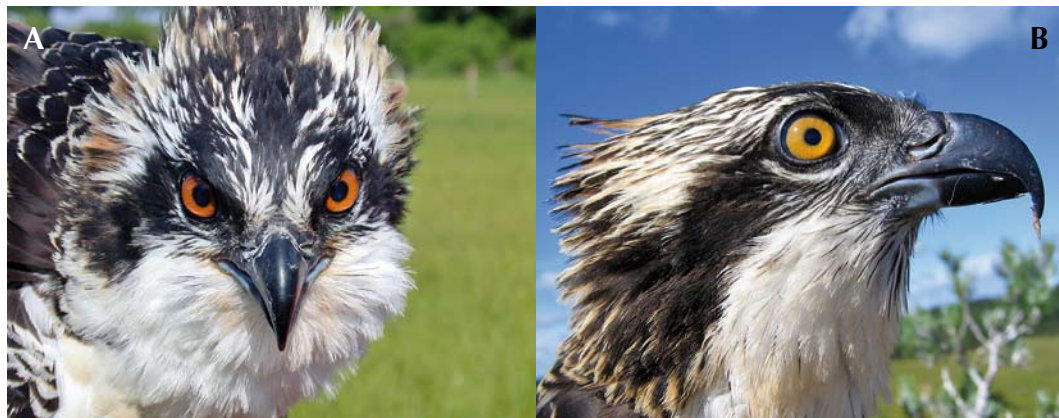
FIGURE 12 Ospreys / Visarenden Pandion haliaetus . A P h carolinensis , juvenile, Tashmoo, New England, USA, 2 August 2008 (Rob Bierregaard); B P h haliaetus , Grimsö area, Sweden, 19 July 2007 (Raymond Klaassen). Note in carolinensis reddish iris, blackish plumage, darker upper gape, black eyeliner, and lack of gorget streaks, and in haliaetus yellow-orange iris, brownish plumage, equally bluish upper and lower gape, blue-grey eyeliner and black gorget streaks.

mottled brown and pale brown on upperwing-coverts. Carolinensis : blackish-brown, males often blacker on upperwing-coverts.