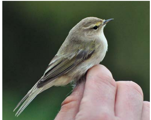
529 Siberian Chiffchaff / Siberische Tjiftjaf Phylloscopus collybita tristis , Wassenaar, Zuid-Holland, 31 October 2009 (Vincent van der Spek/Vrs Meijndel). The bird (same as in plate 528), the very first in the project, was identified as abietinus/tristis by the ringers. Although not prominent, note green feathers on mantle. 530 Siberian Chiffchaff / Siberische Tjiftjaf Phylloscopus collybita tristis , Castricum, Noord-Holland, 28 October 2011 (Luc Knijnsberg). Identified as abietinus by the ringers. Note amount of green on upperparts. 531 Siberian Chiffchaff / Siberische Tjiftjaf Phylloscopus collybita tristis , Castricum, Noord-Holland, 8 October 2010 (Luc Knijnsberg). Identified as abietinus by the ringers. 532 Siberian Chiffchaff / Siberische Tjiftjaf Phylloscopus collybita tristis , Wassenaar, Zuid-Holland, 7 November 2010 (Vincent van der Spek/Vrs Meijndel). The bird had many green feathers on upperparts and yellow feathers on head and, most strikingly, supercilium. Identified as abietinus by the ringers.

other birds representing the three subspecies. This resulted in three very distinct groups of sequences, corresponding to the subspecies collybita , abietinus and tristis (figure 1). The majority of the sequences (n=30) grouped with the tristis sequence types. The remaining sequences (n=11) grouped with the single collybita sequence. So, none of the sampled 41 birds showed a sequence typical of abietinus . In terms of sequence variation, each of the three chiffchaff taxa analysed here showed distinct sequence types. This confirms the previous results from Helbig et al (1996) and Bensch et