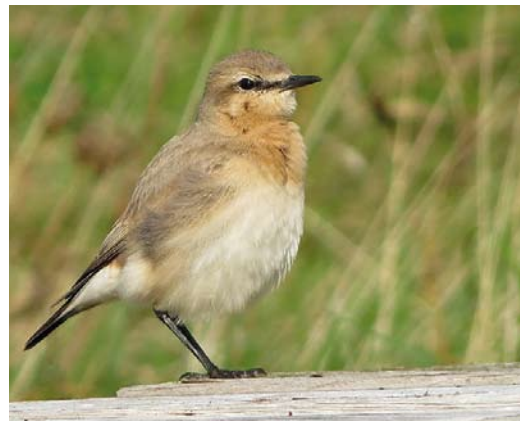
559 White-throated Needletail / Stekelstaartgierzwaluw Hirundapus caudacutus , Rømø, Tønder, Denmark, 21 October 2012 ( Ole Zoltan Göller ) 560 Bobolink / Bobolink Dolichonyx oryzivorus , first-year, Shetland, Scotland, 28 October 2012 ( Hugh Harrop ) 561 Rufous Turtle Dove / Meenatortel Streptopelia orientalis meena , first-year, Wabern, Hessen, Germany, 30 October 2012 ( Tobias Epple ) 562 Isabelline Wheatear / Izabeltapuit Oenanthe isabellina , Spiekeroog, Niedersachsen, Germany, 19 October 2012 ( Tobias Epple )

THRUSHES White's Thrushes Zoothera aurea were found at Cot Valley, Cornwall, England, on 8 October; on Ouessant (two or three) on 11-20 October; at Brevig, Barra, Outer Hebrides, on 13 October (trapped); and at Mølen, Vestfold, on 20 October. Also on Barra, a Swainson's Thrush Catharus ustulatus from 2 October was trapped on 4 October; the first for Denmark was trapped on Christiansø, Bornholm, on 21 October and seen on 24-30 October. A Grey-cheeked Thrush C. minimus stayed on St Agnes, Scilly, on 6-8 October. Eyebrowed Thrushes Turdus obscurus turned up on Foula, Shetland, on 13 October and at Pori, Finland, on 15 October. The second Naumann's Thrush T. naumanni for Ukraine was a first-winter trapped at Lviv on 6 October; the first for Estonia stayed at Kihnu Pärnumaa from 17 November. Black-throated Thrushes T. atrogularis were seen, eg, on Fair Isle on 6 October; on Helgoland on 10-16 October; at Hanko, Finland, on 27 October; at