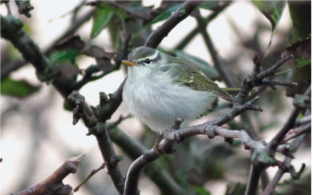
563 Eastern Crowned Warbler / Kroonboszanger Phylloscopus coronatus , Helgoland, Schleswig-Holstein, Germany, 16 October 2012