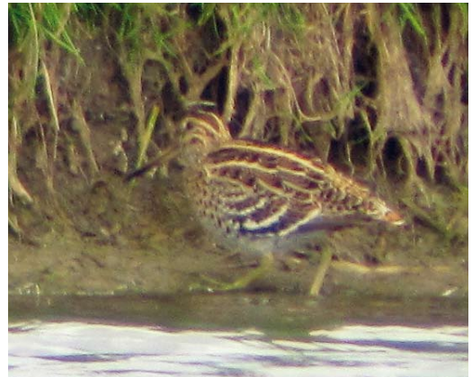
494 Caspian Plover / Kaspische Plevier Charadrius asiaticus , adult male, De Nederlanden, Texel, Noord-Holland, 27 April 2011 495 Sociable Lapwing / Steppiekievit Vanellus gregarius , Ezumakeeg, Friesland, 27 March 2011 496 Pacific Golden Plover / Aziatische Goudplevier Pluvialis fulva , Wissenkerke, Zeeland, 9 July 2011 497 Great Snipe / Poelsnip Gallinago media , adult, Polder Sandelingen, Hendrik-Ido-Ambacht, Zuid-Holland, 18 May 2011

ones in 2011 were the first since 2007. With six records in one year, 2011 was a record year, surpassing 1992 (five).