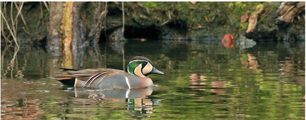
484 Baikal Teal / Siberische Taling Anas formosa , adult male, Gravenbos, Almelo, Overijssel, 14 March 2010 (Jaco Walhout)

2010 29 January to 24 February and 14 March to 23 April, Gravenbos, Almelo, Overijssel, adult male, photographed (G Mensink, M Zekhuis et al; Dutch Birding 32: 180, plate 143, 2010).