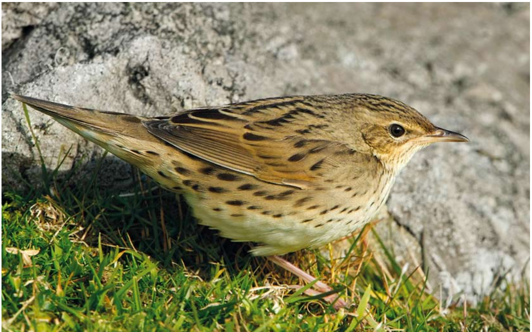
567 Lanceolated Warbler / Kleine Sprinkhaanzanger Locustella lanceolata , Fair Isle, Shetland, Scotland, 2 October 2012

ACCENTORS TO WAGTAILS A Black-throated Accentor Prunella atrogularis trapped at Jurmo, Korppoo, on 4-8 November was the ninth for Finland. A male Spanish Sparrow Passer hispaniolensis was found in a garden at Newchurch, Isle of Wight, on 4 November. A Blyth's Pipit Anthus godlewskii at Korsnäs on 4 November was this autumn's first for Finland. The second and third for Denmark were present at Grenen, Skagen, from 24 November onwards. One of the largest influxes ever of Olive-backed Pipit A hodgsoni in western Europe became apparent in October. For instance, a total of up to 33 was recorded in the Netherlands alone, with groups of up to four at two sites; also c 33 were found in Norway, with a flock of four on Røstlandet on 28 September; and five were seen on Helgoland in October. The second (or third or fourth) for Belgium turned up at De Maten, Limburg, on 21 October and (only) the sixth for Denmark was found at Mandø on 11 October.