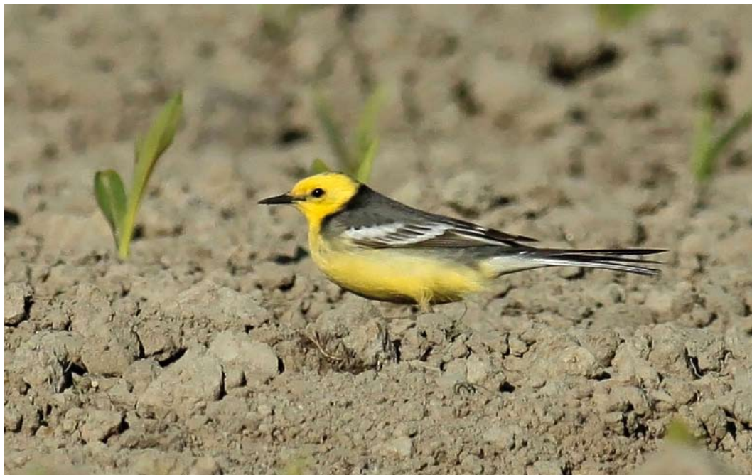
516 Citrine Wagtail / Citroenkwikstaart Motacilla citreola , second calendar-year male, Dijkgatsweide, Wieringermeer, Noord-Holland, 2 May 2011