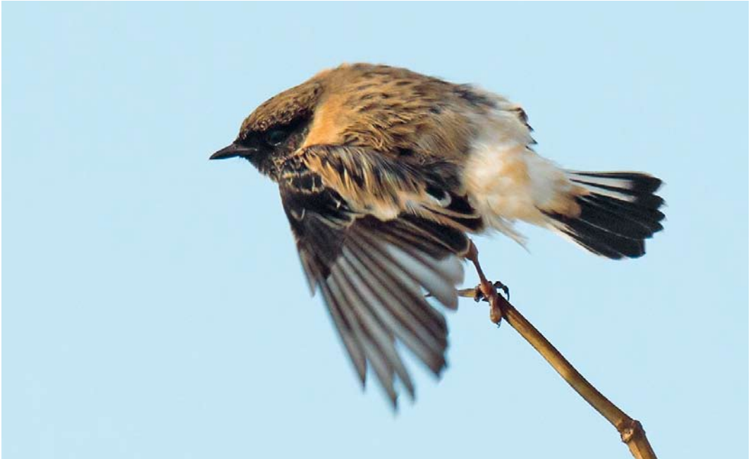
525 Kaspische Roodborstapuit / Caspian Stonechat Saxicola maurus variegatus , adult mannetje, Vlieland, Friesland, 6 oktober 2012 ( Arnaud B van den Berg )