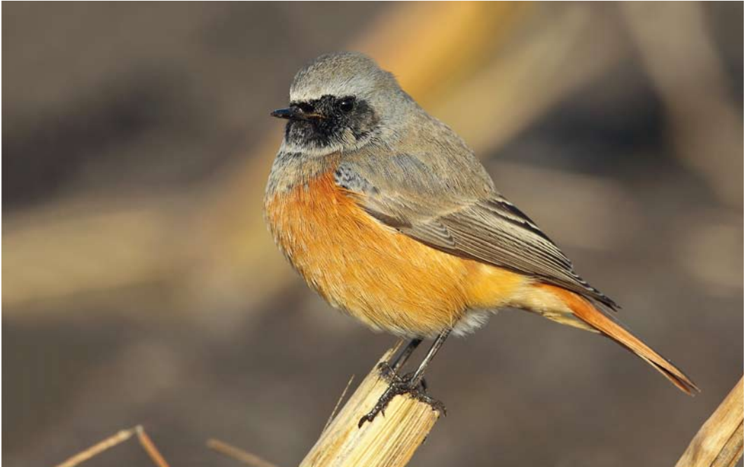
605 Oosterse Zwarte Roodstaart / Eastern Black Redstart Phoenicurus ochruros phoenicuroides , eerstejaars mannetje, Rolde, Drenthe, 12 november 2012