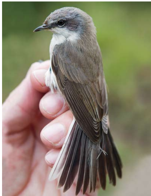
597 Bruine Boszanger / Dusky Warbler Phylloscopus fuscatus , Noordhollands Duinreservaat, Castricum, Noord-Holland, 27 oktober 2012 ( Leo Heemskerk ) 598 Siberische Braamsluiper / Blyth's Lesser Whitethroat Sylvia curruca blythi , eerstejaars, Kennemerduinen, Bloemendaal, Noord-Holland, 20 oktober 2012 ( Arnoud B van den Berg/Vrs van Lennep ) 599 Kleine Vliegenvanger / Red-breasted Flycatcher Ficedula parva , eerstejaars, De Cocksdorp, Texel, Noord-Holland, 7 oktober 2012 ( Jos van den Berg )