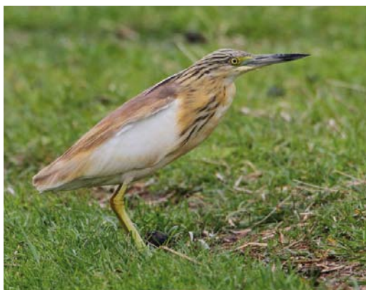
485 Pallid Harrier / Steppekiekendief Circus macrourus , juvenile male, Zwanenwater, Noord-Holland, 27 September 2011 486 Pallid Harrier / Steppekiekendief Circus macrourus , juvenile, Rosmalen, Noord-Brabant, 6 September 2011 487 Gyrfalcon / Giervalk Falco rusticolus , juvenile, Katwijk aan Zee, Zuid-Holland, 14 October 2011 488 Eleonora's Falcon / Eleonora's Valk Falco eleonora , second calendar-year, Oostvaardersplassen, Lelystad, Flevoland, 17 September 2011 489 Ring-necked Duck / Ring-snaveleend Aythya collaris , adult male, Krammersluizen, Philipsdam, Zeeland, 17 April 2011 490 Squacco Heron / Ralreiger Ardeola ralloides , De Driehoek, Texel, Noord-Holland, 29 May 2011