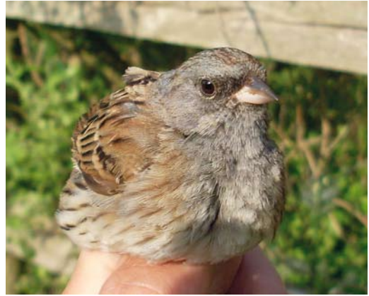
520 Black-faced Bunting / Maskergors Emberiza spodocephala , adult male, Zwanenwater, Noord-Holland, 7 May 2011

F J Koning; van Ee & Spannenburg 2011; Birding World 24: 192, 2011, Dutch Birding 33: 221, plate 270, 280, plate 362, 2011).