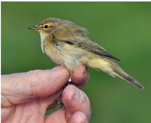
535 Common Chiffchaff / Tjiftjaf Phylloscopus collybita collybita , Wassenaar, Zuid-Holland, 8 October 2010 (Vincent van der Spek/Vrs Meijndel). Identified as collybita/abietinus by the ringers; abietinus was suggested based on its wing length of 67 mm.

in the past many trapped tristis were erroneously identified as abietinus . Clearly, if any morphological criteria were used in the past, they should be considered inconclusive or even erroneous.