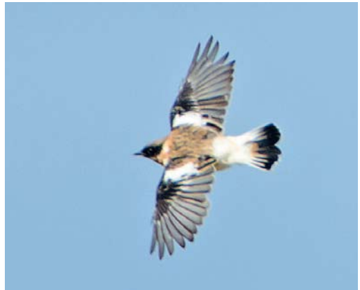
521 Kaspische Roodborsttapuit / Caspian Stonechat Saxicola maurus variegatus , adult mannetje, Vlieland, Friesland, 6 oktober 2012 ( Cock Reijnders ) 522 Kaspische Roodborsttapuit / Caspian Stonechat Saxicola maurus variegatus , adult mannetje, Vlieland, Friesland, 6 oktober 2012 ( Laurens B Steijn ). Let op grote hoeveelheid wit op binnenvlag van t3-6 / note large white area on inner web of t3-6. 523 Kaspische Roodborsttapuit / Caspian Stonechat Saxicola maurus variegatus , adult mannetje, Vlieland, Friesland, 6 oktober 2012 ( Arnoud B van den Berg ). Let op roze poten en wratten op tenen / note pink coloured legs and wart-like growths on toes. 524 Kaspische Roodborsttapuit / Caspian Stonechat Saxicola maurus variegatus , adult mannetje, Vlieland, Friesland, 6 oktober 2012 ( Han Zevenhuizen ). Let op grote witte veld op binnenste dekveren en rui van buitenste armpennen / note large white panel on inner coverts and moult of outer secondaries.

catief voor groeiende veren; binnenste twee armpennen ontbrekend.