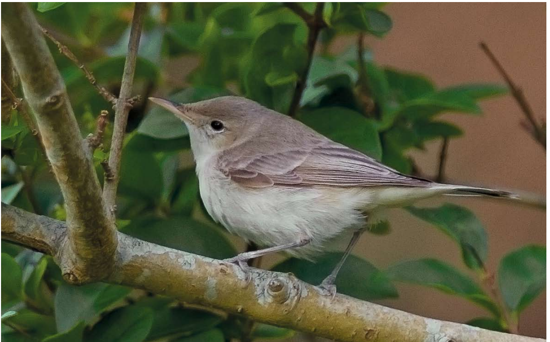
566 Eastern Olivaceous Warbler / Oostelijke Vale Spotvogel Iduna pallida , first-year, Utsira, Rogaland, Norway, 1 October 2012