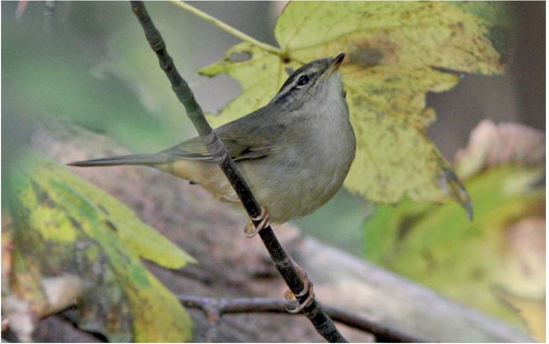
513 Radde's Warbler / Raddes Boszanger Phyllsocolopus schwarzi , Nieuwe Kooi, Vlieland, Friesland, 22 October 2011 514 Red-flanked Bluetail / Blauwstaart Tarsiger cyanurus , adult female, Noordhollands Duinreservaat, Castricum, Noord-Holland, 15 October 2011 515 Siberian Stonechat / Aziatische Roodborsttapuit Saxicola maurus , De Cocksdorp, Texel, Noord-Holland, 26 October 2011