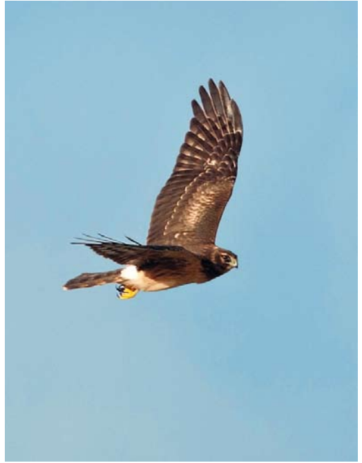
539 Black Skimmer / Amerikaanse Schaarbek Rynchops niger , adult, Rietvlei, Cape Town, South Africa, 5 October 2012 ( Callan Cohen ) 540 Northern Harrier / Amerikaanse Blauwe Kiekendief Circus hudsonius , juvenile female, Tacumshin, Wexford, Ireland, 31 October 2012 ( Killian Mullarney ) 541 Little Bustard / Kleine Trap Tetrax tetrax , Wedeler Marsch, Schleswig-Holstein, Germany, 1 October 2012 ( Eckhard Möller )