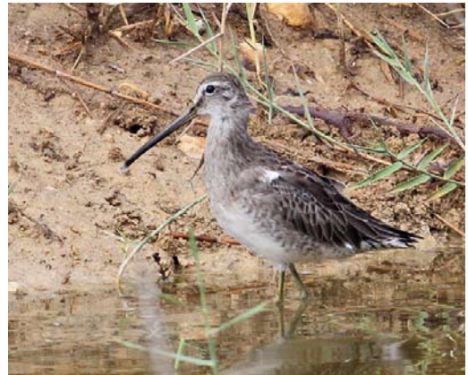
542 Greater Sand Plover / Woestijnplevier Charadrius leschenaultii , first-winter, Dunkerque, Nord, France, October 2012 ( Edouard Dansette ) 543 Solitary Sandpiper / Amerikaanse Bosruiter Tringa solitaria , juvenile, Bryher, Scilly, England, 13 October 2012 ( Michael Schmitz ) 544 Short-billed Dowitcher / Kleine Grijze Snip Limnodromus griseus , juvenile, Le Crotoy, Somme, France, 24 October 2012 ( Edouard Dansette ) 545 Long-billed Dowitcher / Grote Grijze Snip Limnodromus scolopaceus , first-winter, Simar Nature Reserve, Malta, 18 October 2012 ( Raymond Galea )

JAEGERS TO SKIMMERS Adult Bonaparte's Gulls Chroicocephalus philadelphia stayed at Larne, Antrim, Northern Ireland, through October-November; at Strumble Head, Pembrokeshire, Wales, on 16-20 October; at Sunderland, Durham, England, on 27 October; at Dawlish Warren, Devon, England, from 21 October to at least 19 November; and at Boddington Reservoir, Northamptonshire, England, from 1 November. An adult Franklin's Gull Larus pipixcan associated with a marked influx of up to 4200 Brown-headed Gulls L brunnicapillus (and c 200 Slender-billed Gulls L genei ) at Morjim beach, Chapora mouth, Goa, from 14 November onwards was the first for India and South Asia. In Poland, 2012 has become one of the best years for Pallas's Gull L ichthyaeetus with 10 immatures and two adults between 19 May and 28 October (in 2008, 14 individuals were recorded); in October, two were seen in Germany. The first