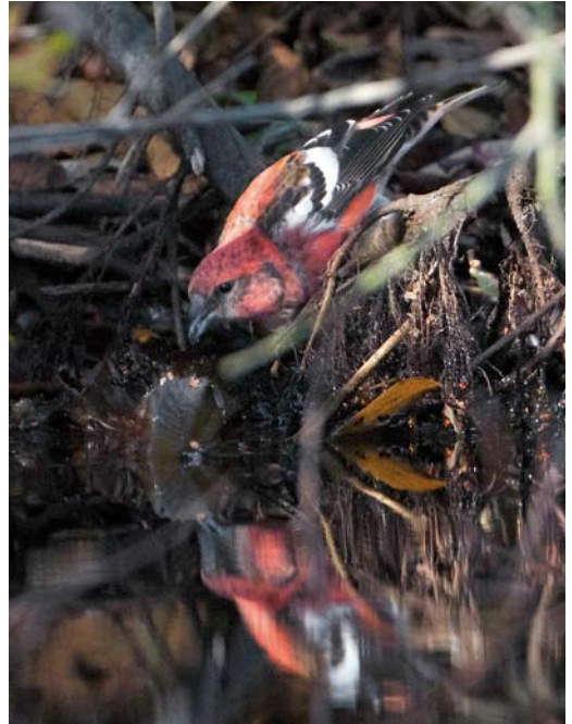
510 Long-tailed Shrike / Langstaartklauwier Lanius schach , first-year, Oude Vuilnisbelt, Den Helder, Noord-Holland, 31 October 2011 ( Jaap Denee ) 511 Two-barred Crossbill / Witbandkruisbek Loxia leucoptera , male, Klaas Douwes, Vlieland, Friesland, 8 October 2011 ( Jaap Denee ) 512 Greater Short-toed Lark / Kortteenleeuwerik Calandrella brachydactyla , Hondsbossche Zeewering, Noord-Holland, 7 May 2011 ( Cock Reijnders )