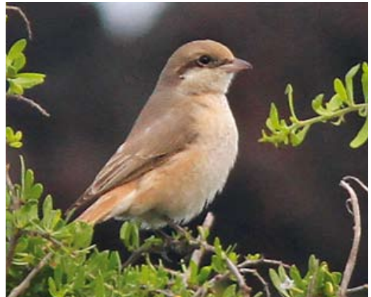
555 Trumpeter Finch / Woestijnvink Bucanetes githagineus , Linosa, Italy, 30 October 2012 (Michele Viganò) 556 Rustic Bunting / Bosgors Emberiza rustica , Linosa, Italy, 3 November 2012 (Igor Maiorano) 557 Olive-backed Pipit / Siberische Boompieper Anthus hodgsoni , Linosa, Italy, 11 November 2012 (Igor Maiorano) 558 Daurian Shrike / Daurische Klauwier Lanius isabellinus , adult female, Linosa, Italy, 2 November 2012 (Igor Maiorano)

Isle, Shetland, on 3 October (trapped) and at Marsden Quarry, Dunham, England, on 12 October. Several Lanceolated Warblers L. lanceolata were found on Fair Isle between 2 and 22 October, while others were discovered at Long Nab, Burniston, North Yorkshire, England, on 12 October and on North Ronaldsay, Orkney, Scotland, on 17 October. In Norway, Sykes's Warblers Iduna rama stayed at Træna, Nordland, on 24-25 September and on Skomvær, Røst, Røstlandet, on 28 September. Others were present at Söderskär, Porvoo, on 3-4 October (second for Finland) and on Tresco, Scilly, on 5-6 October (15th for Britain). An Eastern Olivaceous Warbler I. pallida at Kilminning, Fife, from 14 October until 20 November was the ninth for Scotland and c 18th for Britain. The second for Utsira (and sixth for Norway) was trapped on 1 November. The fourth Paddyfield Warbler Acrocephalus agricola for Cornwall (and c 85th for Britain) was watched at Church Cove on 8-13 October. A record 18 Blyth's Reed