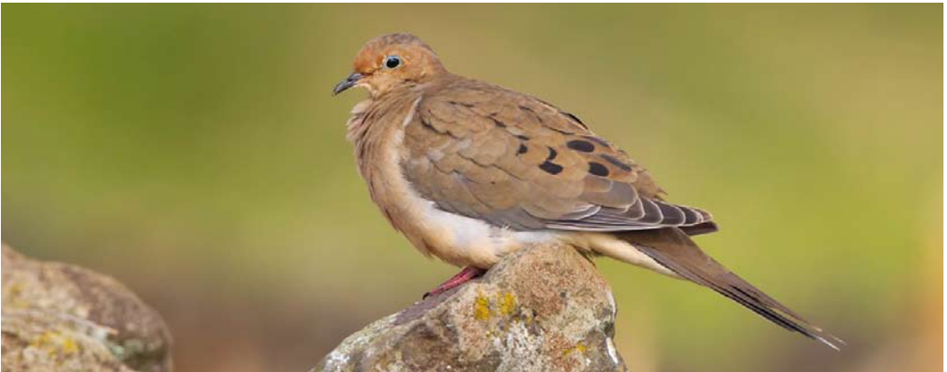
570 American Robin / Roodborstlijster Turdus migratorius , first-year, Corvo, Azores, 17 October 2012 (David Monticelli) 571 Wood Thrush / Amerikaanse Boslijster Hylocichla mustelina , Corvo, Azores, 9 October 2012 (Vincent Legrand) 572 Mourning Dove / Treurduif Zenaidura macroura , Corvo, Azores, 23 October 2012 (David Monticelli)

Several were seen in Spain in October: on Cabrera, Balearic Islands, in Cadíz and in Girona, and three were in Italy. Four reached Portugal: on Berlenga Grande on 20 October; at Roca Cape, Sintra, from 23 October to late November (two); at Praia do Abano, Cascais, on 28 October; and at Foz de Sizandro, Torres Vedras, on 29 October. On Fuerteventura, Canary Islands, four were found on 19 November. Pechora Pipits A. gustavi were present at Norwick, Unst, from 30 September to 2 October; on Fair Isle on 1-2 October; on Ouessant on 5-6 October (third for France); and on Isle of May, Fife, on 16 October. If accepted, one sound-recorded but not seen well enough to decide whether it indeed concerned a pipit in a pine wood on Vlieland on 20-21 October would be the first or second for the Netherlands (another possible one has been sound-recorded at IJmuiden, Noord-Holland, on 24 September 2007). American Buff-bellied Pipits A. rubescens rubescens were found at Loch Smerclate, South Uist, from 21 September to 2 October; at Smerwick Harbour, Kerry, Ireland, from 28