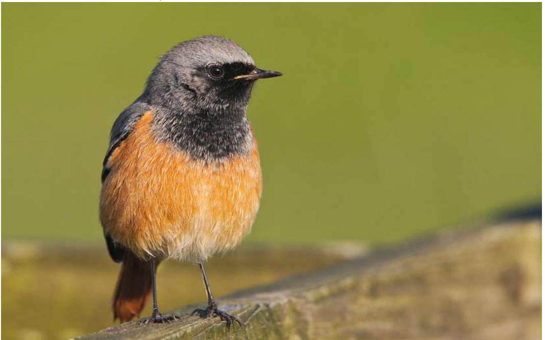
606 Oosterse Zwarte Roodstaart / Eastern Black Redstart Phoenicurus ochruros phoenicuroides , eerstejaars mannetje, Paesens, Friesland, 12 november 2012 ( Rob Olivier )