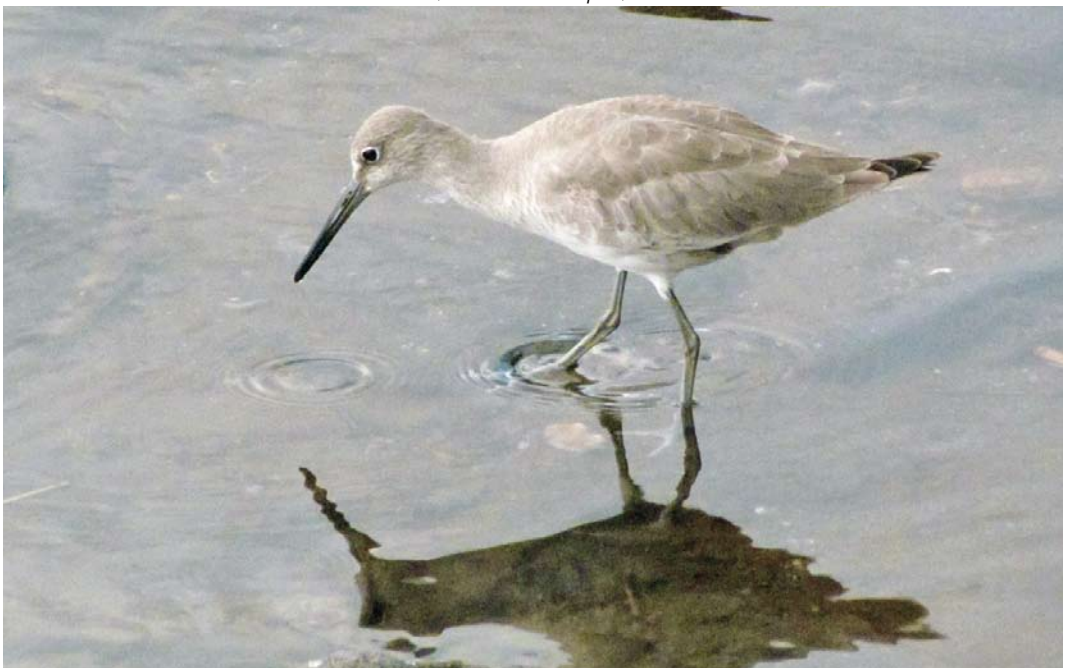
538 Willet / Willet Tringa semipalmata , Villa Franco do Campo, São Miguel, Azores, 18 October 2012