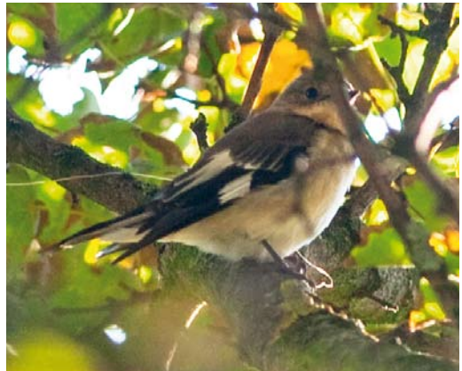
506 Blue-cheeked Bee-eater / Groene Bijeneter Merops persicus , Slikken van Flakkee, Zuid-Holland, 22 July 2011 507 River Warbler / Krekelzanger Locustella fluviatilis , Noordhollands Duinreservaat, Castricum, Noord-Holland, 21 August 2011 508 Greater Short-toed Lark / Kortteenleeuwerik Calandrella brachydactyla , Kennemermeer, IJmuiden, Noord-Holland, 15 May 2011 509 Collared Flycatcher / Withalsvliegenvanger Ficedula albicollis , adult male, Katwijk aan Zee, Zuid-Holland, 10 October 2010

den, Velsen, Noord-Holland, photographed, sound-recorded (R Slaterus et al); 2-4 November, Rijswijk, Rijswijk , Zuid-Holland, photographed, sound-recorded (M Zevenbergen, S Gobin et al); 5 November, Ouddorp, Goede-reede , Zuid-Holland, photographed, sound-recorded (GTanis, N de Schipper, I Meulmeester et al); 9 November, Meijndel, Wassenaar , Zuid-Holland, sound-recorded (A Remeeus, V van der Spek, R van der Vliet et al); 13 November, West-Terschelling, Terschelling , Friesland, sound-recorded (H Schekkerman, M Feenstra, A Ouwkerk); 13-14 November, Maasvlakte, Rotterdam , Zuid-Holland, photographed (B Brieffies et al; Dutch Birding 34: 72, plate 99, 2012). 2010 26 October, Groene Glop, Schiermonnikoog , Friesland, ringed, photographed (K H Oosterbeek, S Deuzeman); 7 November, Noordhollands Duinreservaat, Castricum , Noord-Holland, ringed, photographed (A Wijker,