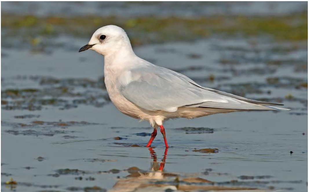
503 Ross's Gull / Ross' Meeuw Rhodostethia rosea , adult winter, Numansdorp, Zuid-Holland, 24 April 2011 (Filip De Ruwe)