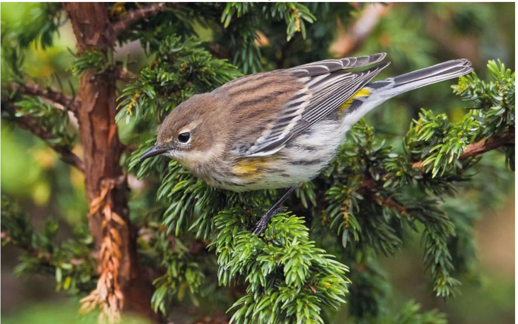
579 Myrtle Warbler / Mirtezanger Setophaga coronata , first-winter male, Corvo, Azores, 20 October 2012