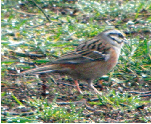
519 Rock Bunting / Grijze Gors Emberiza cia , first-summer male, Schiermonnikoog-Dorp, Schiermonnikoog, Friesland, 3 April 2011