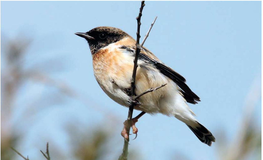
526 Kaspische Roodborstapuit / Caspian Stonechat Saxicola maurus variegatus , adult mannetje, Vlieland, Friesland, 15 oktober 2012 ( Marijn van Oss ). Let op roze poot en wratten op tenen / note pink leg and wart-like growths on toes.