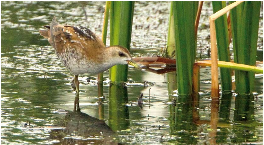
491 Little Crake / Klein Waterhoen Porzana parva , juvenile, Lepelaarplassen, Almere, Flevoland, 11 September 2011

30-31 March, Strabrechtse Heide, Heeze-Leende , Noord-Brabant, adult male, photographed (M van Oss et al; Dutch Birding 33: 216, plate 258, 2011); 7 April, Kamperhoek, Dronten , Flevoland, adult male, photographed (M Roos; Dutch Birding 33: 216, plate 259, 2011); 19 April, Tuintjes, De Cocksdorp, Texel , Noord-Holland, second calendar-year, photographed (R Halff, F Geldermans); 23 April, Tuintjes, De Cocksdorp, Texel , Noord-Holland, second calendar-year male, photographed (N van Houtum, H Verdaat, J van den Berg et al); 23 April, Kamperhoek, Dronten , Flevoland, second calendar-year, photographed (H Zevenhuizen, N van Duivendijk); 24 April, Broeklanden, Hardenberg , Overijssel, second calendar-year, photographed (B Stegeman); 29-30 April, Anjumer en Liessenserpolder, Dongeradeel , Fries-