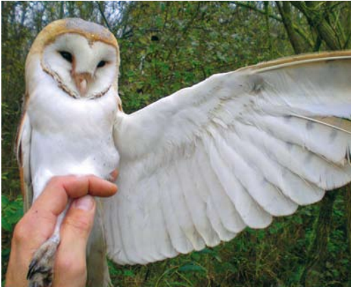
504 Pale Barn Owl / Witte Kerkuil Tyto alba alba , Groene Glop, Schiermonnikoog, Friesland, 9 November 2009