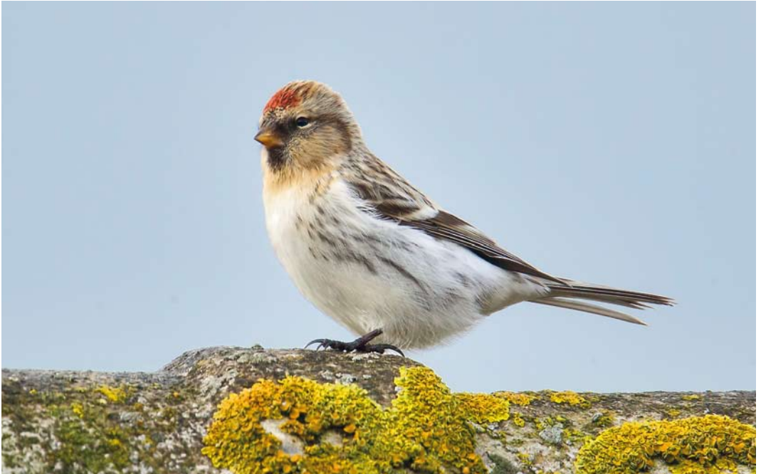
568 Hornemann's Redpoll / Groenlandse Witsuitbarmsijs Acanthis hornemanni hornemanni , Maywick, Mainland, Shetland, Scotland, 27 October 2012 (Hugh Harrop)