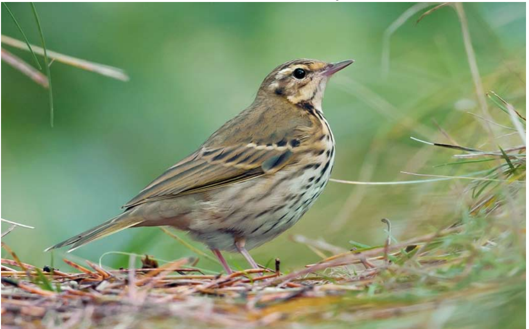
601 Siberische Boompieper / Olive-backed Pipit Anthus hodgsoni , De Koog, Texel, Noord-Holland, 20 oktober 2012 (Jos van den Berg)