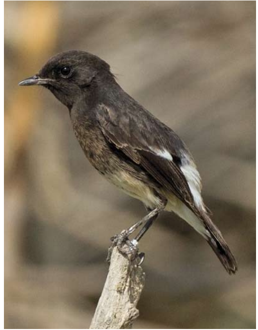
546 Northern Hawk-Owl / Sperweruil Surnia ulula , first-year, Store Hareskov, Sjælland, Denmark, 6 October 2012 547 Pied Bushchat / Zwarte Roodborsttapuit Saxicola caprata , first-year male, Yeroham, Negev, Israel, 18 October 2012 548 Lesser Spotted Woodpecker / Kleine Bonte Specht Dendrocopos minor , female, Scalloway, Mainland, Shetland, Scotland, 16 October 2012