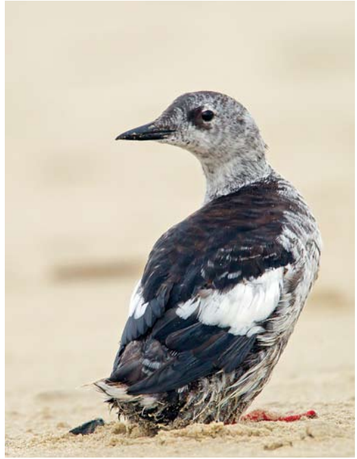
589 Zwarte Ooievaar / Black Stork Ciconia nigra , juveniel, Oudeschild, Texel, Noord-Holland, 1 november 2012 590 Zwarte Zeekoet / Black Guillemot Cepphus grylle , tweede-winter, IJzeren Kaap, Texel, Noord-Holland, 30 september 2012 591 Zwarte Ibis / Glossy Ibis Plegadis falcinellus , adult winter, Banckspolder, Schiermonnikoog, Friesland, 27 oktober 2012