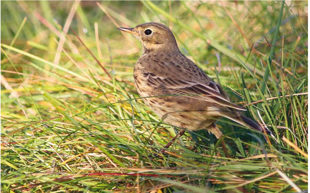
565 American Buff-bellied Pipit / Amerikaanse Waterpieper Anthus rubescens rubescens , Öygarden, Hordaland, Norway, 12 October 2012 (Julian Bell)