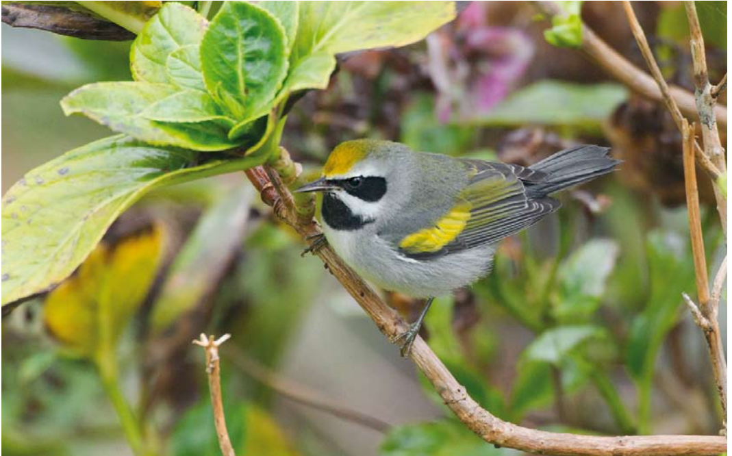
580 Golden-winged Warbler / Geelvleugelzanger Vermivora chrysoptera , first-year male, Corvo, Azores, 12 October 2012