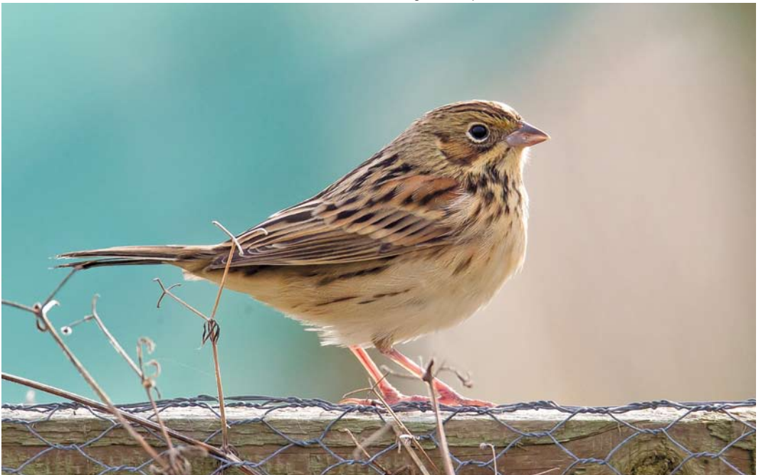
569 Chestnut-eared Bunting / Grijskopgors Emberiza fucata , Pool of Virkie, Mainland, Shetland, Scotland, 24 October 2012