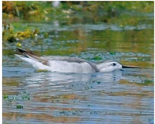
498 Semipalmated Sandpiper / Grijze Strandloper Calidris pusilla , adult, Westpolder, Groningen, 20 May 2011 (Martijn Bot) 499 Red-necked Stint / Roodkeelstrandloper Calidris ruficollis , adult, Utopia, Texel, Noord-Holland, 19 July 2011 (Arnold W J Meijer) 500 Spotted Sandpiper / Amerikaanse Oeverloper Actitis macularius , adult, Hogerwaardpolder, Zeeland, 31 July 2011 (Roy Slaterus) 501 Wilson's Phalarope / Grote Franjepoot Phalaropus tricolor , first-year, Wagejot, Texel, Noord-Holland, 28 August 2011 (René Pop)