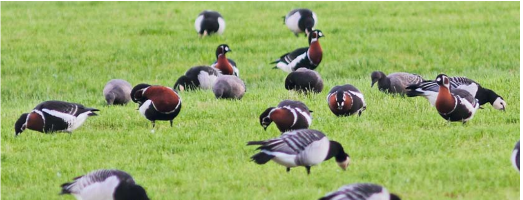
592 Raddes Boszanger / Radde's Warbler Phylloscopus schwarzi , Noordhollands Duinreservaat, Castricum, Noord-Holland, 20 oktober 2012 ( Arnold Wijker ) 593 Roodstuitzwaluw / Red-rumped Swallow Cecropis daurica , Robbenjager, Texel, Noord-Holland, 13 oktober 2012 ( Arnoud B van den Berg ) 594 Bosgors / Rustic Bunting Emberiza rustica , Kroon's Polders, Vlieland, Friesland, 13 september 2012 ( Nils van Duivendijk ) 595 Dwerggors / Little Bunting Emberiza pusilla , Robbenjager, Texel, Noord-Holland, 16 september 2012 ( Toy Janssen ) 596 Roodhalsganzen / Red-breasted Geese Branta ruficollis , Banckspolder, Schiermonnikoog, Friesland, 27 oktober 2012 ( Marc Dijksterhuis )