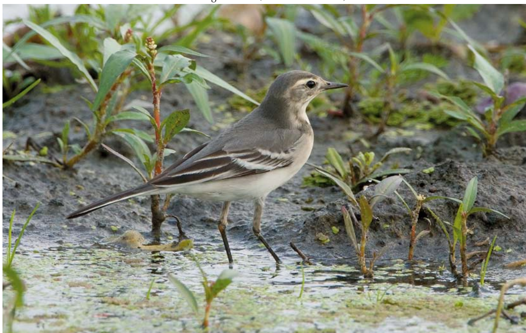
517 Citrine Wagtail / Citroenkwikstaart Motacilla citreola , first-year, Polder R, Petten, Noord-Holland, 25 August 2011 (Co van der Wardt)