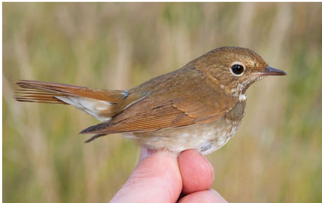
553 Rufous-tailed Robin / Snornachtegal Larivora sibilans , first-year, Christiansø, Bornholm, Denmark, 14 October 2012