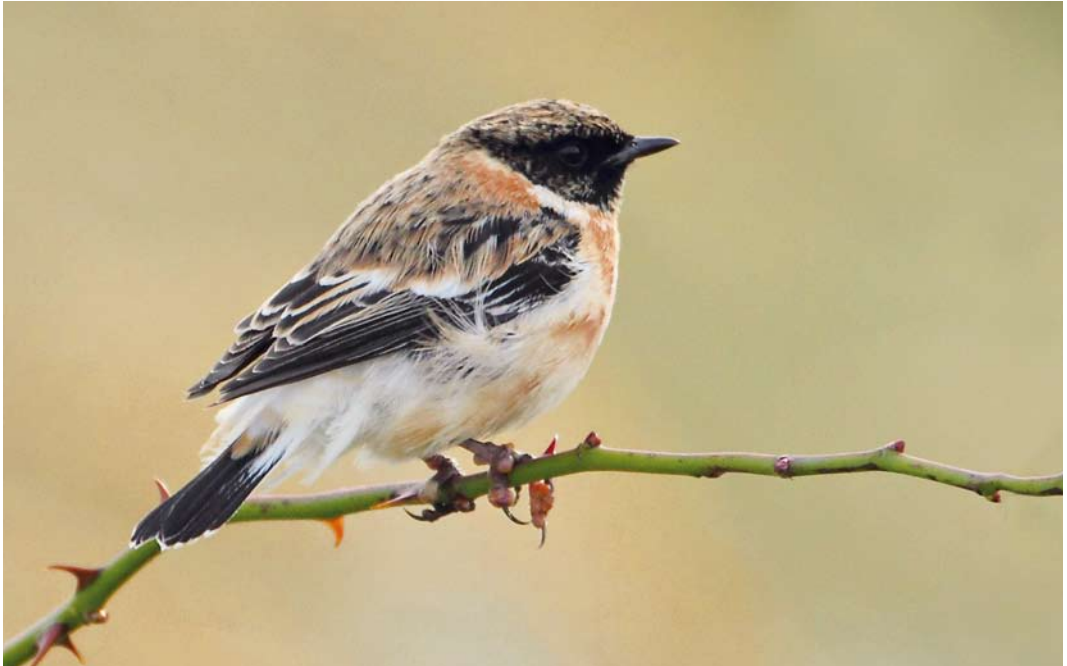
527 Kaspische Roodborsttapuit / Caspian Stonechat Saxicola maurus variegatus , adult mannetje, Vlieland, Friesland, 8 oktober 2012 (Eric Menkveld)

Europa is variegatus 11 keer vastgesteld, met negen gevallen op Cyprus, één geval in Griekenland en één in Italië, alle in december-april (Slack 2009). Opvallend is dat van de negen gevallen in Noordwest-Europa er zes in het voorjaar waren, terwijl nominaat maurus juist veel vaker in het najaar wordt waargenomen. Ter illustratie: van de 38 als maurus aanvaarde gevallen van Aziatische Roodborsttapuit in Nederland zijn er slechts twee in het voorjaar, een beeld dat overeenkomt met de ons omringende landen (Slack 2009; www.dutchavifauna.nl). Mogelijk is dit een vertekend beeld omdat maurus in het voorjaar vaak lastiger te onderscheiden is van Roodborsttapuit terwijl door het afwijkende staartpatroon variegatus het hele jaar goed is te onderscheiden van Roodborsttapuit.