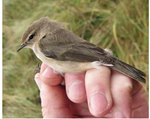
534 Siberian Chiffchaff / Siberische Tjiftjaf Phylloscopus collybita tristis , Castricum, Noord-Holland, 22 November 2010. Identified as tristis by the ringer.

to pick out chiffchaffs which looked like another subspecies than collybita on the basis of plumage characters but they appeared to mistake them for abietinus . They often did consider the possibility of a 'greyish' tristis , but in many cases ruled out this taxon based on the CDNA criteria for acceptance. It means that they were not able to correctly identify many tristis by plumage, despite having much experience with chiffchaffs in the hand.