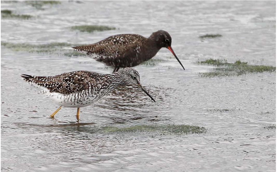
502 Greater Yellowlegs / Grote Geelpootruiter Tringa melanoleuca , with Spotted Redshank / Zwarte Ruiter T erythropus , Bokkegat, Noord-Beveland, Zeeland, 19 June 2011 (Kris De Rouck)