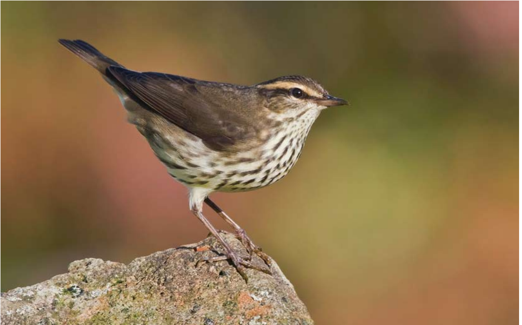
578 Northern Waterthrush / Noordse Waterlijster Parkesia noveboracensis , Corvo, Azores, 6 October 2012