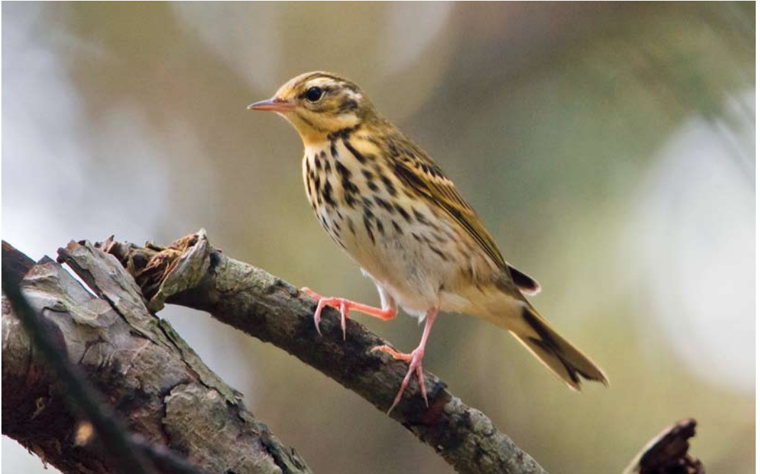
600 Siberische Boompieper / Olive-backed Pipit Anthus hodgsoni , Hoorn, Terschelling, Friesland, 19 oktober 2012