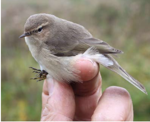
533 Siberian Chiffchaff / Siberische Tjiftjaf Phylloscopus collybita tristis , Almere, Flevoland, 26 October 2010. Identified as tristis by the ringers due to lack of yellow and green on, eg, head, supercilium and upperparts.