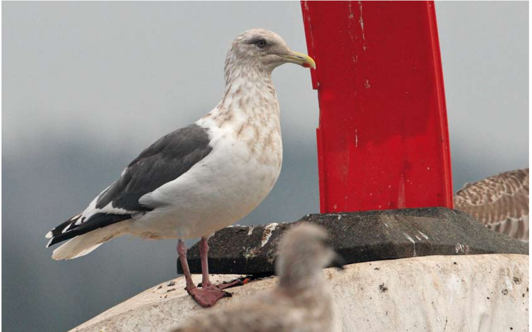
537 Slaty-backed Gull / Kamtsjatkameeuw Larus schistisagus , adult, Kikkonummi, Helsinki, Finland, 3 November 2012