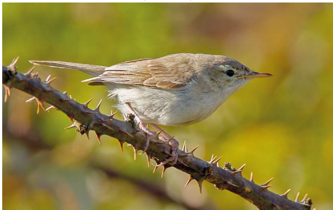
564 Sykes's Warbler / Sykes' Spotvogel Iduna rama , Tresco, Scilly, England, 6 October 2012 ( Richard Stonier )