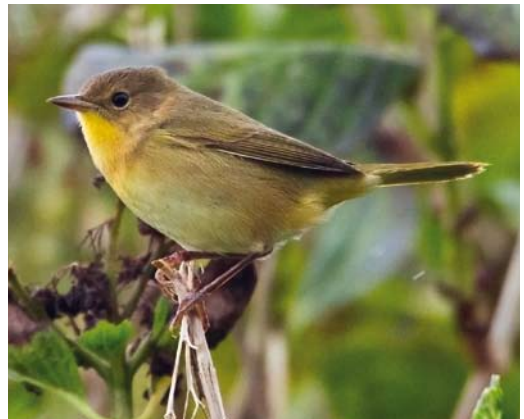
582 Black-and-white Warbler / Bonte Zanger Mniotilta varia , first-year male, Corvo, Azores, 12 October 2012 (Vincent Legrand) 583 American Yellow Warbler / Gele Zanger Setophaga petechia , first-year, Corvo, Azores, 20 October 2012 (David Monticelli) 584 Tennessee Warbler / Tennesseezanger Geothlypis peregrina , Corvo, Azores, 16 October 2012 (Vincent Legrand) 585 Common Yellowthroat / Gewone Maskerzanger Geothlypis trichas , Corvo, Azores, 16 October 2012 (Vincent Legrand)

described by Christie A MacDonald et al in Arctic 65 (3): 344-348, 2012. A first-year female Chestnut-eared Bunting Emberiza fucata first identified as Little Bunting E pusilla at Pool of Virkie, Shetland, on 23-25 October was the second for Scotland and the third for the WP (Birding World 25: 433-436, 2012); the previous two were on Fair Isle on 15-20 October 2004 and in Uppland, Sweden, on 25 October 2011. In Shetland, a first-winter Bobolink Dolichonyx oryzivorus was photographed at Brake, Mainland, on 28 October. Blackpoll Warblers Setophaga striata stayed on Inishmore on 7 October; in Scilly on Bryher on 11-18 October and on St Mary's on 28-29 October; and at Blacksod, The Mullet, Mayo, on 9 November. In Ireland, Myrtle Warblers S coronata were seen on Dursey Island, Cork, on 3-6 October and (two) on Inishmore on 6 October and, in Iceland, one turned up at Hafnarfjörður on 11 November.