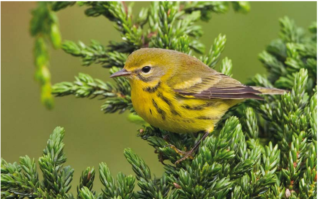
581 Prairie Warbler / Prairiezanger Setophaga discolor , first-year male, Corvo, Azores, 20 October 2012 (Vincent Legrand)