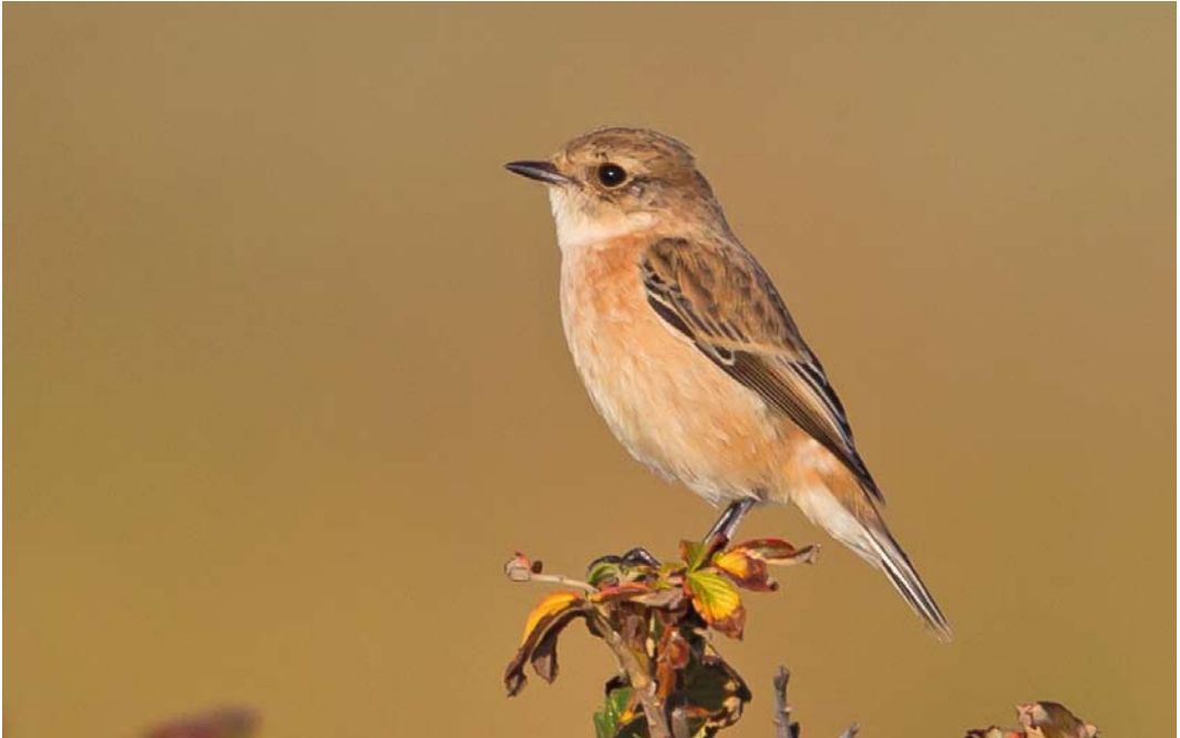
604 Stejnegers Roodborsttapuit / Stejneger's Stonechat Saxicola maurus stejnegeri , eerstejaars mannetje, Robbenjager, Texel, Noord-Holland, 10 oktober 2012

vogels zag, op basis van kleedkenmerken zeker een ander exemplaar. Vooral tijdens het Dutch Birding-vogelweekend op 13-14 oktober trok de vogel veel bekijks en tijdens zijn lange verblijf werd hij door minstens 300 vogelaars gezien. In die tijd las ik met interesse een bijdrage op Birding Frontiers ( www.birdingfrontiers.com ) over een Aziatische Roodborsttapuit op Shetland, waarbij het vraagstuk werd aangekaart of en hoe een Stejnegers Roodborsttapuit S m stejnegeri (hierna stejnegeri ) in Europa van een nominaat maurus kon worden onderscheiden. De Texel-vogel leek donker genoeg voor een stejnegeri maar er waren volgens mij onvoldoende handvatten bekend om dit taxon in het veld te determineren.