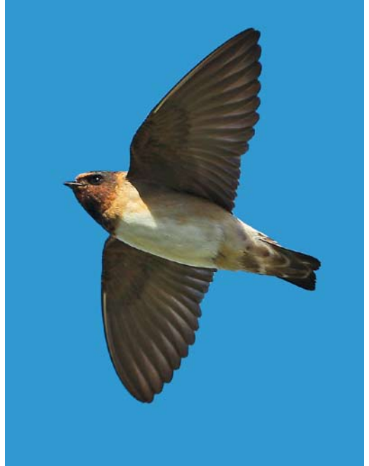
549-550 American Cliff Swallow / Amerikaanse Klifzwaluw Petrochelidon pyrrhonota , first-year, Ouessant, Finistère, France, 4 October 2012 551 American Cliff Swallow / Amerikaanse Klifzwaluw Petrochelidon pyrrhonota , adult, Gårdby hamn, Öland, Sweden, 19 November 2012 552 Eastern Kingbird / Koningstiran Tyrannus tyrannus , Inishmore, Galway, Ireland, first-year, 5 October 2012