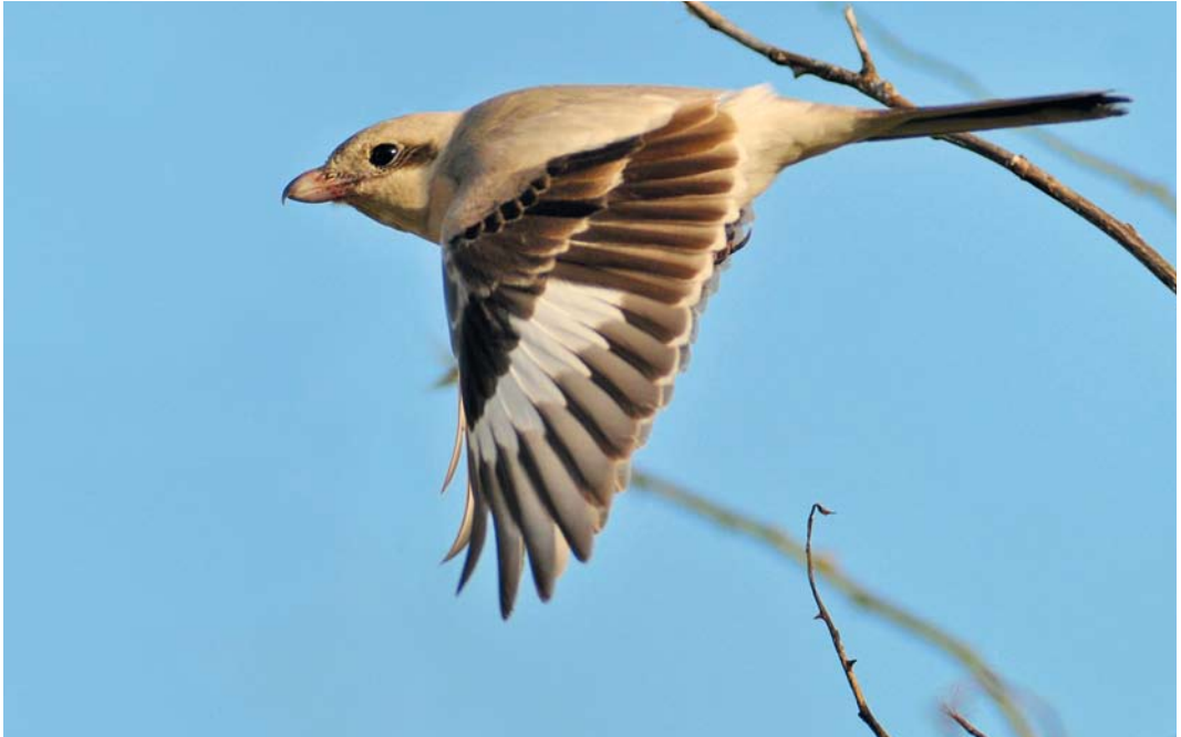
602 Steppeklapekster / Steppe Grey Shrike Lanius lahtora pallidirostris , eerste-winter, Buitendijk, Texel, Noord-Holland, 30 oktober 2012

Nachtgaal Luscinia luscinia werd op 8 september gevangen bij Castricum. Op minimaal 10 plekken langs de kust werden Kleine Vliegenvangers Ficedula parva ontdekt. Vooral op Texel en Vlieland lieten enkele exemplaren zich aan een groot publiek zien. Op www.waarneming.nl werd de soort in deze periode zelfs meer dan 500 keer ingevoerd. Twee late exemplaren verbleven op 27 oktober op Vlieland en bij Leidschendam. Aziatische Roodborstapuiten Saxicola maurus verbleven van 13 tot 15 oktober bij de Slufter op Texel en op 25 oktober in de Tuintjes op de noordpunt van Texel. Een derde exemplaar dat van 8 tot 23 oktober veel bekijks trok op de noordpunt van Texel, bleek – na bestudering van details in het verenkleed – dezelfde als de vogel die van 24 tot 26 oktober verbleef op Portland Bill, Dorset, Engeland, waar hij op 26 oktober werd gevangen; DNA-analyse toonde vervolgens aan dat het hier ging om een Stejnegers Roodborstapuit S m stejneri . Indien aanvaard betreft dit het eerste geval van dit taxon. De eerste Kaspische Roodborstapuit S m variegatus was een adult mannetje van 6 tot 20 oktober op Vlieland.