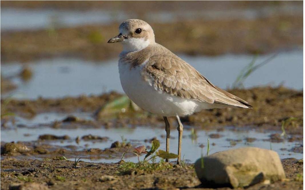
492 Greater Sand Plover / Woestijnplevier Charadrius leschenaultii , adult female, Batenburg, Gelderland, 1 May 2011 (Roland Jansen) 493 Cream-colored Coursers / Renvogels Cursorius cursor (above: collected between IJmuiden and Zandvoort, Noord-Holland, on 18 October 1933; below: first calendar-year, collected at 's-Graveland, Noord-Holland, on c 18 October 1844), Zoölogisch Museum Amsterdam (ZMA), Noord-Holland, January 1996 (Jan van der Laan)