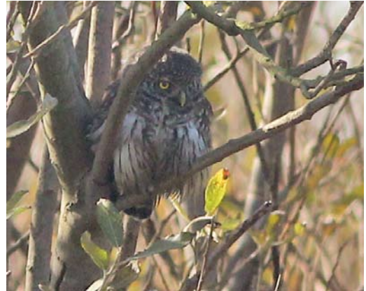
505 Eurasian Pygmy Owl / Dwerguil Glaucidium passerinum , Robbenjager, Texel, Noord-Holland, 14 October 2011

graphed (F Visscher et al; Dutch Birding 33-5, cover, 33: 347, plate 446, 2011).