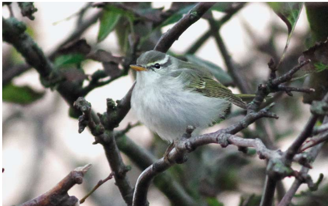
563 Eastern Crowned Warbler / Kroonboszanger Phylloscopus coronatus , Helgoland, Schleswig-Holstein, Germany, 16 October 2012 ( Jochen Dierschke )