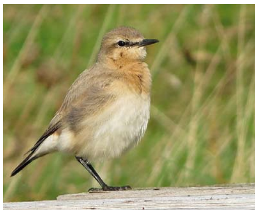
559 White-throated Needletail / Stekelstaartgierzwaluw Hirundapus caudacutus , Rømø, Tønder, Denmark, 21 October 2012 ( Ole Zoltan Göller ) 560 Bobolink / Bobolink Dolichonyx oryzivorus , first-year, Shetland, Scotland, 28 October 2012 ( Hugh Harrop ) 561 Rufous Turtle Dove / Meenatorstel Streptopelia orientalis meena , first-year, Wabern, Hessen, Germany, 30 October 2012 ( Tobias Epple ) 562 Isabelline Wheatear / Izabeltapuit Oenanthe isabellina , Spiekeroog, Niedersachsen, Germany, 19 October 2012 ( Tobias Epple )

THRUSHES White's Thrushes Zoothera aurea were found at Cot Valley, Cornwall, England, on 8 October; on Ouessant (two or three) on 11-20 October; at Brevig, Barra, Outer Hebrides, on 13 October (trapped); and at Mølen, Vestfold, on 20 October. Also on Barra, a Swainson's Thrush Catharus ustulatus from 2 October was trapped on 4 October; the first for Denmark was trapped on Christiansø, Bornholm, on 21 October and seen on 24-30 October. A Grey-cheeked Thrush C. minimus stayed on St Agnes, Scilly, on 6-8 October. Eyebrowed Thrushes Turdus obscurus turned up on Foula, Shetland, on 13 October and at Pori, Finland, on 15 October. The second Naumann's Thrush T. naumanni for Ukraine was a first-winter trapped at Lviv on 6 October; the first for Estonia stayed at Kihnu Pärnumaa from 17 November. Black-throated Thrushes T. atrogularis were seen, eg, on Fair Isle on 6 October; on Helgoland on 10-16 October; at Hanko, Finland, on 27 October; at