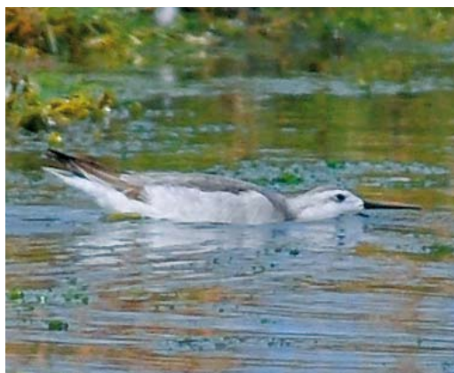
498 Semipalmated Sandpiper / Grijze Strandloper Calidris pusilla , adult, Westpolder, Groningen, 20 May 2011 499 Red-necked Stint / Roodkeelstrandloper Calidris ruficollis , adult, Utopia, Texel, Noord-Holland, 19 July 2011 500 Spotted Sandpiper / Amerikaanse Oeverloper Actitis macularius , adult, Hogerwaardpolder, Zeeland, 31 July 2011 501 Wilson's Phalarope / Grote Franjepoot Phalaropus tricolor , first-year, Wagejot, Texel, Noord-Holland, 28 August 2011