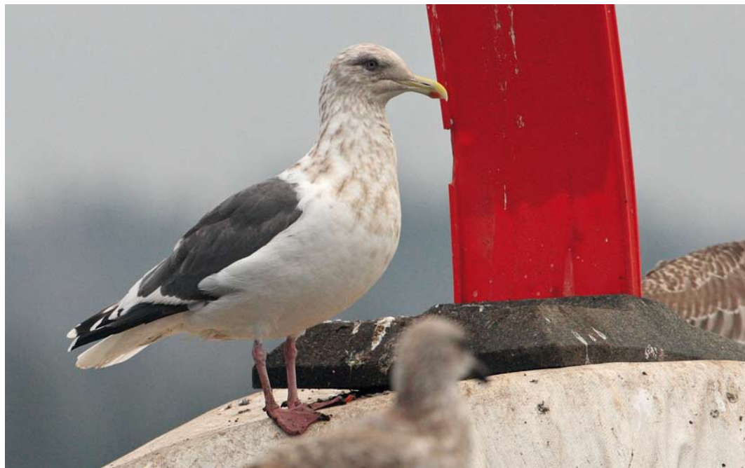
537 Slaty-backed Gull / Kamtsjatkameeuw Larus schistisagus , adult, Kikkonummi, Helsinki, Finland, 3 November 2012