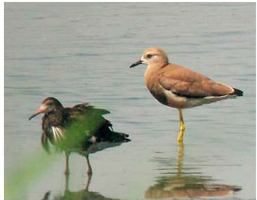
352 Spectacled Eiders / Brileiders Somateria fischeri , male and female, off Prins Karls Forland, Svalbard, 20 June 2012 353 Harlequin Duck / Harlekijneend Histrionicus histrionicus , male, Persfjorden, Finnmark, Norway, 30 June 2012 354 Eurasian Stone-curlews / Grielen Burhinus oedicanus , Baden-Württemberg, Germany, 15 July 2012 355 White-tailed Lapwing / Witstaartkievit Vanellus leucurus , with Ruff / Kemphaan Philomachus pugnax , male, Dinnyés, Fejér, Hungary, 1 July 2012

photographed at Randaberg, Rogaland, Norway, on 10 July. An adult Sociable Lapwing Vanellus gregarius was found at Oostvaardersplassen, Lelystad, Flevoland, on 22 June; up to and including 2011, there were 50 records for the Netherlands. On 1-2 July, a White-tailed Lapwing V leucurus was photographed at Fertő, Dinnyés, Fejér, Hungary. A Great Knot Calidris tenuirostris first seen at Kokullen, Uppsala, on 18 June and, the next afternoon, more than 200 km further south-west at Erstadkärret, Visingsö, Småland, was the second for Sweden. A Western Sandpiper C mauri on Öland on 14-15 July was the second for Sweden. In the Azores, a Least Sandpiper C minutilla was found on 15 July at Cabo da Praia, Terceira. The second White-rumped Sandpiper C fuscicollis for Poland was an adult photographed at Szczecin lagoon near Świnoujście on 4 July (the first was on 28-29 May 1998) and the fifth Semipalmated Sandpiper C pusilla for Poland was found at the same site on 20 July. The first Sharp-tailed Sandpiper C acuminata for Jan Mayen, Norway, was present from 27 June to at least