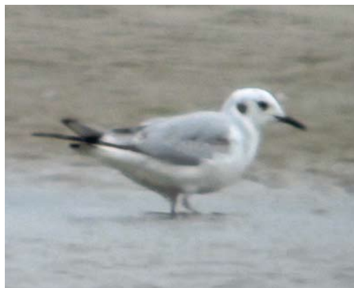
320 Kleine Kokmeeuw / Bonaparte's Gull Chroicocephalus philadelphia , eerste-zomer, Razende Bol, Noord-Holland, 3 mei 2012 (Tim Zutt)