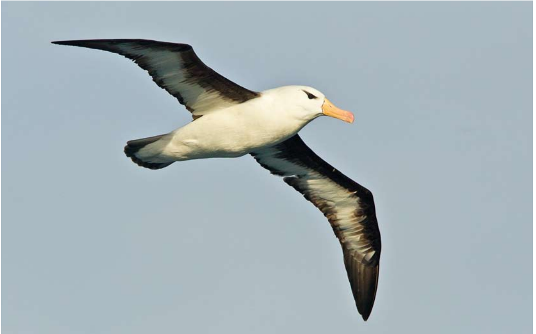
343 Black-browed Albatross / Wenkbrauwalbatros Thalassarche melanophris , adult, South Georgia, 9 April 2011