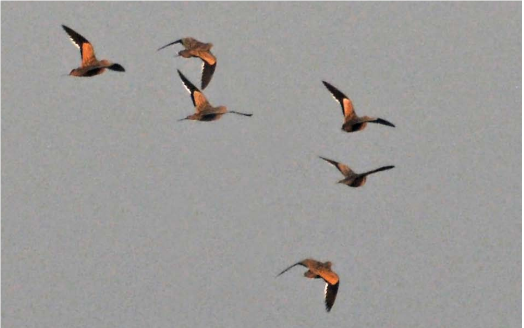
298 Chestnut-bellied Sandgrouse / Roodbuikzandhoenders Pterocles exustus , Al Bahnasa, Minya, Egypt, 22 March 2012 (Jonas Geburzi)

ly barred and streaked on the underparts than nominate exustus .