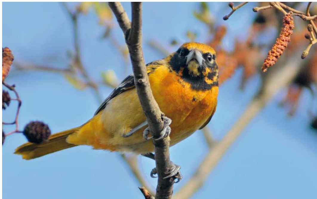
318 Baltimoretroepiaal / Baltimore Oriole Icterus galbula , eerstejaars mannetje, Oudorp, Alkmaar, Noord-Holland, 11 april 2010 ( Harm Niesen )