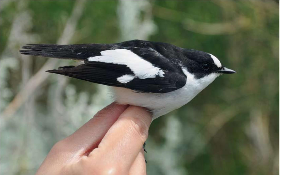
363 Atlas Flycatcher / Atlasvliegenvanger Ficedula speculigera , adult male, Ventotene, Italy, 22 April 2012 cf Dutch Birding 34: 194, 2012 (not early May)