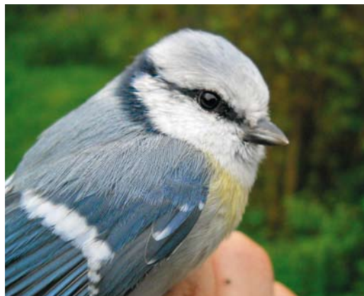
310 Hybrid Azure x European Blue Tit / hybride Azuurmees x Pimpelmees Cyanistes cyanus x caeruleus , Drienovec, Košice, Slovakia, 5 October 2010 (Milan Olekšák)

Azure Tit to west of the traditional breeding grounds during the last 20 years, the number of records of this species in central and northern Europe significantly decreased (cf table 1). However, it could be expected that the increase in the number and activity of observers would have resulted in a larger number of Azure Tit records, particularly in countries bordering the breeding areas (eg, Poland). The reverse applies to records of 'Pleske's Tit', which are now reported in central and western Europe more frequently than in the past. The ratio of records of pure Azure to Pleske's has changed very significantly from 9:1 before 1990 (90 records of Azure Tit versus 11 of hybrids) to 2:1 in the years 1990-2010 (29 Azure versus 15 hybrids). What could have caused this? Perhaps in the past, Pleske's has been misidentified as Azure Tit, while nowadays a better knowledge of identification characters of hybrids and the increase in photographic documentation of records and awareness of observers contributed to the change of these proportions.