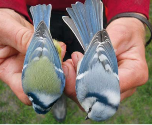
311 Hybrid Azure x European Blue Tit / hybride Azuurmees x Pimpelmees Cyanistes cyanus x caeruleus (right), with European Blue Tit / Pimpelmees, Drienovec, Košice, Slovakia, 5 October 2010

Polen (55%). De meest westelijke gevallen waren in Kroatië en Zuid-Frankrijk, meer dan een eeuw geleden (figuur 1, tabel 1). Ongeveer de helft van het aantal gevallen was in de 19e eeuw en in de eerste helft van de