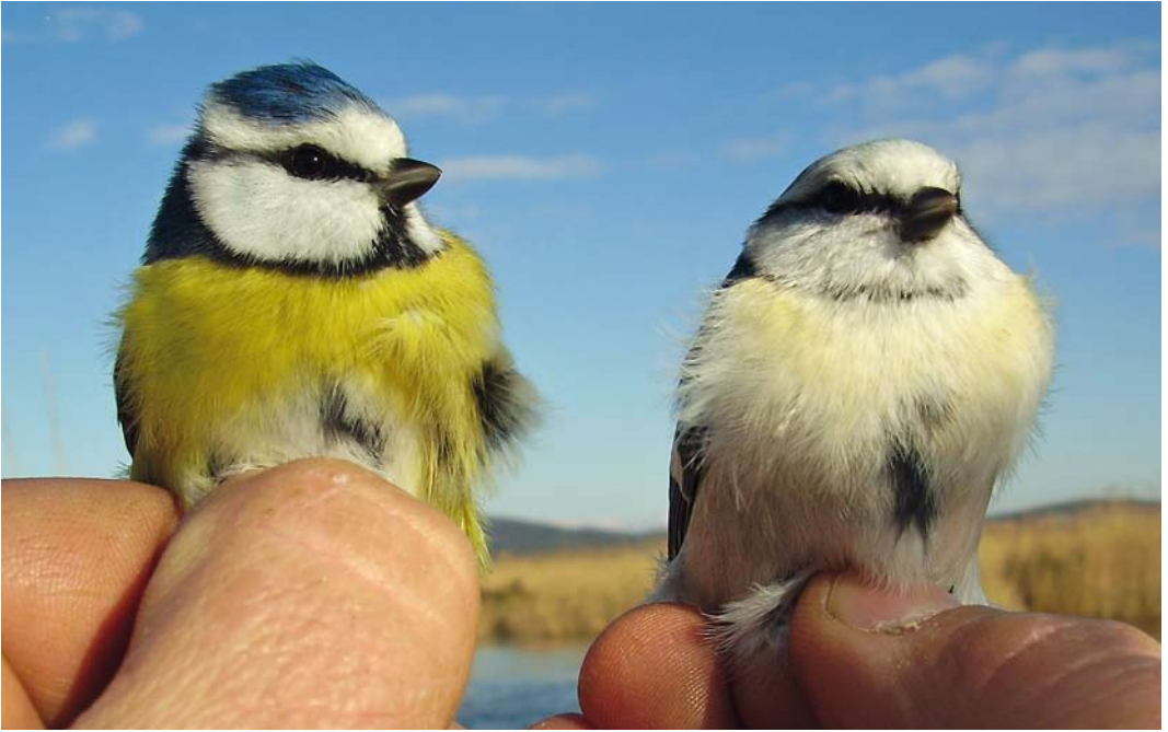
303-304 Hybrid Azure x European Blue Tit / hybride Azuurmees x Pimpelmees Cyanistes cyanus x caeruleus (right), with European Blue Tit / Pimpelmees C. caeruleus , Vransko Jezero, Dalmacija, Croatia, 7 January 2006