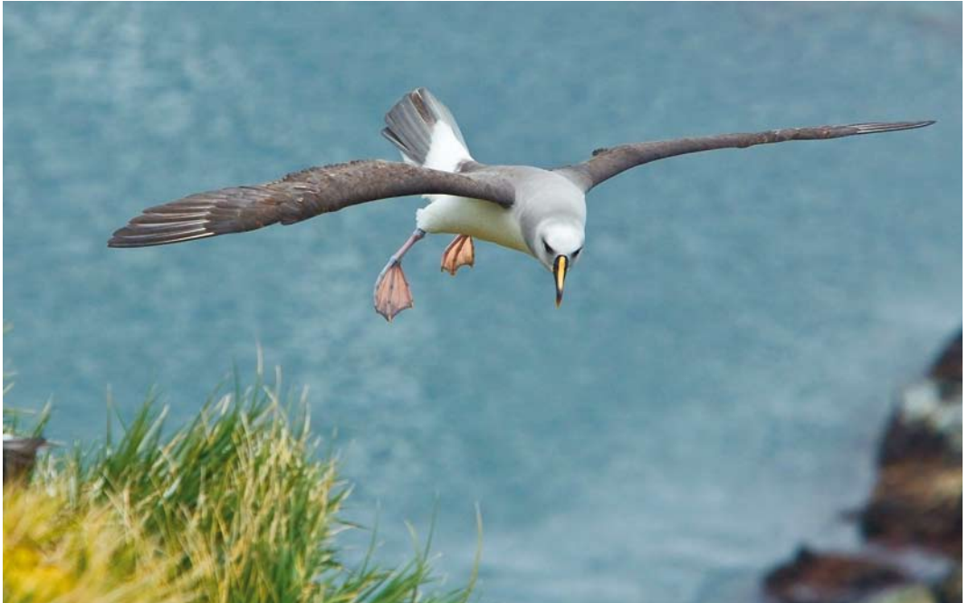
341 Grey-headed Albatross / Grijskopalbatros, Thalassarche chrysostoma , adult, Elsenhul, South Georgia, 12 November 2010