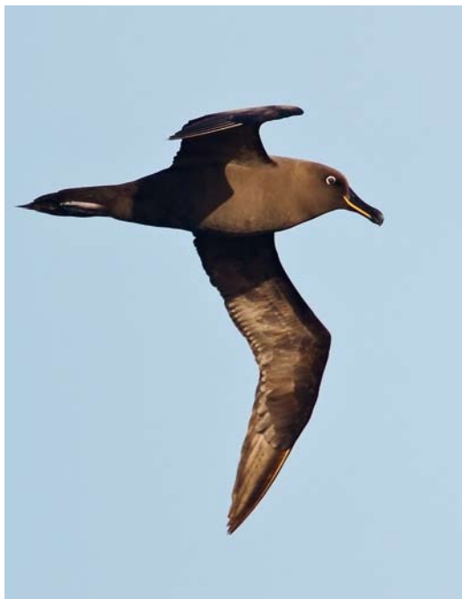
337 Sooty Albatross / Zwarte Albatros Phoebastria fusca , adult, at sea, south of Gough, 7 April 2011 (Otto Plantema)