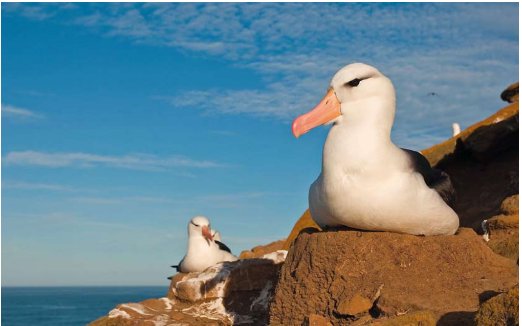
344 Black-browed Albatrosses / Wenkbrauwalbatrossen Thalassarche melanophris , adults, Pebble Island, Falkland Islands, 1 December 2007