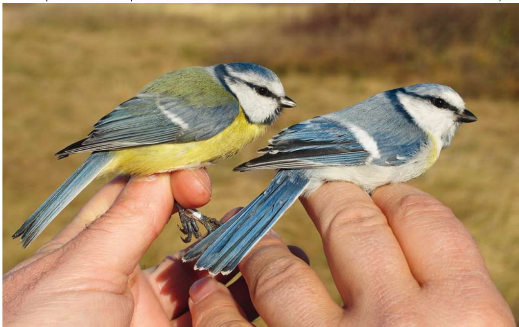
306 Hybrid Azure x European Blue Tit / hybride Azuurmees x Pimpelmees Cyanistes cyanus x caeruleus (right), with European Blue Tit / Pimpelmees, Castricum, Noord-Holland, Netherlands, 15 November 2007 ( Arnold Wijker )