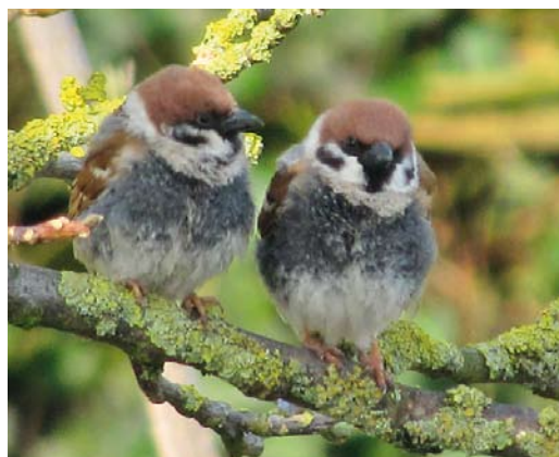
325 Ringmussen / Eurasian Tree Sparrows Passer montanus , Makkum, Friesland, 25 december 2009 (Rien van Wijk) 326-327 Ringmus / Eurasian Tree Sparrow Passer montanus , Makkum, Friesland, 27 december 2009 (Rien van Wijk) 328 Ringmussen / Eurasian Tree Sparrows Passer montanus , Makkum, Friesland, 5 april 2010 (Rien van Wijk)

kleed werd advies gevraagd aan Hein van Grouw (Natural History Museum (NHM), Tring, Engeland), C S (Kees) Roselaar (Naturalis Biodiversity Center, Leiden, Zuid-Holland) en Piet de Goede (Nederlands Instituut voor Ecologie (NIOO-KNAW), Wageningen, Zuid-Holland). Het afwijkende venkleed wordt volgens HvG, CSR en PdG (in litt) verklaard doordat de veren op de borst zeer sterk gesleten of beschadigd waren, waarbij de bleekbeige veertoppen waren verdwenen en alleen nog het donkere (donkergrijze tot zwartachtige) onderdons (de basale helft van de veren) zichtbaar was. De extreme slijtage kan veroorzaakt zijn door parasieten of door het veelvuldig in een (nest)holte kruipen met een (te) kleine opening. Dat parasieten de oorzaak zouden zijn is goed mogelijk omdat dit vaak voorkomt bij holenslappende vogels, zoals Ringmus. Daartegen spreekt