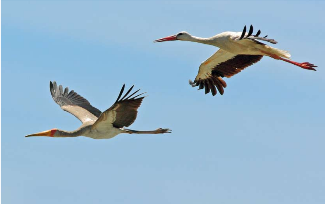
346 Yellow-billed Stork / Afrikaanse Nimmerzat Mycteria ibis , immature, with White Stork Ciconia ciconia , Mogan Gölü, Ankara, Turkey, 22 June 2012