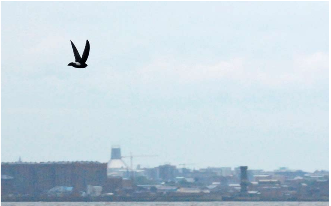
347 Little Swift / Huisgierzwaluw Apus affinis , juvenile, New Brighton, Merseyside, England, 22 June 2012