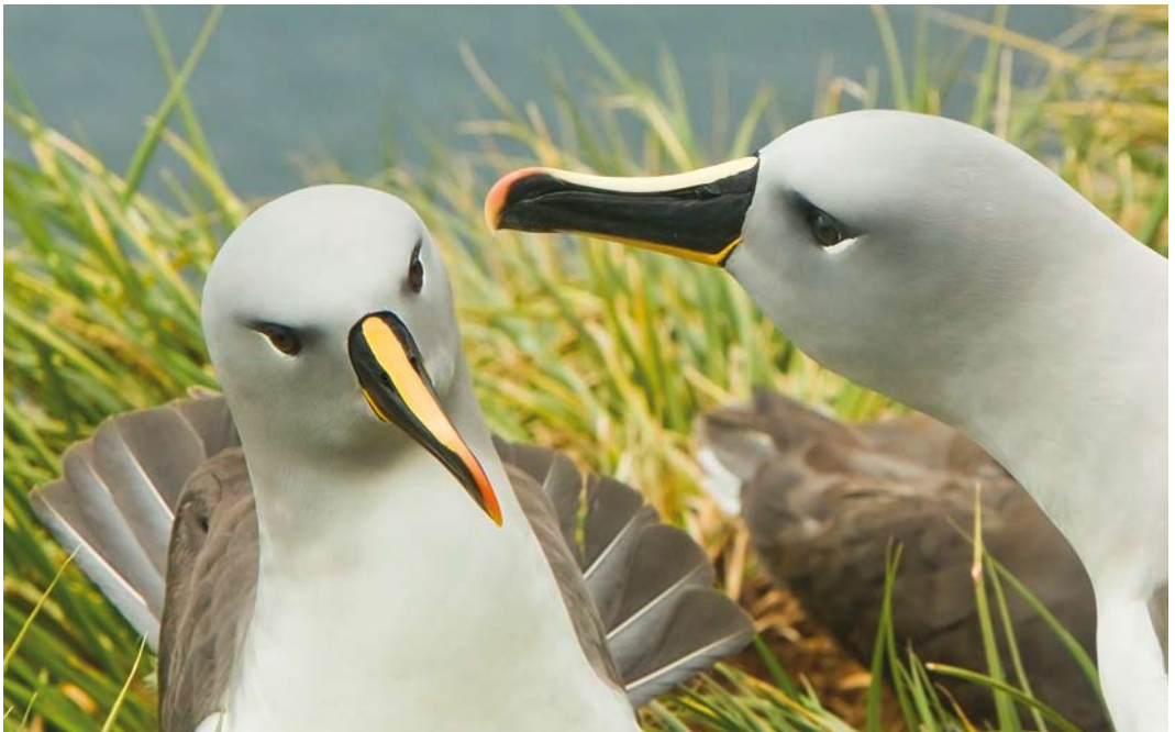
342 Grey-headed Albatrosses / Grijskopalbatrossen Thalassarche chrysostoma , adults, Elsenhul, South Georgia, 14 November 2010