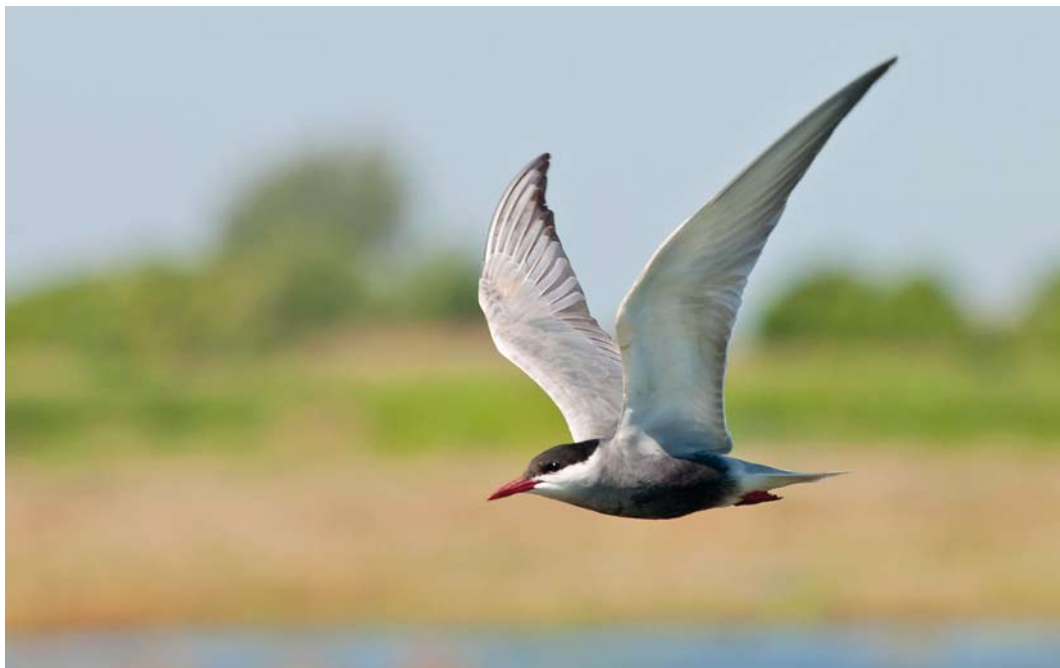
366 Witwangstern / Whiskered Tern Chlidonias hybrida , adult zomer, Kroppswolderbuitenpolder, Groningen, 26 mei 2012