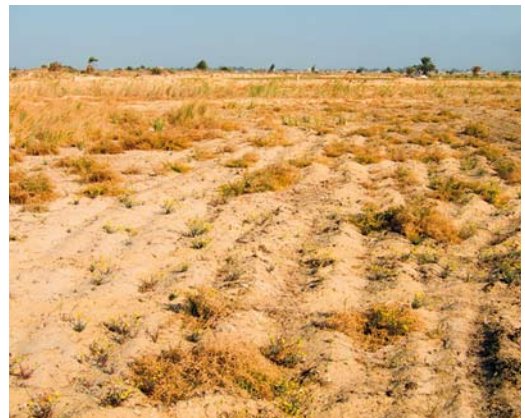
293 Habitat where Chestnut-bellied Sandgrouse Pterocles exustus were observed, Al Bahnasa, Minya, Egypt, 21 March 2012

Male and female Chestnut-bellied Sandgrouse can be distinguished quite easily by the colour of the plumage. Males are more uniform on head and breast and show a sharply demarcated black line across the upperbreast. Face and throat are yellowish, contrasting little with a more greyish crown, neck and breast. Females have a heavily mottled breast and neck and lack the black line across the breast. The upperparts are less vividly colored and more mottled in females than in males. The subspecies P e floweri , which might be expected in the region, differs from other subspecies slightly in colour (Meintertzhagen 1930, Madge & McGowan 2002; Nicoll in British Ornithologists' Club 1921). Based on distribution