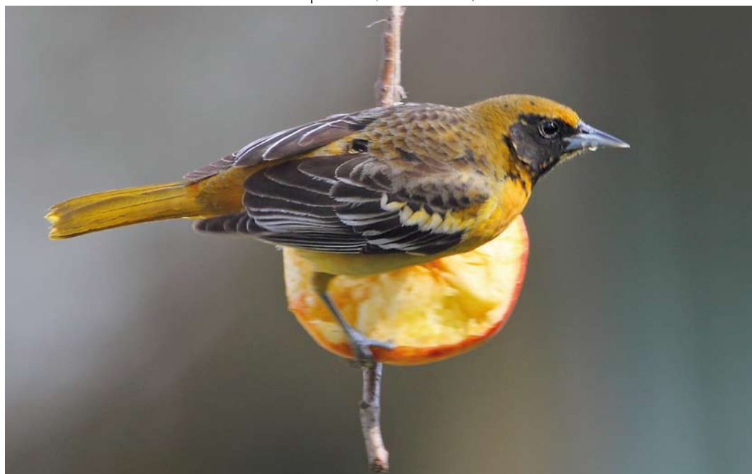
319 Baltimoretroepiaal / Baltimore Oriole Icterus galbula , eerstejaars mannetje, Oudorp, Alkmaar, Noord-Holland, 13 april 2010 ( Eric Menkveld )