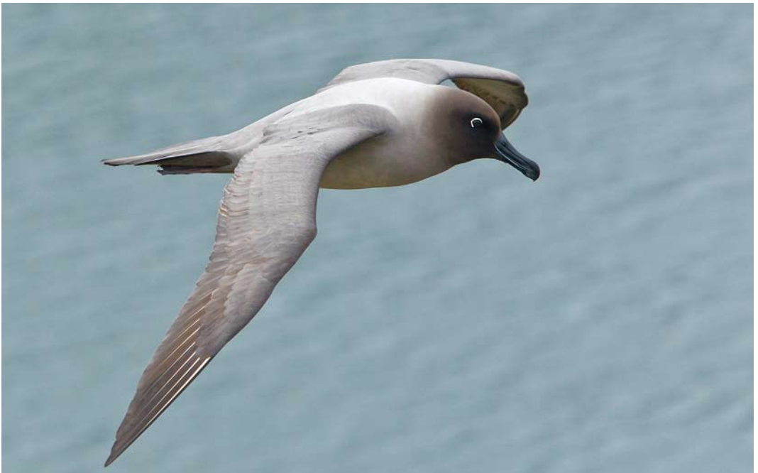
335 Light-mantled Albatross / Roetkopalbatros Phoebetria palpebrata , adult, Elsenhul, South Georgia, 12 November 2010 ( Otto Plantema )