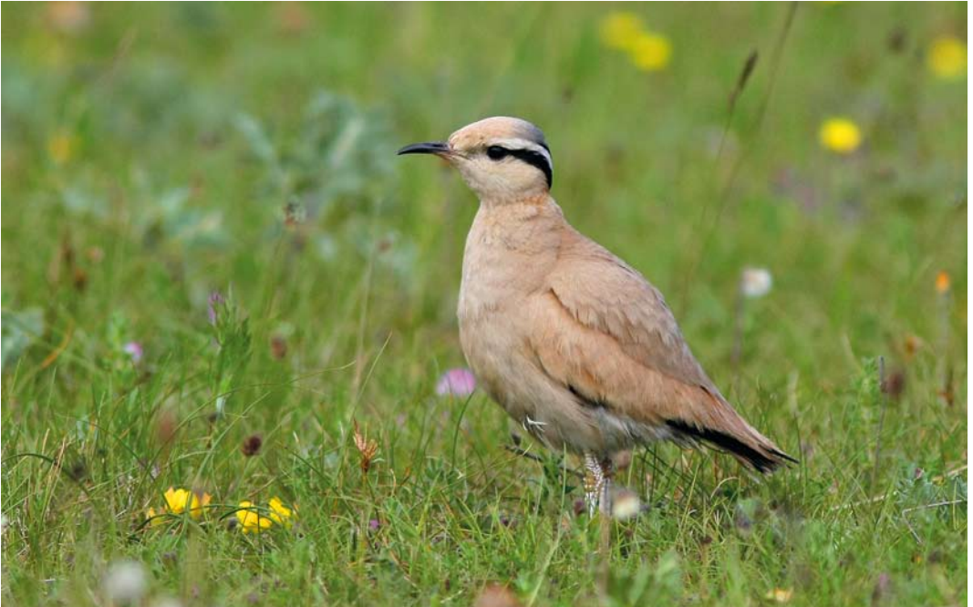
348 Cream-colored Courser / Renvogel Cursorius cursor , Lampaul-Ploudalmézeau, Finistère, France, 30 June 2012 (Christian Kerihuel)