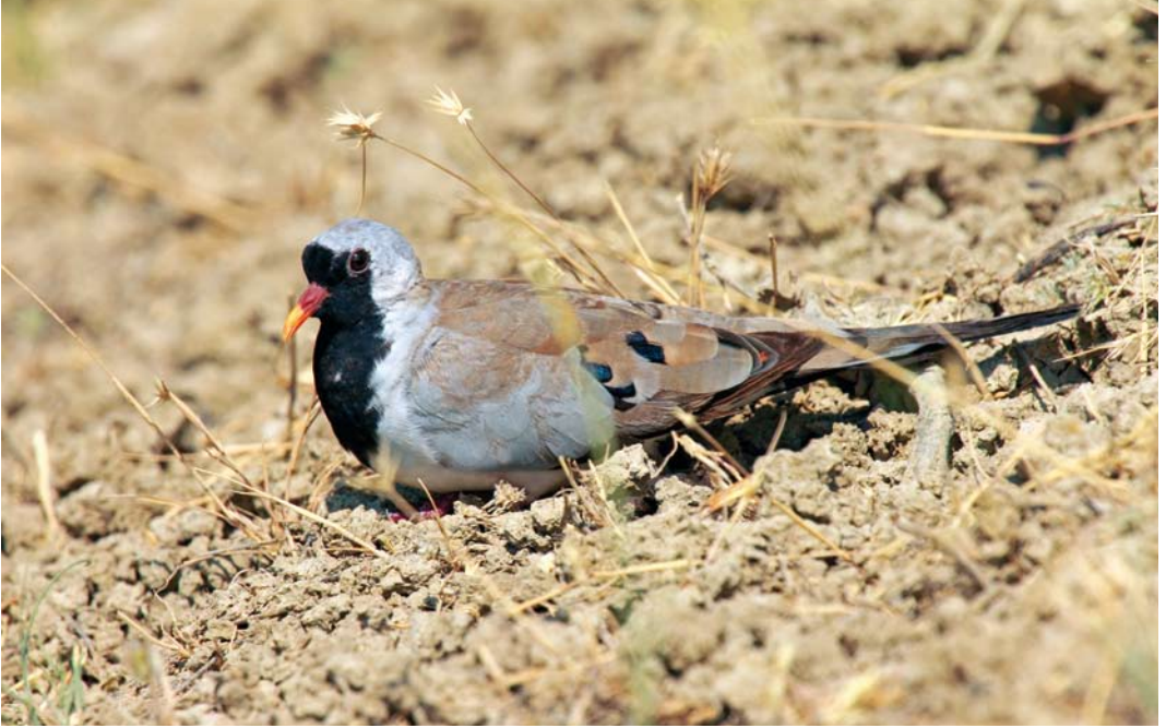
350 Namaqua Dove / Maskerduif Oena capensis , male, Çöl Gölü, Ankara, Turkey, 27 June 2012 (Emin Yoğurtçuoğlu)