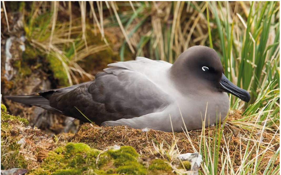
336 Light-mantled Albatross / Roetkopalbatros Phoebetria palpebrata , adult, Elsenhul, South Georgia, 13 November 2010

Tristan Albatross is very similar in plumage to Snowy Albatross and both species are almost indistinguishable in the field, although Tristan is generally smaller and darker, with a shorter bill. Tristan's breeding population is now restricted to Gough, although in some years a pair breeds on Inaccessible Island. Recently, adults flying over the remote southern part of Tristan fostered hope that the species may return or even may have returned to breed unseen on the rugged remote side of the island. The species nests at 400-700 m altitude, primarily in wet peat, where it is open enough for take-off and landings. It is a colonial, biennially breeding species. Adults return in November and lay eggs in January and chicks fledge in November. The population has been estimated at c 1700 breeding pairs (c 7100 individuals). Counts suggest a continuing population decrease and the species is now listed as 'Critically Endangered' (IUCN 2012). The large colonies on Tristan da Cunha were extirpated due to predation by introduced pigs and rats, while the early settlers (since 1816) caught birds for food. Predation of chicks by the introduced House Mice Mus musculus on Gough, observed since 2000,