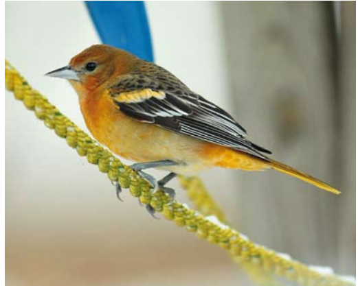
317 Baltimoretroepiaal / Baltimore Oriole Icterus galbula , eerstejaars mannetje, Oudorp, Alkmaar, Noord-Holland, 6 januari 2010

VLEUGEL Middelste dekveren licht oranjebruin met witte top, brede witte baan vormend. Basale deel van middelste dekveren zwart (in zit meestal verborgen onder schouderveren). Grote dekveren zwart met smalle witte buitenvlag en aan buitenzijde top brede witte zoom, tweede vleugelstreep vormend. Witte top aanzienlijk korter dan halve veerlengte. Grote handdekveren zwart. Tertiaals, armpennen en handpennen zwart met heldere,