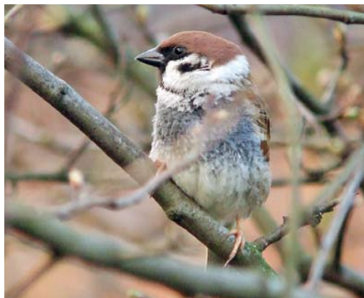
329 Ringmus / Eurasian Tree Sparrow Passer montanus , Cleasby, North Yorkshire, Engeland, 25 maart 2007

EURASIAN TREE SPARROWS WITH ABERRANT PLUMAGE AT MAKKUM IN 2009/10 Around Christmas 2009, four to six ab-