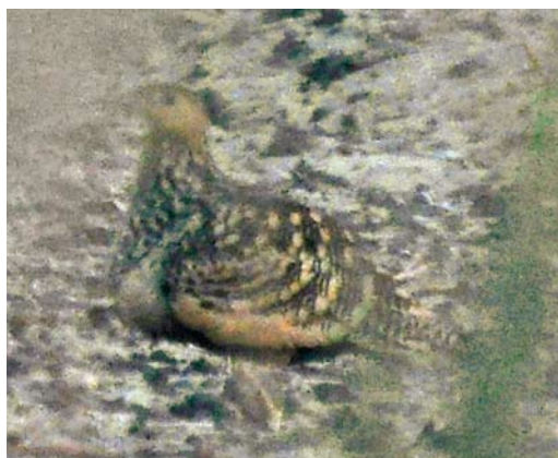
294 Chestnut-bellied Sandgrouse / Roodbuikzandhoen Pterocles exustus , male, Al Bahnasa, Minya, Egypt, 30 March 2012 ( Elias Stich ) 295 Chestnut-bellied Sandgrouse / Roodbuikzandhoen Pterocles exustus , male, Al Bahnasa, Minya, Egypt, 2 April 2012 ( Elias Stich ) 296 Chestnut-bellied Sandgrouse / Roodbuikzandhoen Pterocles exustus , male, Al Bahnasa, Minya, Egypt, 22 March 2012 ( Jonas Geburzi ) 297 Chestnut-bellied Sandgrouse / Roodbuikzandhoen Pterocles exustus , female, Al Bahnasa, Minya, Egypt, 22 March 2012 ( Jonas Geburzi )

and the overall greyish tones visible in plate 294-297, we strongly suspect the birds to belong to this subspecies. However, the verification should be left open for upcoming studies and will require studies of birds in the hand. If the identification of floweri is confirmed, our records refute the presumed extinction of this taxon.