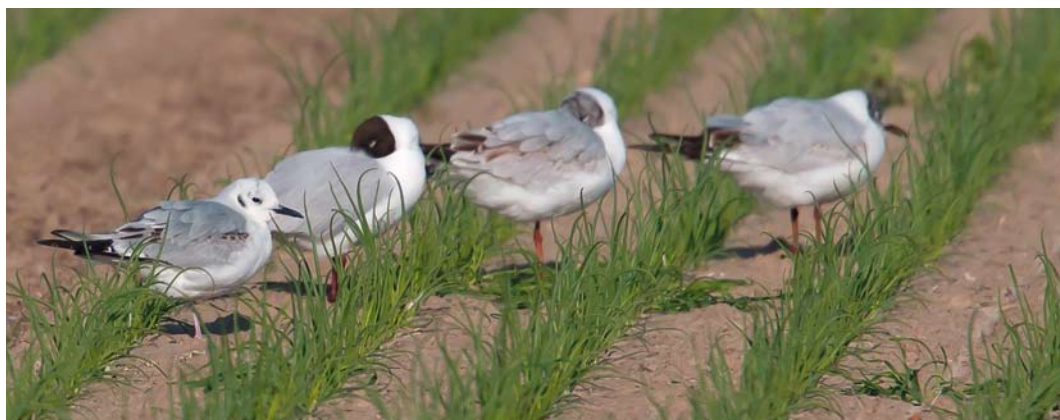
322 Kleine Kokmeeuw / Bonaparte's Gull Chroicocephalus philadelphia , eerste-zomer, De Cocksdoorp, Texel, Noord-Holland, 6 juni 2012 (Jos van den Berg) 323 Kleine Kokmeeuw / Bonaparte's Gull Chroicocephalus philadelphia , eerste-zomer, De Cocksdoorp, Texel, Noord-Holland, 8 juni 2012 (René Pop) 324 Kleine Kokmeeuw / Bonaparte's Gull Chroicocephalus philadelphia , eerste-zomer, met Kokmeeuwen / Black-headed Gulls C. ridibundus , De Cocksdoorp, Texel, Noord-Holland, 5 juni 2012 (Jos van den Berg)

ter en vlogen richting land en even later volgde het bericht dat de Kleine Kokmeeuw was teruggevonden op de akker bij de waterzuivering. Daar konden enkele 10-tallen vogelaars hem bekijken. Even later vloog hij weer het wad op; de laatkomers konden hem daar gelukkig nog bekijken, zij het op enige afstand. Een aantal vogelaars overnachtte op het eiland en zij konden de volgende ochtend direct weer aanschuiven; de Kleine Kokmeeuw was al vroeg weer aanwezig bij de Robbenjager en later op het Renvogelveld. Daarna verdween hij weer het wad op, om eind van de middag weer kortstondig op het Renvogelveld te verschijnen en 's avonds pas weer om 21:15 bij de waterzuivering. De volgende dag (7 juni) was er alleen een korte waarneming in de middag en vervolgens