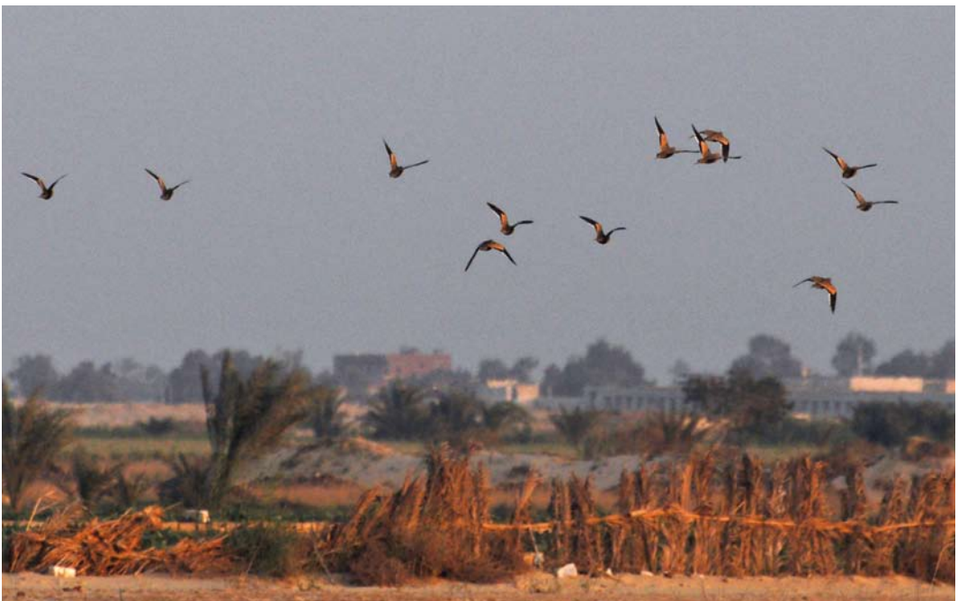
292 Chestnut-bellied Sandgrouse / Roodbuikzandhoenders Pterocles exustus , Al Bahnasa, Minya, Egypt, 22 March 2012

After the team left the country in late March and had been replaced by another team, more observations followed until the end of May; all observations are listed in table 1. On 17 May, sound-re-