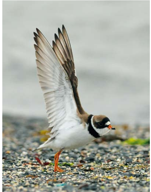
360 Northern Carmine Bee-eater / Noordelijke Karmijnrode Bijeneter Merops nubicus , Öland, Sweden, 2 June 2012 ( Christian Cederroth ) 361 Semipalmated Plover / Amerikaanse Bontbekplevier Charadrius semipalmatus , adult summer, Vardø, Finnmark, Norway, 4 July 2012 ( Tormod Amundsen ) 362 European Roller / Scharrelaar Coracias garulus , adult male, Aldbrough, East Yorkshire, England, 5 June 2012 ( Rebecca Nason )