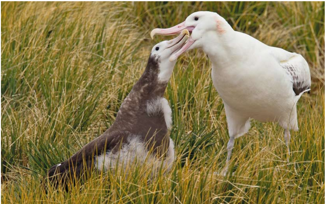
330 Snowy Albatrosses / Grote Albatrossen Diomedea exulans , adult and juvenile, Prion Island, South Georgia, 16 November 2010

A decline of the breeding population of all albatross species is a general trend, mainly because of widespread non-regulated fishery (cf Jiménez et al 2009, IUCN 2012). Most species have lost 60-75% of the population within three generations (75-90 years). Also introduced cats, mice, pigs and rats