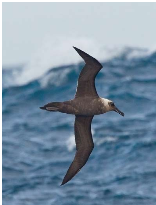
338 Sooty Albatross / Zwarte Albatros Phoebastria fusca , immature, at sea, south of Gough, 10 April 2011

has led to a very low fledging success of c 15%. The mice are gnawing at the chick's body until they eventually die through blood loss, infection or destruction of vital organs. These House Mice have increased in weight, from 15 g to 'giants' up to 40 g. An eradication programme for the mice is underway. This would certainly be the largest such effort undertaken to date. Longline fishing also kills an estimated 500 individuals every year. As a result, the species is under strong pressure and is therefore qualified as 'Critically Endangered' (IUCN 2012).