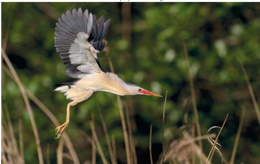
367 Woudaap / Little Bittern Ixobrychus minutus , mannetje, Zevenhuizen, Zuid-Holland, 25 mei 2012