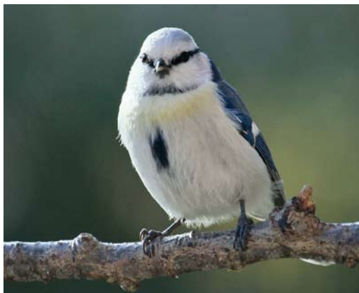
309 Hybrid Azure x European Blue Tit / hybride Azuurmees x Pimpelmees Cyanistes cyanus x caeruleus , Grans, Bouches-du-Rhône, France, 24 December 2010