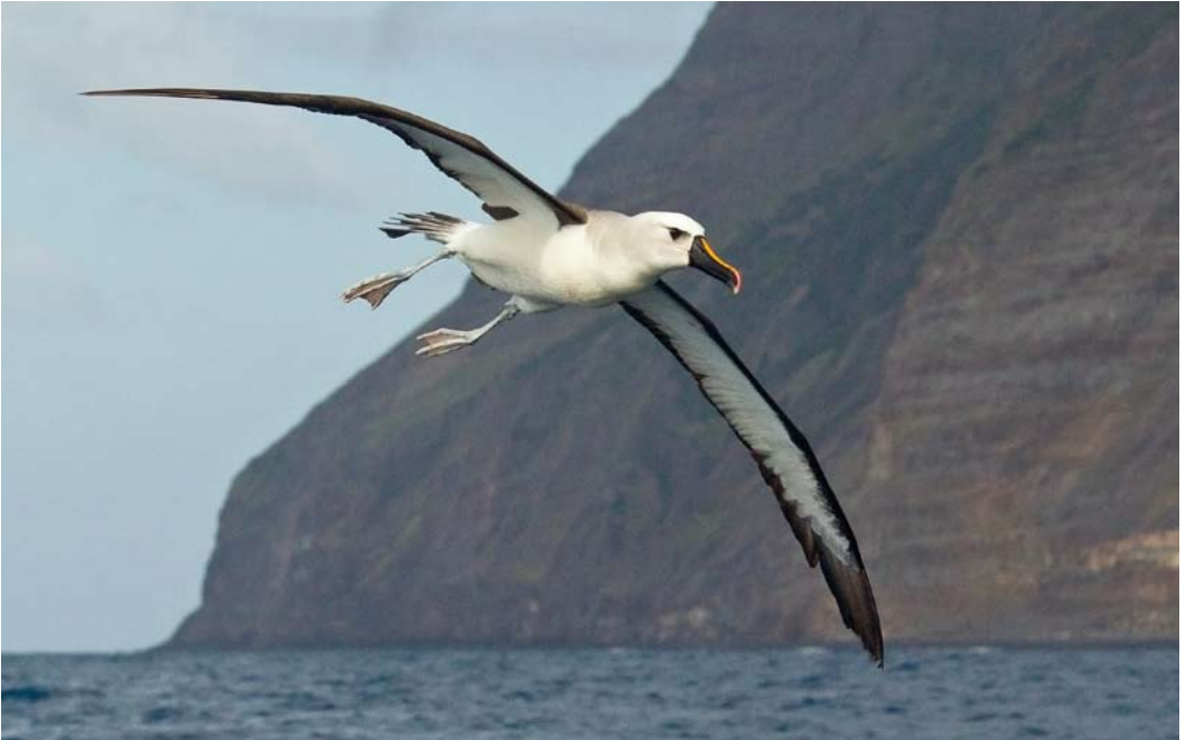
339-340 Atlantic Yellow-nosed Albatross / Atlantische Geelsnavelalbatros Thalassarche chlororhynchos , adult, Tristan da Cunha, 14 April 2011 (Otto Plantema)