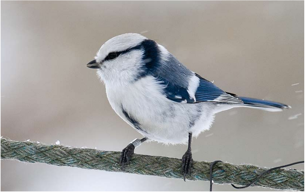
307-308 Hybrid Azure x European Blue Tit / hybride Azuurmees x Pimpelmees Cyanistes cyanus x caeruleus , Kuusamo Sossonniemi, Finland, 3 March 2007. This individual could be a second-generation hybrid since it was so similar to Azure Tit.