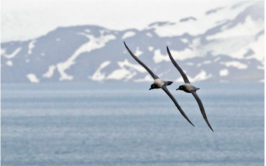
334 Light-mantled Albatrosses / Roetkopalbatrossen Phoebetria palpebrata , adult, Elsenhul, South Georgia, 16 November 2010