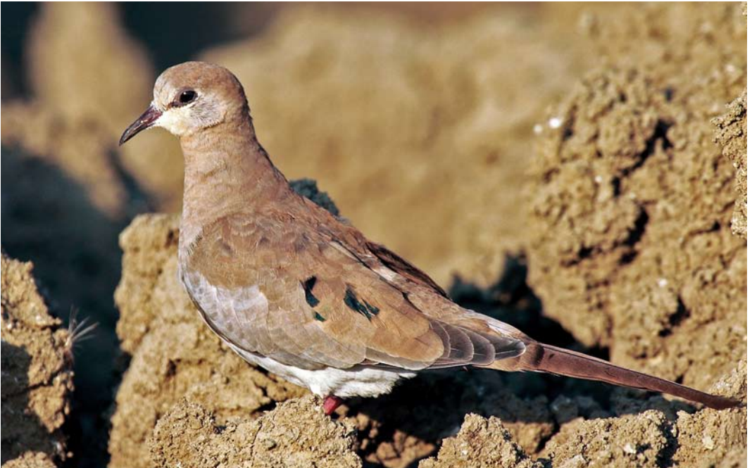
351 Namaqua Dove / Maskerduif Oena capensis , female, Çöl Gölü, Ankara, Turkey, 27 June 2012 (Emin Yoğurtçuoğlu)