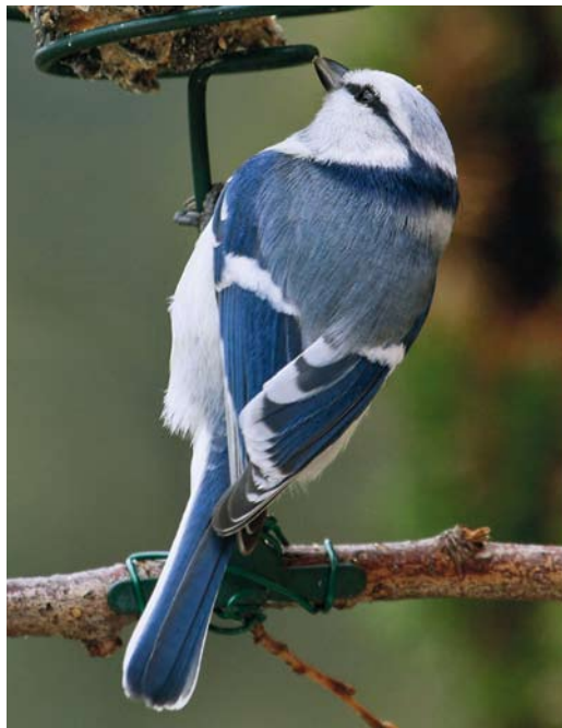
300 Azure Tit / Azuurmees Cyanistes cyanus , Polesie, Belarus, 28 April 2010 ( Krzysztof Błachowiak ) 301 Hybrid Azure x European Blue Tit / hybride Azuurmees x Pimpelmees Cyanistes cyanus x caeruleus , Grans, Bouches-du-Rhône, France, 30 December 2010 ( Michel Carré ) 302 Hybrid Azure x European Blue Tit / hybride Azuurmees x Pimpelmees Cyanistes cyanus x caeruleus , Grans, Bouches-du-Rhône, France, 3 January 2011 ( Michel Carré )