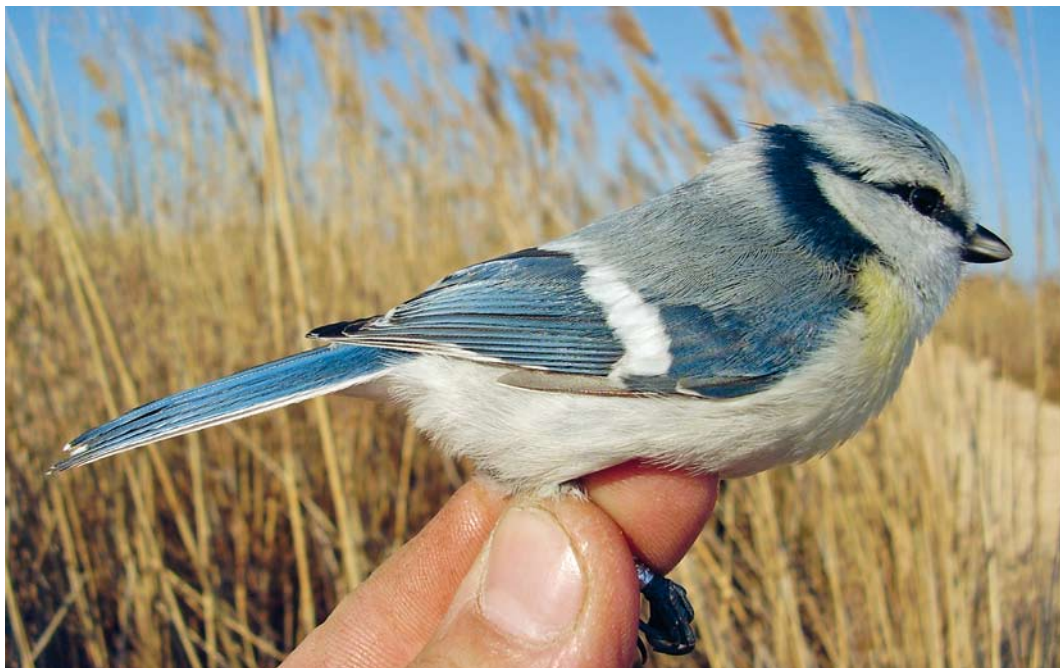
305 Hybrid Azure x European Blue Tit / hybride Azuurmees x Pimpelmees Cyanistes cyanus x caeruleus , Vransko Jezero, Dalmacija, Croatia, 7 January 2006 ( Ivica Lolič )