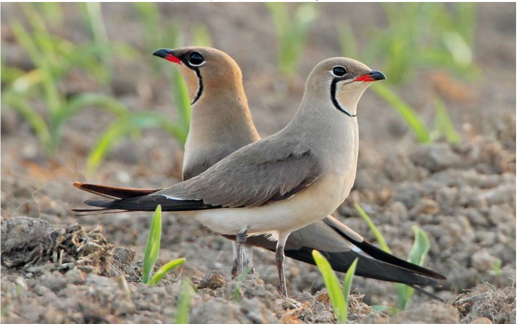
349 Collared Pratincoles / Vorkstaartplevieren Glareola pratincola , adult summer, Wersabe, Niedersachsen, Germany, 21 May 2012