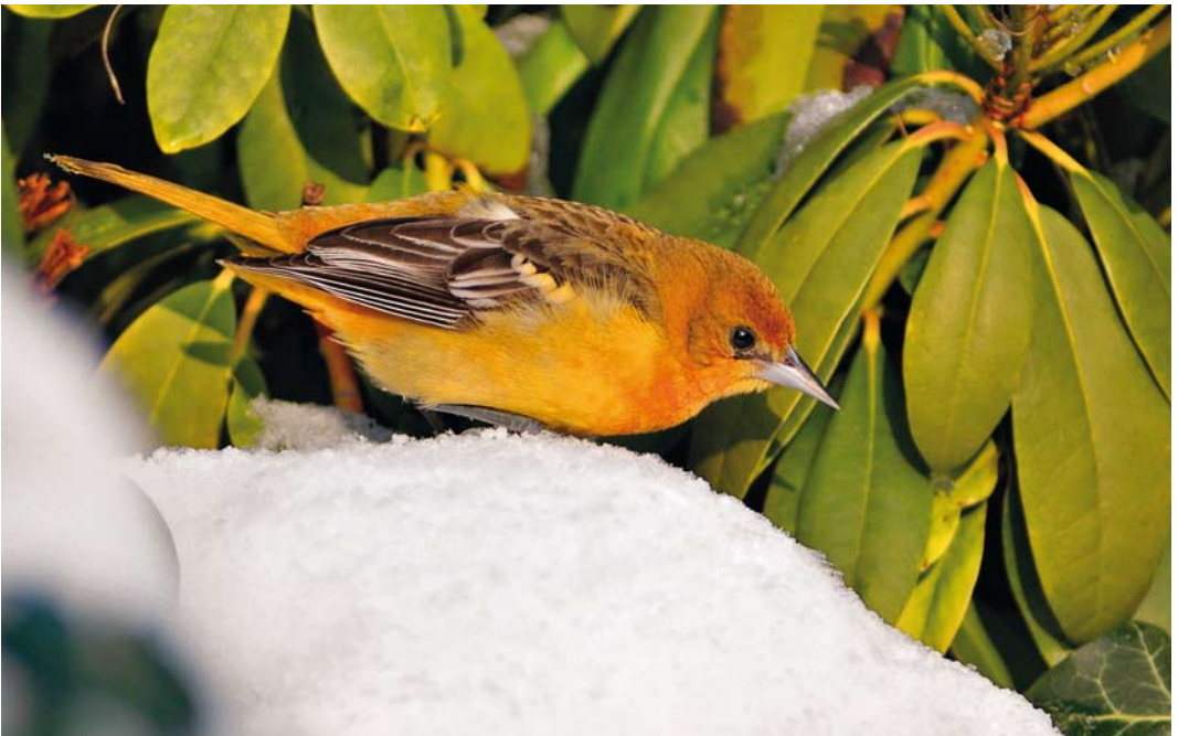
316 Baltimoretroepiaal / Baltimore Oriole Icterus galbula , eerstejaars mannetje, Oudorp, Alkmaar, Noord-Holland, 7 januari 2010

Op 5 januari was het spekglad in Oudorp. In de loop van de ochtend werd de troepiaal herondekt door Debby Doodeman in een den aan de Istriastraat. Deze dag werd hij ondanks de moeilijke omstandigheden regelmatig gezien door 150-200 vogelaars. De volgende dagen kwamen hij en de gladde twitch uitgebreid in het (landelijke) nieuws. Dit zorgde voor extra belangstelling en de periode daarna werd de troepiaal dagelijks gezien door 10-tallen vogelaars in een klein gebied met tuinen met veel vogelvoer (Argeloo 2010). In februari en begin maart werd hij nog regelmatig maar minder frequent waargenomen. Vervolgens werd hij op 28 maart opnieuw gemeld en bleef hij tot en met 14 april. In deze laatste periode trok hij door het doorkomende eerste-zomerkleed en de zangactiviteit nog wat extra belangstelling. Later bleek dat de vogel in ieder geval al vanaf begin december 2009 aanwezig was. De eerste documentatie (beschrijving) dateert van