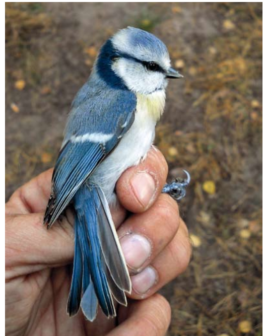
313 Hybrid Azure x European Blue Tit / hybride Azuurmees x Pimpelmees Cyanistes cyanus x caeruleus , Kopań, Zachodniopomorskie, Poland, 22 October 2011 ( Michał Polakowski )

De verhouding in het aantal gevallen van Azuurmees en Pleskes Mees is sterk veranderd, van 9:1 vóór 1990 (90 gevallen van Azuurmees versus 11 van Pleskes) tot 2:1 in 1990-2010 (29 gevallen van Azuurmees vs 11 van Pleskes). Mogelijk zijn in het verleden Pleskes Mezen ten onrechte als Azuurmees gedetermineerd. De toegevoegde kennis van determinatietekens, fotografische documentatie en oplettendheid van vogelaars heb-