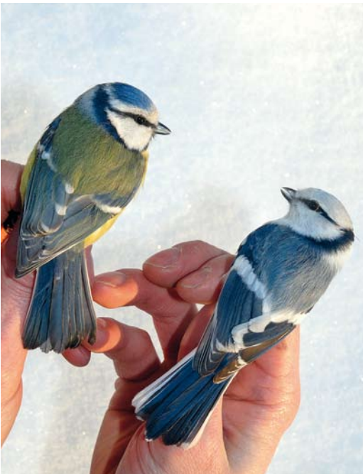
312 Hybrid Azure x European Blue Tit / hybride Azuurmees x Pimpelmees Cyanistes cyanus x caeruleus (right), with European Blue Tit / Pimpelmees, Kuusamo Sossonniemi, Finland, 3 March 2007

20e eeuw. In de laatste decennia is het aantal gevallen in Midden-Europa sterk afgenomen, met in de laatste 20 jaar slechts 29, voornamelijk in Finland en Polen.