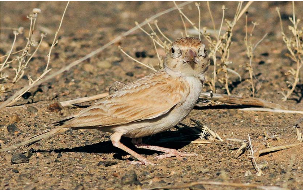
364 African Dunn's Lark / Afrikaanse Dunns Leeuwerik Eremalauda dunnii dunnii , Merzouga, Morocco, 7 June 2012 (Paul French)