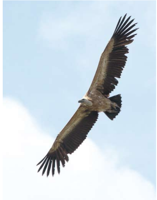
368 Bergfluitier / Western Bonelli's Warbler Phylloscopus bonelli , Veluwezoom, Rheden, Gelderland, 13 juni (Roland Jansen) 369 Vale Gier / Griffon Vulture Gyps fulvus , tweede kalenderjaar, Sint Pietersberg, Maastricht, Limburg, 26 juni 2012 (Ger de Hoog) 370 Grauwe Fitis / Greenish Warbler Phylloscopus trochiloides , Rottumeroog, Groningen, 13 juni 2012 (Martijn Bunskoek)