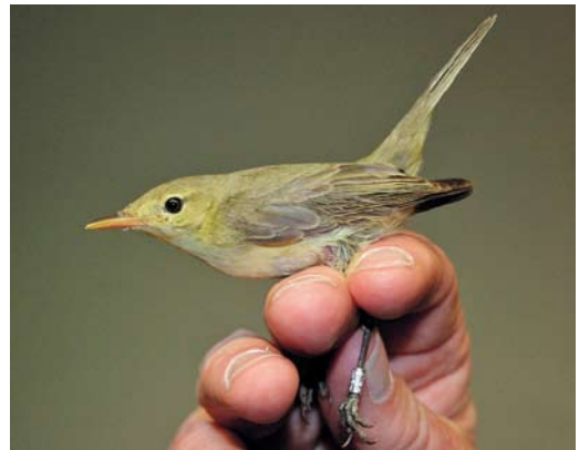
356 White-rumped Sandpiper / Bonapartes Strandloper Calidris fuscicollis , summer plumage, Świnoujście, Poland, 4 July 2012 357 Western Sandpiper / Alaskastrandloper Calidris mauri , first-summer, with Dunlin / Bonte Strandloper C alpina , Västerstadsviken, Öland, Sweden, 15 July 2012 358 Common Buttonquail / Gestreepte Vechtkwartel Turnix sylvaticus , near El Jadida, Morocco, 3 June 2012 359 Melodious Warbler / Orpheusspottvogel Hippolais polyglotta , Blåvandshuk, Vestjylland, Denmark, 18 June 2012

SKUAS TO TERNS On 14 June, an adult pale-morph South Polar Skua Stercorarius maccormicki was photographed off Desertas, Madeira. In the Netherlands, the first-summer Bonaparte's Gull Chroicocephalus philadelphia at De Cocksdoorp, Texel, Noord-Holland, from 4 June stayed until at least 18 June; it was considered the same bird first seen at Den Helder on 3 May and on Texel on 4 May. The first for northern Iceland was an adult at Kaldbakstjarnir, Húsavík, on 6 June. The first Franklin's Gull Larus pipixcan for Kuwait was an adult photographed at Jahra East on 5-7 June. In Denmark, 15 Baltic Gulls L fuscus fuscus at the Bornholm breeding sites had eight nestlings by 28 June. A colour-ring project over a 14-year period showed that the Bay of Biscay is an important non-breeding area for Yellow-legged Gulls L michahellis from the western half of the Mediterranean, where this species' population may be regarded as partially migratory (Ring- ing & Migration 27: 26-31 2012). The first breeding of Caspian Gull L cachinnans for the Netherlands concerned a male paired with a female Herring Gull L argentatus