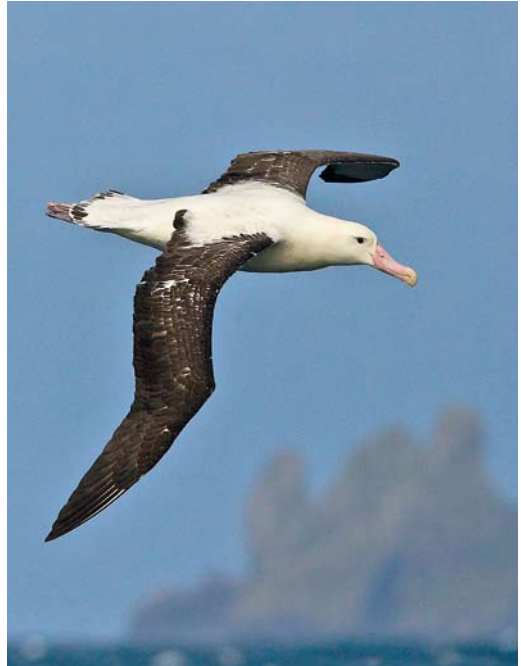
331 Snowy Albatross / Grote Albatros Diomedea exulans , Prion Island, South Georgia, 3 April 2011 (Otto Plantema) 332-333 Tristan Albatross / Tristanalbatros Diomedea dabbenena , Gough, 11 April 2011 (Otto Plantema)