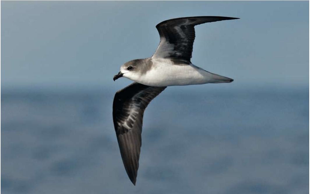
224 Zino's Petrel / Freira Pterodroma madeira , off Madeira, 18 May 2012 (René Pop)