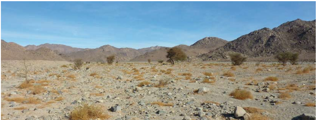
219-220 Asian Desert Warbler / Woestijngrasmus Sylvia nana , Arkno mountains, Libyan Desert, Libya, 3 January 2011 (Jens Hering) 221 Wintering habitat of Asian Desert Warbler Sylvia nana , Arkno mountains, Libyan Desert, Libya, 3 January 2011 (Jens Hering)