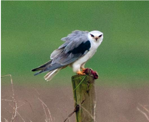
290 Grijze Wouw / Black-winged Kite Elanus caeruleus , tweede kalenderjaar, Keent, Noord-Brabant, 12 april 2012