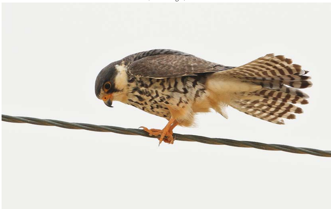
227 Amur Falcon / Amoerrootpootvalk Falco amurensis , female, Jahra East Outfall, Kuwait, 13 May 2012