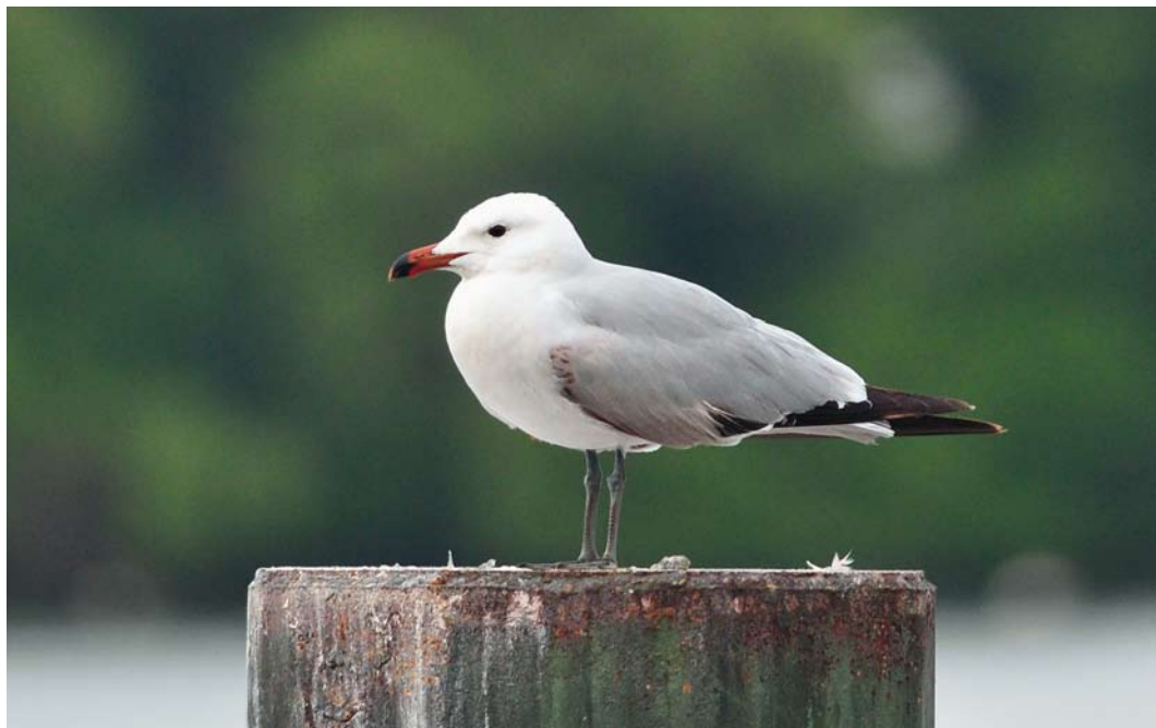
230 Audouin's Gull / Audouins Meeuw Larus audouinii , Tegeler See, Berlin, Germany, 7 May 2012