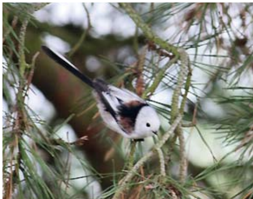
207 White-headed Long-tailed Tit / Witkopstaartmees Aegithalos caudatus caudatus , Loozerheide, Noord- Brabant, Netherlands, 29 October 2010 (Ruud Bouwman)

us (hierna europaeus ) die in West-Europa broeden. In dit artikel worden de resultaten van systematisch onderzoek beschreven. Daartoe werden alle (digitaal) met foto's gepubliceerde waarnemingen (voornamelijk van www.waarneming.nl , aangevuld met www.dutchbirding.nl en www.birdpix.nl ) bestudeerd. In totaal werden 168 caudatus vergeleken met 281 europaeus en 50 intermediaire vogels (hier als derde groep opgevat). Daarnaast werd onderzoek gedaan aan de geluiden van beide ondersoorten en bij de ringvangsten aan de biometrie.