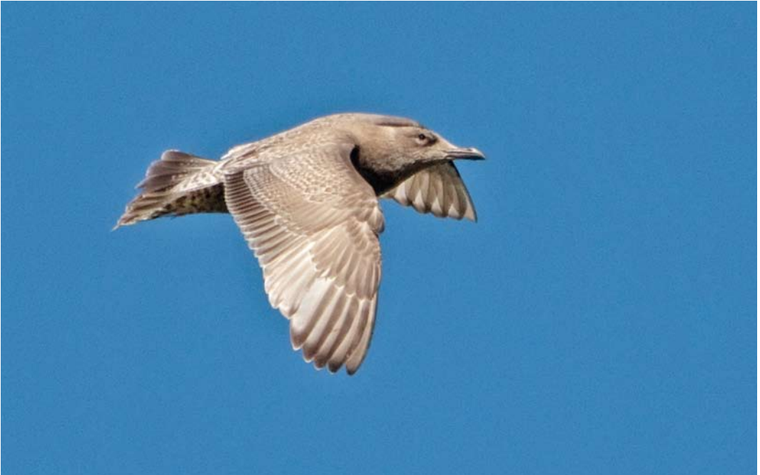
228 Thayer's Gull / Thayers Meeuw Larus thayeri , first-winter, Elsham, Lincolnshire, England, 5 April 2012