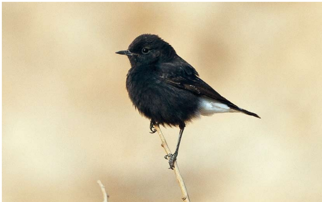
251 Basalt Wheatear / Basalttapuit Oenanthe lugens warriae , Uvda valley, Israel, 29 March 2012 (Yoav Perlman)