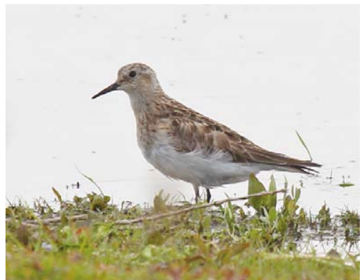
284 Withalsvliegenvanger / Collared Flycatcher Ficedula albicollis , mannetje, Vinkel, Noord-Brabant, 24 mei 2012 ( Bas van de Meulengraaf ) 285 Kleine Klapetekster / Lesser Grey Shrike Lanius minor , Science Park, Amsterdam, Noord-Holland, 14 mei 2012 ( Cock Reijnders ) 286 Roodkopklauwier / Woodchat Shrike Lanius senator , Voorboezem, Wieringen, Noord-Holland, 3 mei 2012 ( Co van der Wardt ) 287 Citroenkwikstaarten / Citrine Wagtails Motacilla citreola , vrouwtjes, Azewijn, Gendringen, Gelderland, 30 april 2012 ( Wim Gerritsen ) 288 Aziatische Goudplevier / Pacific Golden Plover Pluvialis fulva , Middelburg, Zeeland, 20 mei 2012 ( Vincent Legrand ) 289 Bairds Strandloper / Baird's Sandpiper Calidris bairdii , Deventer, Overijssel, 17 mei 2012 ( Wietze Janse )