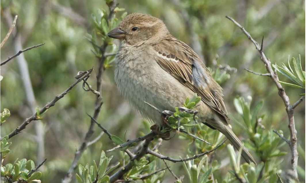
208 Spaanse Mus / Spanish Sparrow Passer hispaniolensis , vrouwtje, IJmuiden, Noord-Holland, 6 mei 2010 ( Jacob Garvelink ). Let op open gezicht, herinnerend aan Roodmus Carpodacus erythrinus , forse snavel en vrij puntige kruin met donkere schachtstrepen / Note open face, reminiscent of Common Rosefinch Carpodacus erythrinus , heavy bill and rather peaked crown with dark shaft-streaks. 209 Spaanse Mus / Spanish Sparrow Passer hispaniolensis , vrouwtje, IJmuiden, Noord-Holland, 6 mei 2010 ( Jacob Garvelink ). Let op crèmekleurige randen aan grote dekveren, tertials en hand- en armpennen en donker centrum en schachtstreep van bovenstaartdekveren / Note sandy-grey fringes of greater coverts, tertials and remiges and dark centre and shaft-streak of uppertail-coverts.