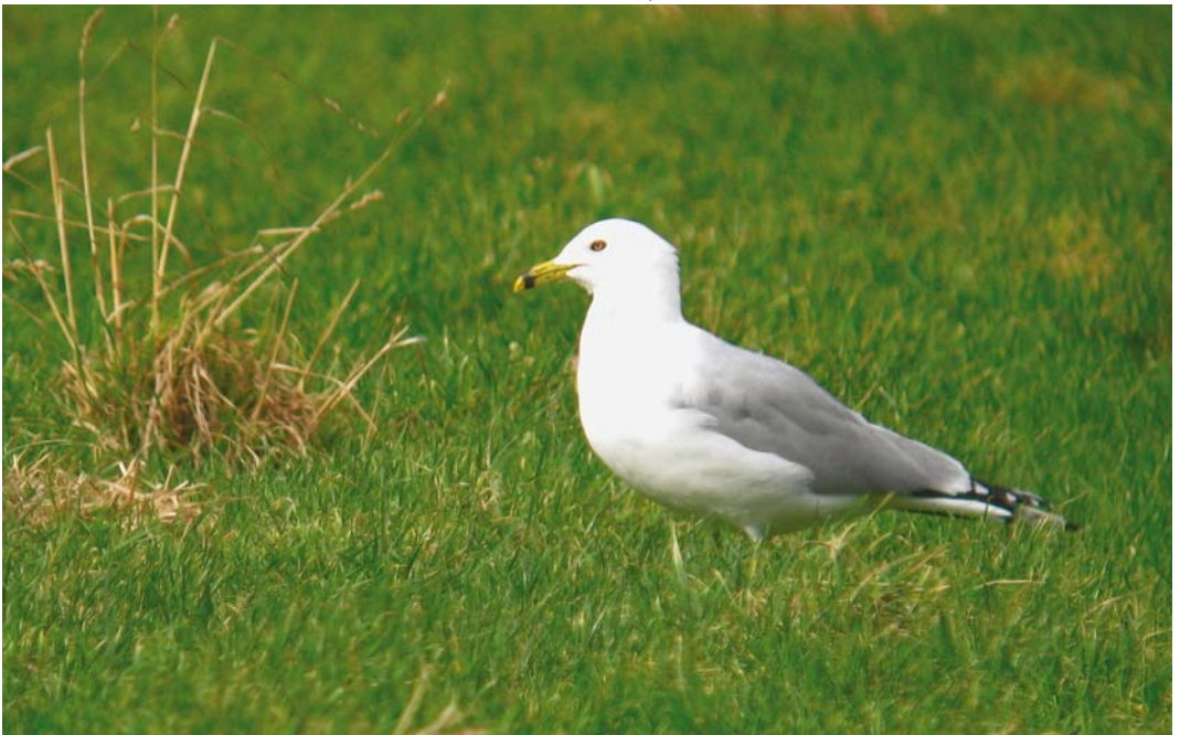
231 Ring-billed Gull / Ringsnavelmeeuw Larus delawarensis , adult (PAA3), Maaseik, Limburg, Belgium, 6 March 2012 (Emiel Opdenacker)