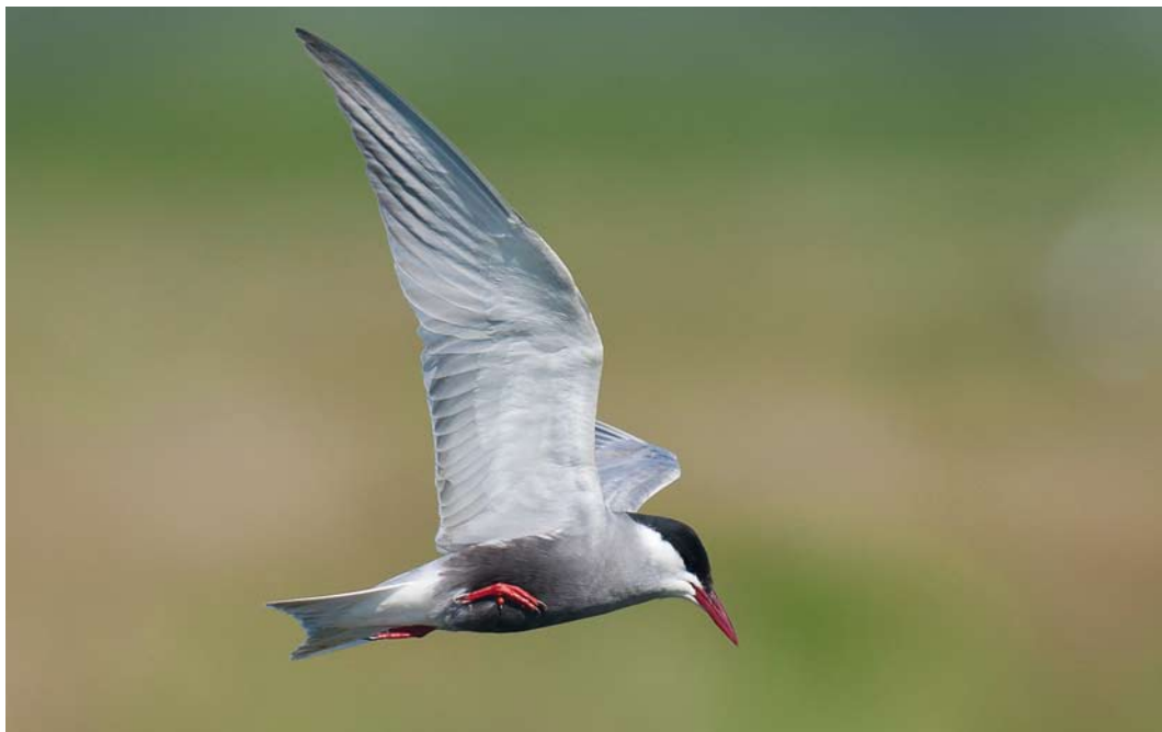
258 Witwangstern / Whiskered Tern Chlidonias hybrida , Kropswolderbuitenpolder, Groningen, 26 mei 2012 (Arnold W J Meijer)