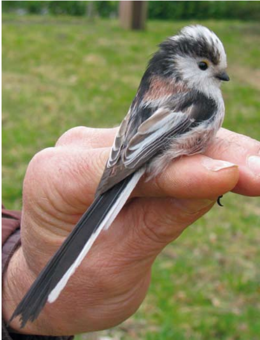
198 Central European Long-tailed Tit / Staartmees Aegithalos caudatus europaeus , Robbenoordbos, Wieringermeer, Noord-Holland, Netherlands, 13 March 2011 (Klaas van den Berg). Typical individual. Note predominance of dark over white in tertials.