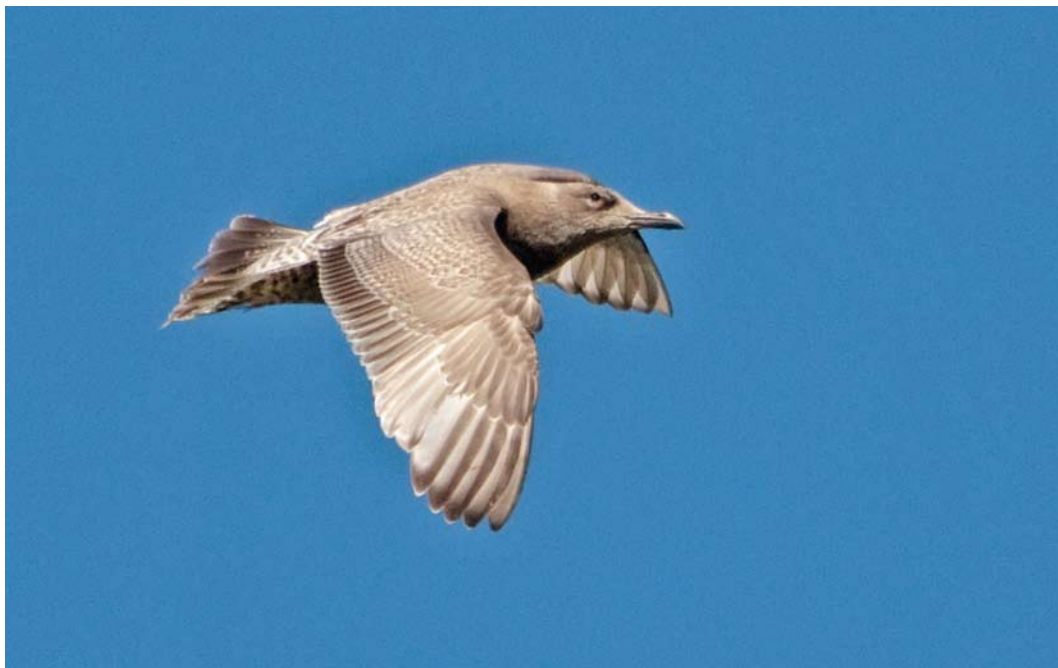
228 Thayer's Gull / Thayers Meeuw Larus thayeri , first-winter, Elsham, Lincolnshire, England, 5 April 2012