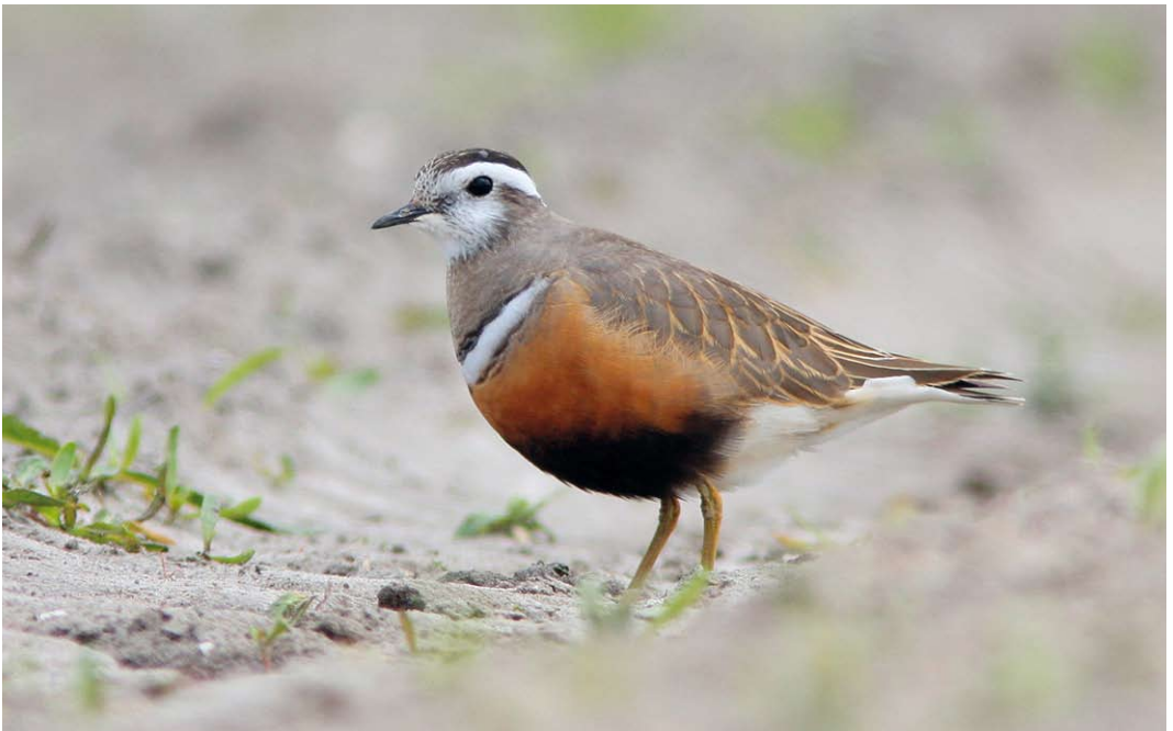
266 Morinelplevier / Eurasian Dotterel Charadrius morinellus , mannetje, Texel, Noord-Holland, 6 mei 2012 (Rob Half)