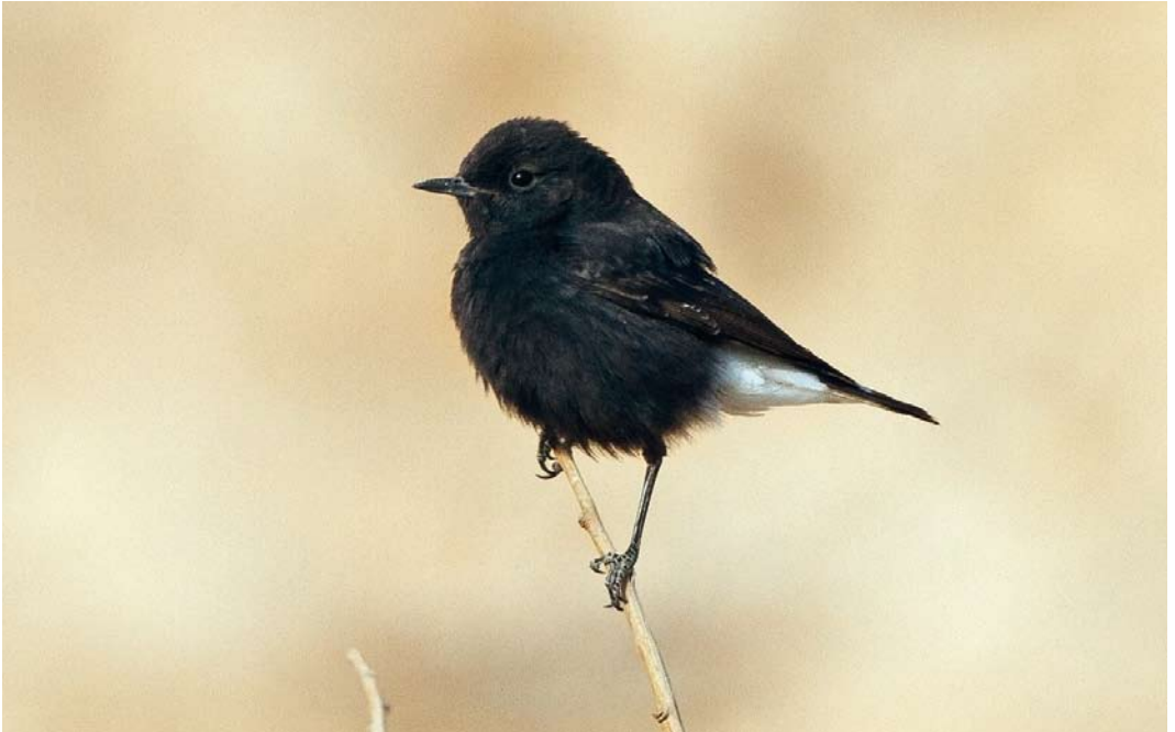
251 Basalt Wheatear / Basalttapuit Oenanthe lugens warriae , Uvda valley, Israel, 29 March 2012 (Yoav Perlman)