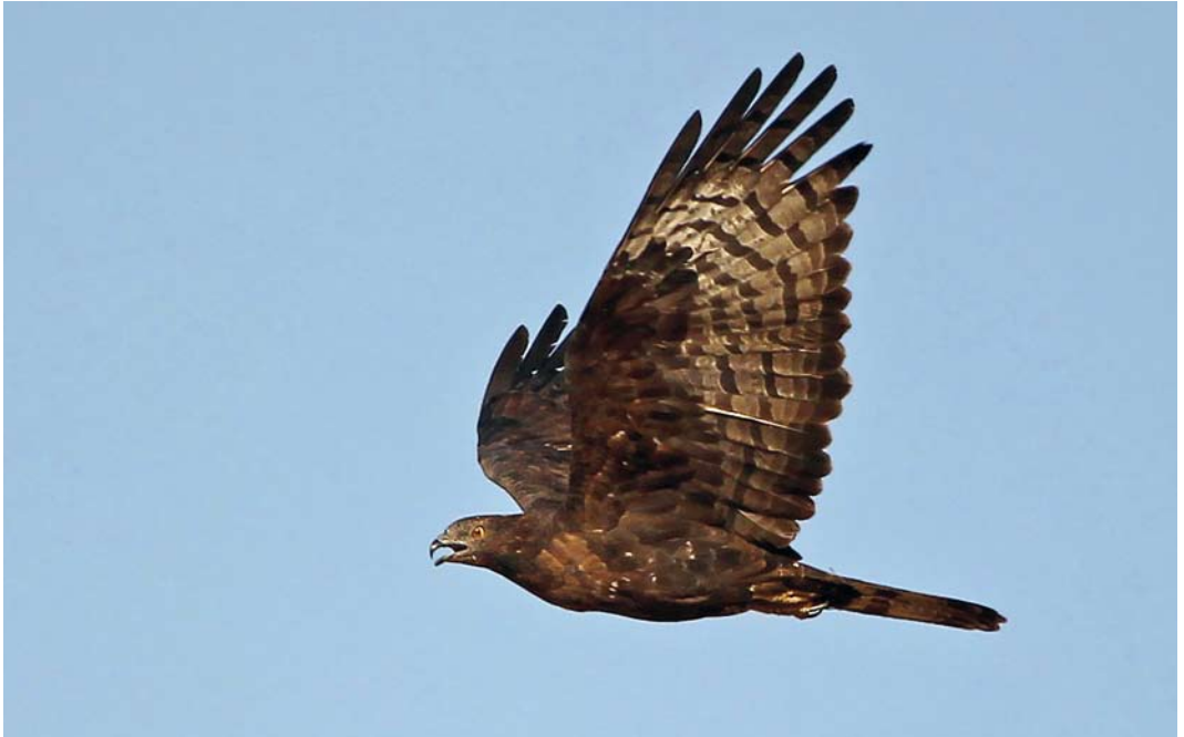
226 Crested Honey Buzzard / Aziatische Wespensdief Pernis ptilorhynchus , Eilat, Israel, 8 April 2012