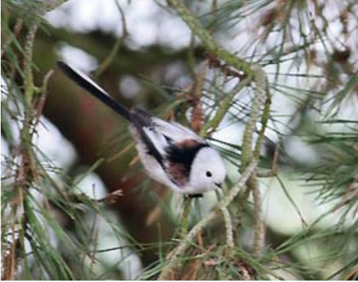
207 White-headed Long-tailed Tit / Witkopstaartmees Aegithalos caudatus caudatus , Loozerheide, Noord- Brabant, Netherlands, 29 October 2010

us (hierna europaeus ) die in West-Europa broeden. In dit artikel worden de resultaten van systematisch onderzoek beschreven. Daartoe werden alle (digitaal) met foto's gepubliceerde waarnemingen (voornamelijk van www.waarneming.nl , aangevuld met www.dutchbirding.nl en www.birdpix.nl ) bestudeerd. In totaal werden 168 caudatus vergeleken met 281 europaeus en 50 intermediaire vogels (hier als derde groep opgevat). Daarnaast werd onderzoek gedaan aan de geluiden van beide ondersoorten en bij de ringvangsten aan de biometrie.