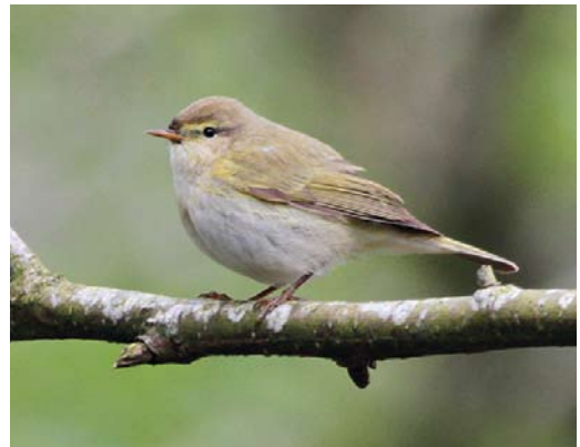
278 Baardgrasmus / Subalpine Warbler Sylvia cantillans , eerste-zomer mannetje, Den Helder, Noord-Holland, 6 mei 2012 ( Rob Halfj ) 279 Humes Bladkoning / Hume's Leaf Warbler Phylloscopus humei , Schiedam, Zuid-Holland, 20 maart 2012 ( Jan den Hertog ) 280 Bergfluitier / Western Bonelli's Warbler Phylloscopus bonelli , Westervoort, Gelderland, 2 mei 2012 ( Roland Wantia ) 281 Humes Bladkoning / Hume's Leaf Warbler Phylloscopus humei , Schiedam, Zuid-Holland, 24 maart 2012 ( Paul Cools ) 282 Pallas' Boszanger / Pallas's Leaf Warbler Phylloscopus proregulus , Hilversum, Noord-Holland, 30 maart 2012 ( Jaap Denee ) 283 Iberische Tjiftjaf / Iberian Chiffchaff Phylloscopus ibericus , Drachten, Friesland, 22 april 2012 ( Alwin Borhem )