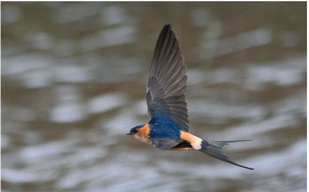
268 Roodstuitzwaluw / Red-rumped Swallow Cecropis daurica , Zeeburg, Texel, Noord-Holland, 7 mei 2012 (Laurens B Steijn)