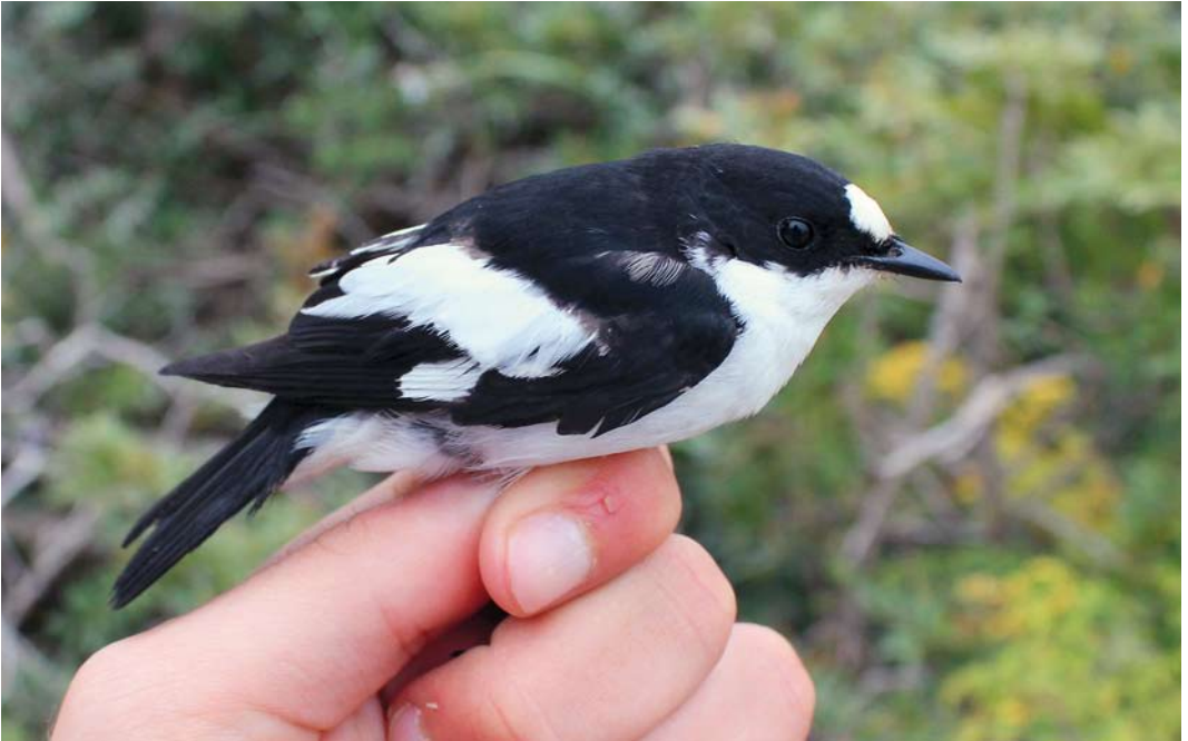
253 Atlas Flycatcher / Atlasvliegenvanger Ficedula speculigera , male, Comino, Malta, 15 April 2012 ( Raymond Galea ) 254 Trumpeter Finch / Woestijnvink Bucanetes githagineus , female, Migra Ferha, Malta, 7 May 2012 ( Raymond Galea ) 255 Western Orpheat Warbler / Westelijke Orpheusgrasmus Sylvia hortensis , Hartlepool Headland, Cleveland, England, 29 May 2012 ( Brian Clasper )