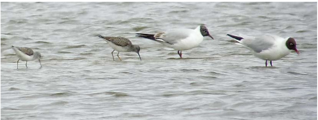
269 Lammergier / Bearded Vulture Gypaetus barbatus ('Jakob'), tweede kalenderjaar, De Muy, Texel, Noord-Holland, 17 mei 2012 270 Vorkstaartplevier / Collared Pratincole Glareola pratincola , Wormer- en Jisperveld, Noord-Holland, 23 mei 2012 271 Parelduiker / Black-throated Loon Gavia arctica , adult zomer, Ool, Limburg, 13 mei 2012 272 Kleine Kokmeeuw / Bonaparte's Gull Chroicocephalus philadelphia , eerste-zomer, Razende Bol, Noord-Holland, 3 mei 2012 273 Kleine Geelpootruiter / Lesser Yellowlegs Tringa flavipes en Poelruiter / Marsh Sandpiper T stagnatilis (links), met Kokmeeuwen / Black-headed Gulls Chroicocephalus ridibundus , Dijkmanshuizen, Texel, Noord-Holland, 5 mei 2012