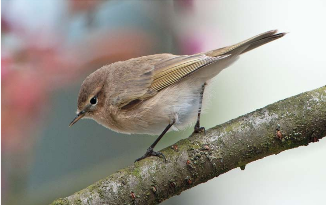
276 Siberische Tjiftjaf / Siberian Chiffchaff Phylloscopus collybita tristis , Leiden, Zuid-Holland, 13 april 2012 (Hans Overduin)