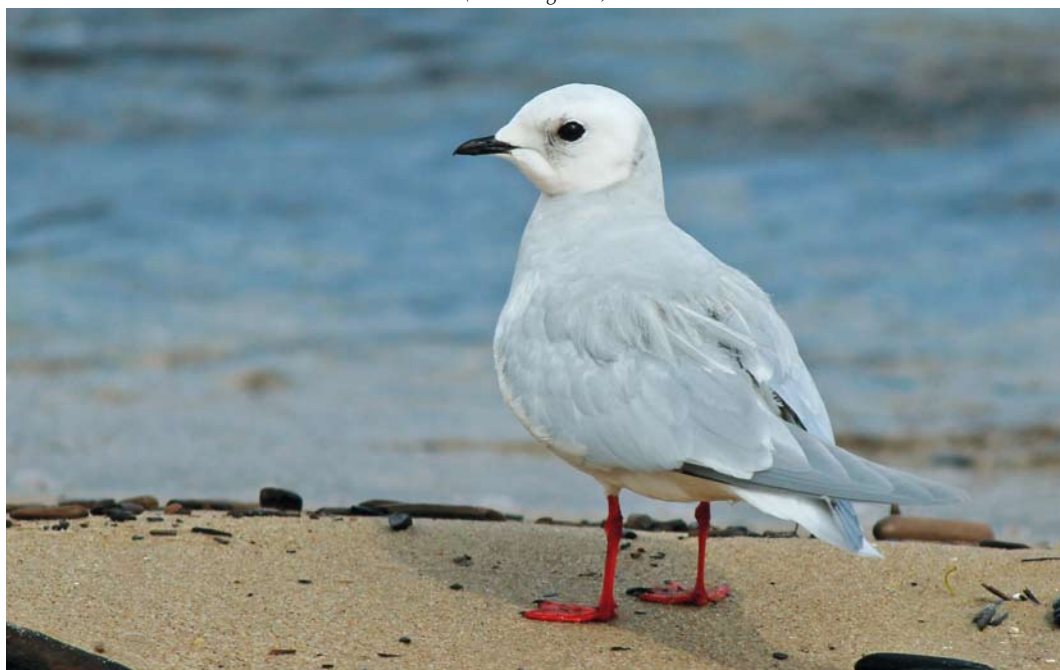
225 Ross's Gull / Ross' Meeuw Rhodostethia rosea , adult, Sobieszewo, Gdańsk, Poland, 14 April 2012