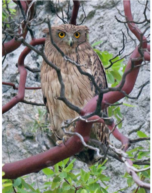
234 Bateleur / Bateleur Terathopius ecaudatus , subadult, Algeciras, Cádiz, Spain, 5 April 2012 235 Western Brown Fish Owl / Westelijke Bruine Visuil Bubo zeylonensis semenowi , Manavgat, Turkey, 11 May 2012 236 Nubian Nightjar / Nubische Nachtzwaluw Caprimulgus nubicus , Dead Sea, Israel, 22 March 2012