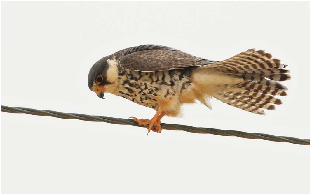
227 Amur Falcon / Amoerrootpootvalk Falco amurensis , female, Jahra East Outfall, Kuwait, 13 May 2012