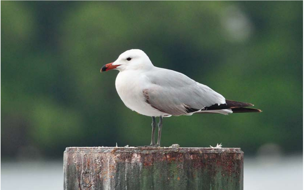
230 Audouin's Gull / Audouins Meeuw Larus audouinii , Tegeler See, Berlin, Germany, 7 May 2012 (Christoph Bock)