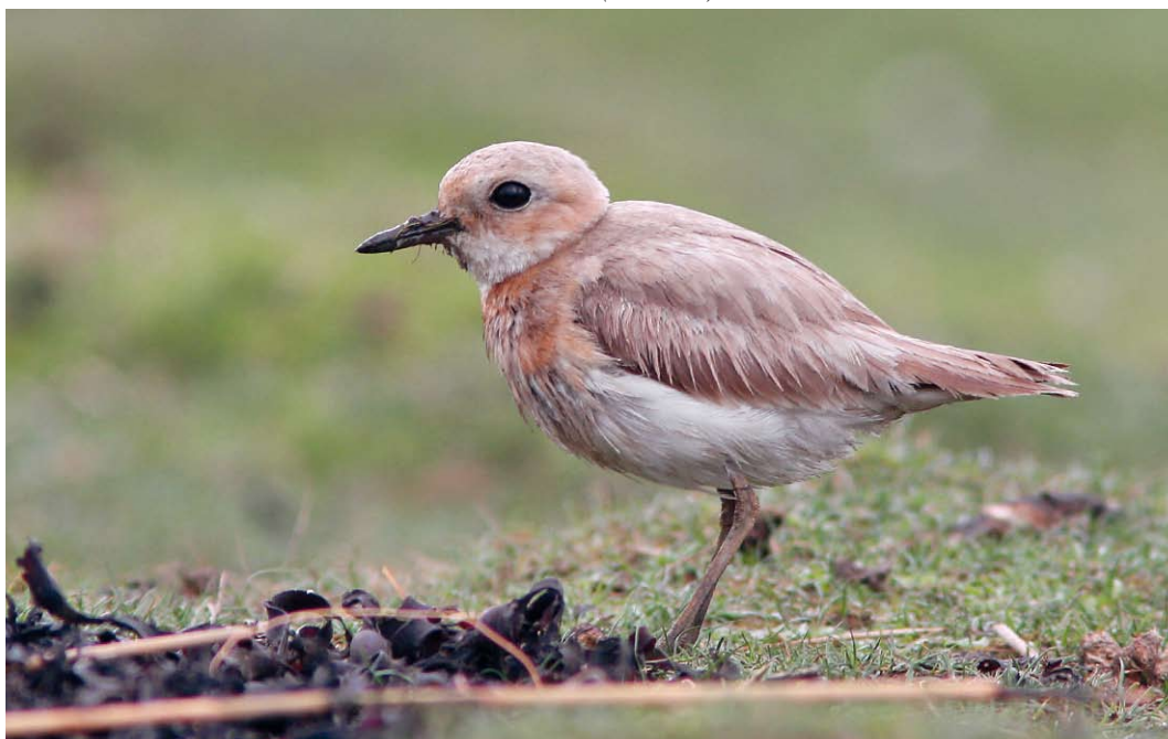
264 Woestijnplevier / Greater Sand Plover Charadrius leschenaultii , eerste-zomer, Punt van Reide, Groningen, 12 mei 2012 (Rob Half)