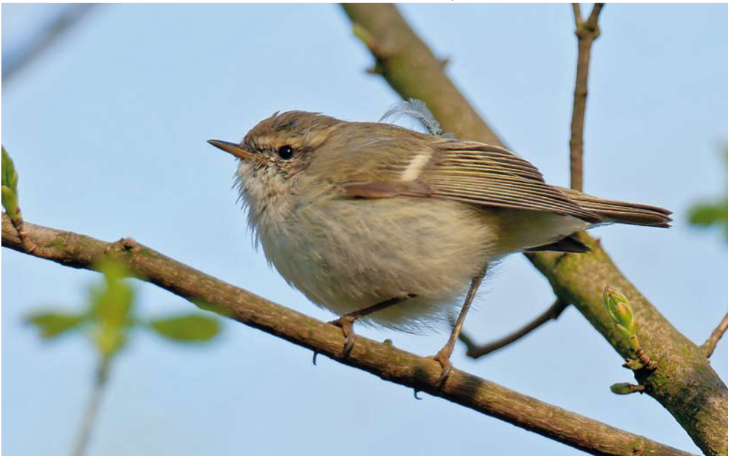
277 Humes Bladkoning / Hume's Leaf Warbler Phylloscopus humei , Katwijk aan den Rijn, Zuid-Holland, 28 maart 2012