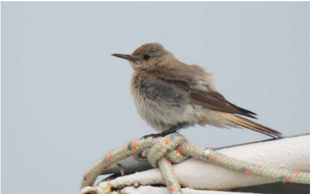
252 Hooded Wheatear / Monnikstapuit Oenanthe monacha , female, Nestos delta, Greece, 19 May 2012