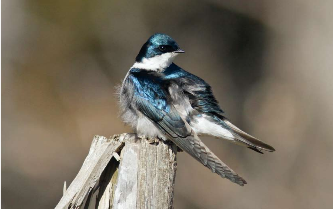
256 Tree Swallow / Boomzwaluw Tachycineta bicolor , Helluvatn, Reykjavík, Iceland, 16 May 2012 (Sigmundur Ásgeirsson)