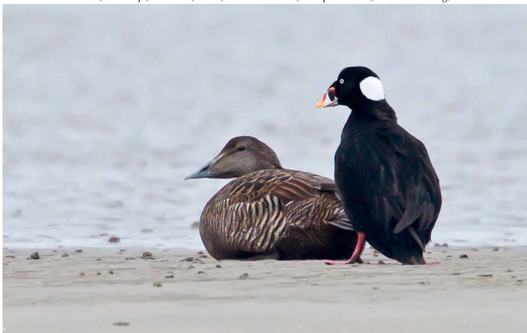
259 Brilzee-eend / Surf Scoter Melanitta perspicillata , adult mannetje, met Eider / Common Eider Somateria mollissima , vrouwtje, Mokbaai, Texel, Noord-Holland, 17 april 2012