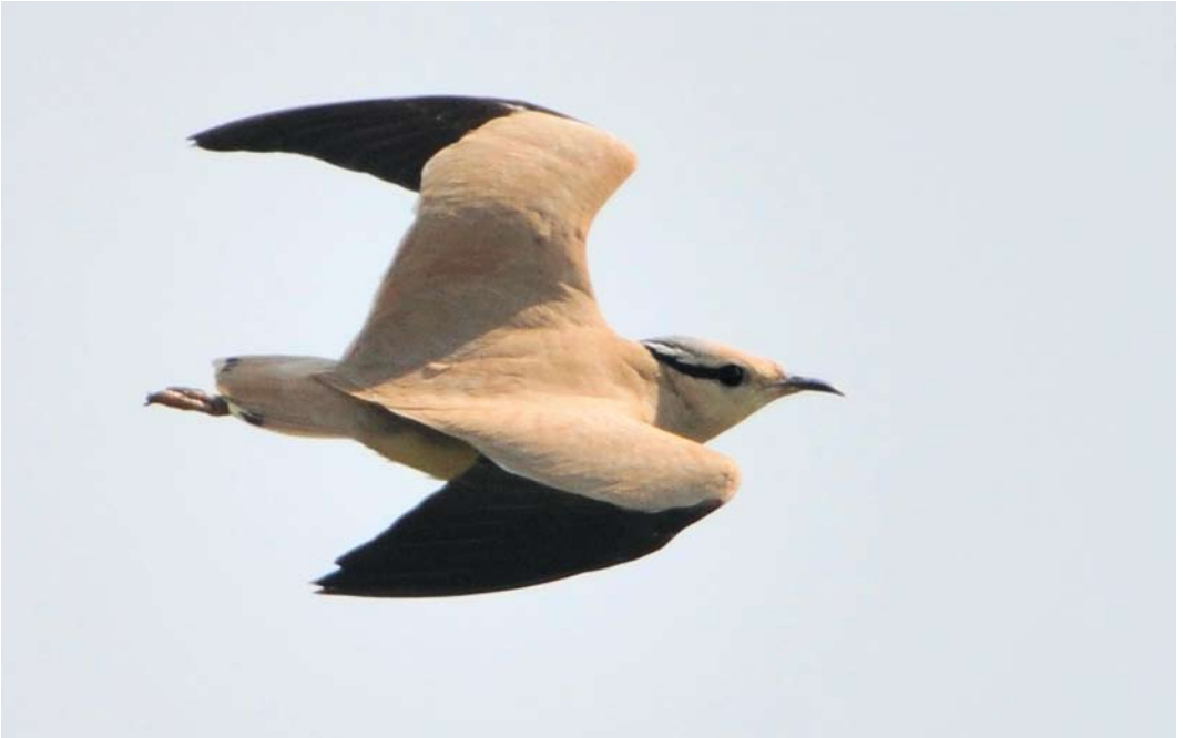
232 Cream-colored Courser / Renvogel Cursorius cursor , Bradnor Hill, Herefordshire, England, 21 May 2012 (Rebecca Nason)