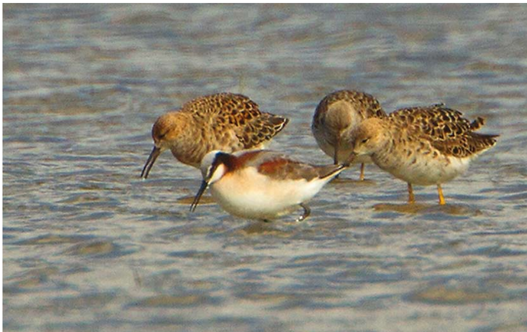
263 Grote Franjepoot / Wilson's Phalarope Phalaropus tricolor , vrouwtje, met Kemphanen / Ruffs Philomachus pugnax , Ezumakeeg, Friesland, 16 mei 2012 (Roland Jansen)