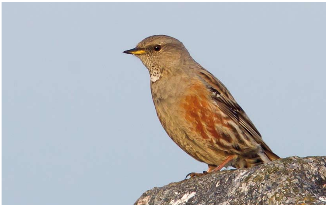
274 Alpenheggenmus / Alpine Accentor Prunella collaris , Jan Ayeslag, Texel, Noord-Holland, 21 mei 2012