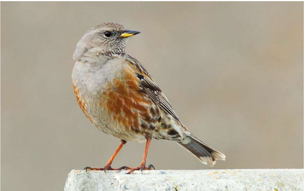
250 Alpine Accentor / Alpenheggenmus Prunella collaris , Zeebrugge, West-Vlaanderen, Belgium, 7 May 2012