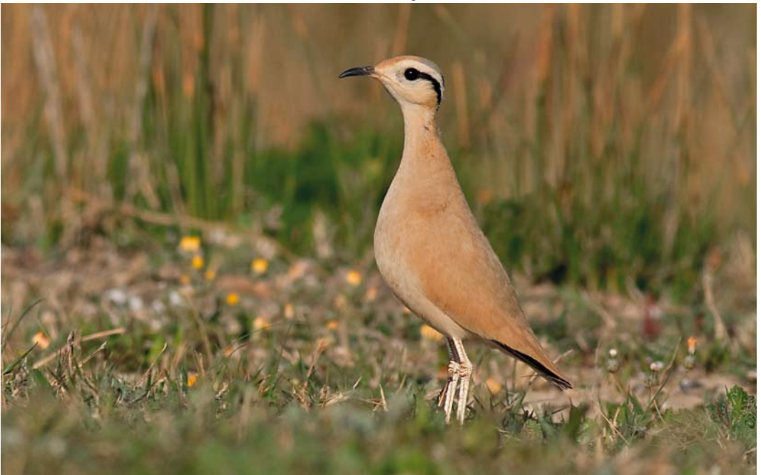
233 Cream-colored Courser / Renvogel Cursorius cursor , Los Lances beach, Tarifa, Cádiz, Spain, 12 April 2012