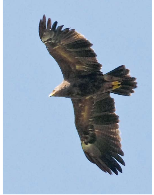
260 Steppekiekendief / Pallid Harrier Circus macrourus , tweede kalenderjaar mannetje, Noordkaap, Emmapolder, Groningen, 26 april 2012 261 Schreeuwarend / Lesser Spotted Eagle Aquila pomarina , Hoog Buurlo, Gelderland, 14 mei 2012 262 Zwarte Zeekoet / Black Guillemot Cepphus grylle , eerste-winter, NIOZ-haven, Texel, Noord-Holland, 22 april 2012