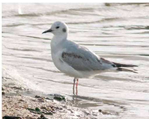
237 Blue-winged Teal / Blauwvleugeltaling Anas discors , male, Siemianówka reservoir, Podlaskie, Poland, 21 April 2012 238 Asian White-winged Scoter / Aziatische Grote Zee-eend Melanitta deglandi stejnegeri , male, Hanko, Finland, 30 May 2012 239 Baillon's Crake / Kleinst Waterhoen Porzana pusilla , Great Saltee Island, Wexford, Ireland, 24 March 2012 240 Bonaparte's Gull / Kleine Kokmeeuw Chroicocephalus philadelphia , first-summer, De Cocksdorp, Texel, Noord-Holland, Netherlands, 5 June 2012

2012); he concluded that males are strictly sedentary and that females move around to secondary sites but return again to their breeding sites as early as 17 January, when average temperatures have increased to 6°C. It remains unclear whether the species also exhibits this lack in migratory behaviour in its main distribution area, the Iberian Peninsula but, if it does, one may conclude that it is an unlikely vagrant in all neighbouring countries. In the Netherlands, a systematic count of House Crows Corvus splendens at Hoek van Holland, Zuid-Holland, on 4 March resulted in a total of 23. If accepted, two Red-billed Choughs Pyrhocorax pyrrhocorax on mount Hermon on 18 May will concern the second record for Israel. A Great Tit Parus major photographed at Rituvík, Eysturoy, on 29 April was the fourth for the Faroes. In Morocco, an African Dunn's Lark Eremalauda dunnii was seen near Fom Zguid, Zagora, on 29 April; at Merzouga, at the same spot as in spring 2010, one was reported in April and on 2 May. In Israel, Arabian