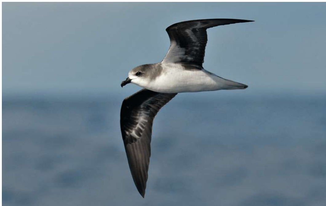
224 Zino's Petrel / Freira Pterodroma madeira , off Madeira, 18 May 2012