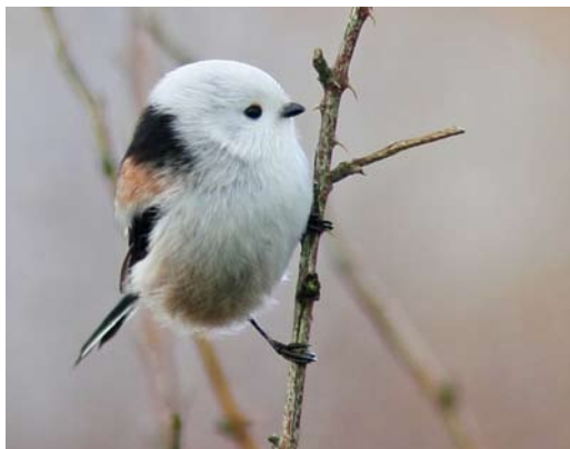
205 White-headed Long-tailed Tit / Witkopstaartmees Aegithalos caudatus caudatus , Groote Peel, Noord- Brabant, Netherlands, 9 November 2010 (Raymond Pahlplatz)