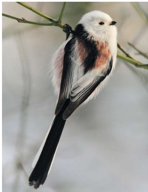
204 White-headed Long-tailed Tit / Witkopstaartmees Aegithalos caudatus caudatus , Amsterdam, Netherlands, Noord-Holland, Netherlands, 20 December 2010 (William Price). Note almost entirely white middle tertial. Some grey can be seen on side of head, but this seemingly was caused by grey feather bases.

as an often repeated 'tserrr'. Both calls are illustrated in figure 1. The trisyllabic call is used in longer-range communication and is often given in flight, particularly when the flock is in rapid movement, and by 'lost' individuals isolated from the main flock (Cramp & Perrins 1993, Harrap & Quinn 1996). The tserrr -call is given less frequently compared with the trisyllabic call. It is said to be given in excitement or alarm and is also used in longer flights of more than 20 m (Cramp & Perrins 1993). However, the call is often heard without any apparent provocation. It is often repeated with an irregular frequency. Other calls frequently heard in groups include soft ticking and chattering sounds and very high and thin-sounding calls. Sometimes a rather long rapid trill, falling in pitch towards the end, is heard, which is often associated with alarm or excitement (Cramp & Perrins 1993, Harrap & Quinn 1996).