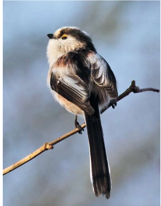
199 Central European Long-tailed Tit / Staartmees Aegithalos caudatus europaeus , Nijverdal, Overijssel, Netherlands, 21 November 2010. Note largely dark tertials.

text. The aim of this paper is to document morphology, biometry and vocalizations of birds involved in the caudatus invasion and to compare this with the identification criteria published in Jansen & Nap (2008) and other literature. This paper only deals with the identification; the invasion itself is described in a separate paper (van Bemmelen et al 2012).