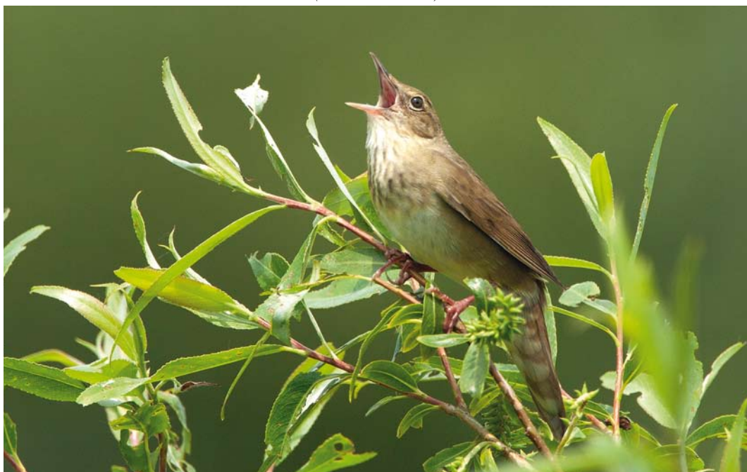
275 Krekelzanger / River Warbler Locustella fluviatilis , Kandelaar, Schiedam, Zuid-Holland, 24 mei 2012