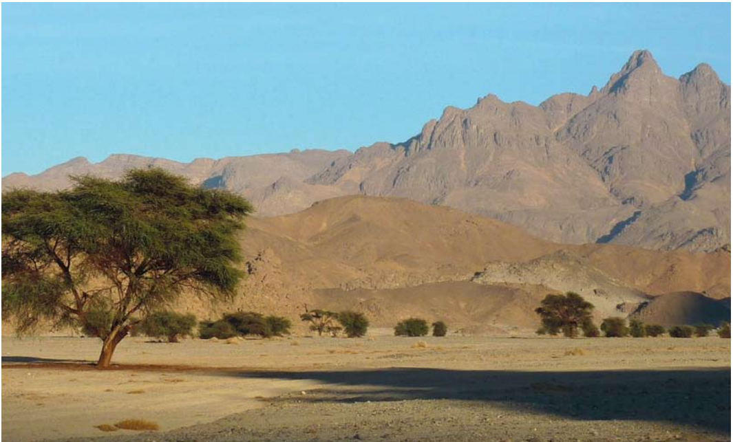
218 Wintering habitat of Asian Desert Warbler Sylvia nana , Jebel Uweinat, Libyan Desert, Libya, 1 January 2011

is exceptional (Bundy 1976). The statements in Urban et al (1997), which mention Asian Desert Warbler as 'scarce' in Libya with 'records from south of Sirte, Ghadames, Al Wadem, Wadi Tanezzuft, Bir Tahala, Ghat, Tin Abunda, Edeyin and Serir' and suggest that it is this taxon that may breed in south-western Fezzan (cf Bundy 1976), are questionable. The westerly records most probably refer to African. Future studies will undoubtedly clarify this point. The specific identification of two individuals seen close to Al Adam south of Tobruk, Cyrenaica, on 27 December 1958 (Bundy 1976) and four in Sarir, Libyan Desert, on 28 March 1970 (Hogg 1974) remains unresolved. The same applies to the sightings mentioned in Meinertzhagen (1930) near the Mediterranean coast, 16 km west of Salum, in January 1920 and 1928. The observations in 2011 indicate that, based on the easterly location of the sightings, Asian Desert Warbler should not be ruled out. Because African and Asian were at that time treated as subspecies of a single species (Desert Warbler Sylvia nana ), observers may not have bothered to establish which of the two was involved, or may have falsely assumed that any 'Desert Warbler' west of Egypt must be African.