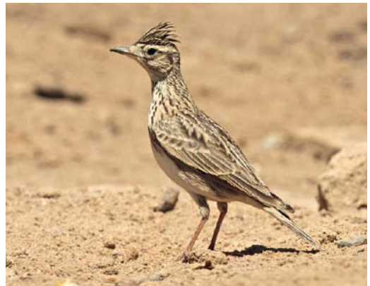
241 Atlas Flycatcher / Atlasliegenvanger Ficedula speculigera , male, Capo Murro di Porco, Sicily, Italy, 24 April 2012 242 Brown-headed Cowbird / Bruinkopkoevogel Molothrus ater , Greifwalder Oie, Mecklenburg-Vorpommern, Germany, 15 May 2012 243 Bar-tailed Lark / Rosse Woestijnleeuwerik Ammomanes cinctura , Capo Murro di Porco, Siracusa, Sicily, Italy, 17 April 2012 244 Oriental Skylark / Kleine Veldleeuwerik Alauda gulgula , El Gouna, Al Bahr al Ahmar, Egypt, 27/28 March 2012

on 4 May. In the second half of April, an Eastern Crowned Warbler Phylloscopus coronatus , an immature male Siberian Blue Robin Larvivora cyane and an Asian Stubtail Urosphena squameiceps at Ashmore Reed, the closest point of Australian territory to Indonesia, concerned first records for Australia, and an immature male Siberian Thrush Geokichla sibirica was the first seen alive. If accepted, a Green Warbler P. nitidus trapped on Lågskär, Åland, on 20 May will be the first for Finland. In the Netherlands, Hume's Leaf Warblers P. humei remained at Katwijk aan Zee, Zuid-Holland, from 9 December 2011 to 22 April, with a second individual at Katwijk aan de Rijn from 25 March to 16 April, and at Schiedam, Zuid-Holland, from 15 March to 22 April (probably the same individual staying here on 3-12 December 2011). The one wintering at Wyke Regis, Dorset, England, and reappearing on 11 March stayed until at least 26 April. An individual found on Fuerteventura on 6 April was the first for the Canary Islands. An