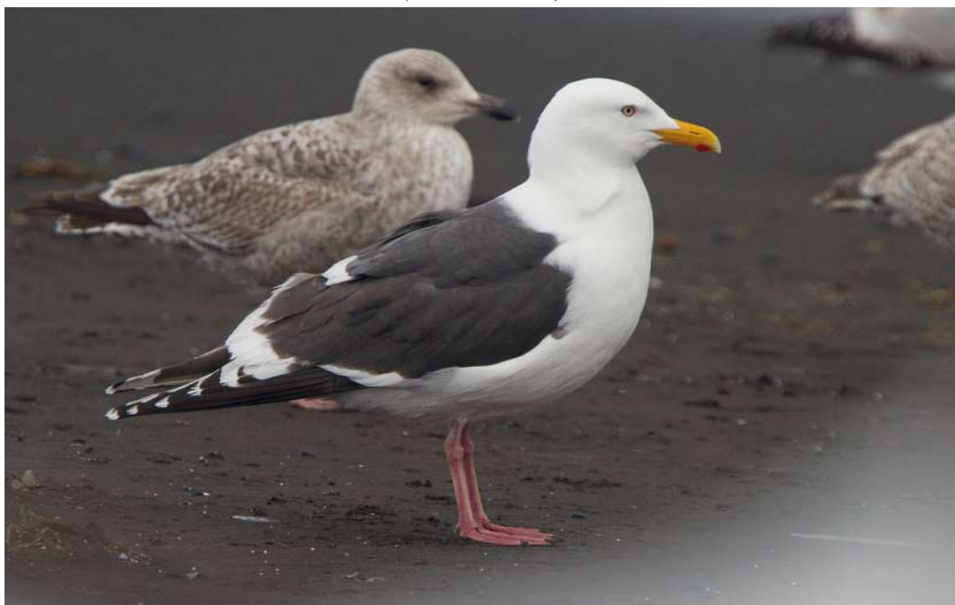
229 Slaty-backed Gull / Kamtsjatkameeuw Larus schistisagus , adult, Húsavík, Iceland, 14 May 2012