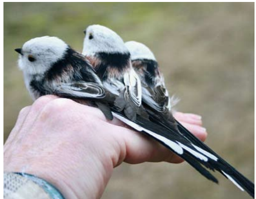
200 Central European Long-tailed Tit / Staartmees Aegithalos caudatus europaeus , Tilburg, Noord-Brabant, Netherlands, 5 October 2010 ( Twan Hak ). Note dark mottling on breast, always absent in White-headed Long-tailed Tit A. c. caudatus . 201 Long-tailed Tit / Staartmees Aegithalos caudatus , Heteren, Gelderland, Netherlands, 24 December 2010 ( Wilbert Koch ). Intermediate bird. 202 White-headed Long-tailed Tit / Witkopstaartmees Aegithalos caudatus caudatus , Oostvaardersdijk, Almere, Flevoland, Netherlands, 7 November 2010 ( Ton Eggenhuizen ). Typical individual, showing snow-white head and clear-cut neck-band. 203 White-headed Long-tailed Tits / Witkopstaartmezen Aegithalos caudatus caudatus , Naarden, Noord-Holland, Netherlands, 13 March 2011 ( Rudy Schippers ). Note variation in tertial marking. Also, note that grey bases of head feathers are easily visible but that feather tips appear white.

mediate. By using these classification criteria, we essentially quantified the variation within the three groups in the remaining eight characters. The majority of photographs used in the analysis were found on the online sighting database www.waarneming.nl , the remainder originating from www.birdpix.nl and www.dutchbirding.nl .