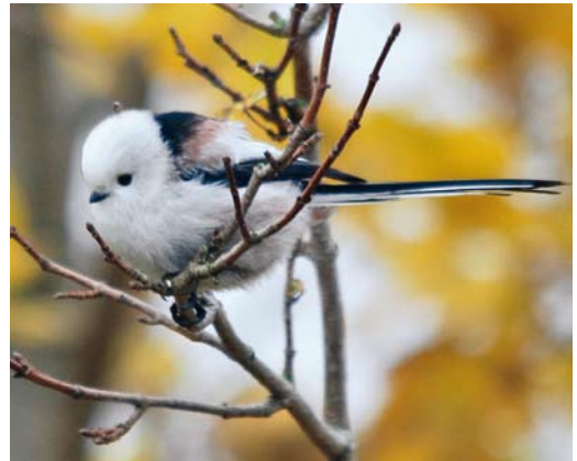
191 White-headed Long-tailed Tit / Witkopstaartmees Aegithalos caudatus caudatus , Westkapelle, Zeeland, Netherlands, 30 October 2010. Part of migrating flock of nine caudatus with three europaeus . 192 White-headed Long-tailed Tit / Witkopstaartmees Aegithalos caudatus caudatus , Rembrandtpark, Amsterdam, Noord-Holland, Netherlands, 20 December 2010. A thorough check of this city park yielded several flocks of caudatus . 193 White-headed Long-tailed Tit / Witkopstaartmees Aegithalos caudatus caudatus , Eemshaven, Groningen, Netherlands, 31 October 2010

western European countries (eg, Belgium, Britain and France), the taxon is regarded as a rarity and therefore records are considered by the national rarities committees.