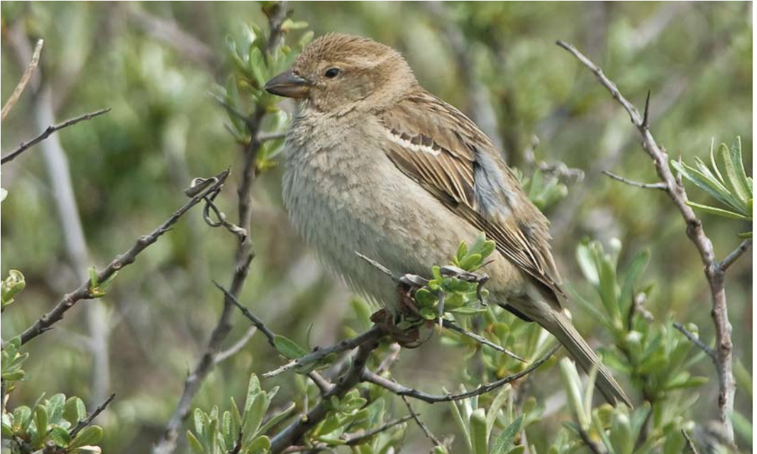
208 Spaanse Mus / Spanish Sparrow Passer hispaniolensis , vrouwtje, IJmuiden, Noord-Holland, 6 mei 2010 ( Jacob Garvelink ). Let op open gezicht, herinnerend aan Roodmus Carpodacus erythrinus , forse snavel en vrij puntige kruin met donkere schachtstrepen / Note open face, reminiscent of Common Rosefinch Carpodacus erythrinus , heavy bill and rather peaked crown with dark shaft-streaks. 209 Spaanse Mus / Spanish Sparrow Passer hispaniolensis , vrouwtje, IJmuiden, Noord-Holland, 6 mei 2010 ( Jacob Garvelink ). Let op crèmekleurige randen aan grote dekveren, tertials en hand- en armpennen en donker centrum en schachtstreep van bovenstaartdekveren / Note sandy-grey fringes of greater coverts, tertials and remiges and dark centre and shaft-streak of uppertail-coverts.