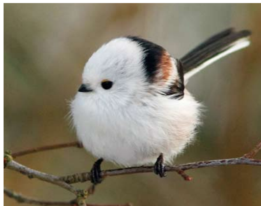
206 White-headed Long-tailed Tit / Witkopstaartmees Aegithalos caudatus caudatus , Alkmaar, Noord-Holland, Netherlands, 1 December 2010. Note absence of dark mottling on breast and pure white underparts, only fading into very pale pink on flank.

C 10% of the analysed Long-tailed Tits showed intermediate features. Only if the black on the head was reduced to some mottling it was regarded an intermediate (birds with more black being categorized as 'pure' europaeus ). However, as all intermediates between a pure white head and a broad black band on the head exist, categorization on the basis of the amount of black on the head is arbitrary. Jansen & Nap (2008) labelled birds approaching caudatus in appearance but showing some black in the head as europaeus but it might be better to leave these birds unidentified on subspecies level, since they could just as well be intergrades rather than extremely pale examples of pure europaeus .