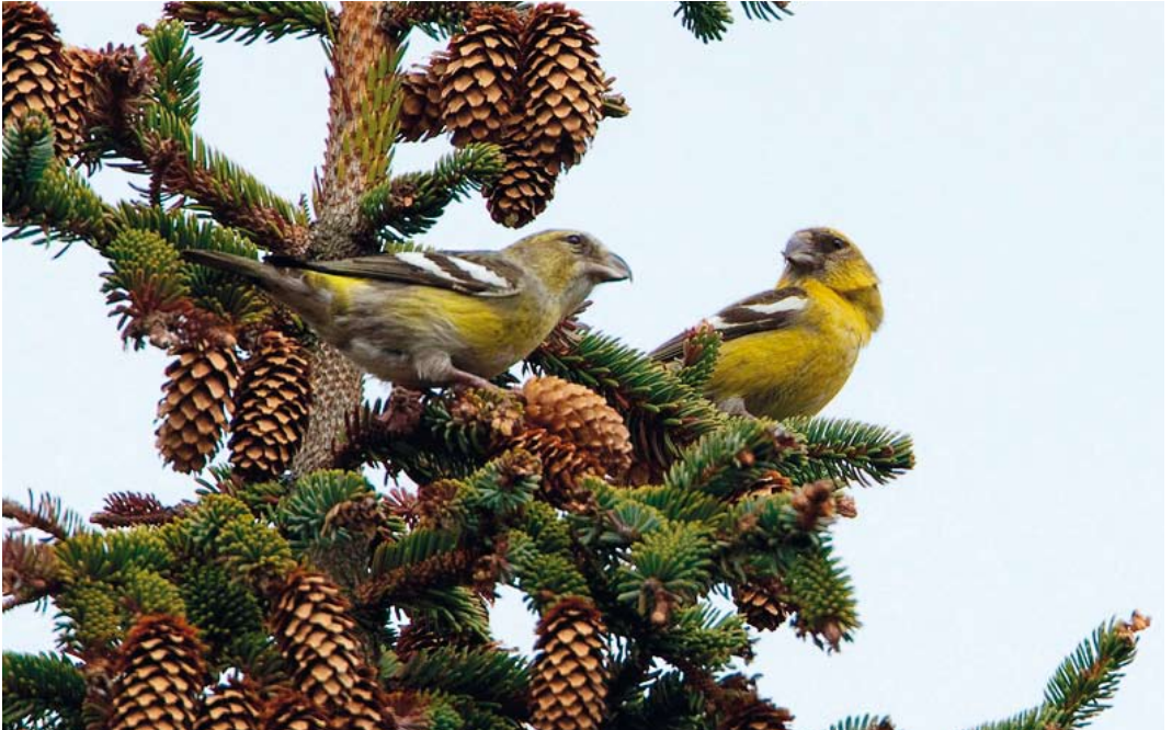
267 Witbandkruisbekken / Two-barred Crossbills Loxia leucoptera , Terschelling, Friesland, 25 april 2012