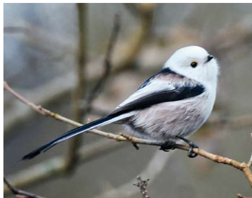
196 White-headed Long-tailed Tit / Witkopstaartmees Aegithalos caudatus caudatus , Julianadorp, Noord-Holland, Netherlands, 21 January 2011