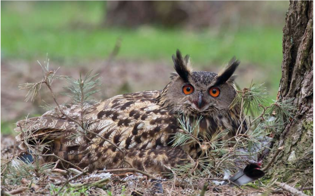
265 Oehoe / Eurasian Eagle Owl Bubo bubo , vrouwtje, Hilvarenbeek, Noord-Brabant, 27 april 2012