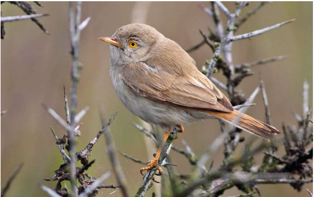
257 Asian Desert Warbler / Woestijngrasmus Sylvia nana , Grenen, Skagen, Nordjylland, Denmark, 20 May 2012 (Knud Pedersen)