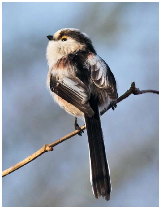
199 Central European Long-tailed Tit / Staartmees Aegithalos caudatus europaeus , Nijverdal, Overijssel, Netherlands, 21 November 2010. Note largely dark tertials.

text. The aim of this paper is to document morphology, biometry and vocalizations of birds involved in the caudatus invasion and to compare this with the identification criteria published in Jansen & Nap (2008) and other literature. This paper only deals with the identification; the invasion itself is described in a separate paper (van Bemmelen et al 2012).