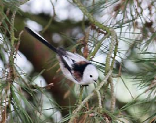
207 White-headed Long-tailed Tit / Witkopstaartmees Aegithalos caudatus caudatus , Loozerheide, Noord- Brabant, Netherlands, 29 October 2010

us (hierna europaeus ) die in West-Europa broeden. In dit artikel worden de resultaten van systematisch onderzoek beschreven. Daartoe werden alle (digitaal) met foto's gepubliceerde waarnemingen (voornamelijk van www.waarneming.nl , aangevuld met www.dutchbirding.nl en www.birdpix.nl ) bestudeerd. In totaal werden 168 caudatus vergeleken met 281 europaeus en 50 intermediaire vogels (hier als derde groep opgevat). Daarnaast werd onderzoek gedaan aan de geluiden van beide ondersoorten en bij de ringvangsten aan de biometrie.