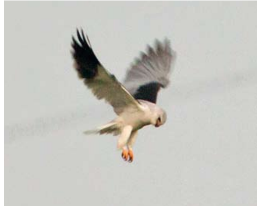
291 Grijze Wouw / Black-winged Kite Elanus caeruleus , Wageningen, Gelderland, 20 mei 2012 (Alex Bos)