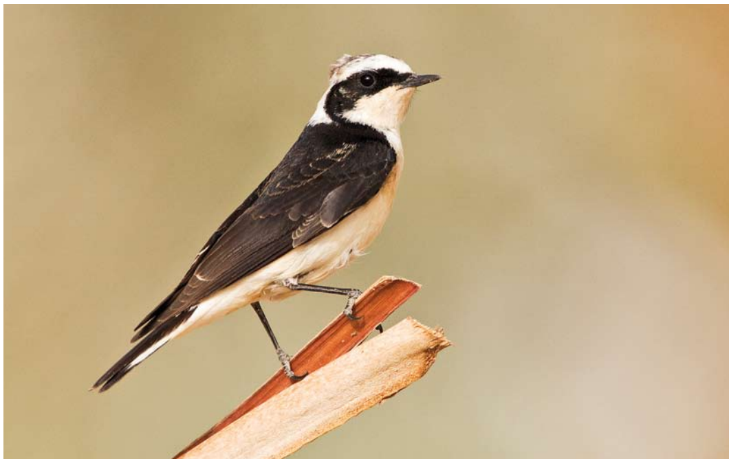
249 Pied Wheatear / Bonte Tapuit Oenathe pleschanka 'vittata', male, Eilat, Israel, 24 March 2012