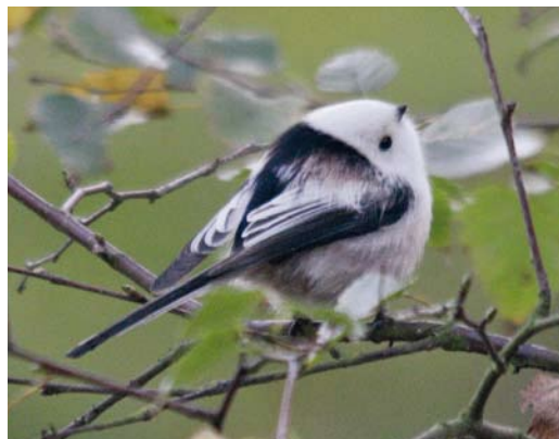
195 White-headed Long-tailed Tit / Witkopstaartmees Aegithalos caudatus caudatus , Vlieland, Friesland, Netherlands, 17 October 2010