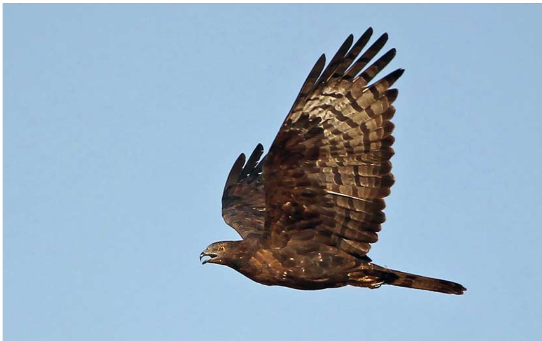
226 Crested Honey Buzzard / Aziatische Wespensdief Pernis ptilorhynchus , Eilat, Israel, 8 April 2012 (Kris De Rouck)