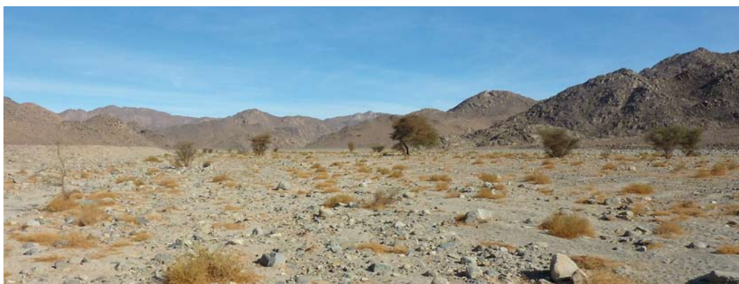
219-220 Asian Desert Warbler / Woestijngrasmus Sylvia nana , Arkno mountains, Libyan Desert, Libya, 3 January 2011 (Jens Hering) 221 Wintering habitat of Asian Desert Warbler Sylvia nana , Arkno mountains, Libyan Desert, Libya, 3 January 2011 (Jens Hering)