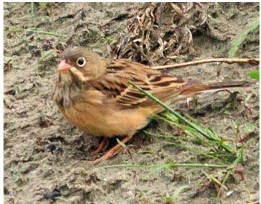
245 Isabelline Wheatear / Izabeltapuit Oenanthe isabellina , Mansour, Ouarzazate, Morocco, 29 March 2012 (Arnoud B van den Berg) 246 Black-faced Bunting / Maskergors Emberiza spodocephala , second calendar-year male, Gislövs stjärna, Skåne, Sweden, 29 April 2012 (Jesper Segergren) 247 Green Warbler / Groene Fitis Phylloscopus nitidus , Lemland, Lågskär, Finland, 20 May 2012 (Mika Bruun) 248 Cretzschmar's Bunting / Bruinkeelortolaan Emberiza caesia , female, Kieldrecht, West-Vlaanderen, Belgium, 10 May 2012 (Filip De Ruwe)

until 18 March. Hansson et al (2012) document the extent of hybridisation in sympatric Great Reed Warbler A arundinaceus and Clamorous Reed Warbler A stenotoreus in southern Kazakhstan ( http://tinyurl.com/crr7xzb ); they concluded that there was no evidence for backcrossing and introgression suggesting that hybrids are either infertile or their progeny unviable but they cannot exclude very low levels of introgression. In Fezzan, western Libya, at least 30 African Reed Warblers A baeticatus were found in reedy sewage ponds at Ghadamis of which 10 were trapped and their identification was confirmed by DNA-analysis; the species was discovered as a new breeder for Libya in 2008. It seems likely that reed warblers reported from oases across the Libyan borders in Algeria and Tunisia also concern African Reed (Limicola 25: 268-271, 2011). On 13 April, a Moustached Warbler A melanopogon turned up at Moos, Baden-Württemberg, Germany. The second and third for Luxembourg were trapped at Uebersyren