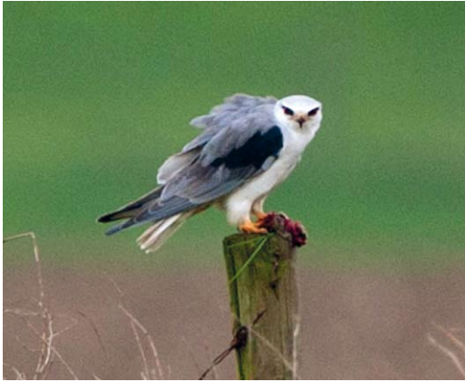
290 Grijze Wouw / Black-winged Kite Elanus caeruleus , tweede kalenderjaar, Keent, Noord-Brabant, 12 april 2012 (Toy Janssen)