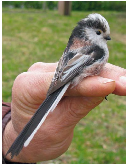
198 Central European Long-tailed Tit / Staartmees Aegithalos caudatus europaeus , Robbenoordbos, Wieringermeer, Noord-Holland, Netherlands, 13 March 2011 (Klaas van den Berg). Typical individual. Note predominance of dark over white in tertials.