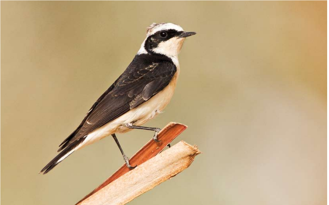
249 Pied Wheatear / Bonte Tapuit Oenanthe pleschanka 'vittata', male, Eilat, Israel, 24 March 2012