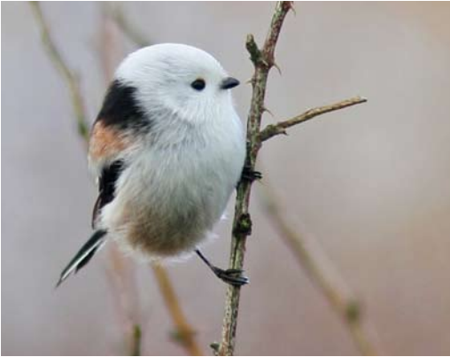
205 White-headed Long-tailed Tit / Witkopstaartmees Aegithalos caudatus caudatus , Groote Peel, Noord- Brabant, Netherlands, 9 November 2010