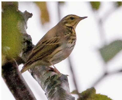
484 Olive-backed Pipit / Siberische Boompieper Anthus hodgsoni , Reddingsweg, Schiermonnikoog, Friesland, 22 October 2010 ( Peter Lindenburg )