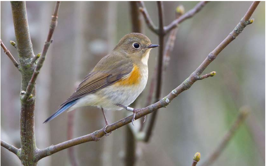
582 Blauwstaart / Red-flanked Bluetail Tarsiger cyanurus , Noordhollands Duinreservaat, Castricum, Noord-Holland, 27 oktober 2011