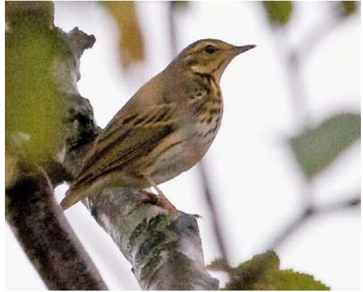
484 Olive-backed Pipit / Siberische Boompieper Anthus hodgsoni , Reddingsweg, Schiermonnikoog, Friesland, 22 October 2010