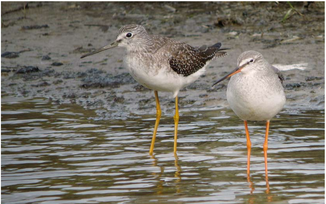
474 Greater Yellowlegs / Grote Geelpootruiter Tringa melanoleuca , first-year, with Spotted Redshank / Zwarte Ruiter T. erythropus , Colijnsplaat, Zeeland, 18 October 2010

The bird was photographed by a single observer in late morning on concrete blocks of a pier 1 km off the North Sea beach. The photographs were sent a few hours later by e-mail to CDNA member Roy Slaterus, who identified the bird almost immediately. Despite extensive searching by many people during the same and the following day, it could not be found again. This was only