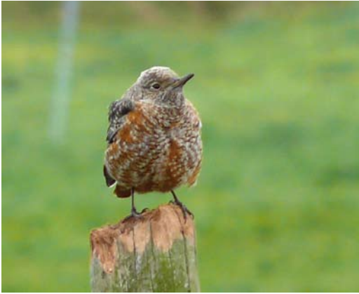
483 Rufous-tailed Rock Thrush / Rode Rotslijster Monticola saxatilis , male, Buren, Ameland, 26 October 2010