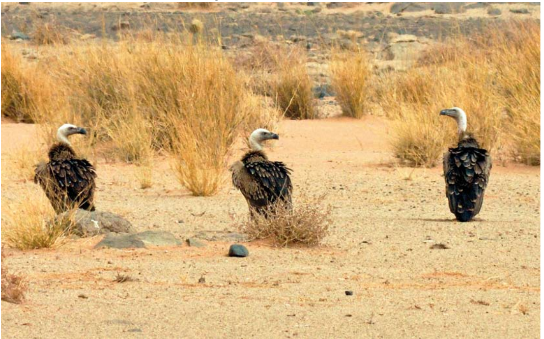
514 Rüppell's Vultures / Ruppells Gieren Gyps rueppellii , 5 km west of Aousserd, Oued-Ed Dahab, Morocco, 1 August 2011 (Michel Aymerich)