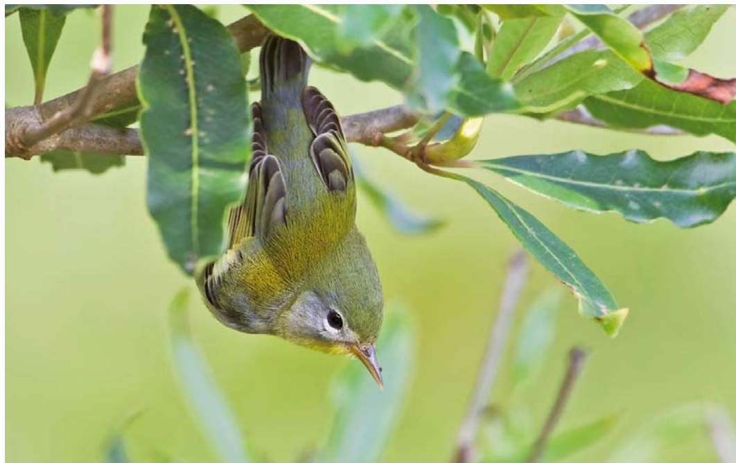
547 Northern Parula / Brilparulazanger Setophaga americana , Corvo, Azores, Iceland, 11 October 2011