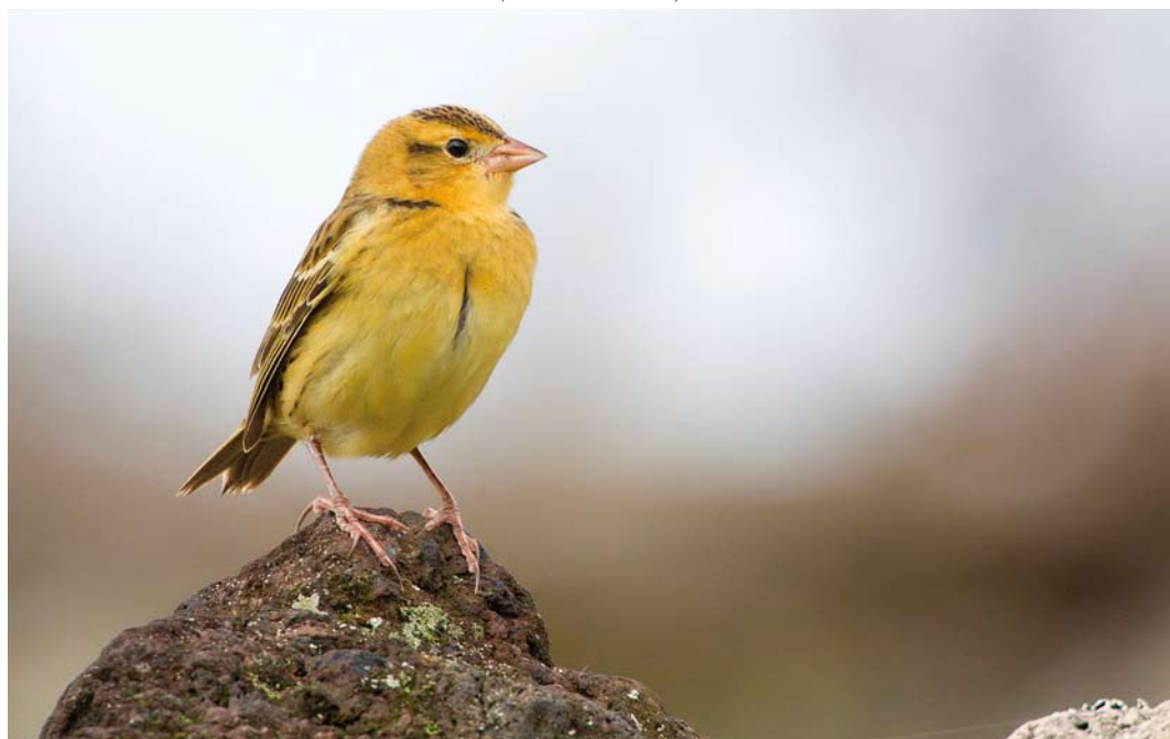
548 Bobolink / Bobolink Dolichonyx oryzivorus , Flores, Azores, 13 October 2011