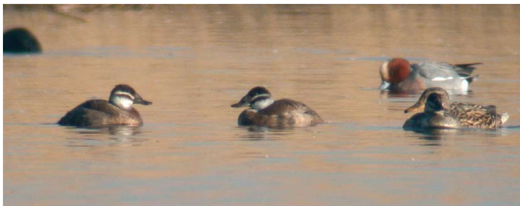
468 Surf Scoter / Brilzee-eend Melanitta perspicillata , adult male, with Common Eider / Eider Somateria mollissima , female, Horsmeertjes, Texel, Noord-Holland, 9 May 2010 469 White-headed Ducks / Witkopeenden Oxyura leucocephala , Starrevaart, Leidschendam, Zuid-Holland, 28 February 2010

bird, already accepted for the winter of 2007/08 (Ovaa et al 2009). The returning bird at Wieringermeer was first accepted for 26 December 2003 to 2 March 2004 (van der Vliet et al 2006).