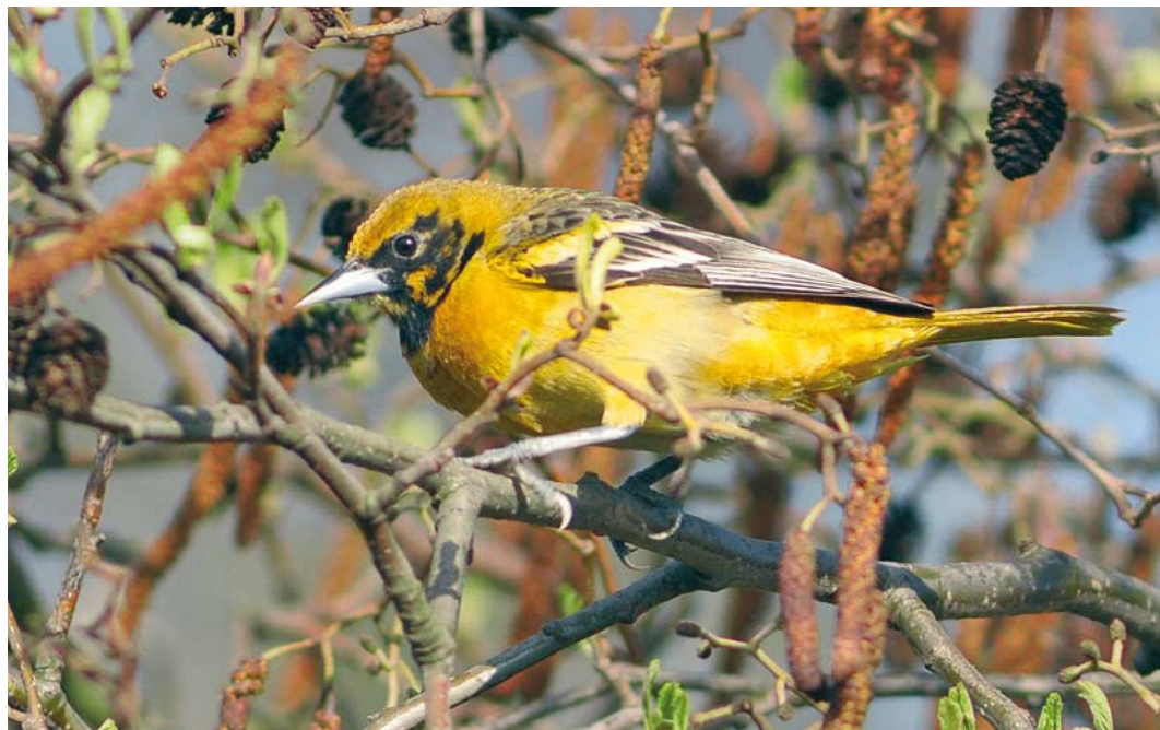
485 Baltimore Oriole / Baltimore retroepiaal Icterus galbula , first-winter male moulting to first-summer, Oudorp, Alkmaar, Noord-Holland, 11 April 2010 ( Harm Niesen )