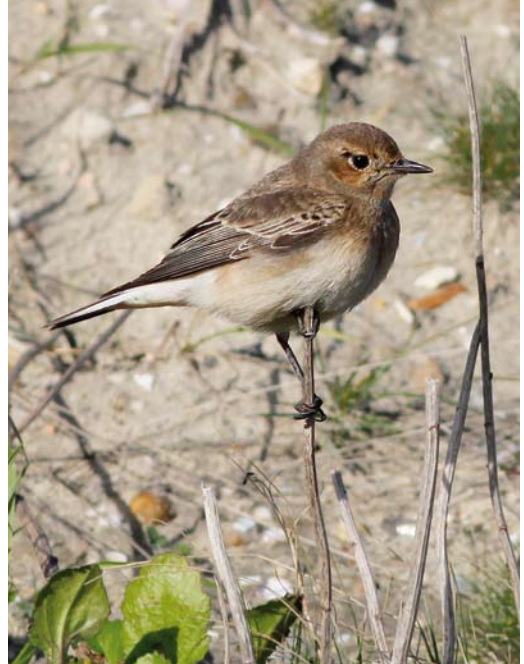
479 Pied Wheatear / Bonte Tapuit Oenanthe pleschanka , female, Westkapelle, Zeeland, 25 October 2010