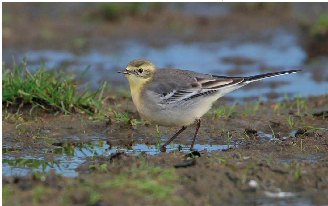
486 Citrine Wagtail / Citroenkwikstaart Motacilla citreola , Klaas Hennepoelpolder, Warmond, Zuid-Holland, 31 October 2010 ( Martin van der Schalk )