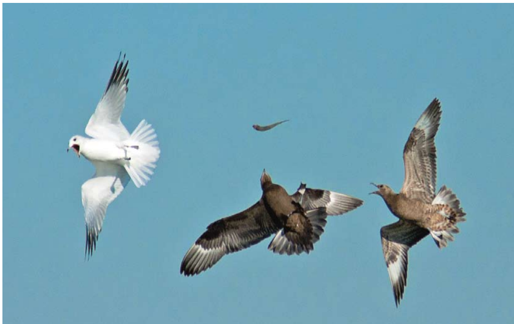
557 Kleine Jagers / Parasitic Jaegers Stercorarius parasiticus , adult en juveniel, met Stormmeeuw / Common Gull Larus canus canus , IJmuiden, Noord-Holland, 16 oktober 2011 (Peter Soer)