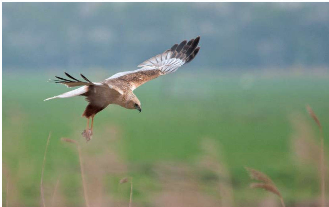
502 Western Marsh Harrier / Bruine Kiekendief Circus aeruginosus , adult male, Nijkerk, Gelderland, 6 April 2011. Note pale markings also visible on upside of primaries.

three such individuals were present in one general area in the Netherlands during a period of just a few years. Perhaps these concern birds from the same nest or from nests in different years of the same breeding pair. One may wonder if such birds are probably more common than expected but go unnoticed.