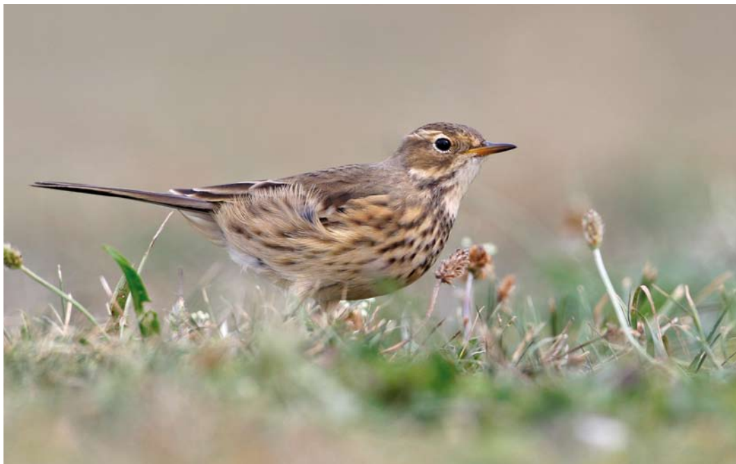
535 Buff-bellied Pipit / Amerikaanse Waterpieper Anthus rubescens rubescens , first-year, A Coruña, Galicia, Spain, 27 September 2011