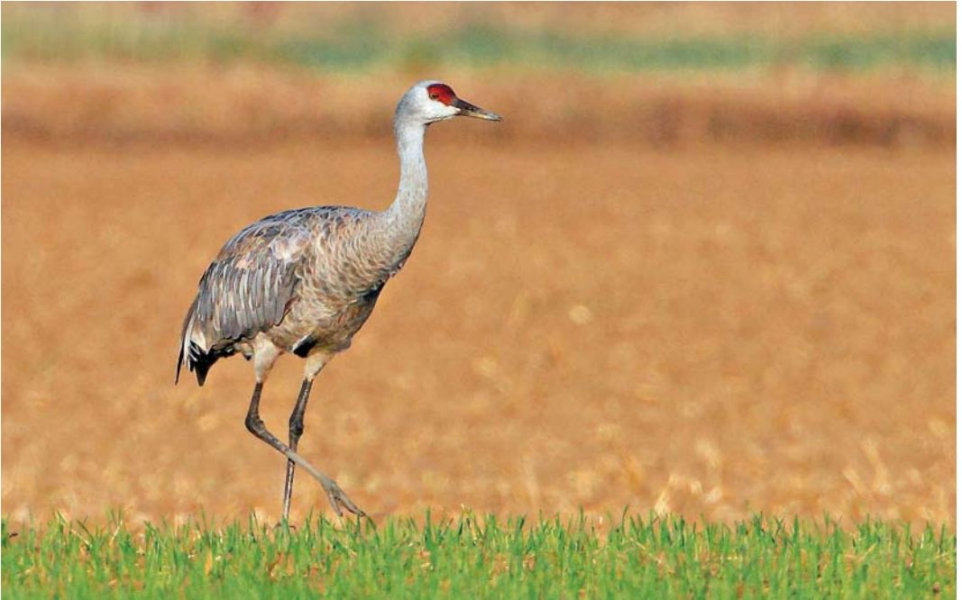
515 Sandhill Crane / Canadese Kraanvogel Grus canadensis , adult, Boyton Marshes, Suffolk, England, 2 October 2011 (Bill Baston)