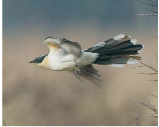
476 Great Crested Cuckoo / Kuifkoekoek Clamator glandarius , Lentevreugd, Wassenaar, Zuid-Holland, 24 March 2010 (René van Rossum)

Dutch Birding 32: 272, plate 366, 2010).