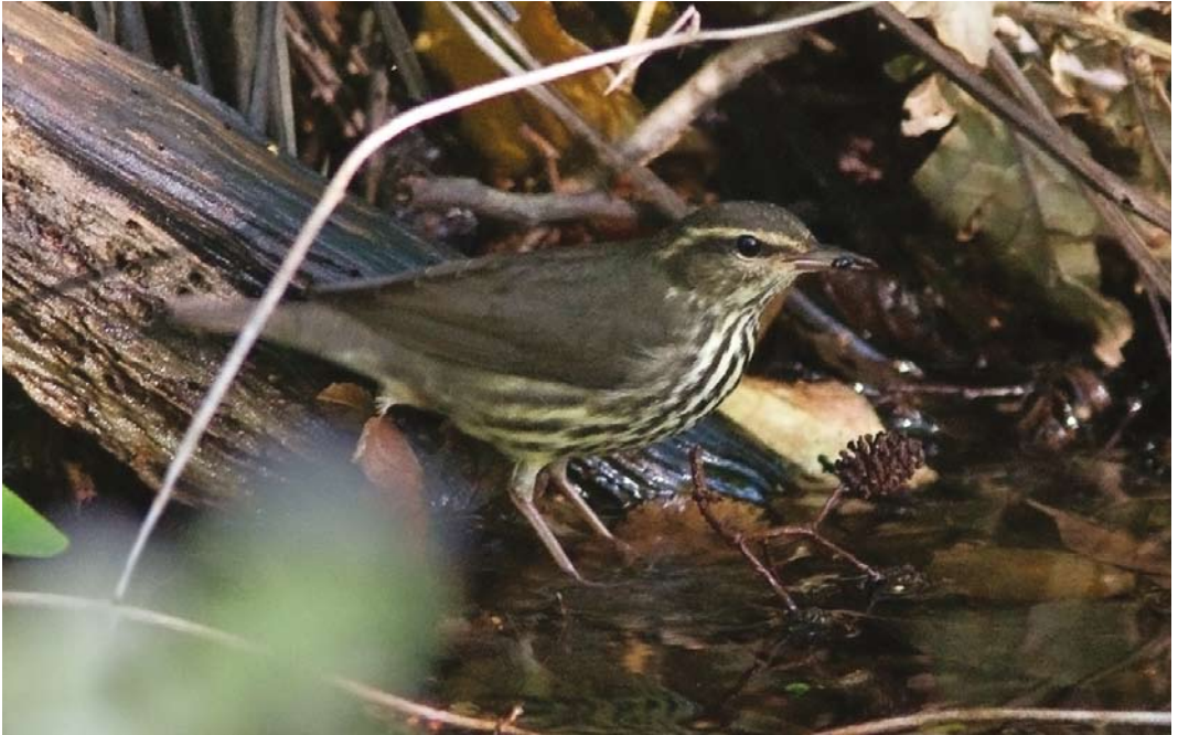
487 Northern Waterthrush / Noordse Waterlijster Parkesia noveboracensis , Oude Kooi, Vlieland, Friesland, 18 September 2010 (Arnold Meijer)