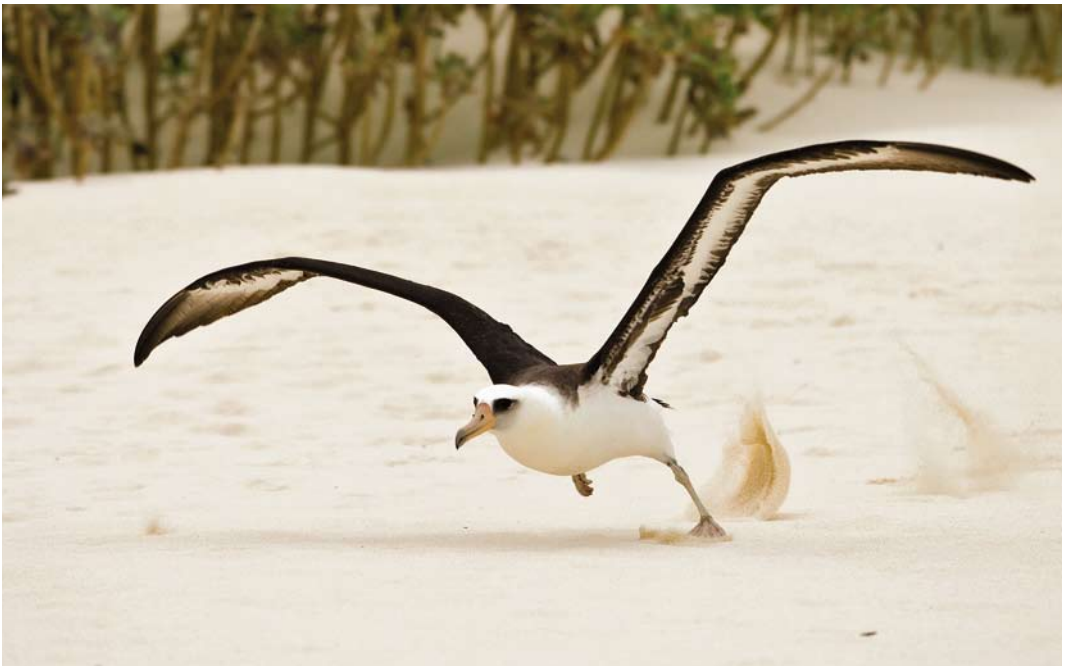
504 Laysan Albatross / Laysanalbatros Phoebastria immutabilis , Midway Atoll, Hawaii, 12 April 2010