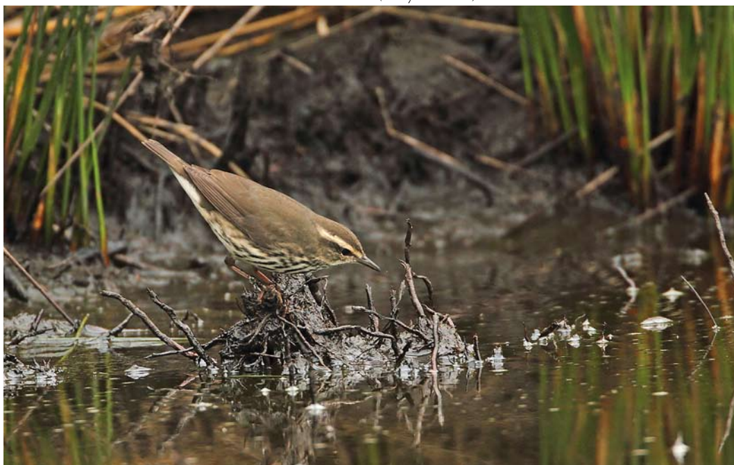
536 Northern Waterthrush / Noordse Waterlijster Parkesia noveboracensis , St Mary's, Scilly, England, 10 October 2011