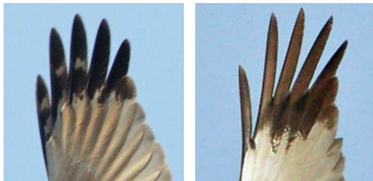
FIGURE 1 Primary tips of adult male Western Marsh Harrier / Bruine Kiekendief Circus aeruginosus . Right: normal pattern, left: aberrant pattern with pale markings (same image as in plate 501).

501). In combination with its marked wing-coverts this probably indicates a younger age than the other birds. On the upperside of the primaries, the prints were also present and visible. Although a faint print in the primaries of the Nijkerk bird could be seen in photographs, it was never as clear as in the Hasselt birds (at least in 2009; there