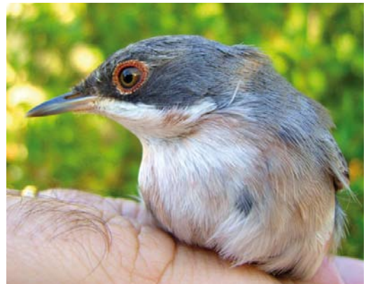
543 Red-eyed Vireo / Roodoogvireo Vireo olivaceus , Cape Clear, Cork, Ireland, 10 October 2011 544 Scarlet Tanager / Zwartvleugeltangare Piranga olivacea , first-year male, St Mary's, Scilly, England, 22 October 2011 545 Mugimaki Flycatcher / Mugimakivliegenvanger Ficedula mugimaki , first-year male, Bagolino, Brescia, Italy, 6 October 2011 546 Ménétriés's Warbler / Ménétriés' Zwartkop Sylvia mystacea , first-year male, Rabat, Malta, 21 August 2011

will be the first for Hungary. In Italy, a Yellow-breasted Bunting E aureola was found on Linosa on 4 November. The Black-and-white Warbler Mniotilta varia on St Mary's from 17 September was last seen on 21 September. The first-year Northern Parula Setophaga americana near Reykjavík, Iceland, on 20 September was not seen subsequently. An Ovenbird Seiurus aurocapilla was seen briefly at Castlebay, Barra, Outer Hebrides, on 23-25 October. The Northern Waterthrush Parkesia noveboracensis on St Mary's from 16 September was still present in the second week of November; it was trapped and ringed on 1 October. A female Common Yellowthroat Geothlypis trichas at Hafurbjarnarstaðir, Miðnes, on 26-29 October was the third for Iceland.