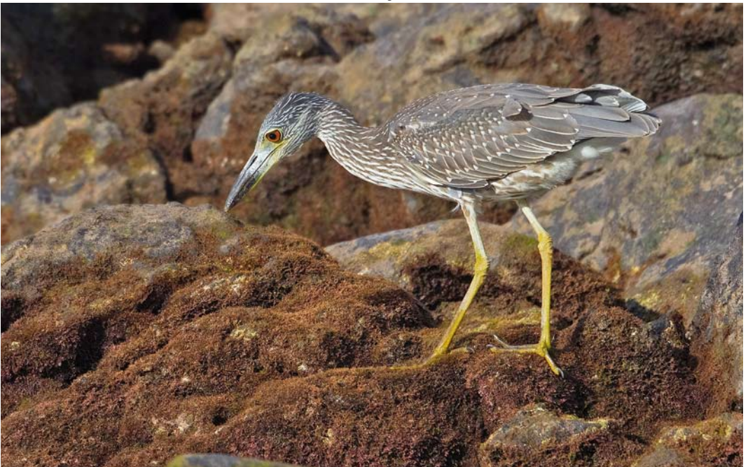
519 Yellow-crowned Night Heron / Geelkruinkwak Nyctanassa violacea , Corvo, Azores, 1 October 2011