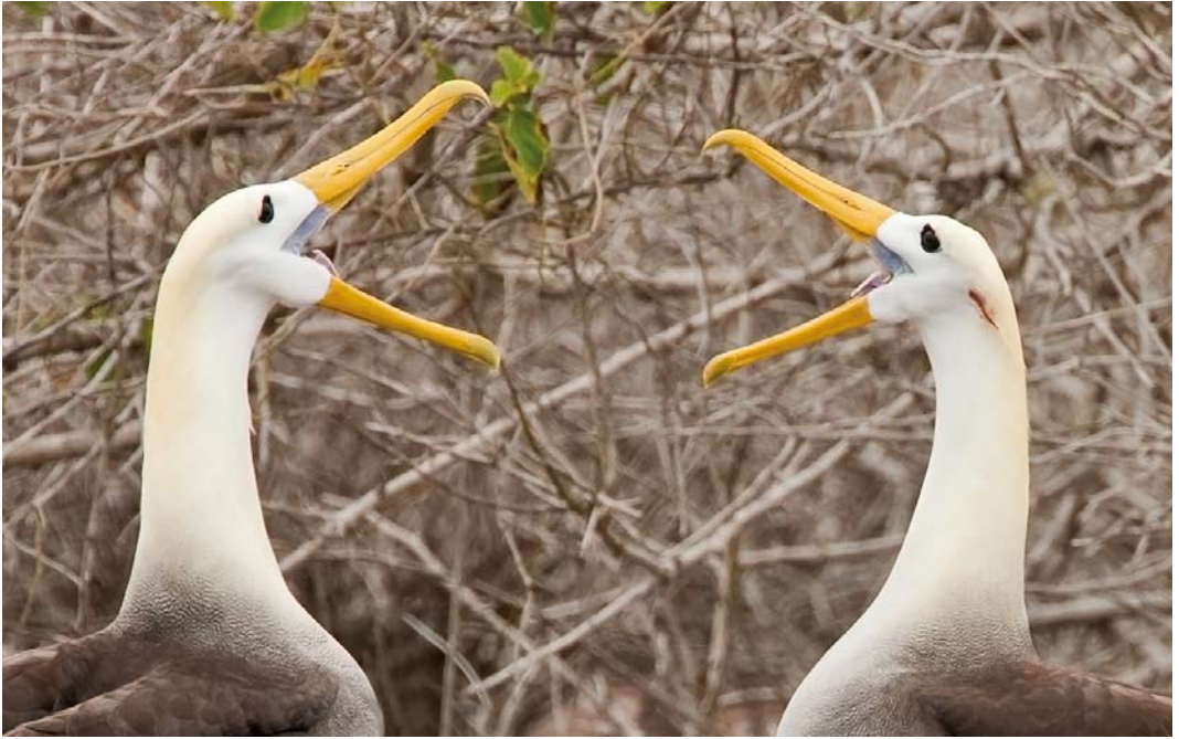
511-512 Waved Albatrosses / Galápagosalbatrossen Phoebastria irrorata , Galápagos Islands, 7 June 2006 (Otto Plantema)