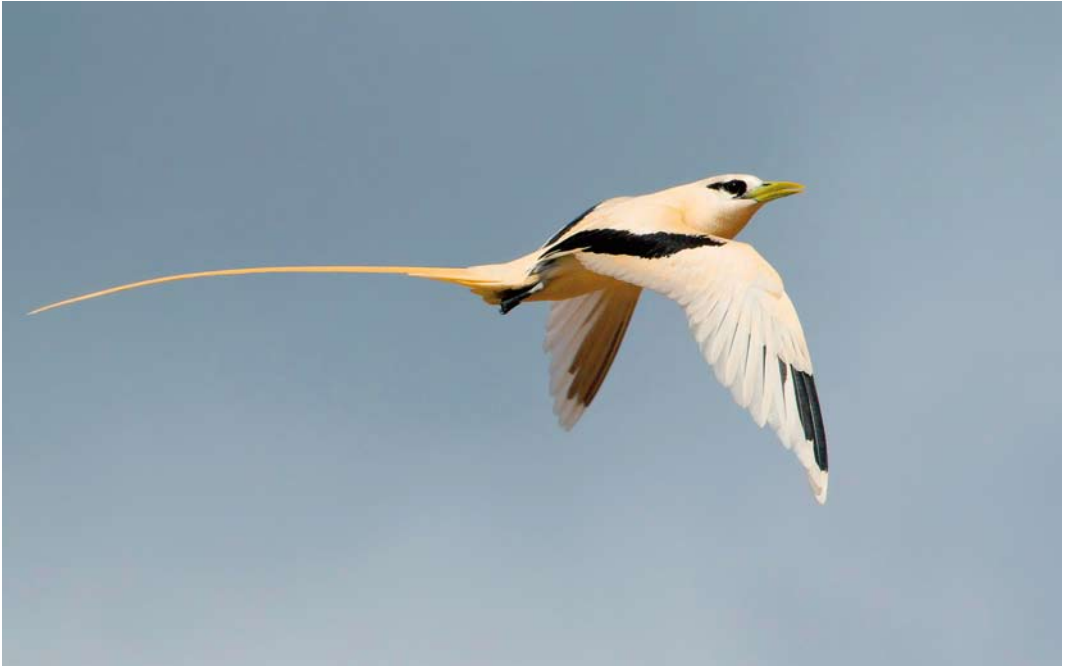
513 White-tailed Tropicbird / Witstaartkeerkringvogel Phaethon lepturus , Fajázinha, Flores, Azores, 15 October 2011