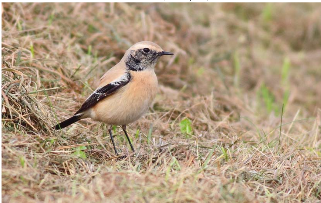
580 Woestijntapuit / Desert Wheatear Oenanthe deserti , eerstejaars mannetje, Camperduin, Noord-Holland, 30 oktober 2011 ( Cock Reijnders )