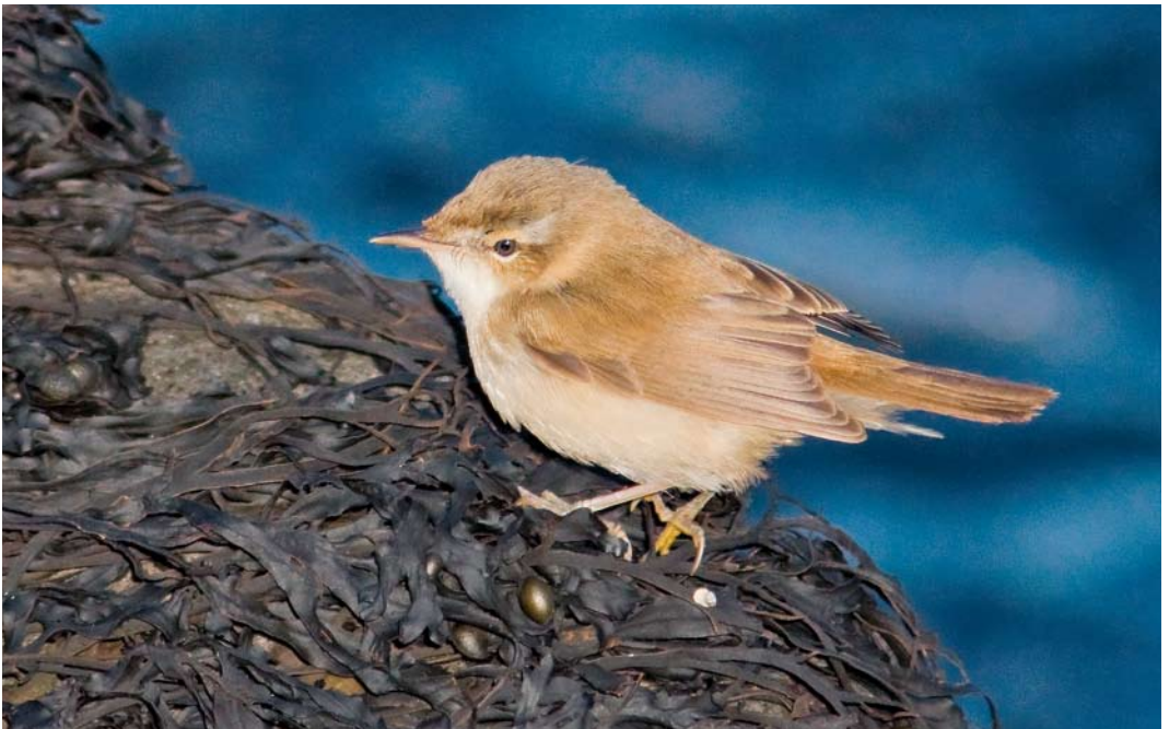
578 Veldrietzanger / Paddyfield Warbler Acrocephalus agricola , Hoek van Holland, Zuid-Holland, 15 oktober 2011 (Peter Soer)