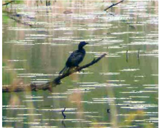
470 Pygmy Cormorant / Dwergaalscholver Phalacrocorax pygmeus , Ooijse Graaf, Ooijpolder, Gelderland, Netherlands, 12 May 2010 (Luuk Punt)

This is a date extension of a bird previously accepted for 25-30 April 1995 (van den Berg & Bosman 2001). This species is no longer considered since 1 January 2000 but the CDNA still welcomes reports from before this date.