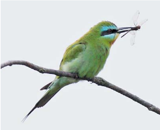
477 Blue-cheeked Bee-eater / Groene Bijeneter Merops persicus , adult, Noordhollands Duinreservaat, Castricum, Noord-Holland, 16 August 2010

A bird at De Cocksdorp, Texel, Noord-Holland, on 7 November (Dutch Birding 33: 69, plate 85, 2011) is still in circulation. The 1983 record was erroneously mentioned as a trapped bird but it was only observed in the field and not in the hand (contra van den Berg & Bosman 1999, 2001). The 2007/08 record concerns a date extension of a bird previously accepted for 21 November 2007 to 20 January 2008 (Ovaa et al 2010).