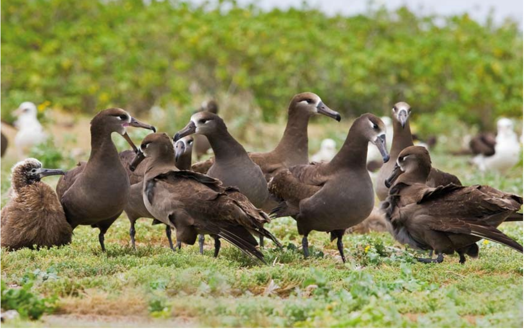
510 Black-footed Albatrosses / Zwartvoetalbatrossen Phoebastria nigripes , Midway Atoll, Hawaii, 11 April 2010 (Otto Plantema)

in 2005 (BirdLife International 2010c). On Midway, every year hybrids of Black-footed and Laysan Albatross are present (cf www.scholtz.org/bill/nature/Midway/index.html ).