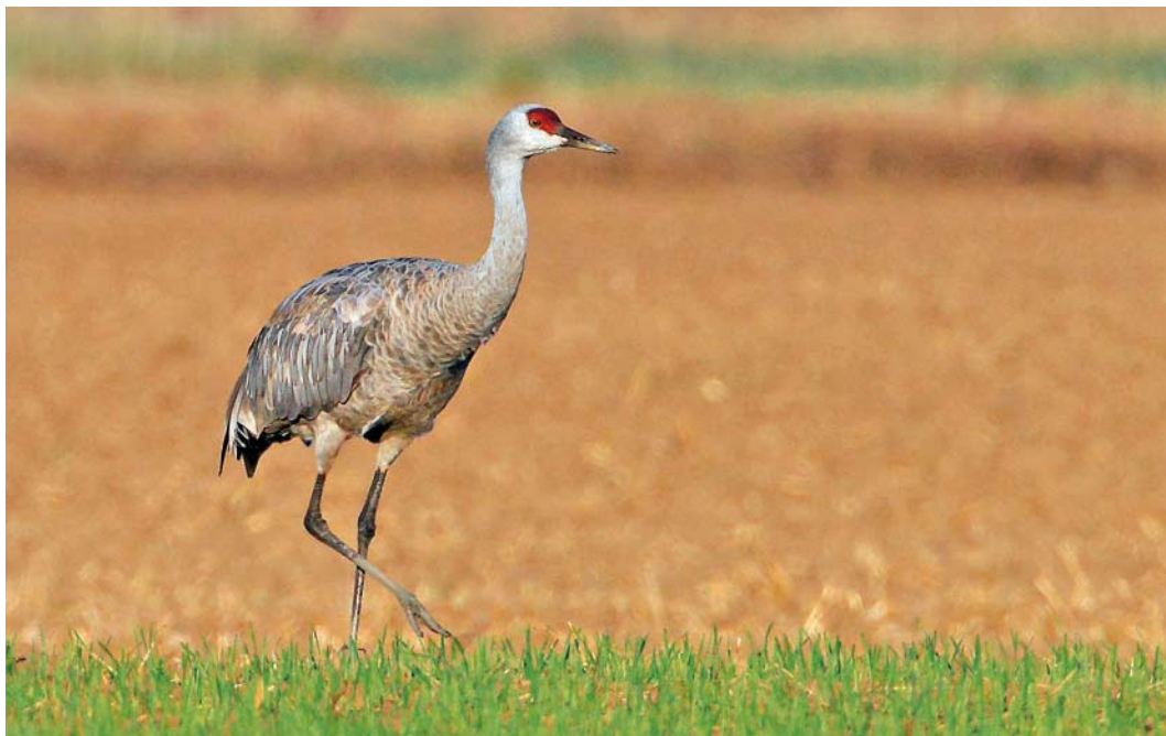
515 Sandhill Crane / Canadese Kraanvogel Grus canadensis , adult, Boyton Marshes, Suffolk, England, 2 October 2011 (Bill Baston)